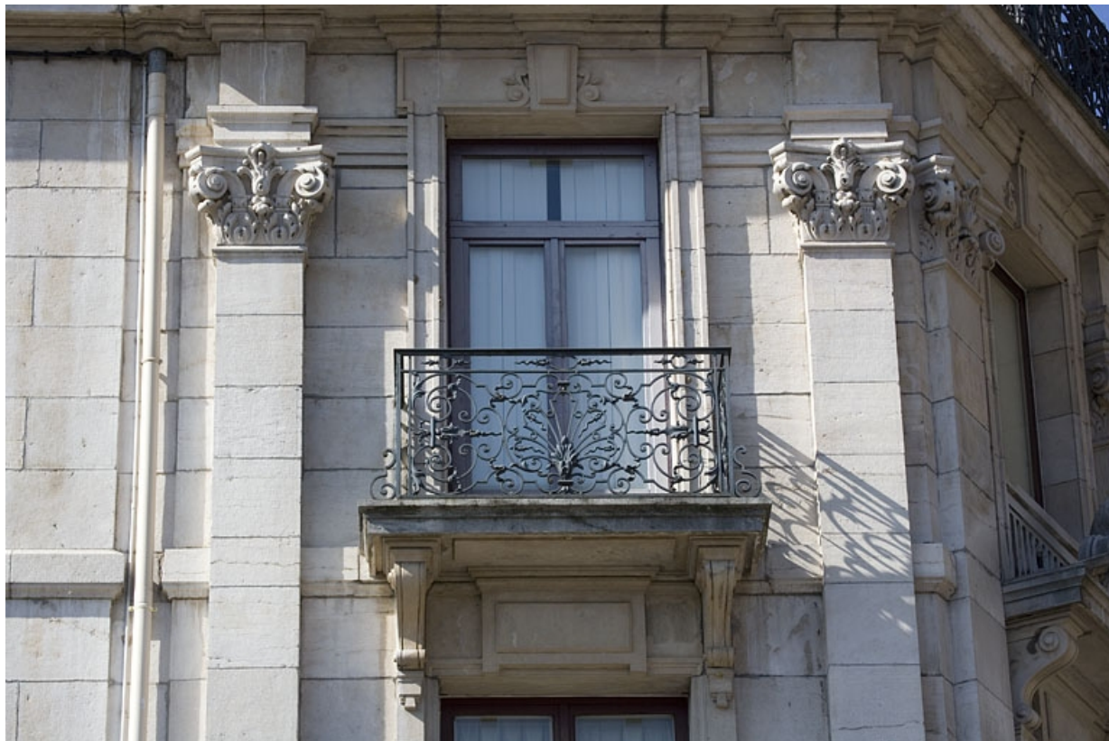
Détail d'un balcon ponctuel entre deux pilastres.

25, Besançon, 2 rue Lacoré, lieudit : îlot Granvelle