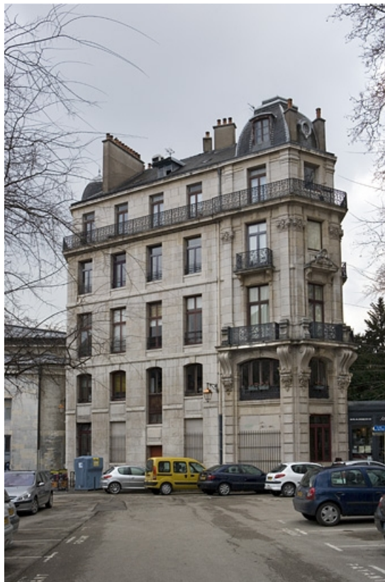
Vue d'ensemble de la façade sur la place du Théâtre, de trois quarts droit. 25, Besançon, 2 rue Lacoré, lieudit : îlot Granvelle