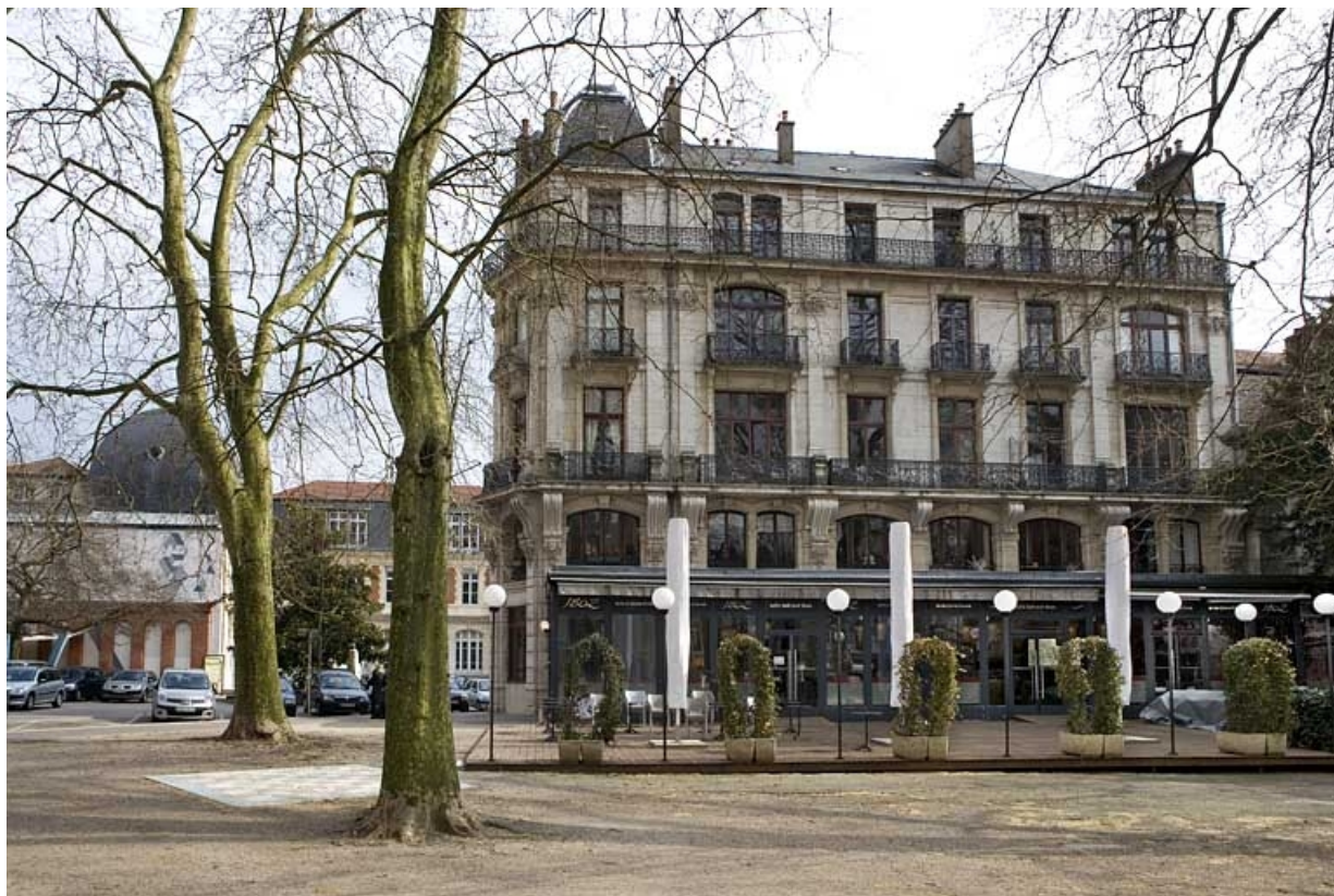
Vue d'ensemble de la façade sur la place Granvelle.

25, Besançon, 2 rue Lacoré, lieudit : îlot Granvelle