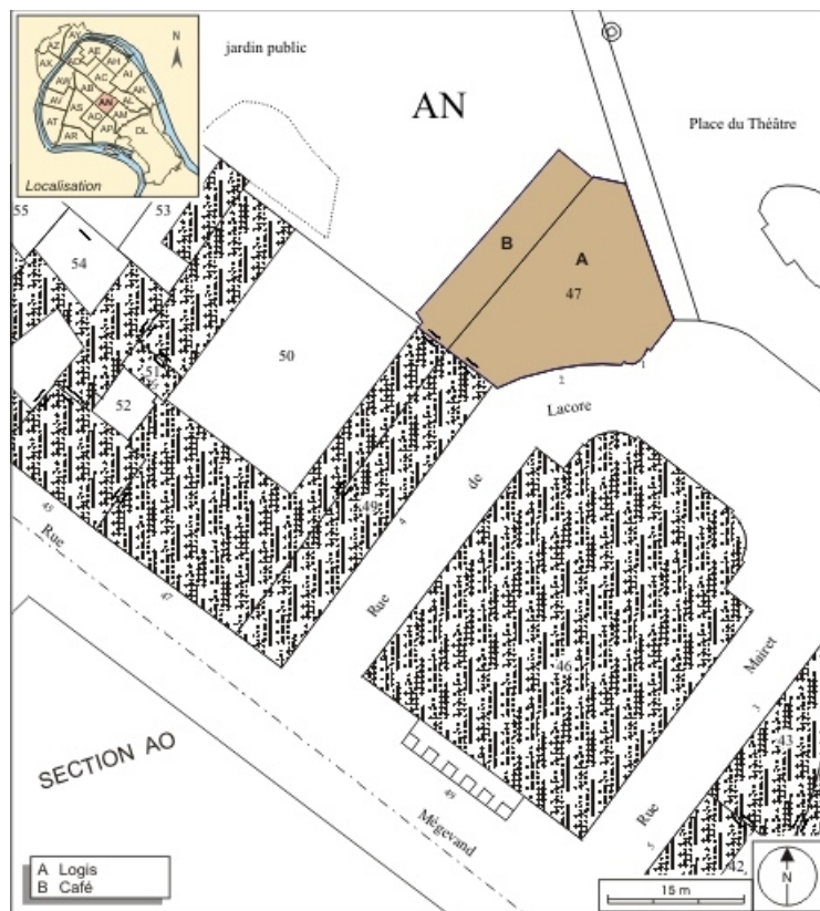
Plan masse et de situation. Extrait du plan cadastral, 1974, section AN. 25, Besançon, 2 rue Lacoré, lieudit : îlot Granvelle