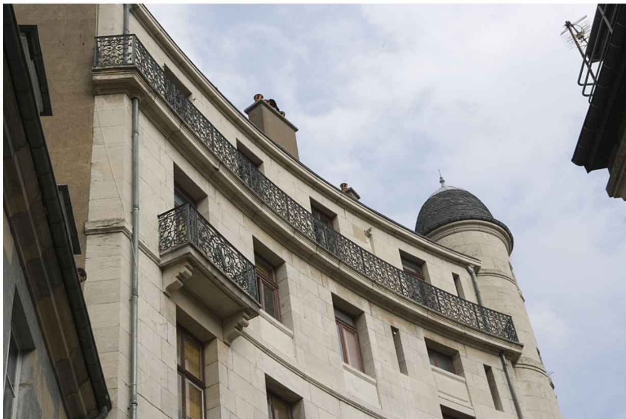
Détail du balcon filant sur la façade donnant rue Lacoré.

25, Besançon, 2 rue Lacoré, lieudit : îlot Granvelle