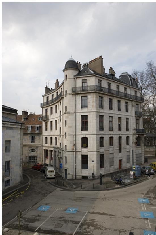
Vue d'ensemble de l'immeuble à l'angle de la place Granvelle et de la rue Lacoré.

25, Besançon, 2 rue Lacoré, lieudit : îlot Granvelle