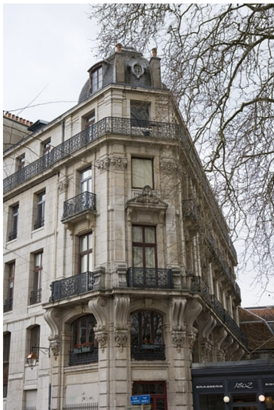
Vue d'ensemble de l'angle de l'immeuble.

25, Besançon, 2 rue Lacoré, lieudit : îlot Granvelle