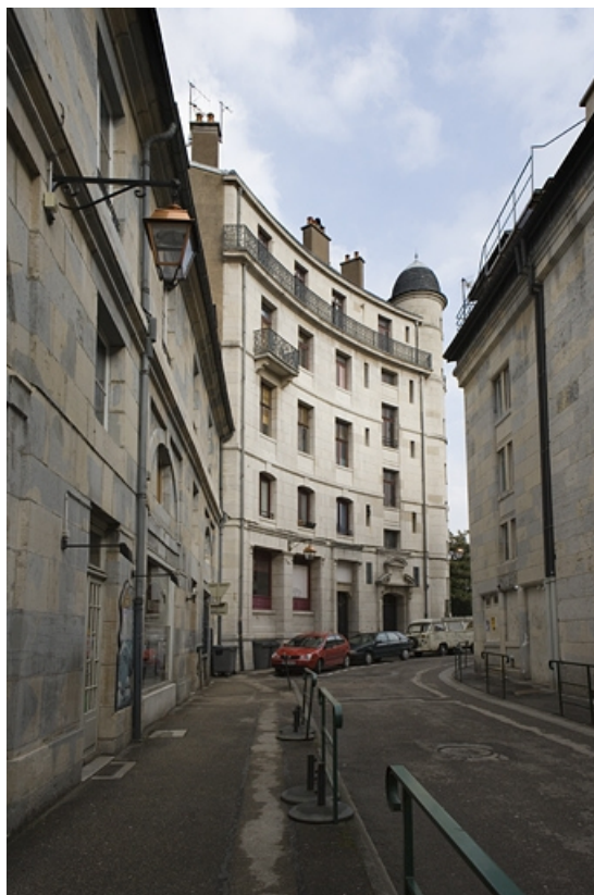
Vue d'ensemble depuis l'entrée de la rue Lacoré.

25, Besançon, 2 rue Lacoré, lieudit : îlot Granvelle