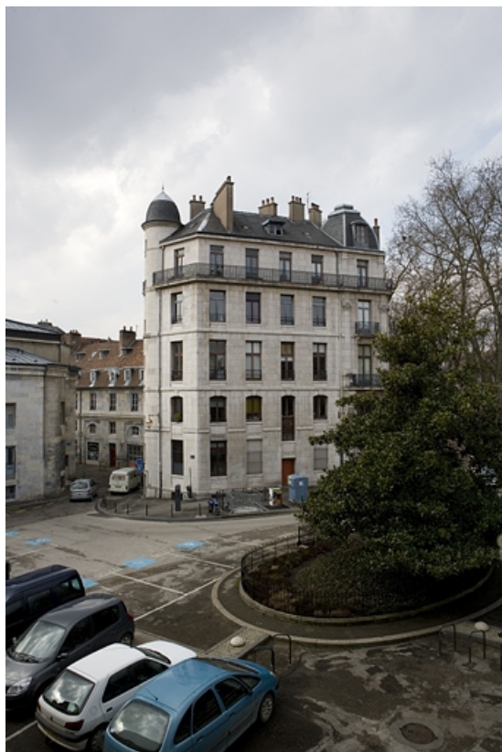
Vue d'ensemble de l'immeuble depuis la place Granvelle.

25, Besançon, 2 rue Lacoré, lieudit : îlot Granvelle