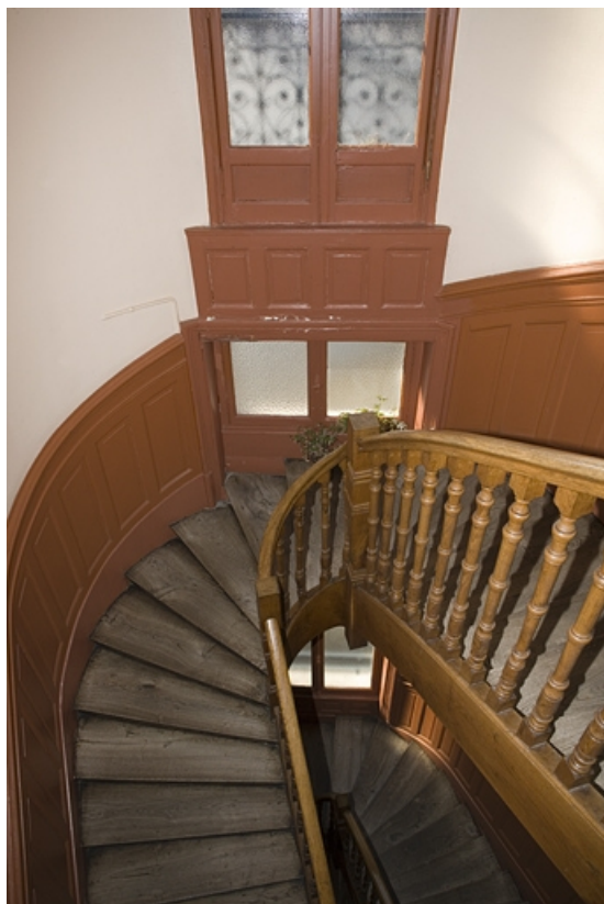
Détail d'une partie de l'escalier.

25, Besançon, 2 rue Lacoré, lieudit : îlot Granvelle