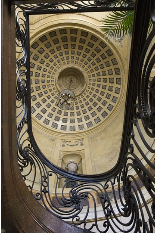
Hôtel en fond de cour : coupole de l'escalier et ferronnerie de la rampe.

25, Besançon Grande Rue 104, lieudit : îlot Granvelle