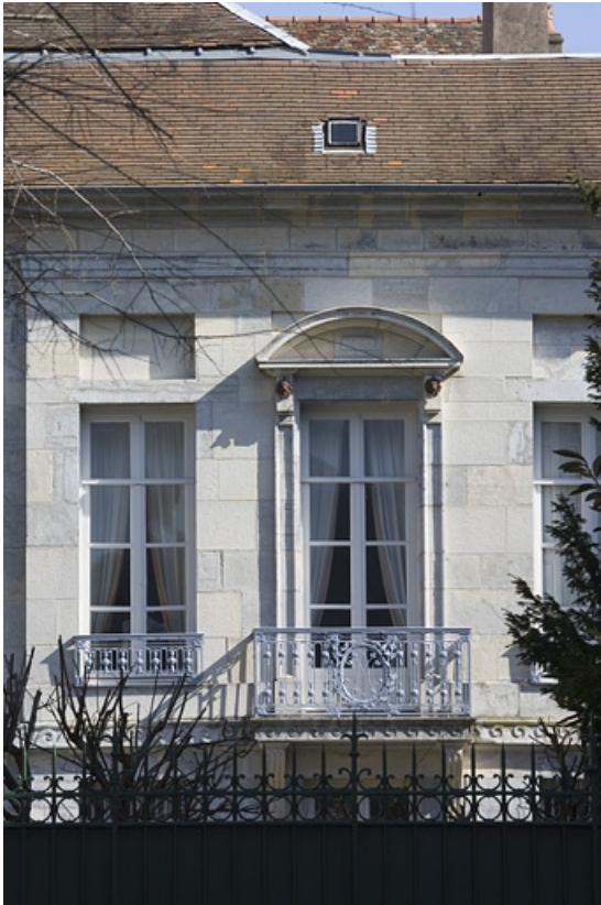
Hôtel en fond de cour : détail de la fenêtre centrale, premier étage sur jardin. 25, Besançon Grande Rue 104, lieudit : îlot Granvelle