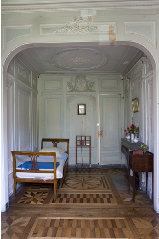
Hôtel en fond de cour : vue d'ensemble de l'ancien cabinet de toilette.

25, Besançon Grande Rue 104, lieudit : îlot Granvelle