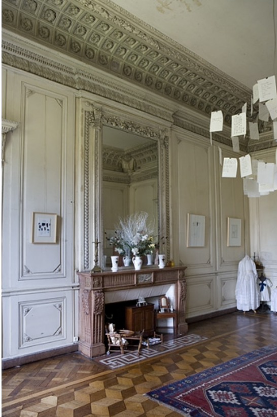
Hôtel en fond de cour, grand salon : vue d'ensemble du mur droit avec la cheminée et sa glace.

25, Besançon Grande Rue 104, lieudit : îlot Granvelle