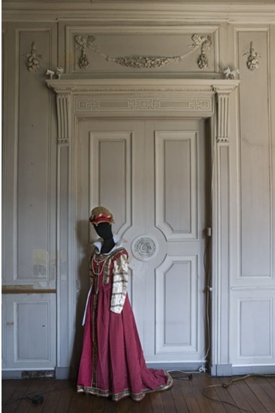
Hôtel en fond de cour, antichambre : fausse-porte, vue d'ensemble.

25, Besançon Grande Rue 104, lieudit : îlot Granvelle