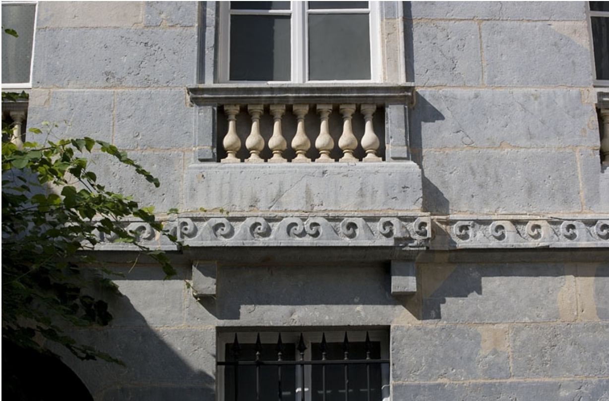
Hôtel en fond de cour : détail d'un balcon et de la frise au premier étage de la façade antérieure.

25, Besançon Grande Rue 104, lieudit : îlot Granvelle