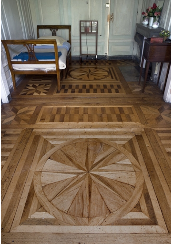
Hôtel en fond de cour : détail des planchers des anciens boudoir et cabinet de toilette.

25, Besançon Grande Rue 104, lieudit : îlot Granvelle