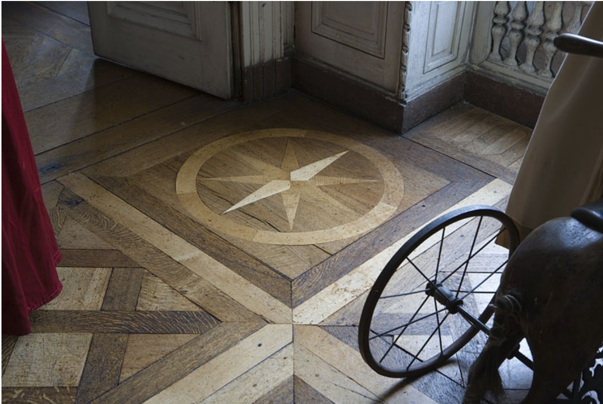
Hôtel en fond de cour : détail du plancher du grand salon, rosace.

25, Besançon Grande Rue 104, lieudit : îlot Granvelle