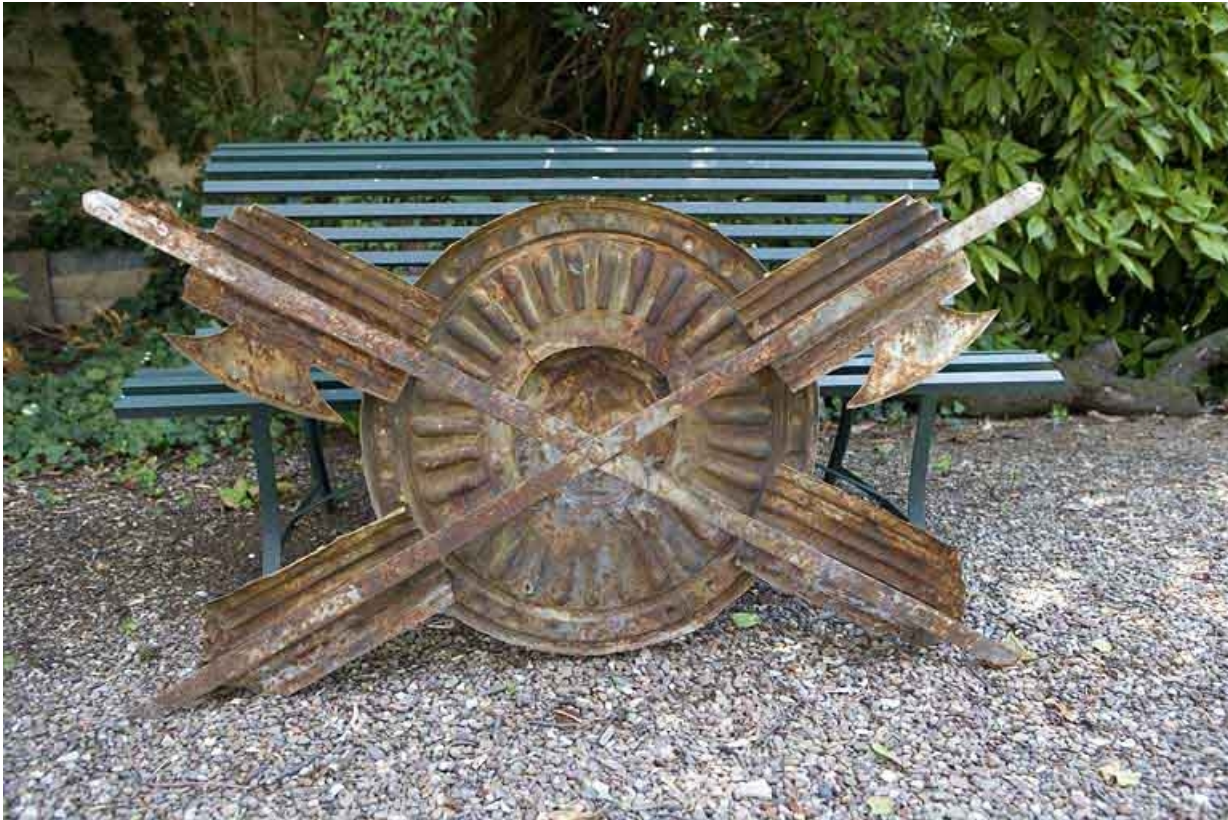
Hôtel en fond de cour : revers du décor en tôle repoussée déposé, ornant auparavant la façade postérieure. 25, Besançon Grande Rue 104, lieudit : îlot Granvelle