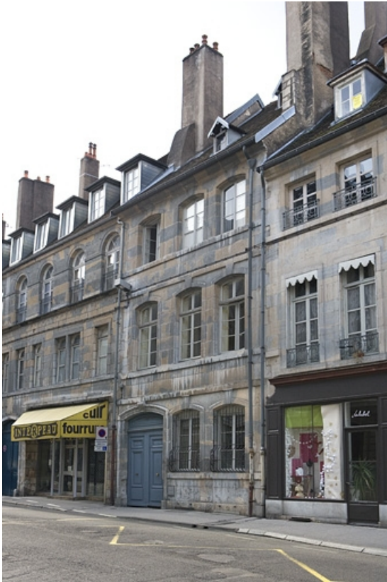
Façade sur rue, de trois quarts droit.

25, Besançon Grande Rue 104, lieudit : îlot Granvelle