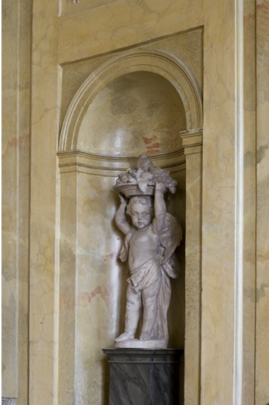
Hôtel en fond de cour, escalier : niche droite décorée d'une statuette d'ange portant un panier de fruits.

25, Besançon Grande Rue 104, lieudit : îlot Granvelle