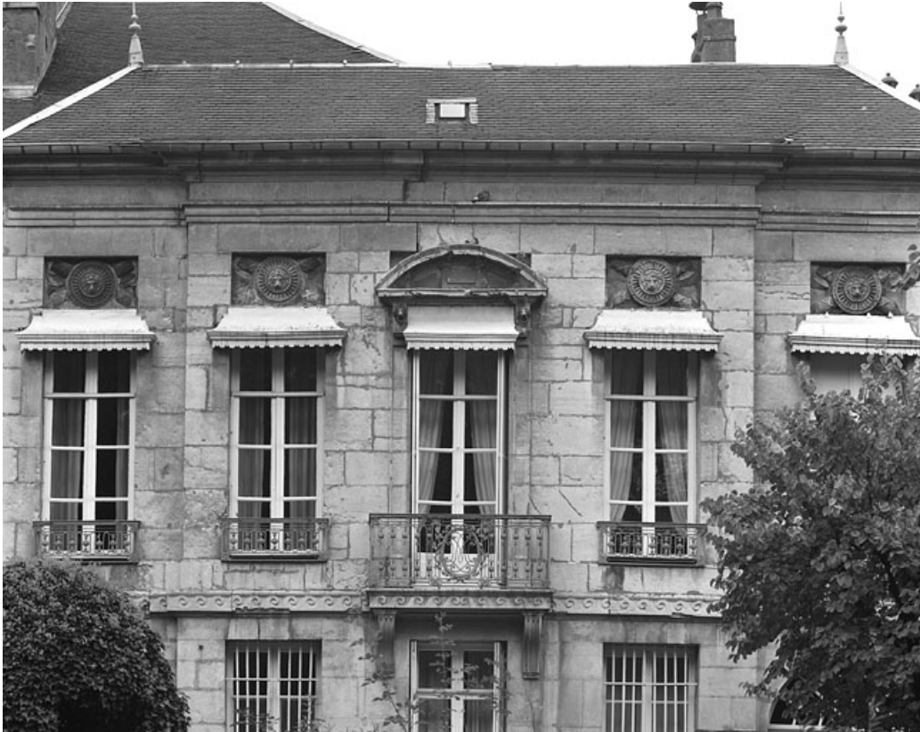
Détail du premier étage de la façade sur jardin de l'hôtel.

25, Besançon Grande Rue 104, lieudit : îlot Granvelle