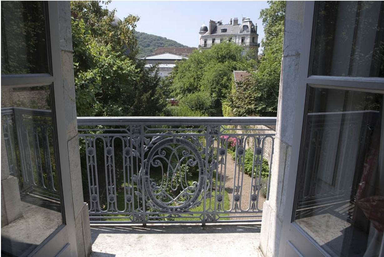
Hôtel en fond de cour : détail de la grille du balcon donnant sur le jardin, depuis l'intérieur.

25, Besançon Grande Rue 104, lieudit : îlot Granvelle