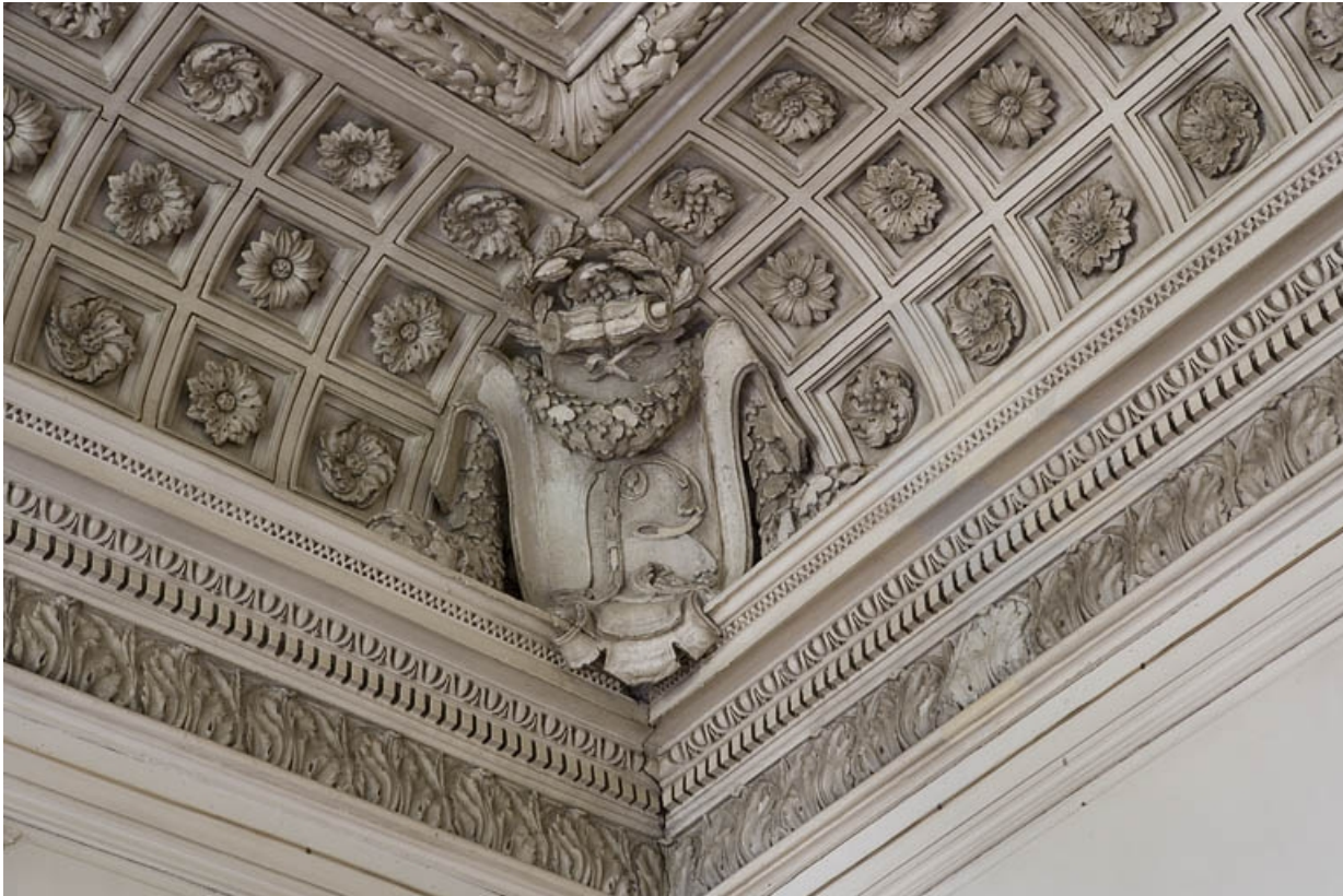
Hôtel en fond de cour, grand salon : détail d'un angle du plafond portant le monogramme B. 25, Besançon Grande Rue 104, lieudit : îlot Granvelle