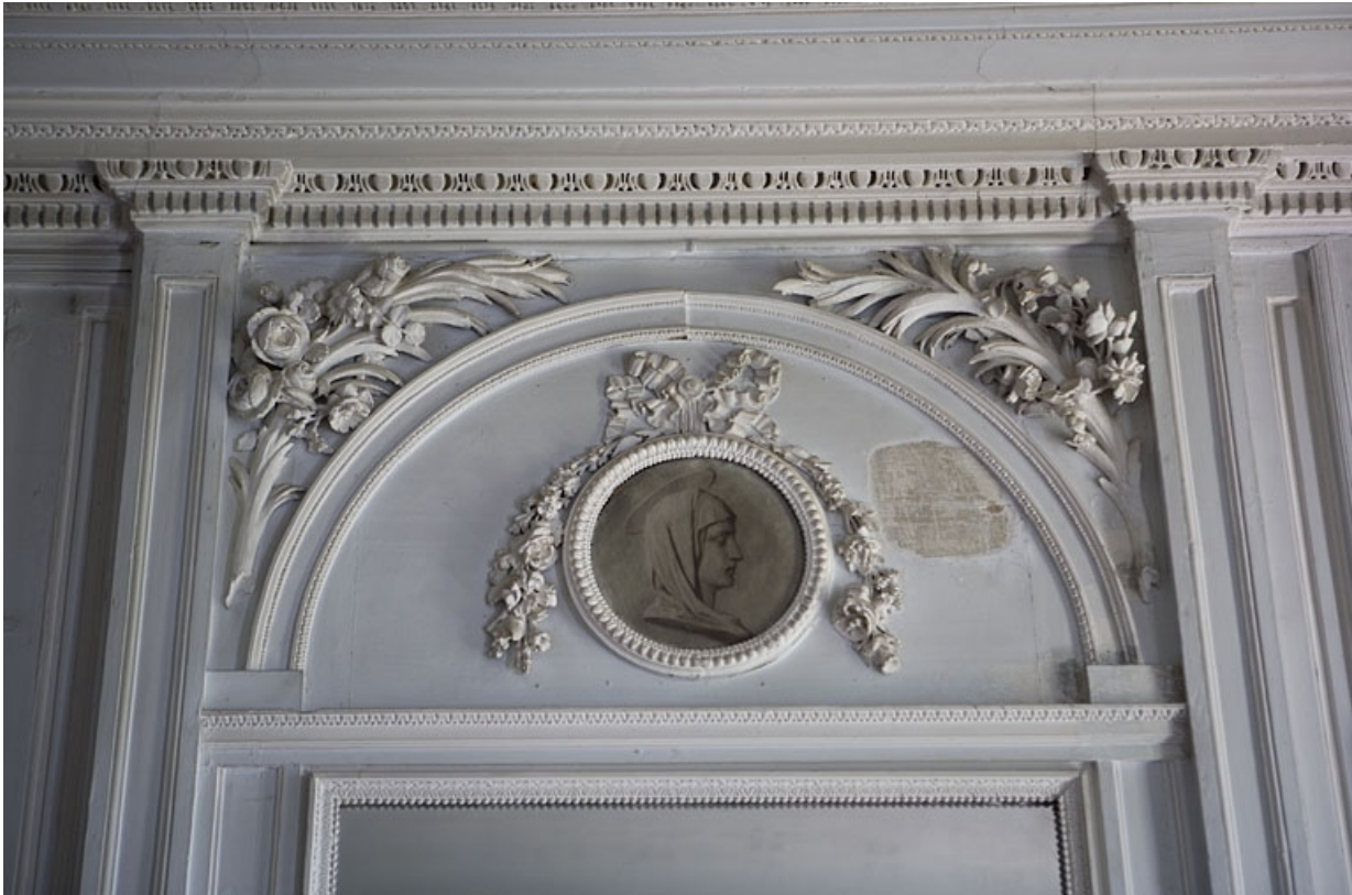
Hôtel en fond de cour, chambre : détail du médaillon peint en grisaille au-dessus de la glace.

25, Besançon Grande Rue 104, lieudit : îlot Granvelle