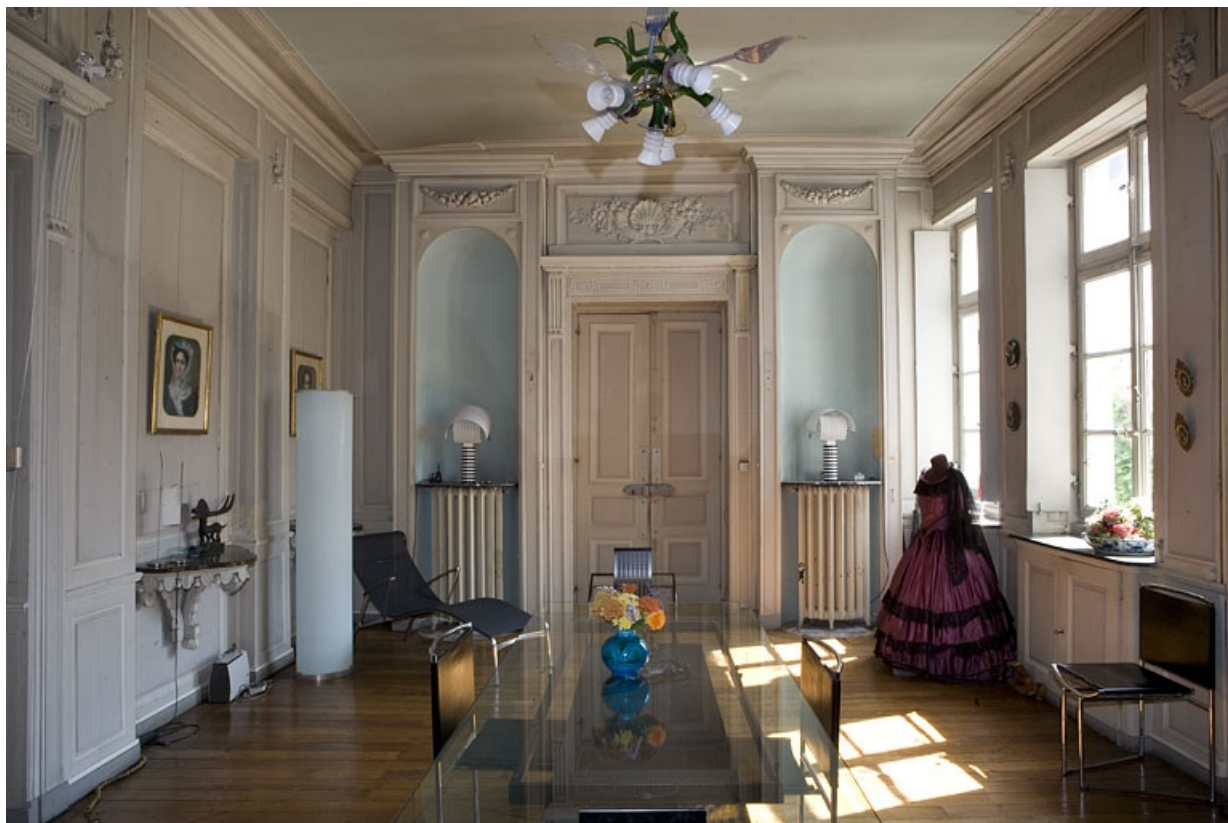
Hôtel en fond de cour, antichambre : vue d'ensemble depuis l'entrée du grand salon.

25, Besançon Grande Rue 104, lieudit : îlot Granvelle