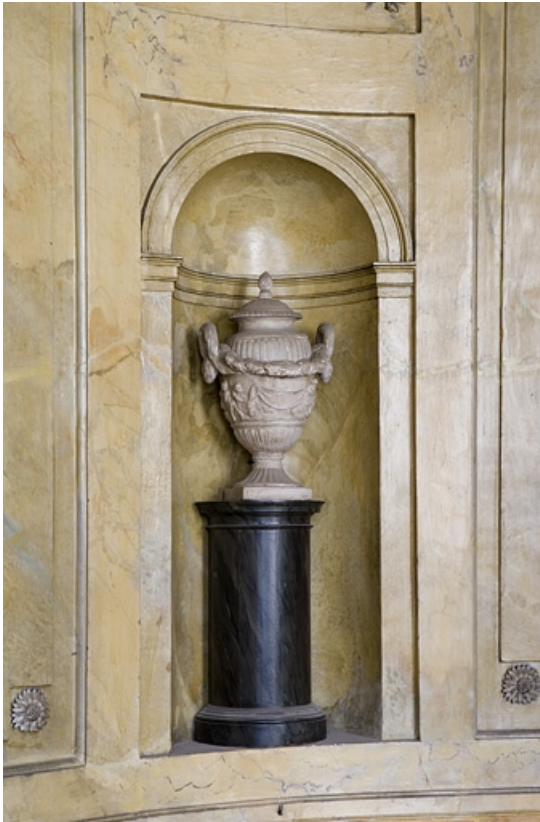
Hôtel en fond de cour, escalier : niche centrale décorée d'une urne sur un piédestal.

25, Besançon Grande Rue 104, lieudit : îlot Granvelle