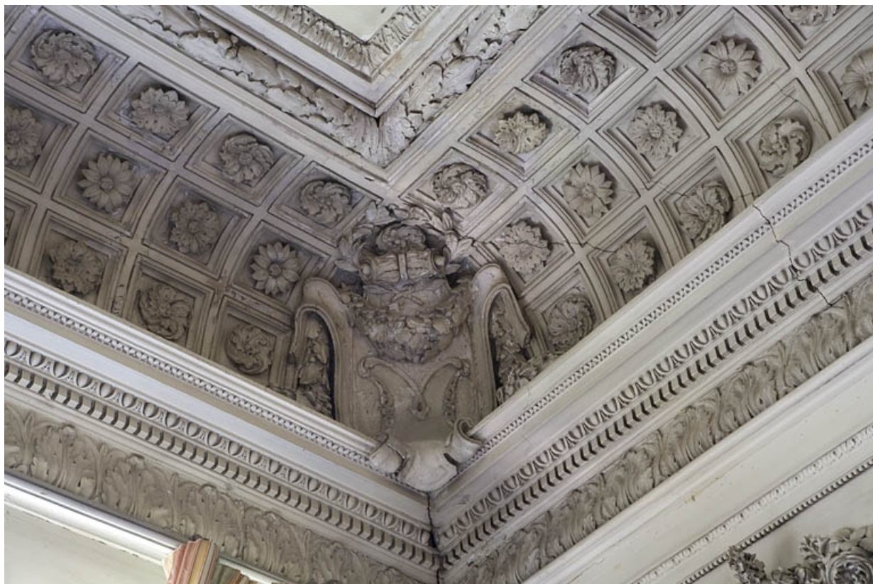
Hôtel en fond de cour, grand salon : détail d'un angle du plafond portant le monogramme M.

25, Besançon Grande Rue 104, lieudit : îlot Granvelle