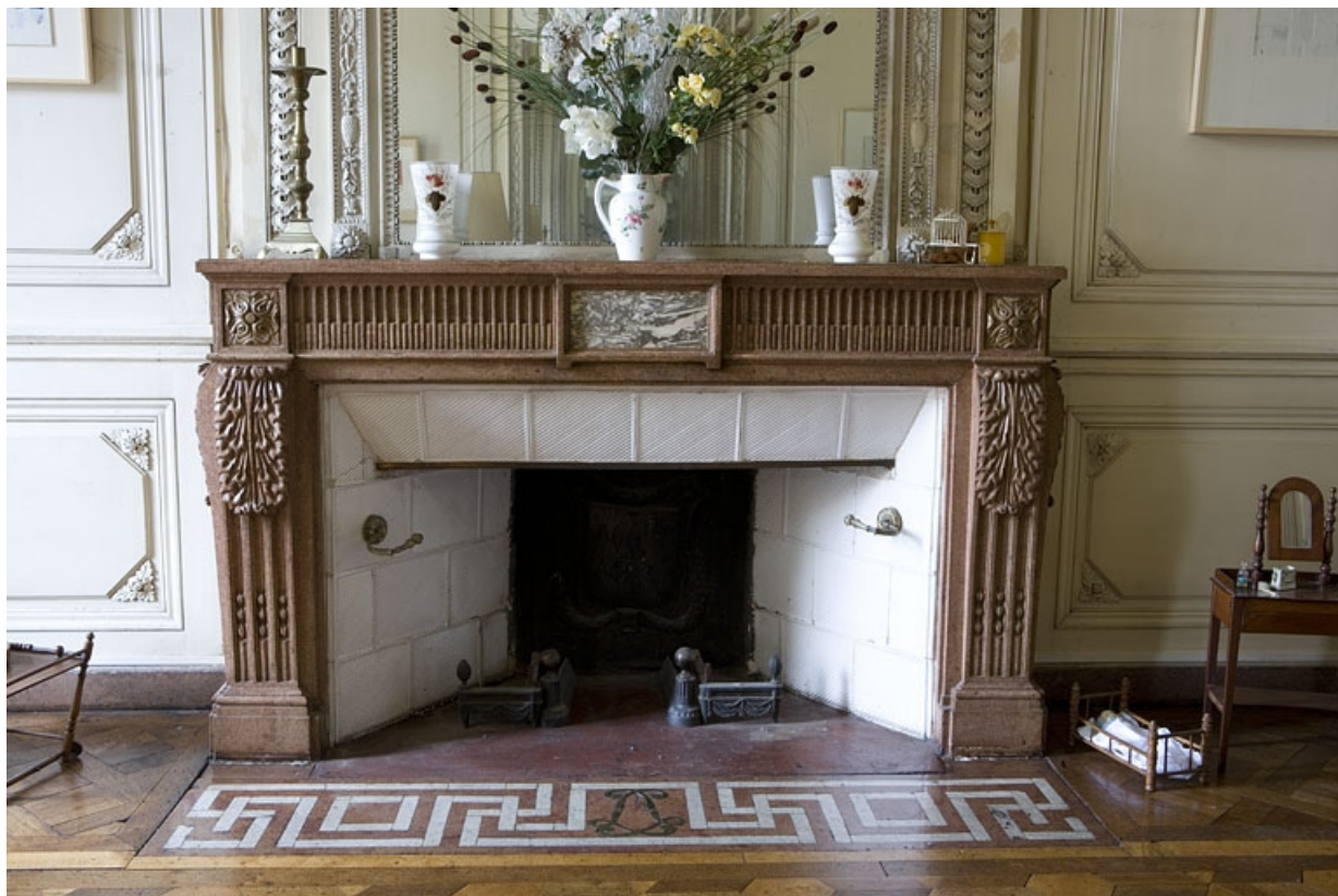
Hôtel en fond de cour : vue d'ensemble de la cheminée du grand salon.

25, Besançon Grande Rue 104, lieudit : îlot Granvelle