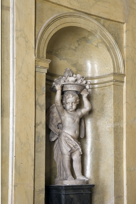
Hôtel en fond de cour, escalier : niche gauche décorée d'une statuette d'ange portant un panier de fruits. 25, Besançon Grande Rue 104, lieudit : îlot Granvelle