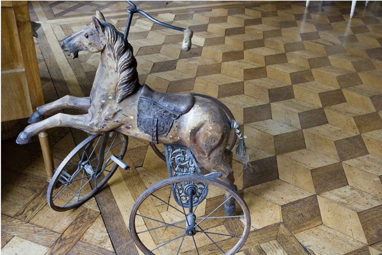
Hôtel en fond de cour : détail du plancher du grand salon.

25, Besançon Grande Rue 104, lieudit : îlot Granvelle