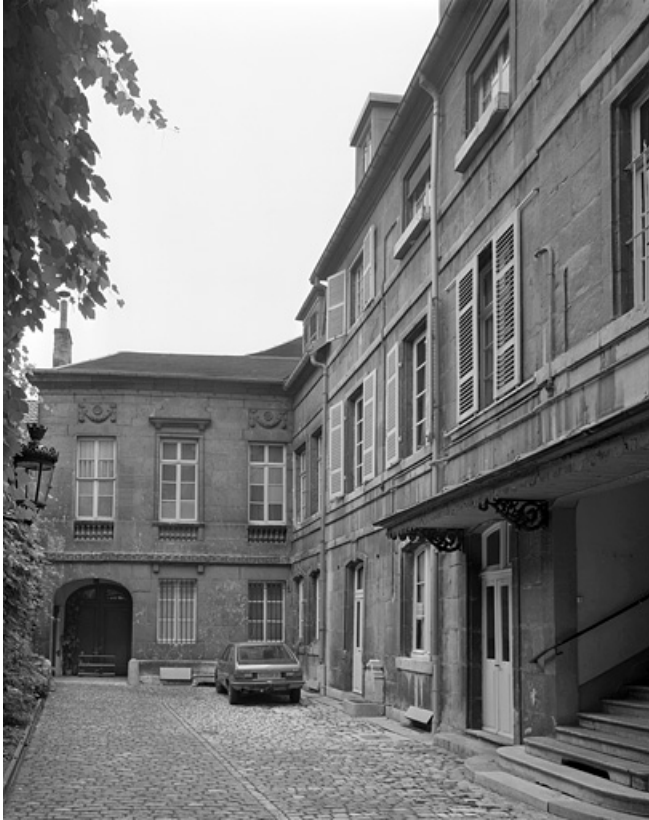
Vue d'ensemble des façades sur cour de l'hôtel.

25, Besançon Grande Rue 104, lieudit : îlot Granvelle