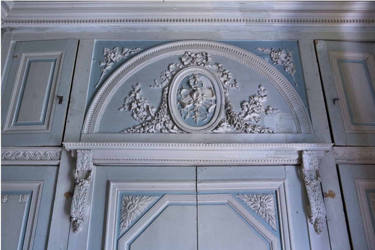
Hôtel en fond de cour : détail de la partie supérieure des lambris, mur droit de l'ancien boudoir. 25, Besançon Grande Rue 104, lieudit : îlot Granvelle