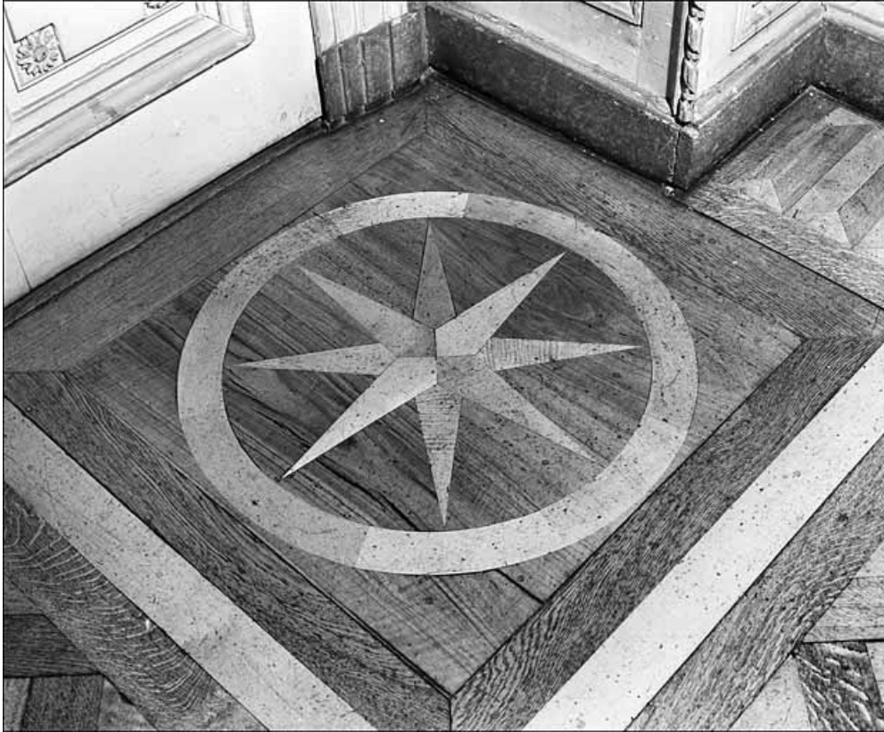
Détail d'un décor du parquet en marquetterie du grand salon.

25, Besançon Grande Rue 104, lieudit : îlot Granvelle