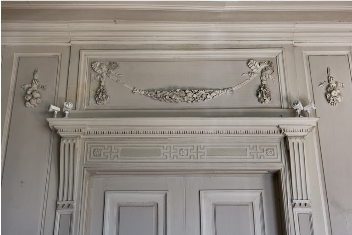
Hôtel en fond de cour, antichambre : décor du dessus d'une fausse-porte.

25, Besançon Grande Rue 104, lieudit : îlot Granvelle