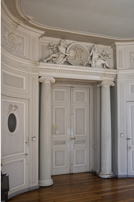
Hôtel en fond de cour, antichambre : vue d'ensemble de la porte menant au grand salon.

25, Besançon Grande Rue 104, lieudit : îlot Granvelle