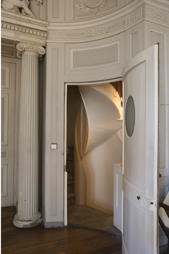
Hôtel en fond de cour, antichambre : vue d'un escalier secondaire à droite de l'entrée du grand salon.

25, Besançon Grande Rue 104, lieudit : îlot Granvelle