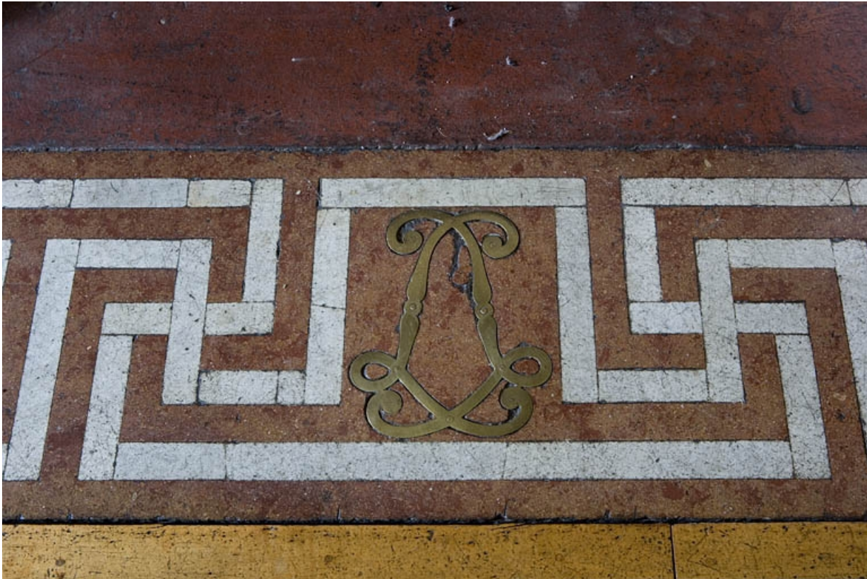
Hôtel en fond de cour : détail central de la dalle de foyer de la cheminée du grand salon.

25, Besançon Grande Rue 104, lieudit : îlot Granvelle