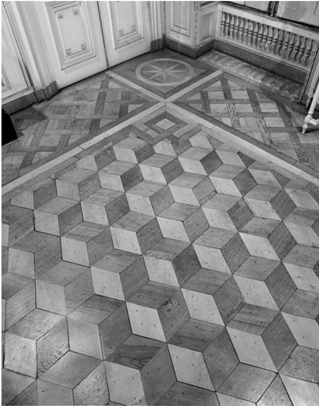
Détail du parquet en marquetterie du grand salon.

25, Besançon Grande Rue 104, lieudit : îlot Granvelle