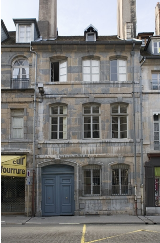
Façade sur rue, de face.

25, Besançon Grande Rue 104, lieudit : îlot Granvelle