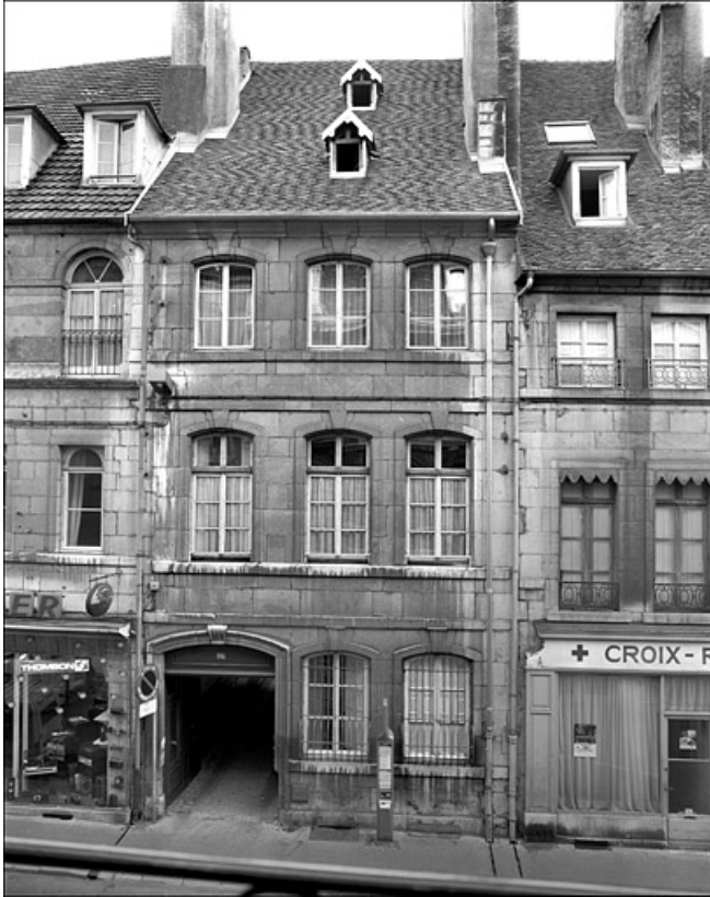
Vue d'ensemble de la façade antérieure du logis sur rue.

25, Besançon Grande Rue 104, lieudit : îlot Granvelle