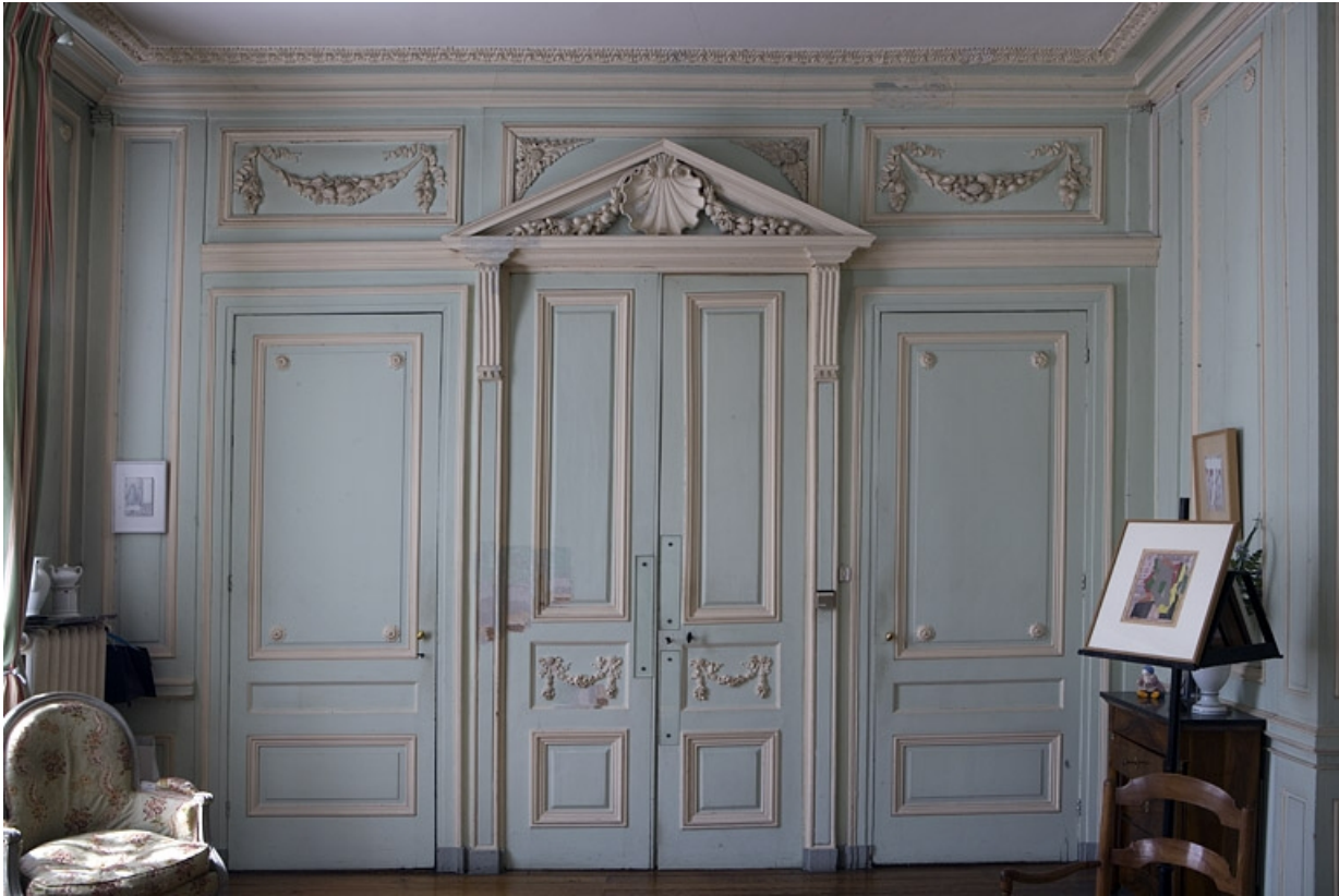
Hôtel en fond de cour, chambre à droite de l'antichambre (ancien petit salon) : lambris et porte donnant sur l'antichambre. 25, Besançon Grande Rue 104, lieudit : îlot Granvelle