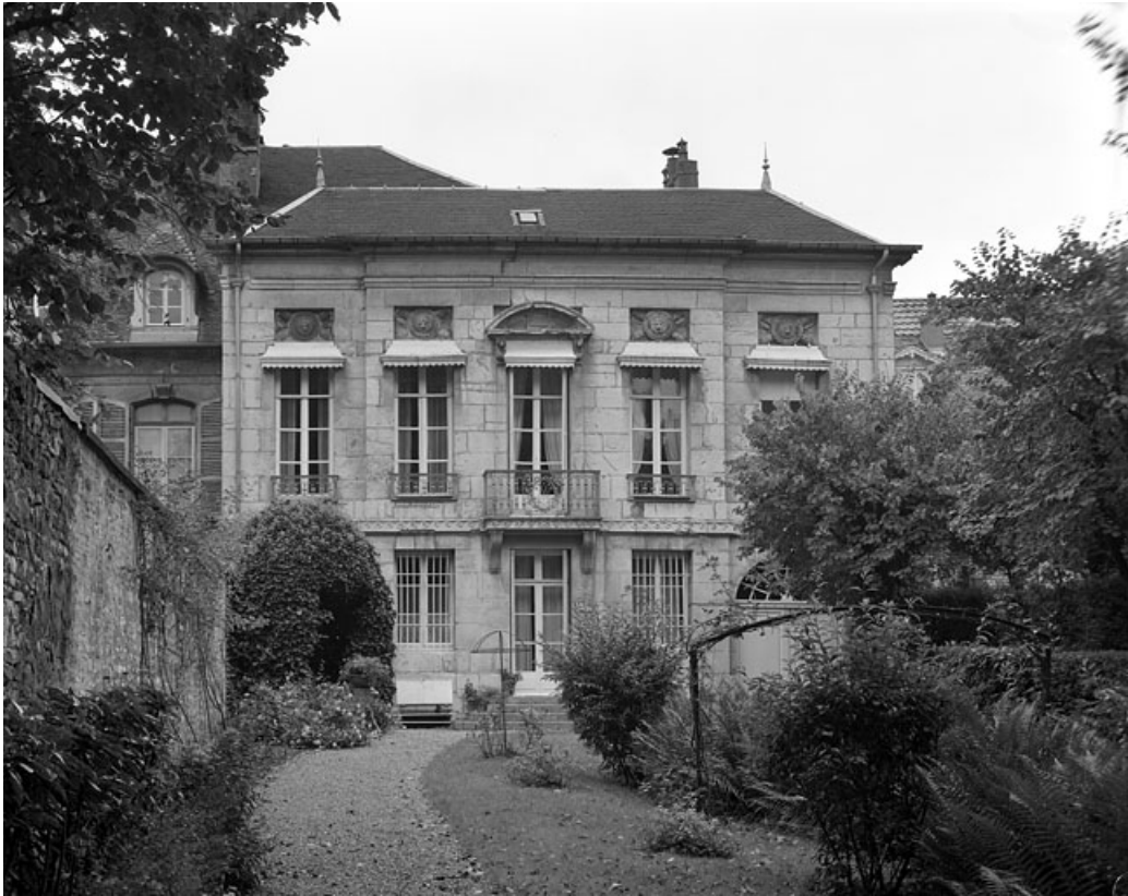
Vue d'ensemble de la façade sur jardin de l'hôtel. 25, Besançon Grande Rue 104, lieudit : îlot Granvelle