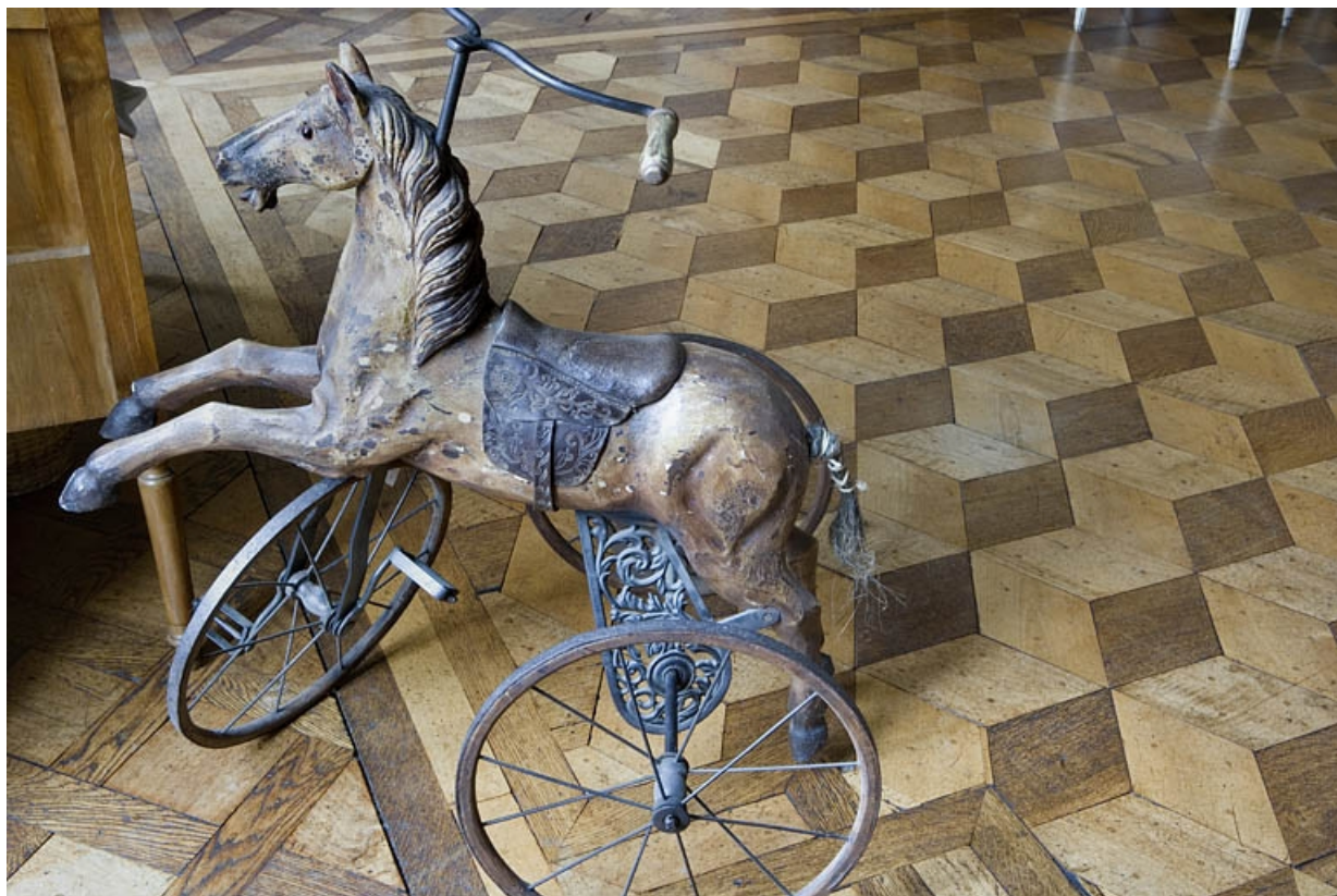
Hôtel en fond de cour : détail du plancher du grand salon.

25, Besançon Grande Rue 104, lieudit : îlot Granvelle