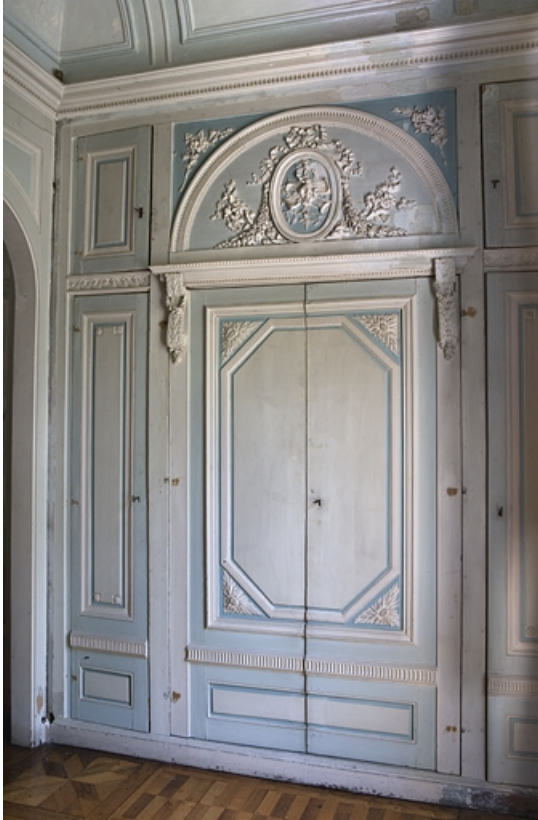
Hôtel en fond de cour : lambris du mur droit de l'ancien boudoir.

25, Besançon Grande Rue 104, lieudit : îlot Granvelle