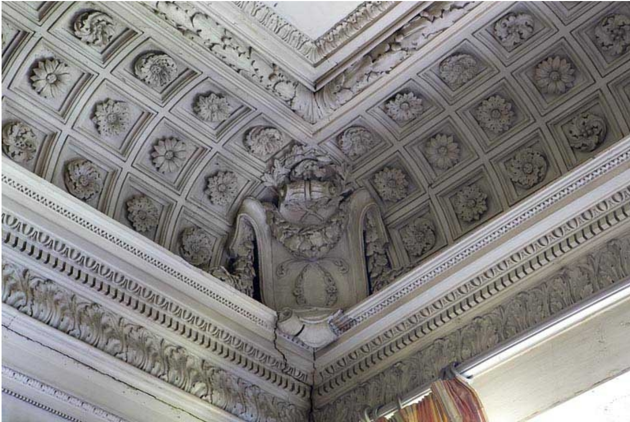
Hôtel en fond de cour, grand salon : détail d'un angle du plafond portant le monogramme C. 25, Besançon Grande Rue 104, lieudit : îlot Granvelle