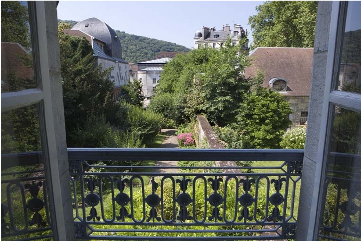
Hôtel en fond de cour : vue du jardin depuis le premier étage, avec le garde-corps de la fenêtre.

25, Besançon Grande Rue 104, lieudit : îlot Granvelle