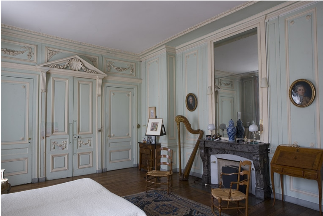
Hôtel en fond de cour, chambre à droite de l'antichambre (ancien petit salon) : vue d'ensemble depuis le fond, de trois quarts gauche.

25, Besançon Grande Rue 104, lieudit : îlot Granvelle