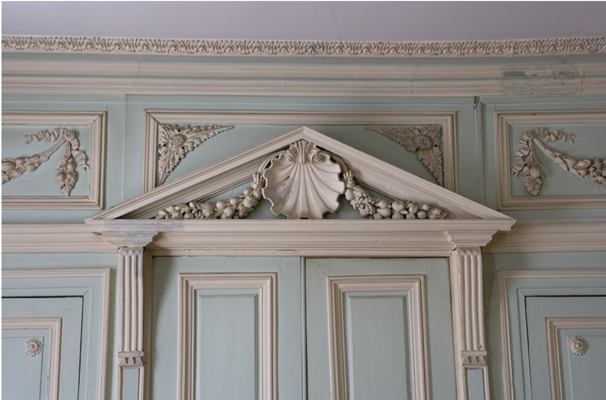
Hôtel en fond de cour, chambre à droite de l'antichambre (ancien petit salon) : détail du dessus de porte donnant sur l'antichambre. 25, Besançon Grande Rue 104, lieudit : îlot Granvelle