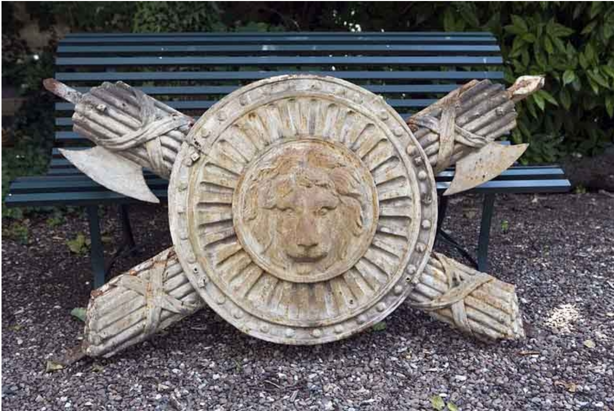
Hôtel en fond de cour : décor en tôle repoussée déposé, ornant auparavant la façade postérieure, vue de face. 25, Besançon Grande Rue 104, lieudit : îlot Granvelle