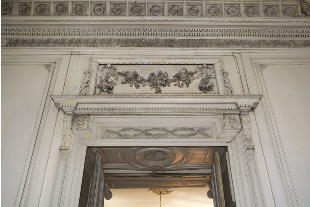
Hôtel en fond de cour, grand salon : détail du dessus de porte, côté antichambre.

25, Besançon Grande Rue 104, lieudit : îlot Granvelle