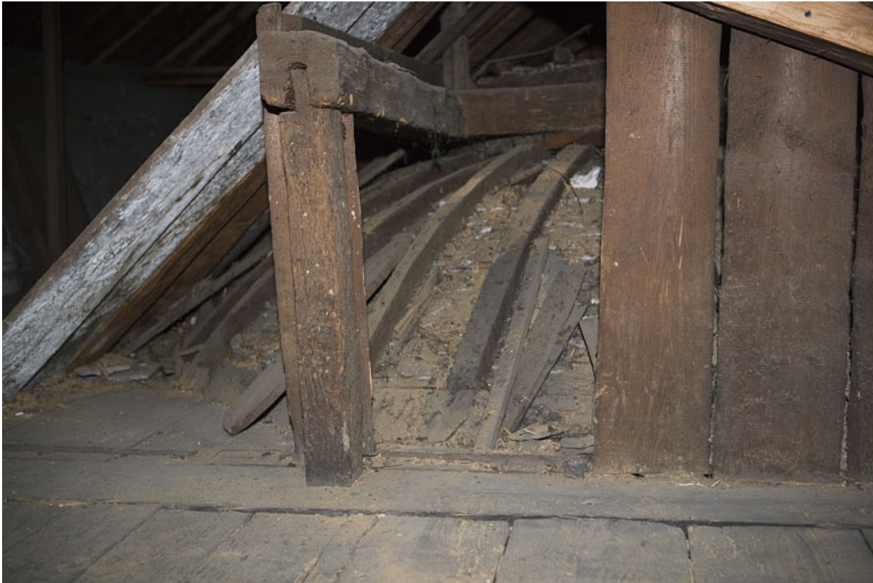
Hôtel en fond de cour : extérieur de la fausse-coupole de l'escalier situé dans le grenier.

25, Besançon Grande Rue 104, lieudit : îlot Granvelle