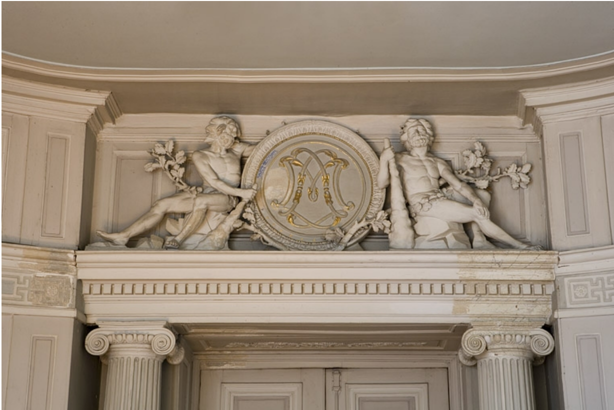
Hôtel en fond de cour, antichambre : détail du dessus de la porte menant au grand salon.

25, Besançon Grande Rue 104, lieudit : îlot Granvelle