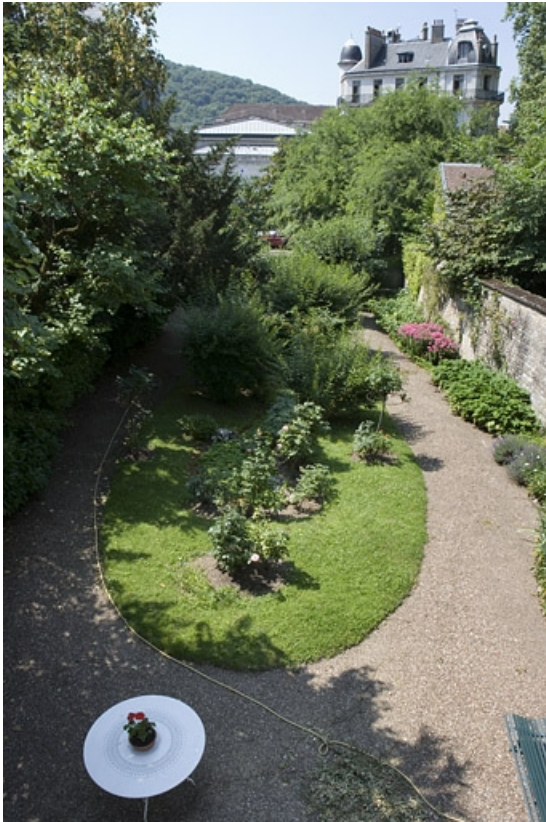
Hôtel en fond de cour : vue du jardin depuis le premier étage.

25, Besançon Grande Rue 104, lieudit : îlot Granvelle