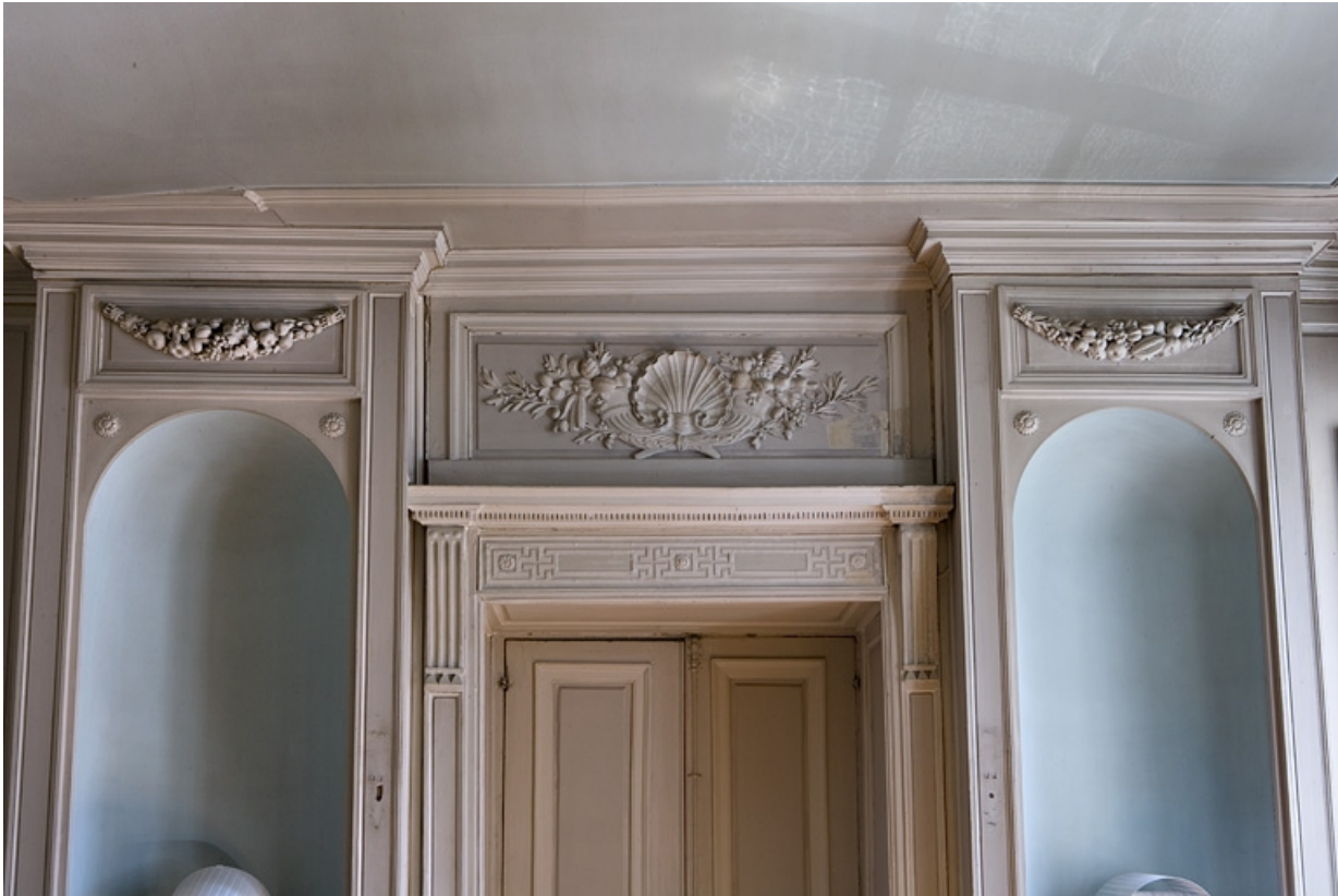
Hôtel en fond de cour, antichambre : décor du dessus de porte et des deux niches sur le mur du fond.

25, Besançon Grande Rue 104, lieudit : îlot Granvelle