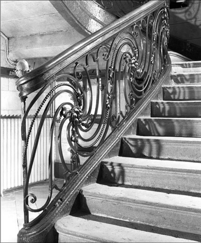
Détail de la rampe de l'escalier d'honneur de l'hôtel. 25, Besançon Grande Rue 104, lieudit : îlot Granvelle