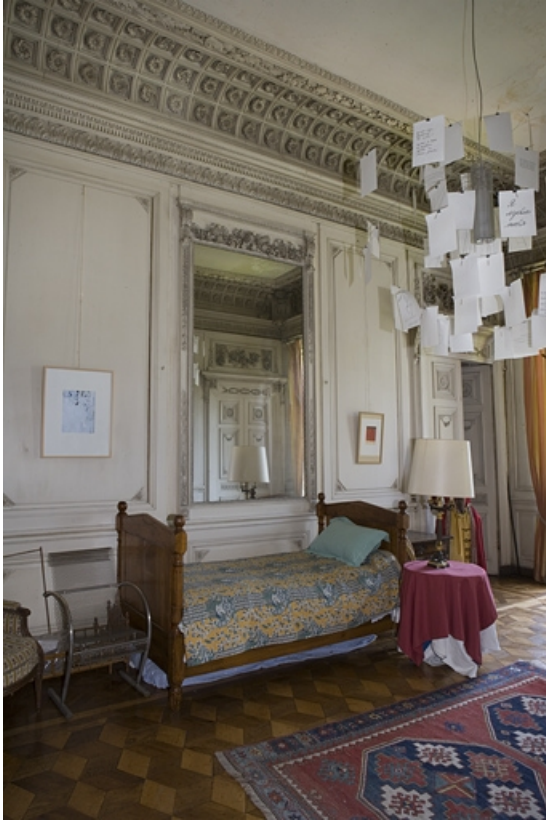
Hôtel en fond de cour, grand salon : vue des lambris et de la glace opposés à la cheminée.

25, Besançon Grande Rue 104, lieudit : îlot Granvelle