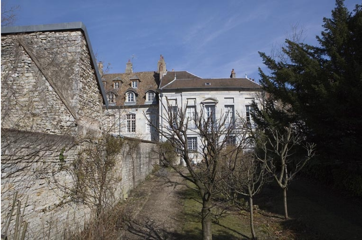
Hôtel en fond de cour : vue d'ensemble du jardin et de la façade postérieure depuis la place du théâtre. 25, Besançon Grande Rue 104, lieudit : îlot Granvelle