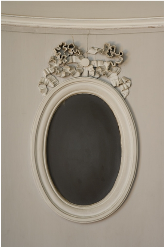
Hôtel en fond de cour, antichambre : détail de l'ouverture ovale dans la porte du couloir, à gauche de l'entrée du grand salon. 25, Besançon Grande Rue 104, lieudit : îlot Granvelle