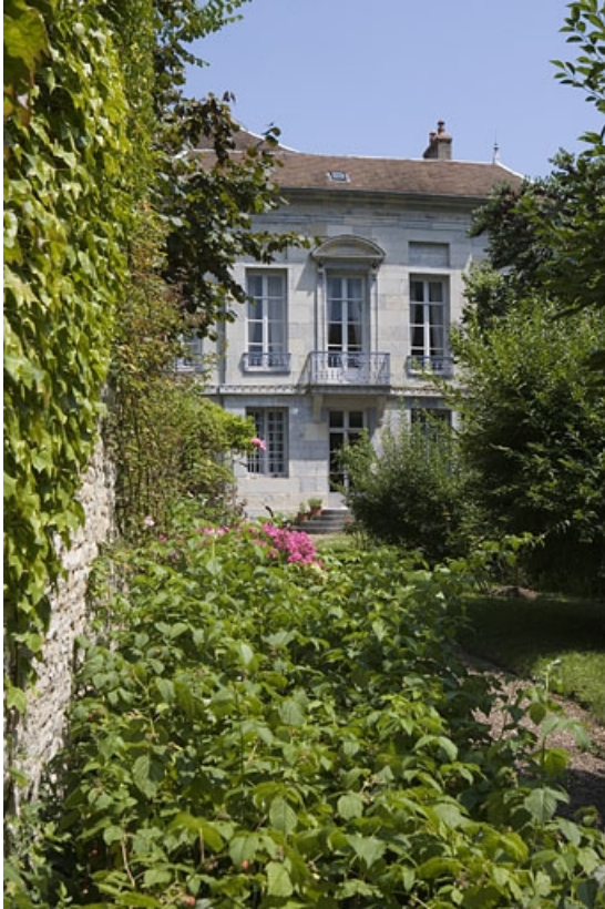
Hôtel en fond de cour : vue d'ensemble de la façade postérieure depuis le fond du jardin.

25, Besançon Grande Rue 104, lieudit : îlot Granvelle