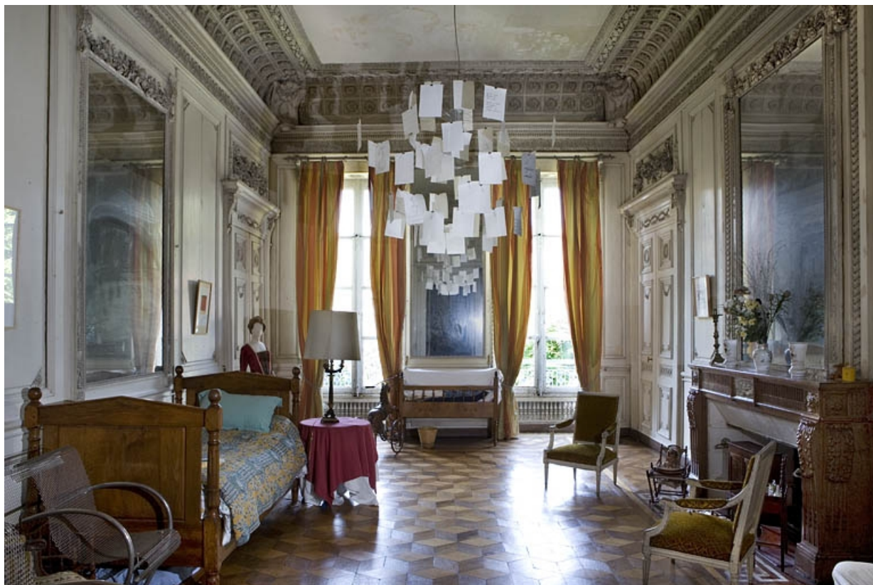
Hôtel en fond de cour : vue d'ensemble du grand salon depuis l'entrée.

25, Besançon Grande Rue 104, lieudit : îlot Granvelle