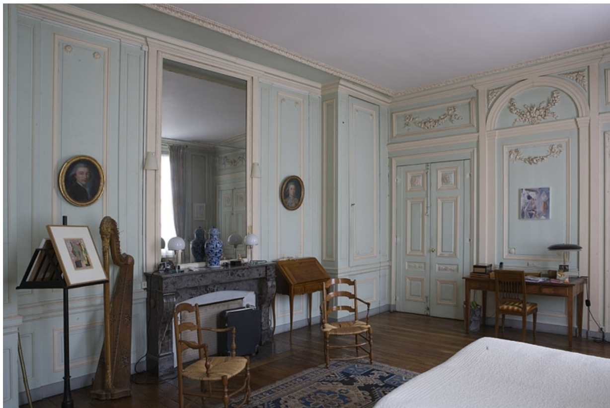
Hôtel en fond de cour, chambre à droite de l'antichambre (ancien petit salon) : vue d'ensemble depuis l'entrée, de trois quarts droit. 25, Besançon Grande Rue 104, lieudit : îlot Granvelle