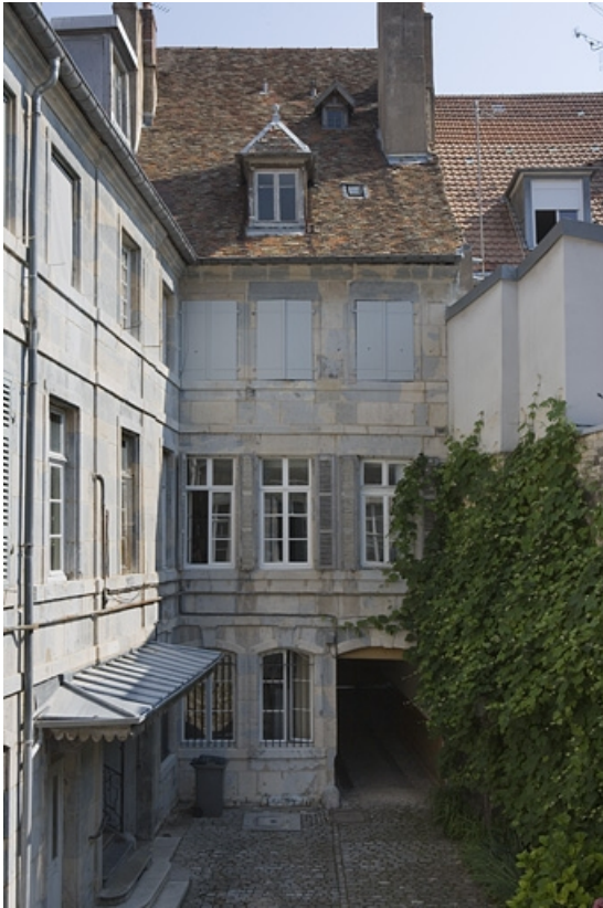
Façade postérieure du logis sur rue et aile sur cour. 25, Besançon Grande Rue 104, lieudit : îlot Granvelle