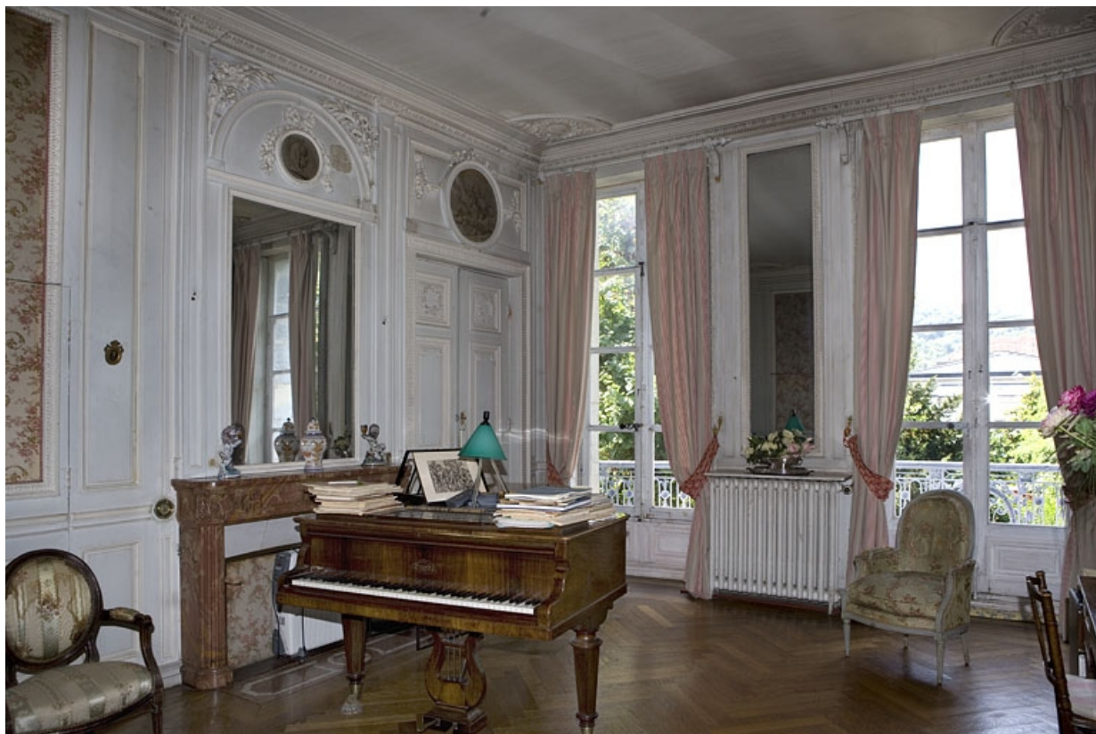
Hôtel en fond de cour : vue d'ensemble de la chambre depuis le fond de la pièce.

25, Besançon Grande Rue 104, lieudit : îlot Granvelle