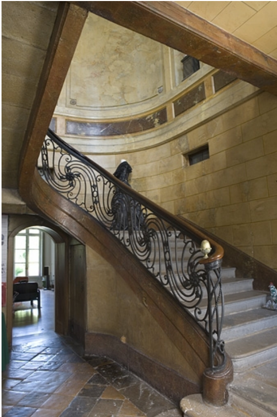
Hôtel en fond de cour, escalier : détail de la première volée avec la rampe en ferronnerie.

25, Besançon Grande Rue 104, lieudit : îlot Granvelle