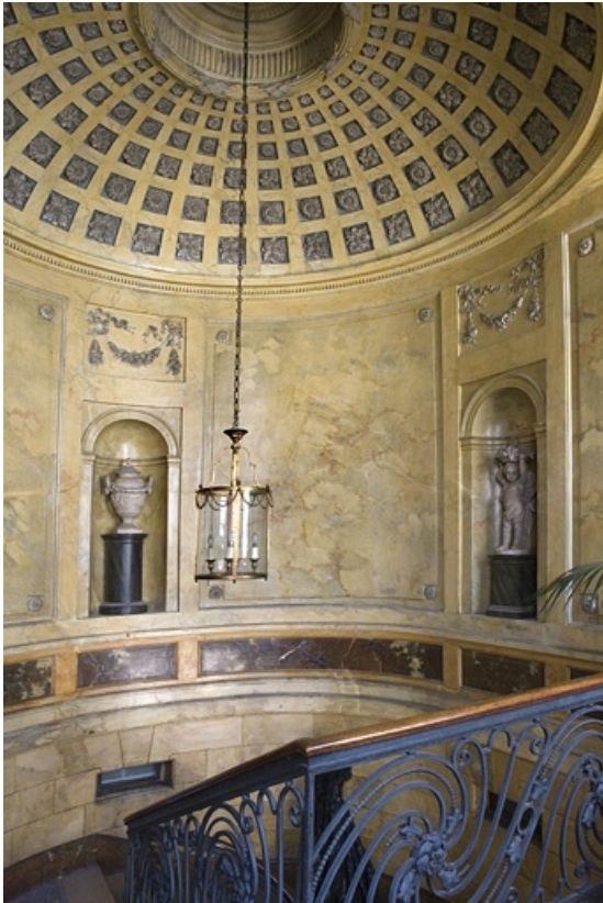
Hôtel en fond de cour, escalier : détail de la cage d'escalier depuis le premier palier.

25, Besançon Grande Rue 104, lieudit : îlot Granvelle