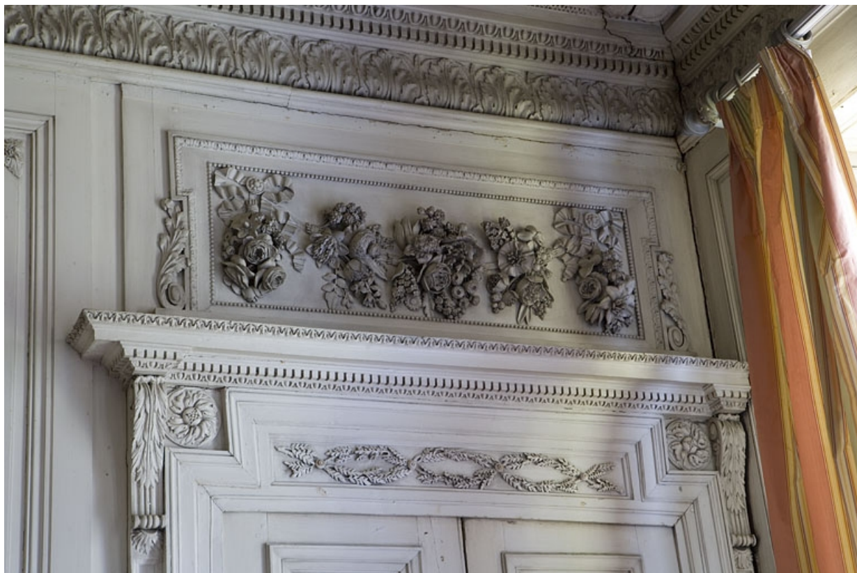
Hôtel en fond de cour : détail du dessus de porte entre le grand salon et la chambre.

25, Besançon Grande Rue 104, lieudit : îlot Granvelle