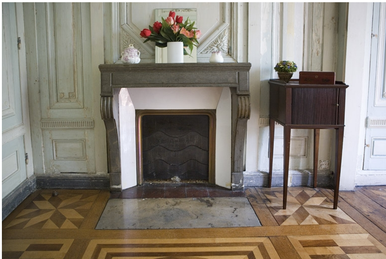
Hôtel en fond de cour : détail de la cheminée de l'ancien cabinet de toilette.

25, Besançon Grande Rue 104, lieudit : îlot Granvelle