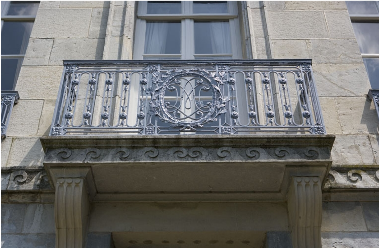
Hôtel en fond de cour : détail du balcon sur la façade postérieure.

25, Besançon Grande Rue 104, lieudit : îlot Granvelle