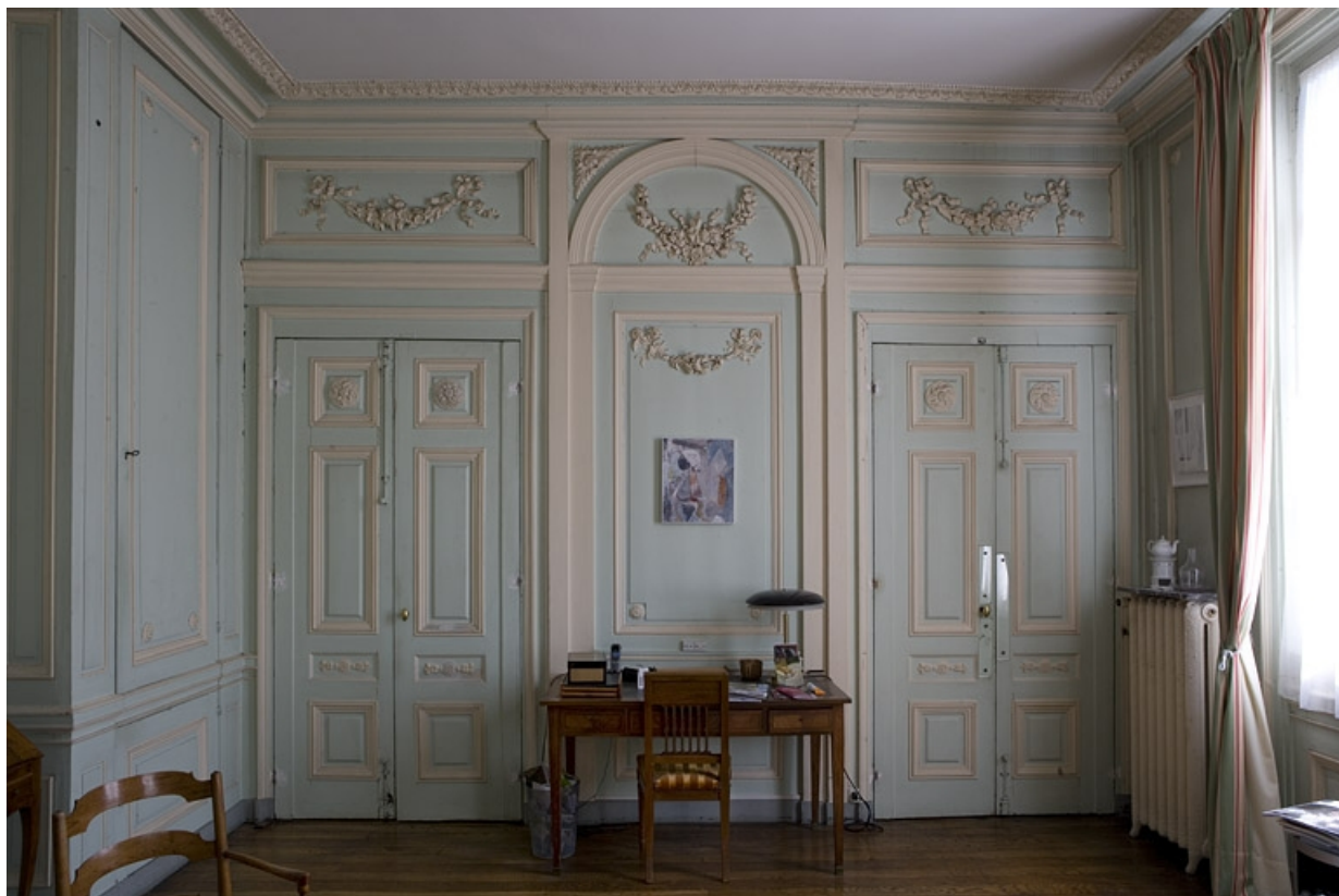
Hôtel en fond de cour, chambre à droite de l'antichambre (ancien petit salon) : détail des lambris au fond de la pièce. 25, Besançon Grande Rue 104, lieudit : îlot Granvelle