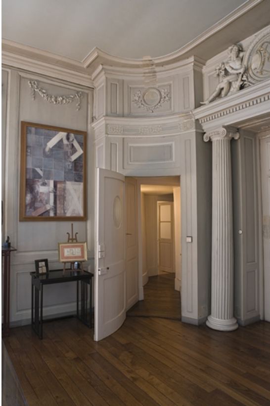
Hôtel en fond de cour, antichambre : vue du couloir, à gauche de l'entrée du grand salon. 25, Besançon Grande Rue 104, lieudit : îlot Granvelle