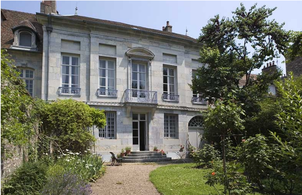
Hôtel en fond de cour : vue d'ensemble de la façade sur jardin.

25, Besançon Grande Rue 104, lieudit : îlot Granvelle