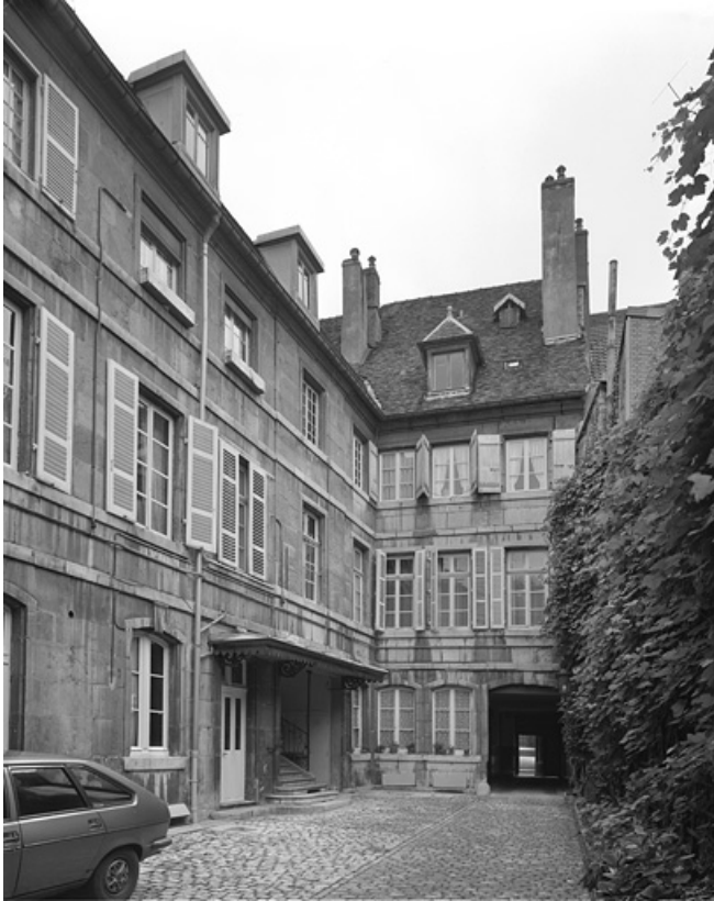
Vue d'ensemble des façades sur cour du logis sur rue.

25, Besançon Grande Rue 104, lieudit : îlot Granvelle