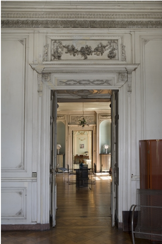
Hôtel en fond de cour, grand salon : vue de l'enfilade depuis l'entrée.

25, Besançon Grande Rue 104, lieudit : îlot Granvelle