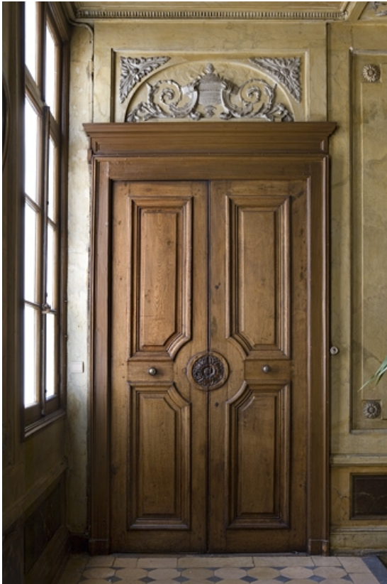
Hôtel en fond de cour, escalier : détail de la porte droite sur le premier palier. 25, Besançon Grande Rue 104, lieudit : îlot Granvelle