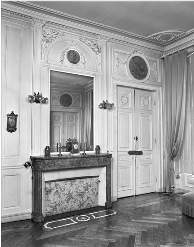
Chambre : détail de la cheminée.

25, Besançon Grande Rue 104, lieudit : îlot Granvelle