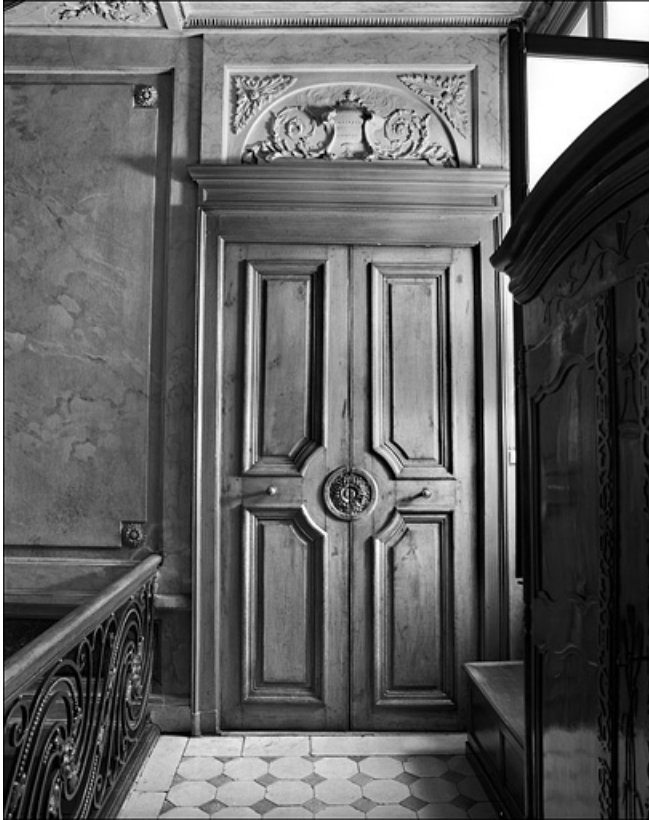
Détail de la porte d'entrée du premier étage de l'hôtel.

25, Besançon Grande Rue 104, lieudit : îlot Granvelle