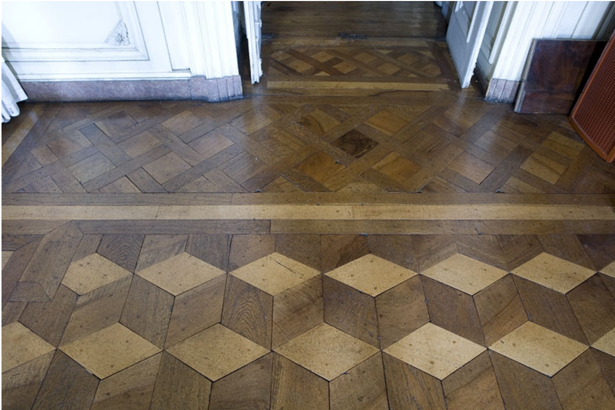
Hôtel en fond de cour : détail du plancher du grand salon vers la porte d'entrée donnant sur l'antichambre. 25, Besançon Grande Rue 104, lieudit : îlot Granvelle