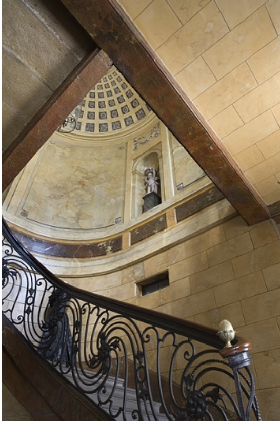
Hôtel en fond de cour, escalier : vue de la cage d'escalier depuis le rez-de-chaussée. 25, Besançon Grande Rue 104, lieudit : îlot Granvelle