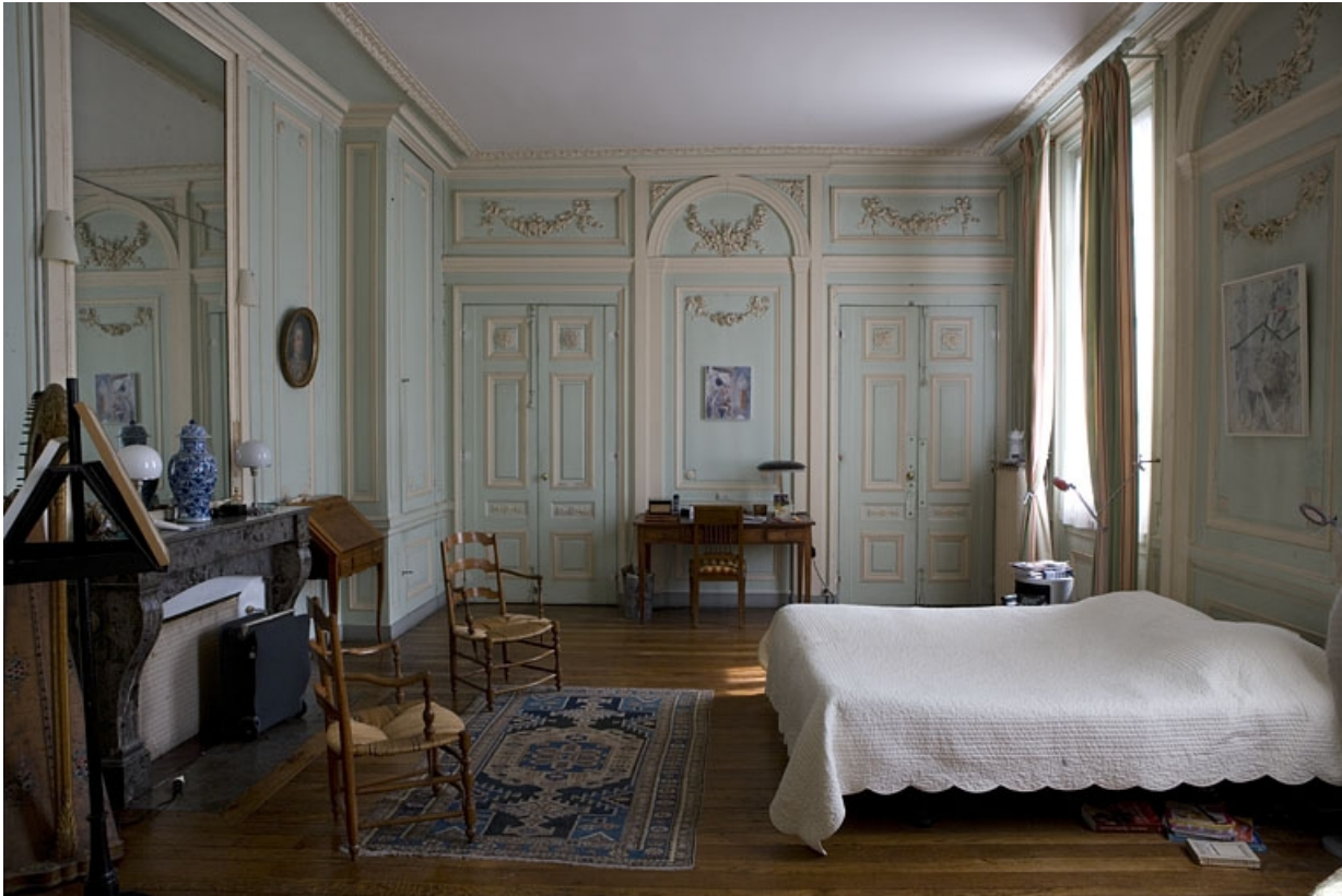
Hôtel en fond de cour, chambre à droite de l'antichambre (ancien petit salon) : vue d'ensemble depuis l'entrée. 25, Besançon Grande Rue 104, lieudit : îlot Granvelle