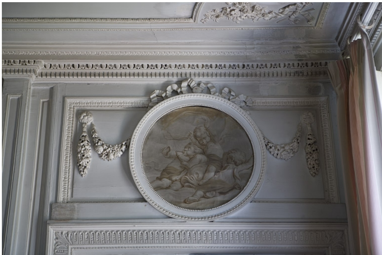
Hôtel en fond de cour, chambre : détail du médaillon peint en grisaille au-dessus de la porte donnant accès au boudoir. 25, Besançon Grande Rue 104, lieudit : îlot Granvelle