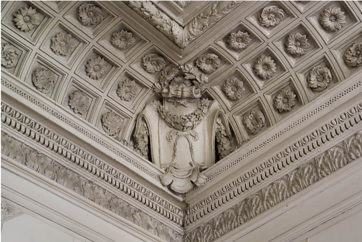
Hôtel en fond de cour, grand salon : détail d'un angle du plafond portant le monogramme L. 25, Besançon Grande Rue 104, lieudit : îlot Granvelle