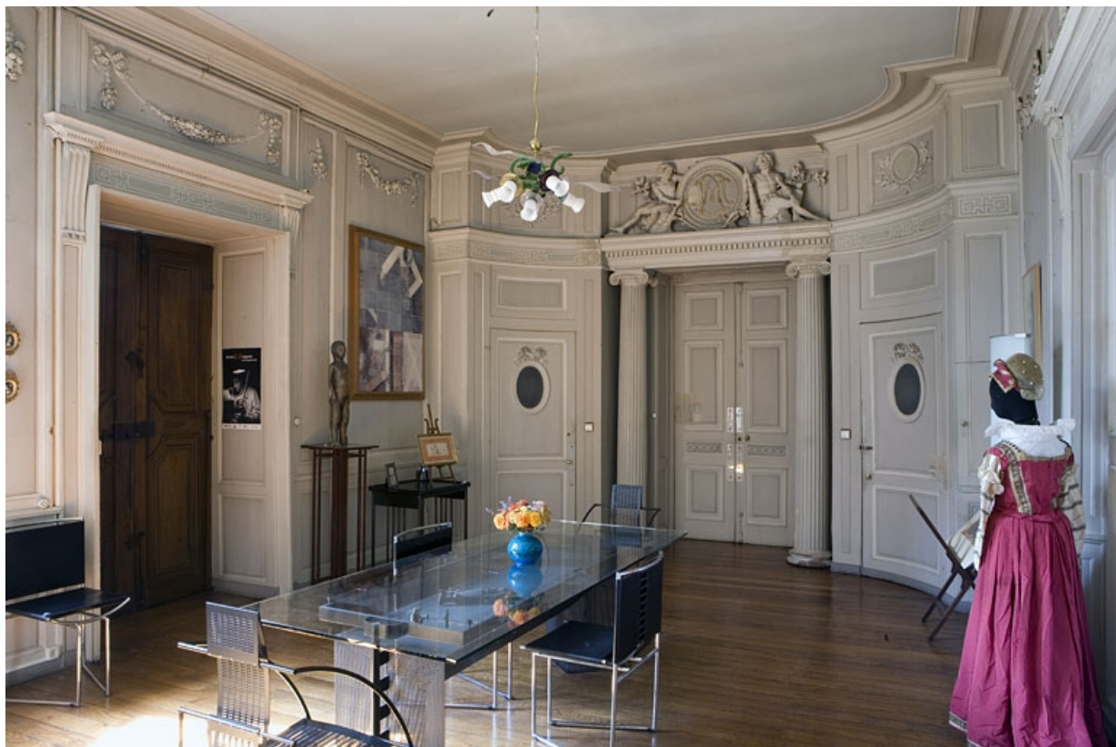
Hôtel en fond de cour, antichambre : vue d'ensemble depuis le fond de la pièce.

25, Besançon Grande Rue 104, lieudit : îlot Granvelle