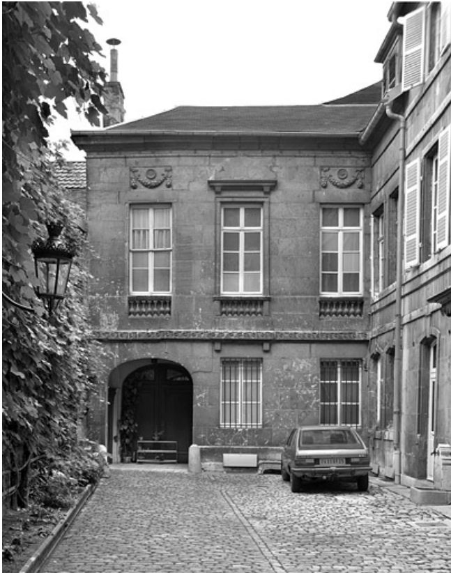
Détail de la façade de l'hôtel en fond de cour.

25, Besançon Grande Rue 104, lieudit : îlot Granvelle