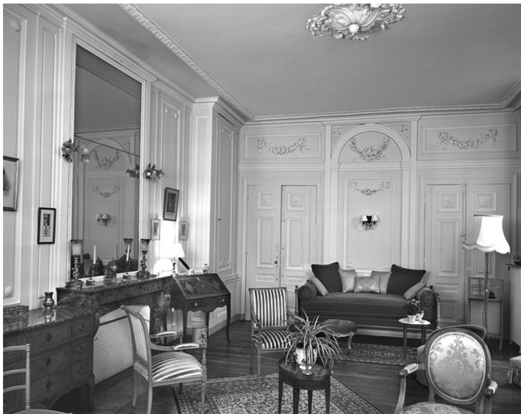
Vue d'ensemble du petit salon depuis la porte de communication avec l'antichambre.

25, Besançon Grande Rue 104, lieudit : îlot Granvelle