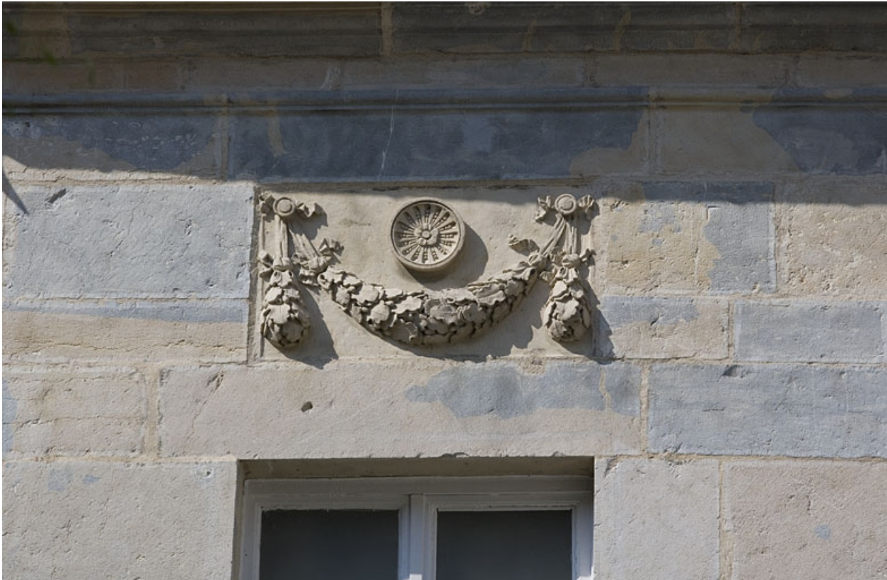
Hôtel en fond de cour : détail d'un décor sur la façade antérieure.

25, Besançon Grande Rue 104, lieudit : îlot Granvelle