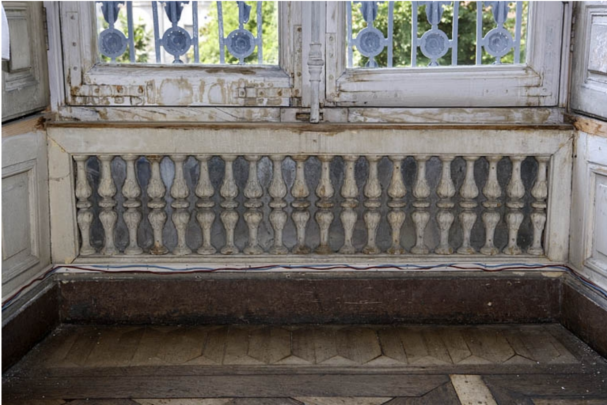
Hôtel en fond de cour, grand salon : décor de balustres sur fond de glace sous une fenêtre.

25, Besançon Grande Rue 104, lieudit : îlot Granvelle