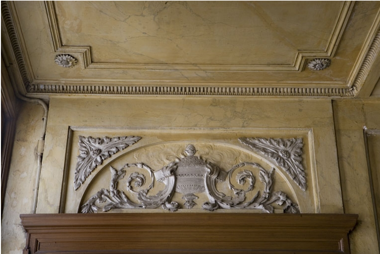
Hôtel en fond de cour, escalier : détail du décor en stuc du dessus de porte, à droite du palier. 25, Besançon Grande Rue 104, lieudit : îlot Granvelle