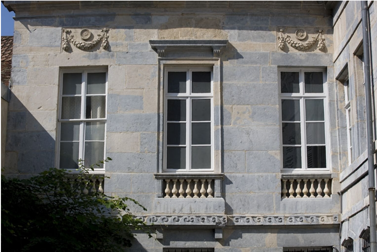
Hôtel en fond de cour : détail du premier étage de la façade antérieure.

25, Besançon Grande Rue 104, lieudit : îlot Granvelle