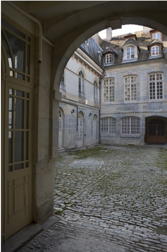
Vue des bâtiments sur cour depuis l'entrée du passage cocher.

25, Besançon Grande Rue 102, lieudit : îlot Granvelle