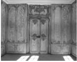
Logis sur cour, intérieur : vue d'ensemble des lambris de la bibliothèque avec la porte d'entrée. 25, Besançon Grande Rue 102, lieudit : îlot Granvelle