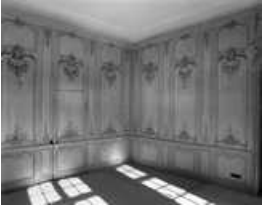
Logis sur cour, intérieur : vue des lambris du salon, de trois quarts. 25, Besançon Grande Rue 102, lieudit : îlot Granvelle