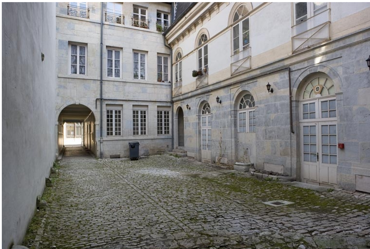
Façade postérieure du logis sur rue et aile sur cour : rez-de-chaussée et premier étage. 25, Besançon Grande Rue 102, lieudit : îlot Granvelle