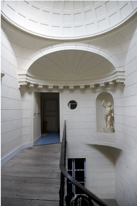
Escalier, dernier palier : détail de la demi-coupole, de face. 25, Besançon Grande Rue 102, lieudit : îlot Granvelle