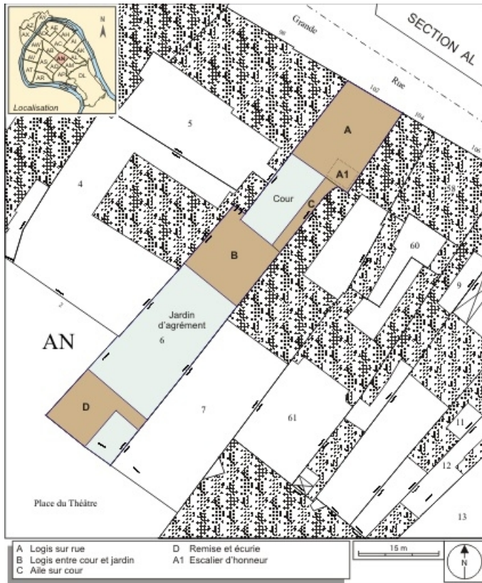
Plan masse et de situation. Extrait du plan cadastral, 1974, section AN. 25, Besançon Grande Rue 102, lieudit : îlot Granvelle