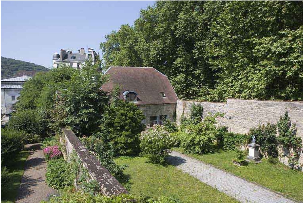
Bâtiment des remise et écurie depuis la propriété voisine.

25, Besançon Grande Rue 102, lieudit : îlot Granvelle