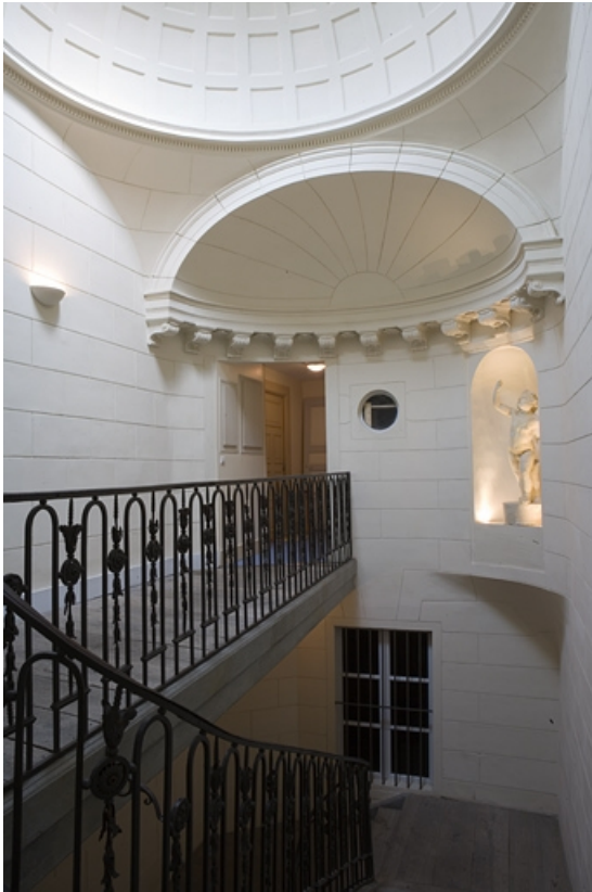
Escalier, dernier palier : détail de la demi-coupole. 25, Besançon Grande Rue 102, lieudit : îlot Granvelle