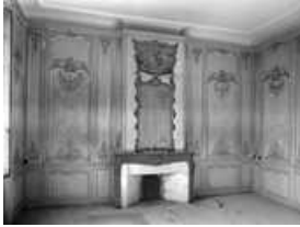
Logis sur cour, intérieur : vue d'ensemble de la cheminée du salon.

25, Besançon Grande Rue 102, lieudit : îlot Granvelle