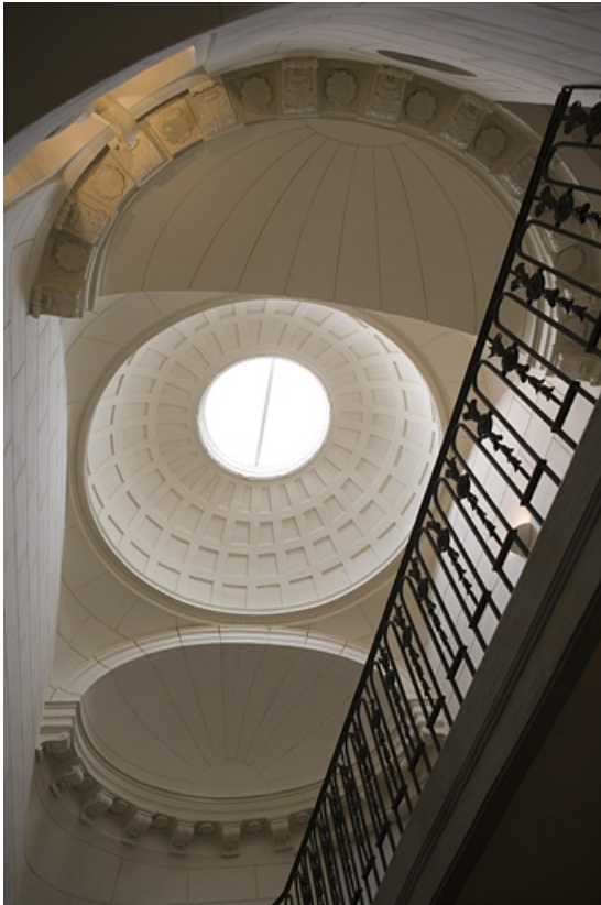
Couvrement de l'escalier : détail de la coupole et des deux demi-coupoles. 25, Besançon Grande Rue 102, lieudit : îlot Granvelle