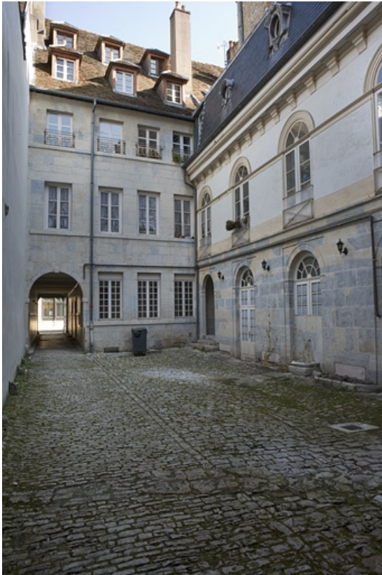
Façade postérieure du logis sur rue et l'aile sur cour. 25, Besançon Grande Rue 102, lieudit : îlot Granvelle