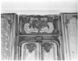
Logis sur cour, intérieur : lambris de la bibliothèque, détail du dessus de porte. 25, Besançon Grande Rue 102, lieudit : îlot Granvelle