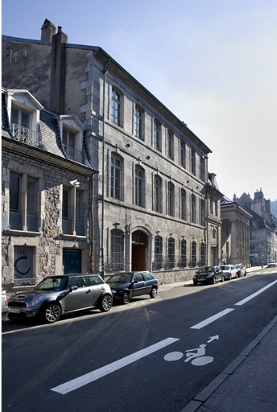
Vue d'ensemble rapprochée de la façade antérieure. 25, Besançon, 47 rue Mégevand, lieudit : îlot Granvelle