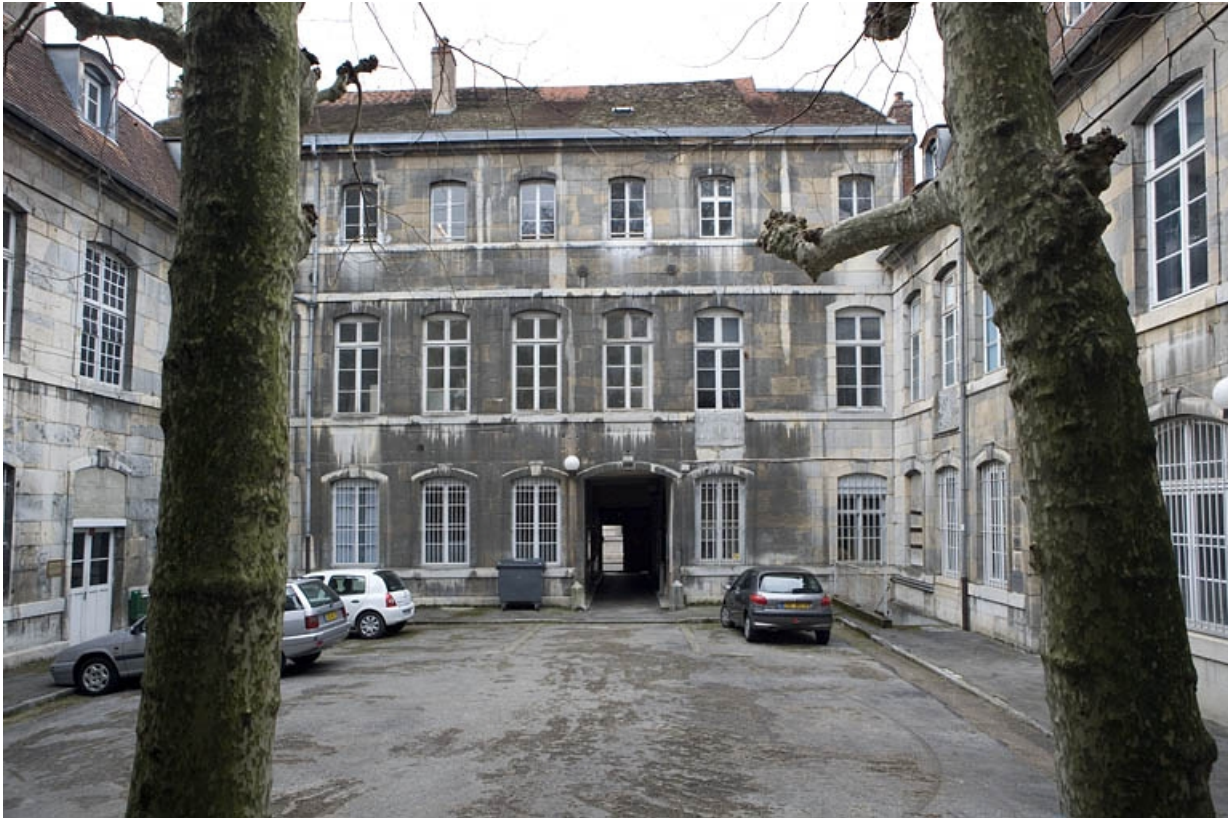
Vue d'ensemble de la façade postérieure du logis principal depuis le fond de la cour. 25, Besançon, 47 rue Mégevand, lieudit : îlot Granvelle