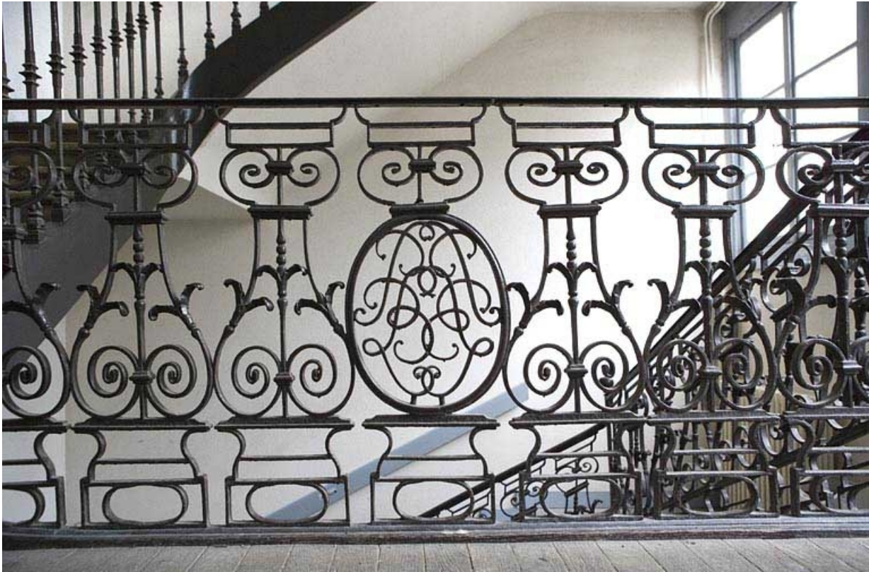
Détail des motifs en fer forgé de la rampe d'escalier.

25, Besançon, 47 rue Mégevand, lieudit : îlot Granvelle