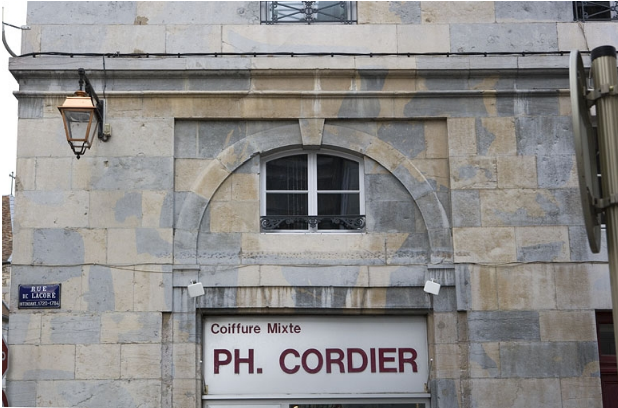
Détail d'une baie sur la rue secondaire.

25, Besançon, 47 rue Mégevand, lieudit : îlot Granvelle