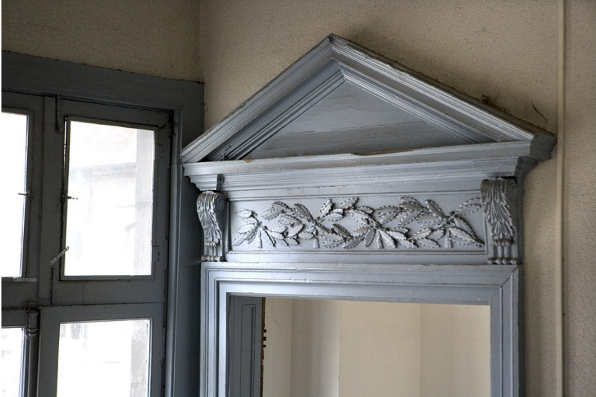
Détail d'un dessus de porte du premier étage.

25, Besançon, 47 rue Mégevand, lieudit : îlot Granvelle