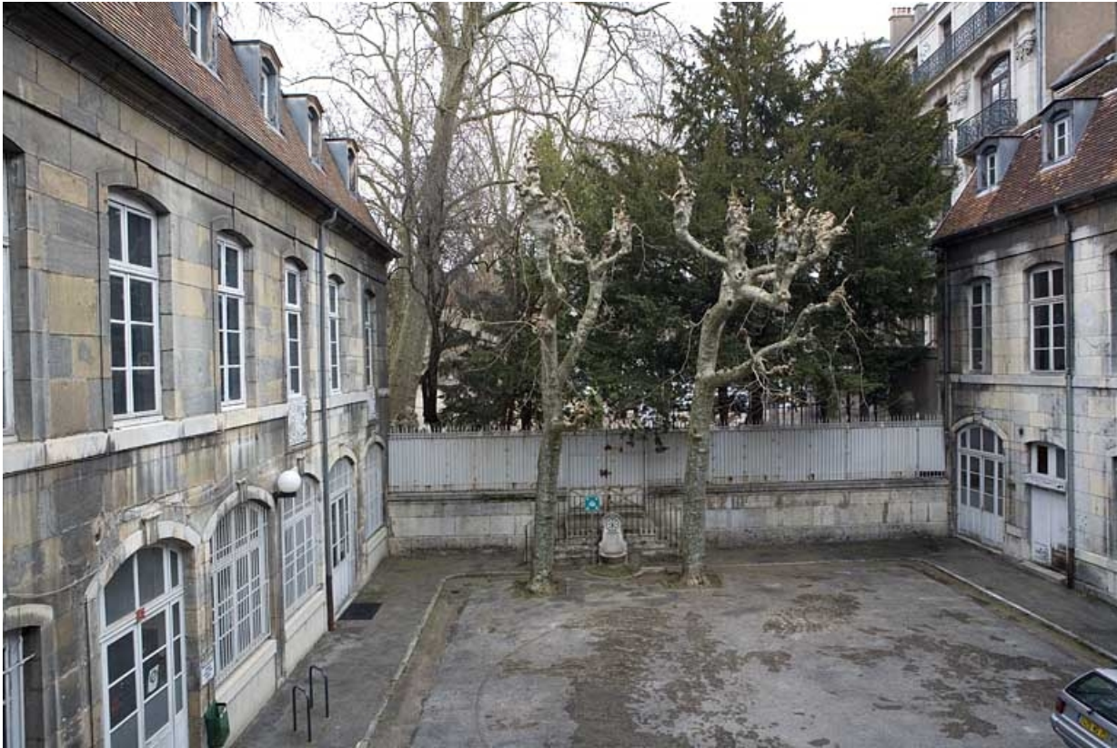
Vue d'ensemble de la cour depuis l'entrée.

25, Besançon, 47 rue Mégevand, lieudit : îlot Granvelle