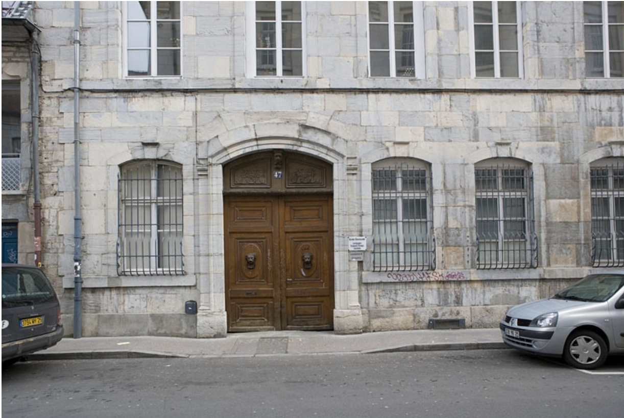
Détail du rez-de-chaussée de la façade principale.

25, Besançon, 47 rue Mégevand, lieudit : îlot Granvelle