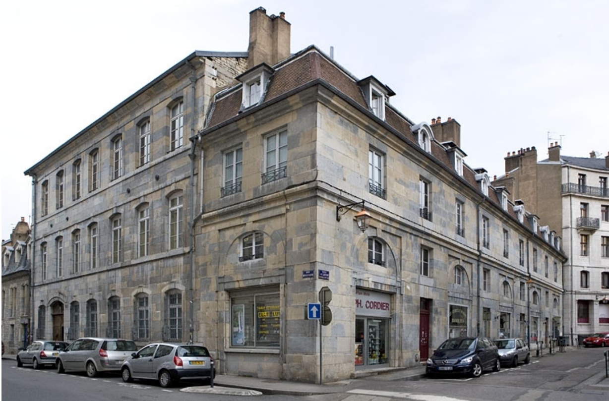
Vue d'ensemble du logis principal à l'angle des deux rues.

25, Besançon, 47 rue Mégevand, lieudit : îlot Granvelle