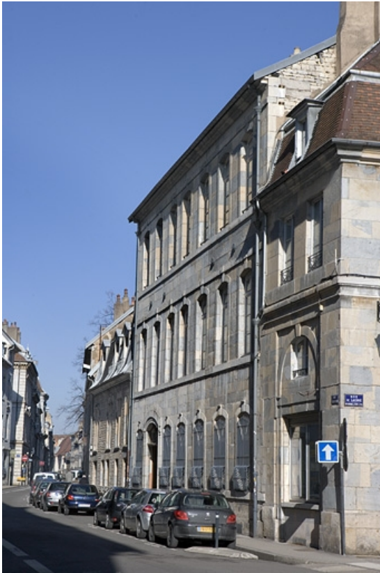
Vue d'ensemble de la façade antérieure dans l'alignement de la rue.

25, Besançon, 47 rue Mégevand, lieudit : îlot Granvelle