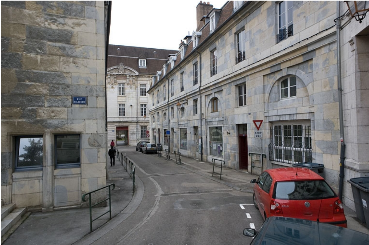
Vue d'ensemble de la façade située sur la rue secondaire.

25, Besançon, 47 rue Mégevand, lieudit : îlot Granvelle