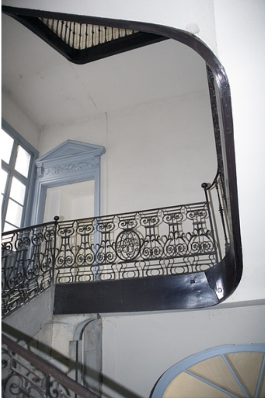
Détail de la rampe de l'escalier.

25, Besançon, 47 rue Mégevand, lieudit : îlot Granvelle