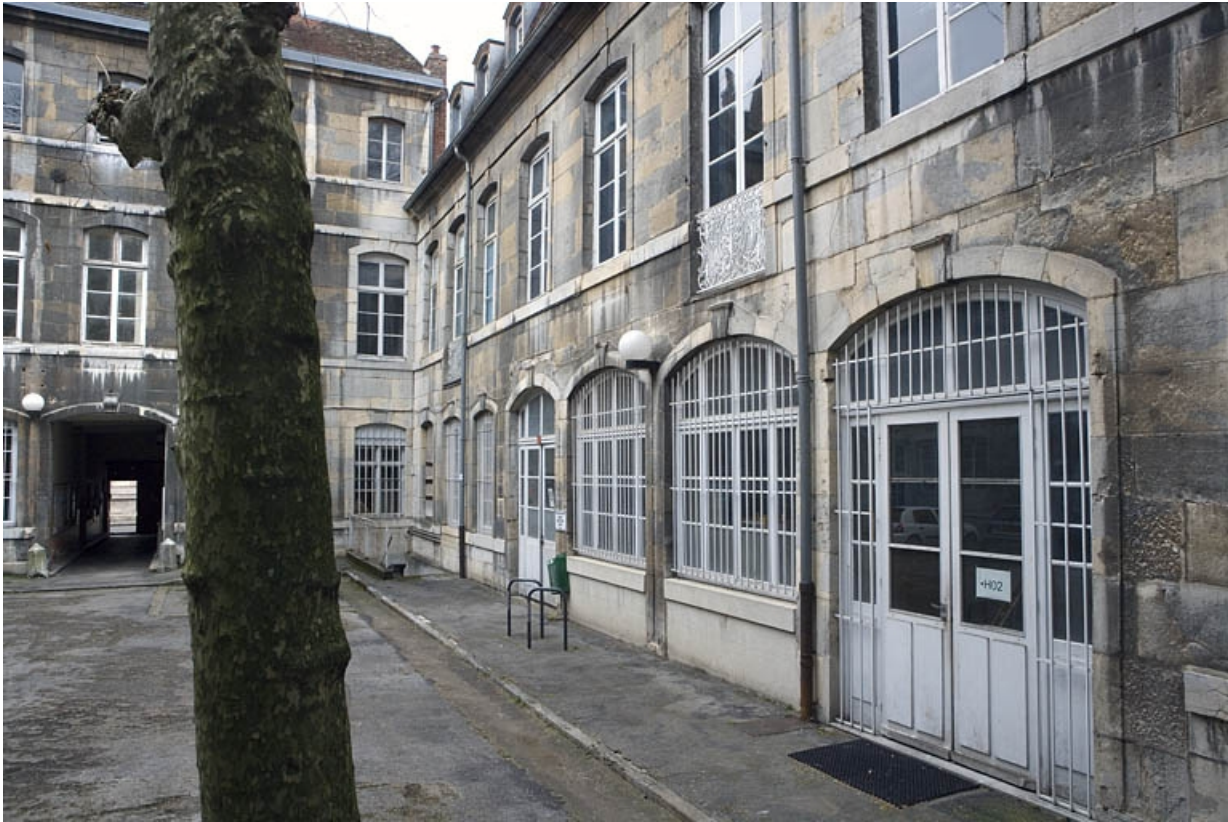
Vue d'ensemble de l'aile gauche depuis le fond de la cour.

25, Besançon, 47 rue Mégevand, lieudit : îlot Granvelle