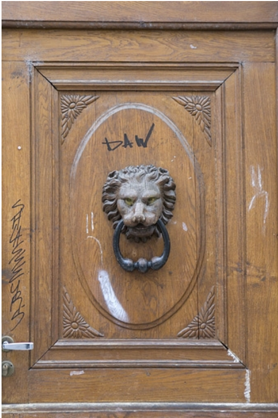
Vantail droit du portail d'entrée : détail du panneau central.

25, Besançon, 47 rue Mégevand, lieudit : îlot Granvelle