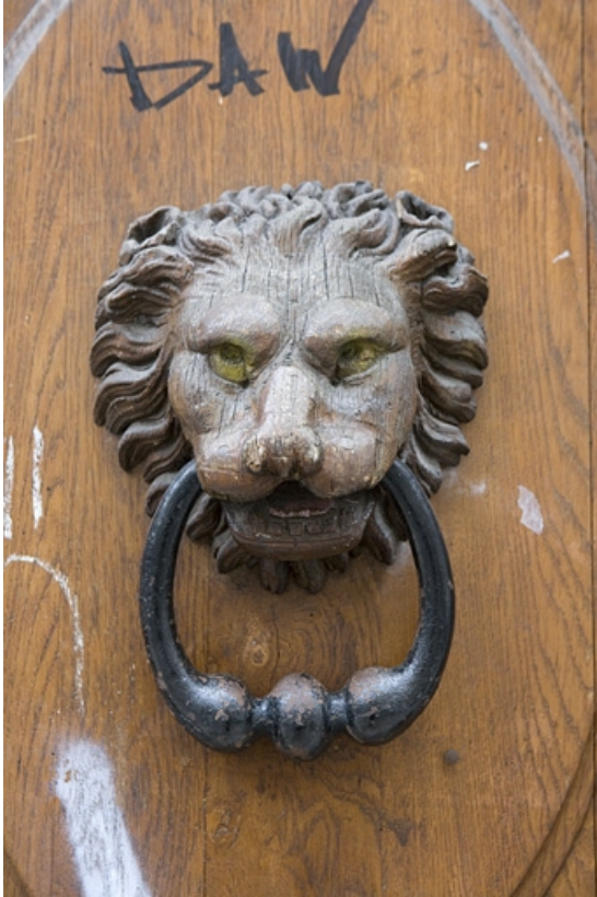
Vantail droit du portail d'entrée : détail du mufle de lion situé sur le panneau central, de face. 25, Besançon, 47 rue Mégevand, lieudit : îlot Granvelle