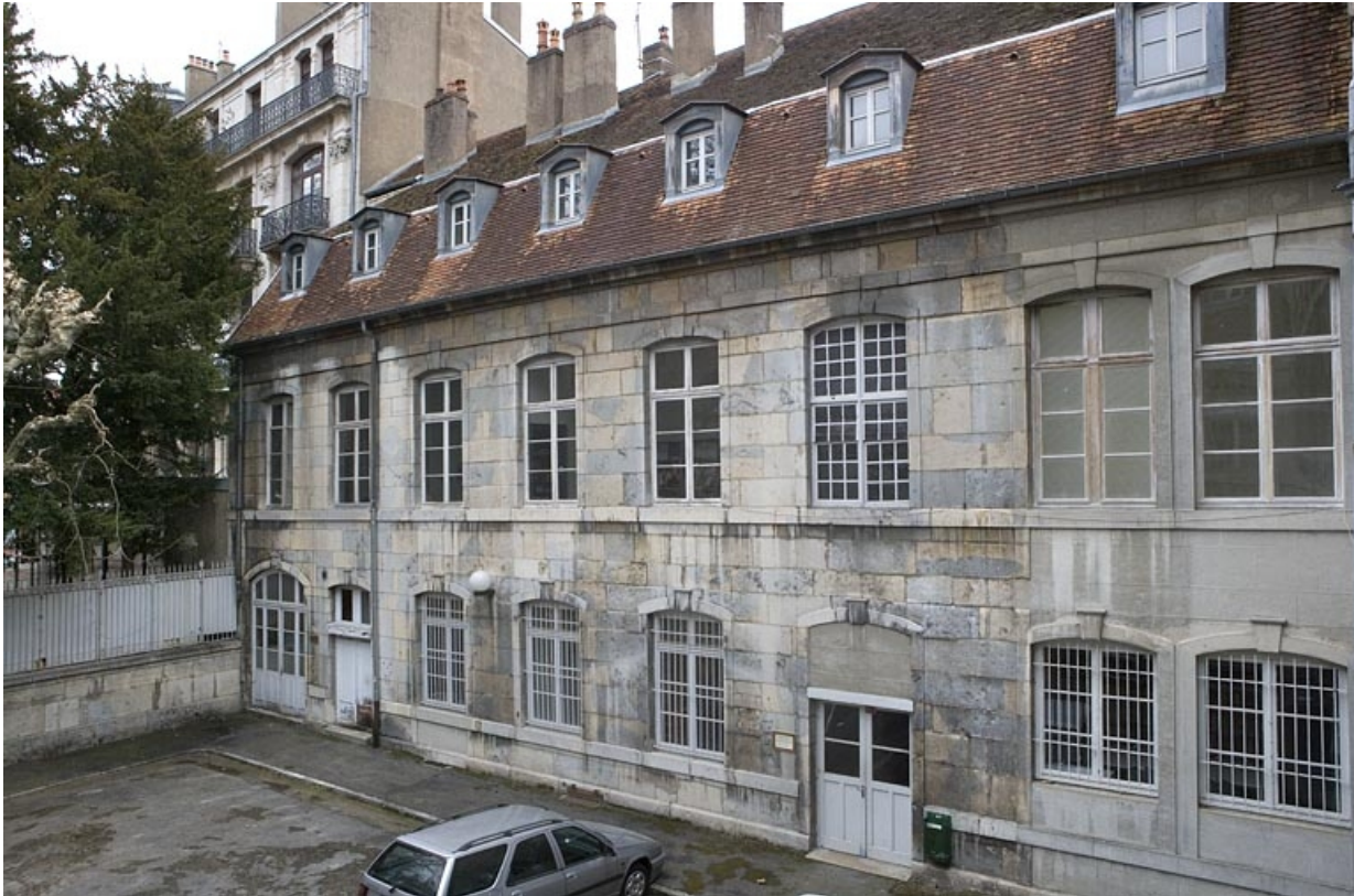
Vue d'ensemble de l'aile droite depuis l'entrée de la cour.

25, Besançon, 47 rue Mégevand, lieudit : îlot Granvelle