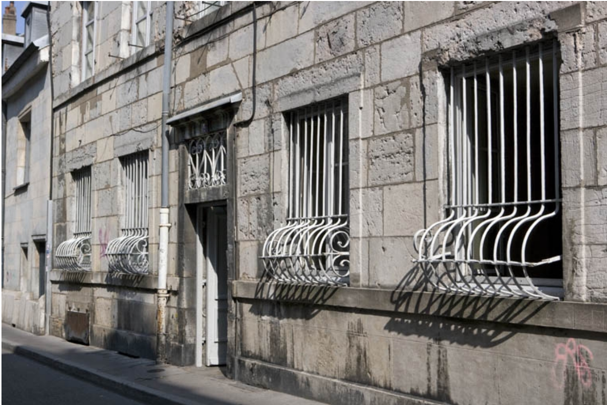
Façade sur rue : détail du rez-de-chaussée, de trois quarts droit.

25, Besançon, 1 rue de la Vieille Monnaie, lieudit : îlot Ronchaux