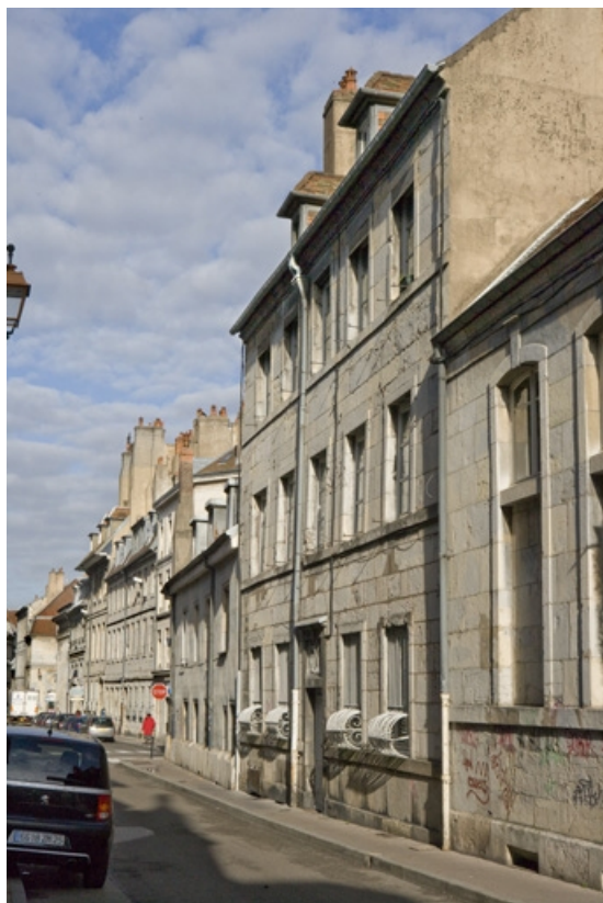
Vue d'ensemble du logis principal sur rue, de trois quarts droit.

25, Besançon, 1 rue de la Vieille Monnaie, lieudit : îlot Ronchaux