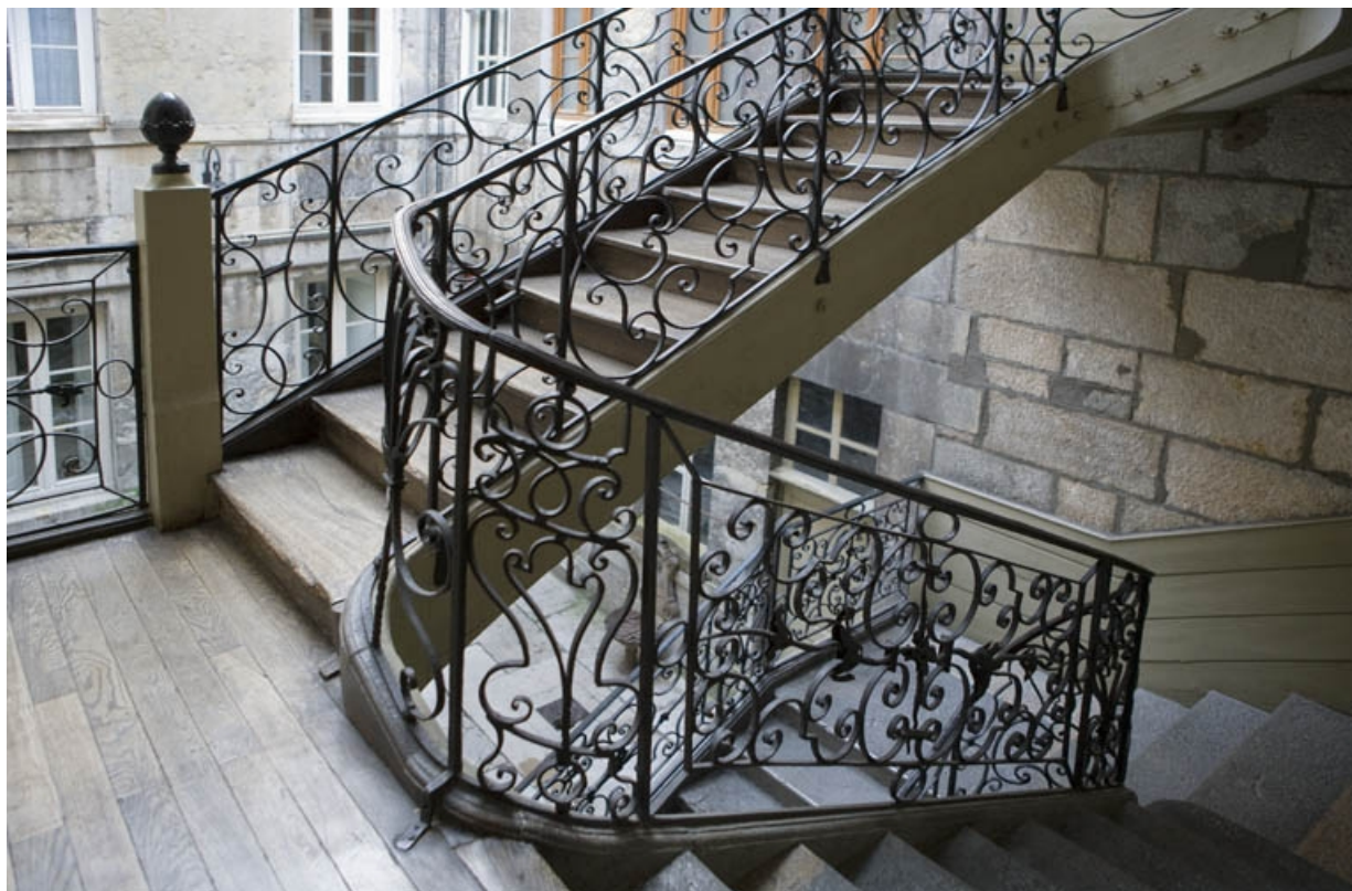
Détail de la rampe en fer forgé de l'escalier à cage ouverte. 25, Besançon, 1 rue de la Vieille Monnaie, lieudit : îlot Ronchaux