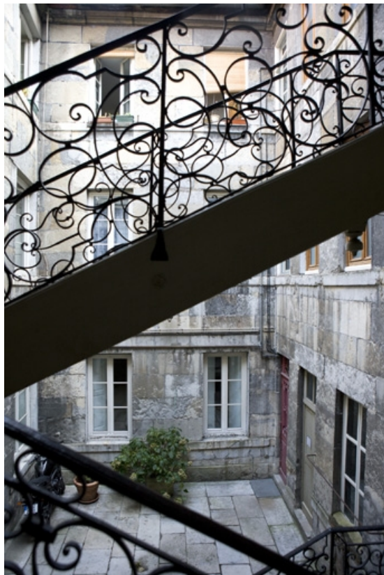
Détail de la rampe de l'escalier à cage ouverte.

25, Besançon, 1 rue de la Vieille Monnaie, lieudit : îlot Ronchaux