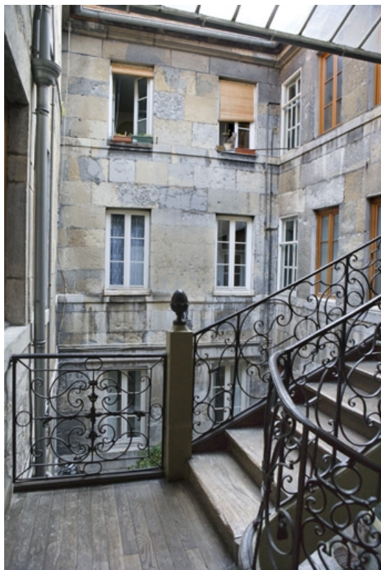
Façades sur cour du logis depuis l'escalier à cage ouverte. 25, Besançon, 1 rue de la Vieille Monnaie, lieudit : îlot Ronchaux