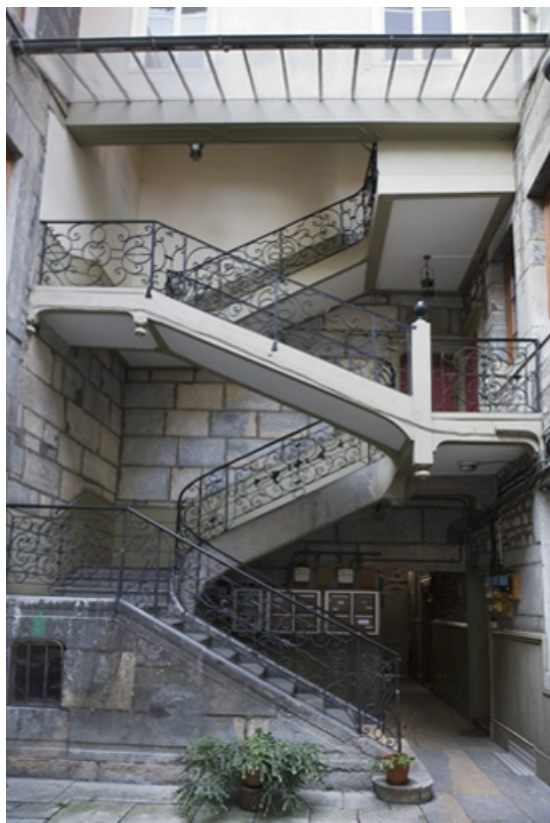
Vue d'ensemble de l'escalier à cage ouverte sur cour.

25, Besançon, 1 rue de la Vieille Monnaie, lieudit : îlot Ronchaux