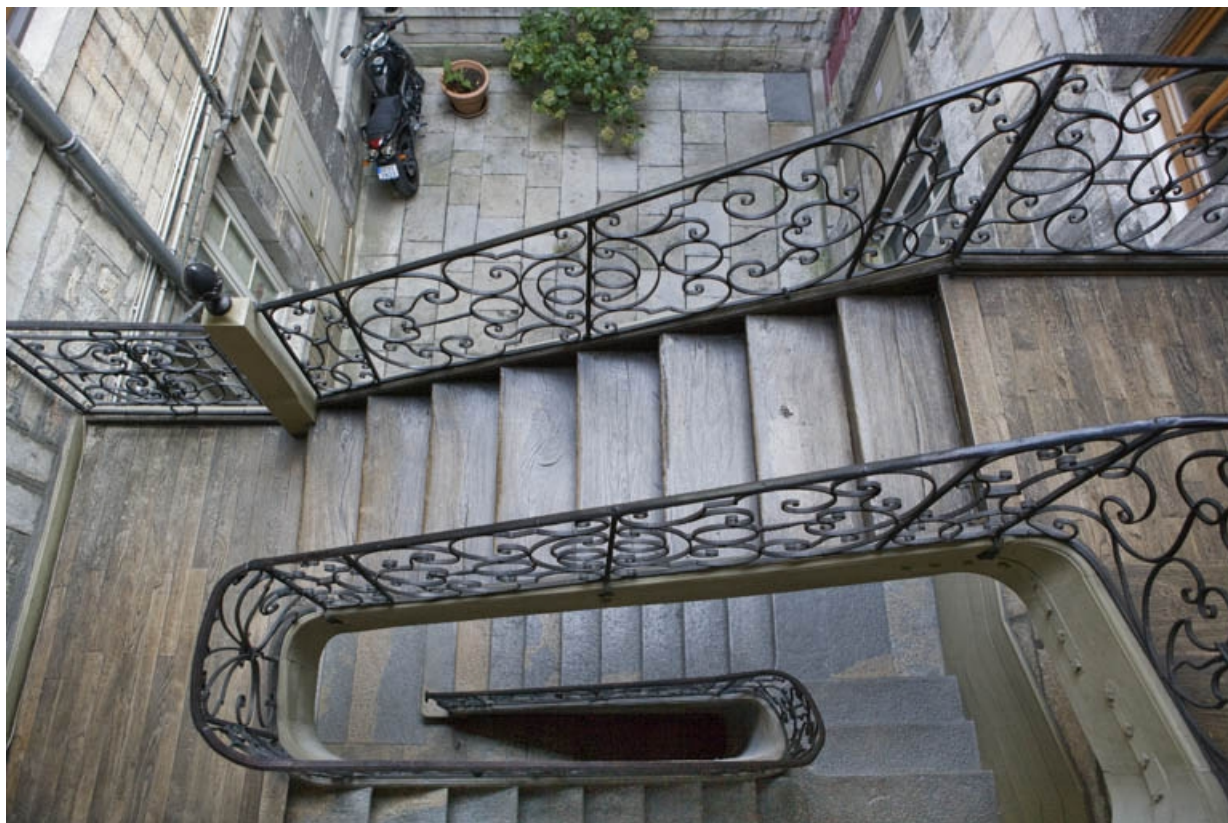
Vue en plongée de l'intérieur de l'escalier à cage ouverte.

25, Besançon, 1 rue de la Vieille Monnaie, lieudit : îlot Ronchaux