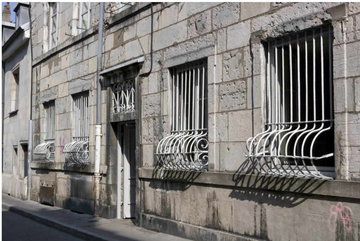
Façade sur rue : détail du rez-de-chaussée, de trois quarts droit.

25, Besançon, 1 rue de la Vieille Monnaie, lieudit : îlot Ronchaux