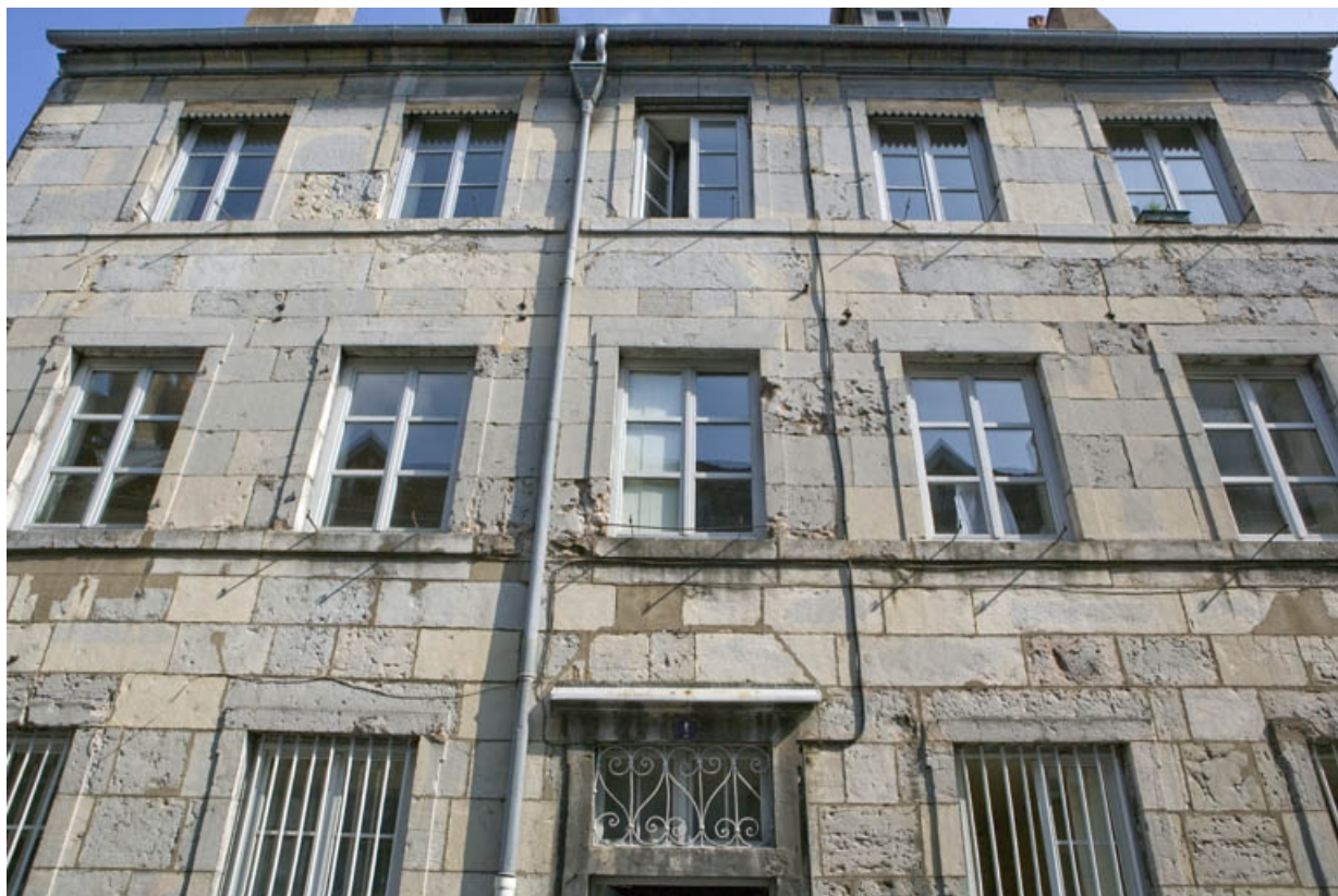
Façade sur rue : détail du premier et du deuxième étages, de face.

25, Besançon, 1 rue de la Vieille Monnaie, lieudit : îlot Ronchaux