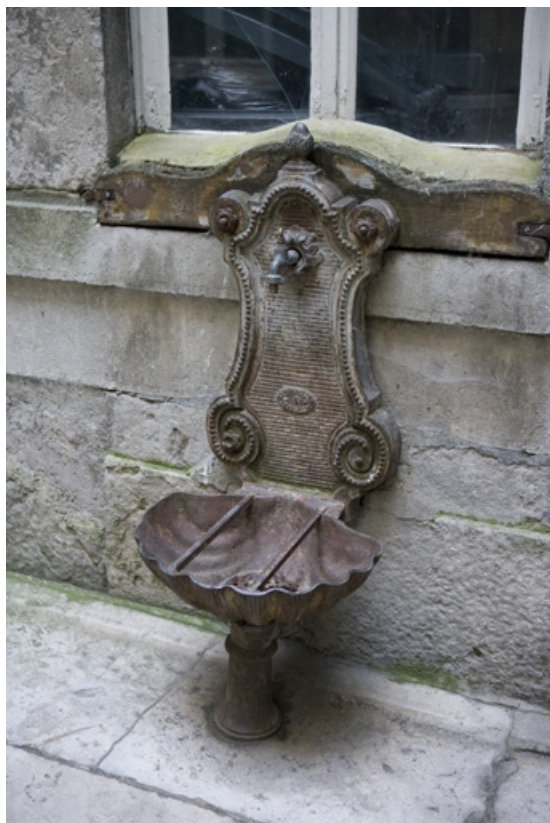
Détail de la borne fontaine située dans la cour.

25, Besançon, 1 rue de la Vieille Monnaie, lieudit : îlot Ronchaux