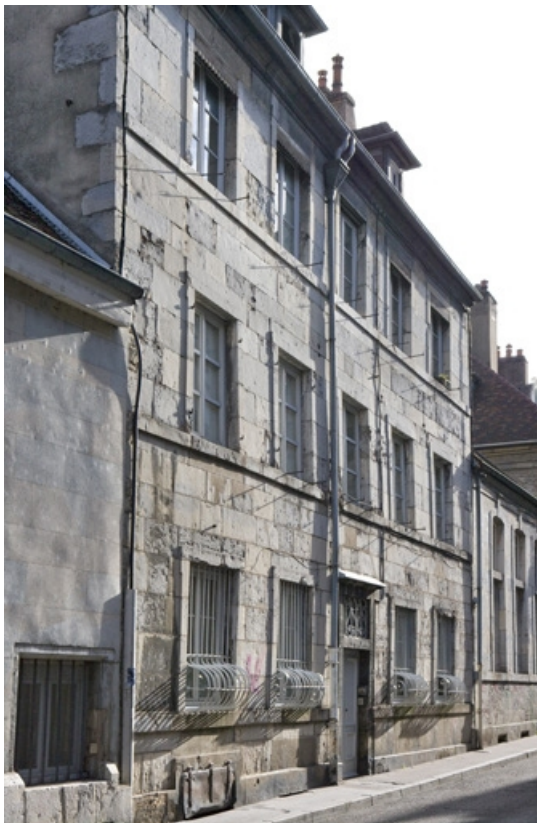
Vue d'ensemble du logis principal sur rue, de trois quarts gauche.

25, Besançon, 1 rue de la Vieille Monnaie, lieudit : îlot Ronchaux