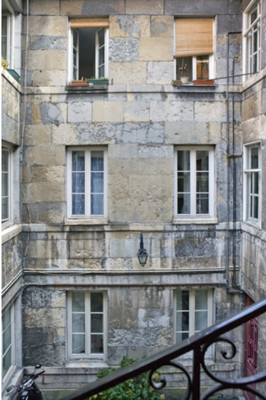
Détail de la façade en fond de cour depuis l'escalier à cage ouverte.

25, Besançon, 1 rue de la Vieille Monnaie, lieudit : îlot Ronchaux