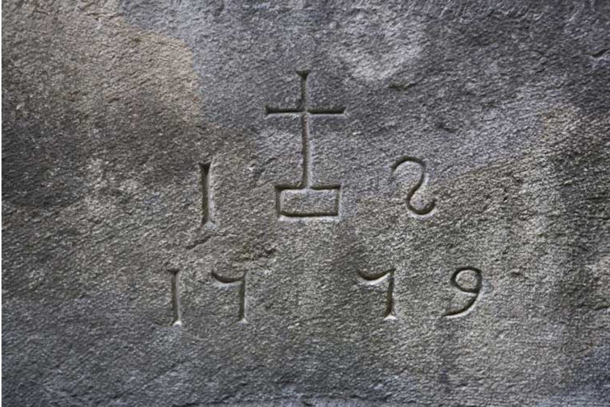
Détail de la date située sur le soupirail de la cave.

25, Besançon, 1 rue de la Vieille Monnaie, lieudit : îlot Ronchaux