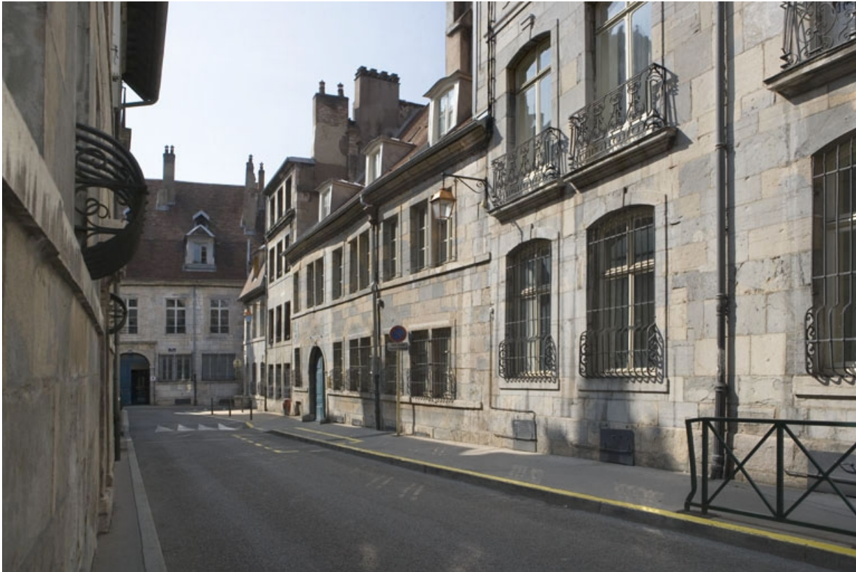
Vue d'ensemble du logis principal dans l'alignement de la rue.

25, Besançon, 36 rue Renan, lieudit : îlot Ronchaux