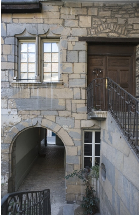
Détail du passage cocher côté cour depuis l'escalier.

25, Besançon, 36 rue Renan, lieudit : îlot Ronchaux