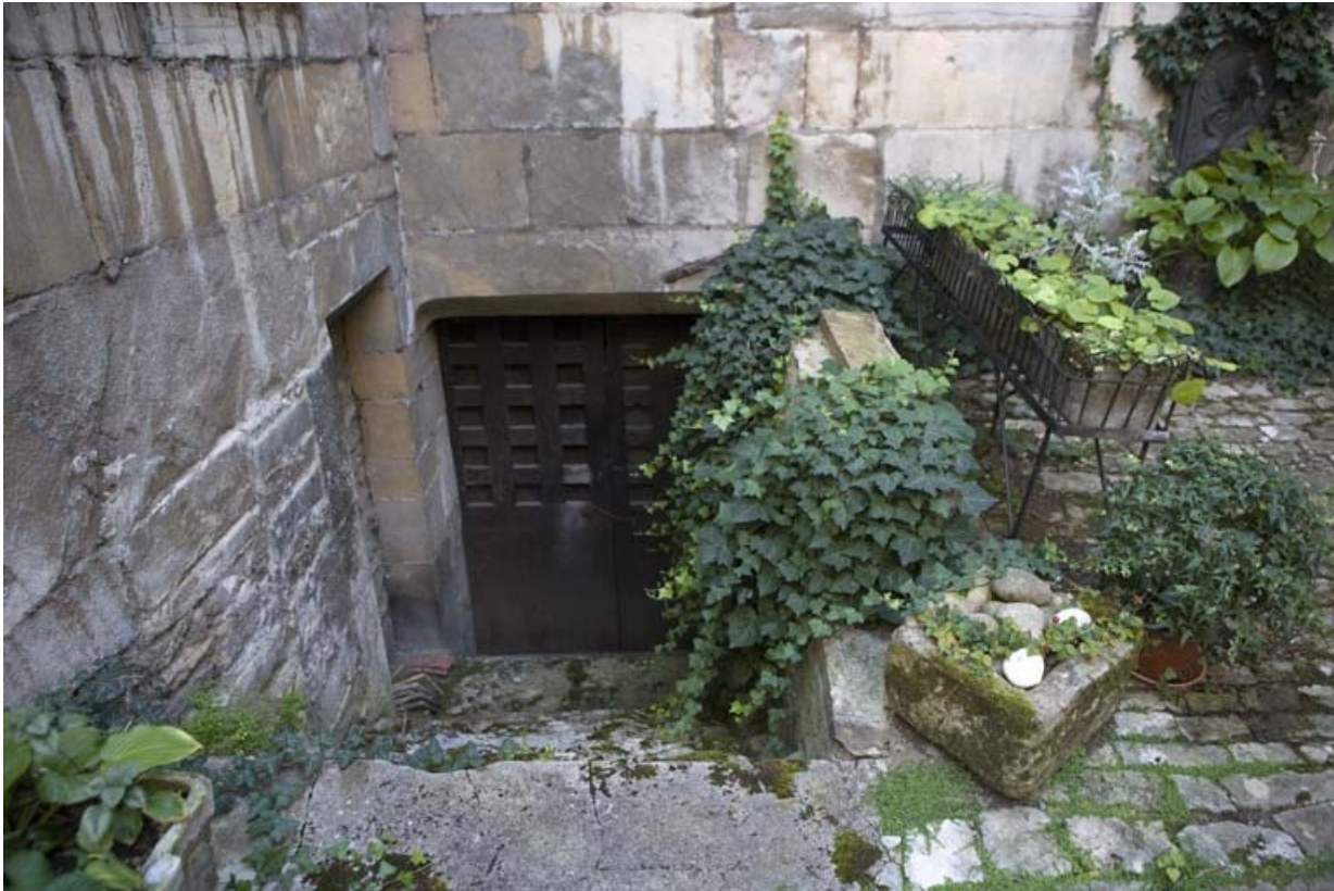
Façade postérieure du logis : entrée de cave.

25, Besançon, 36 rue Renan, lieudit : îlot Ronchaux