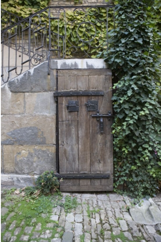
Porte dans le soubassement de l'escalier extérieur : vue d'ensemble.

25, Besançon, 36 rue Renan, lieudit : îlot Ronchaux