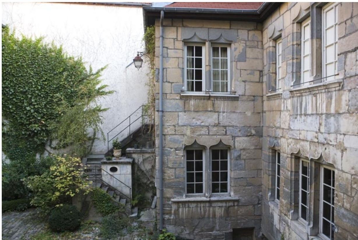
Aile du logis, façade latérale.

25, Besançon, 36 rue Renan, lieudit : îlot Ronchaux