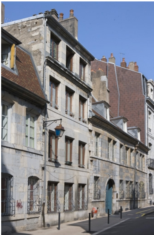
Vue d'ensemble éloignée du logis principal sur rue, de trois quarts gauche.

25, Besançon, 36 rue Renan, lieudit : îlot Ronchaux