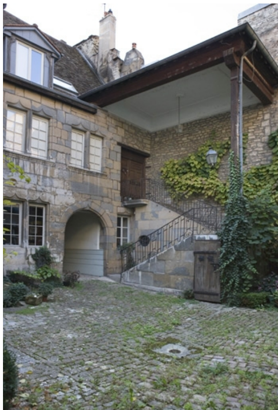
Vue d'ensemble de l'escalier extérieur, de trois quarts droit.

25, Besançon, 36 rue Renan, lieudit : îlot Ronchaux