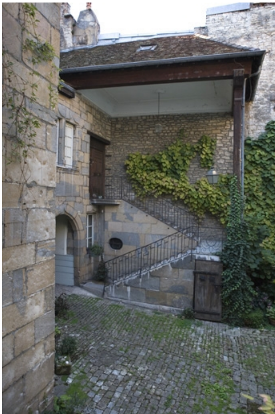
Vue d'ensemble de l'escalier extérieur, de face.

25, Besançon, 36 rue Renan, lieudit : îlot Ronchaux