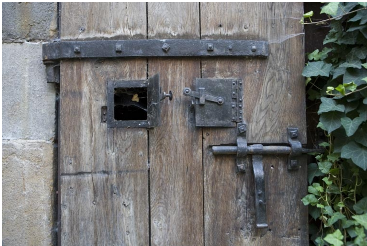
Porte dans le soubassement de l'escalier extérieur : détail de la fermeture et des guichets.

25, Besançon, 36 rue Renan, lieudit : îlot Ronchaux