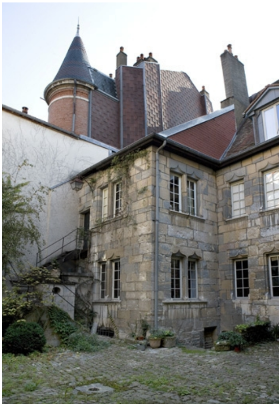
Détail de l'aile sur cour, de trois quarts droit.

25, Besançon, 36 rue Renan, lieudit : îlot Ronchaux