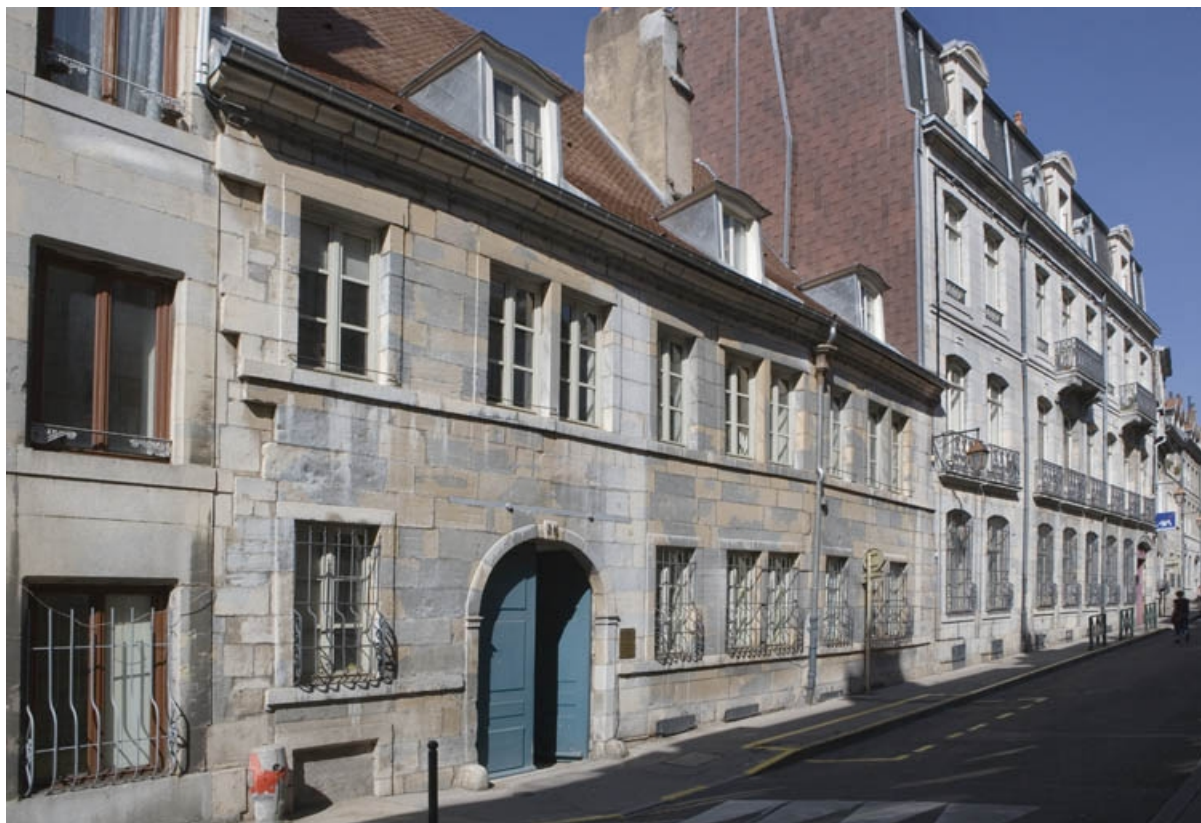
Vue d'ensemble du logis principal sur rue, de trois quarts gauche.

25, Besançon, 36 rue Renan, lieudit : îlot Ronchaux