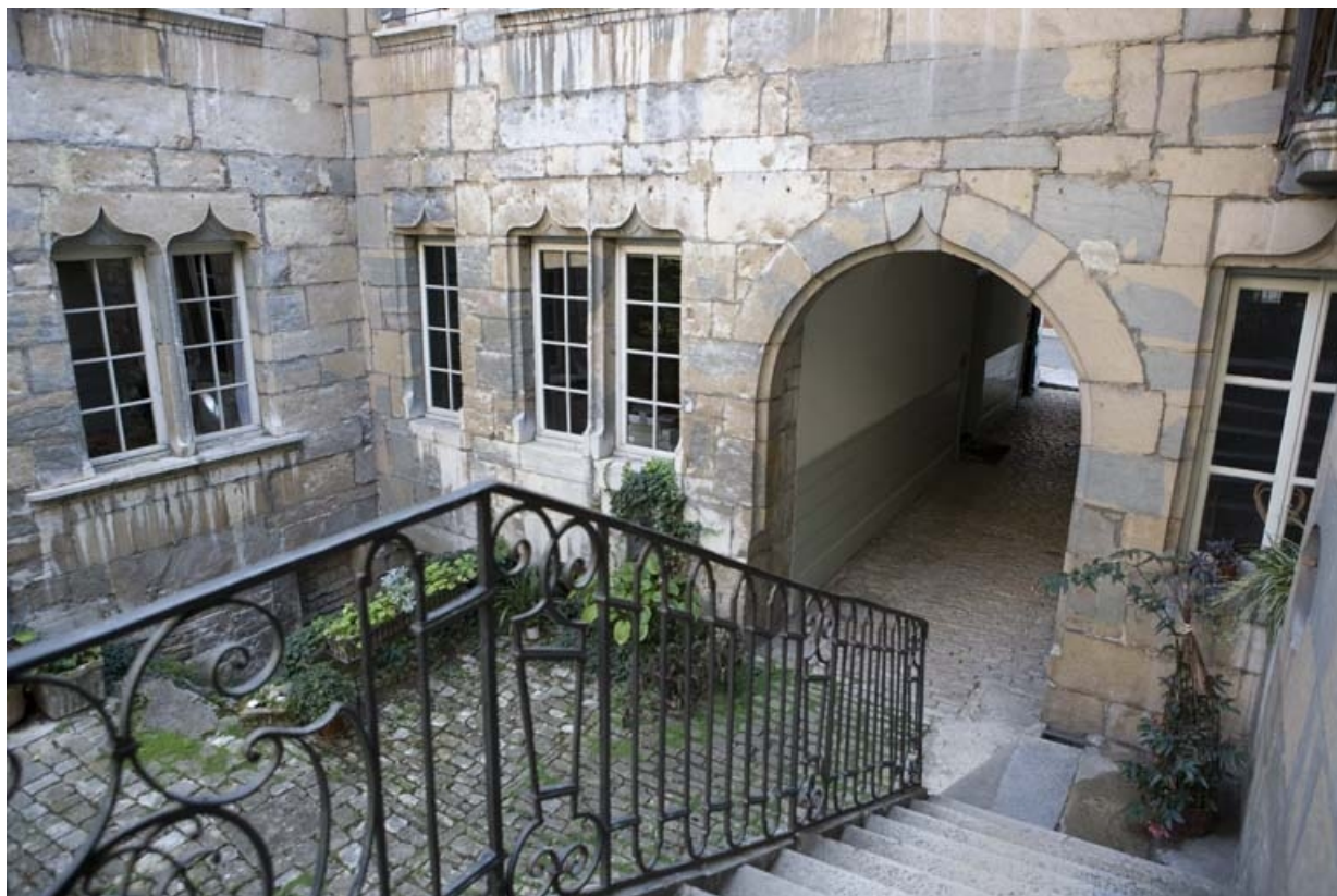
Détail du rez-de-chaussée sur cour depuis l'escalier.

25, Besançon, 36 rue Renan, lieudit : îlot Ronchaux