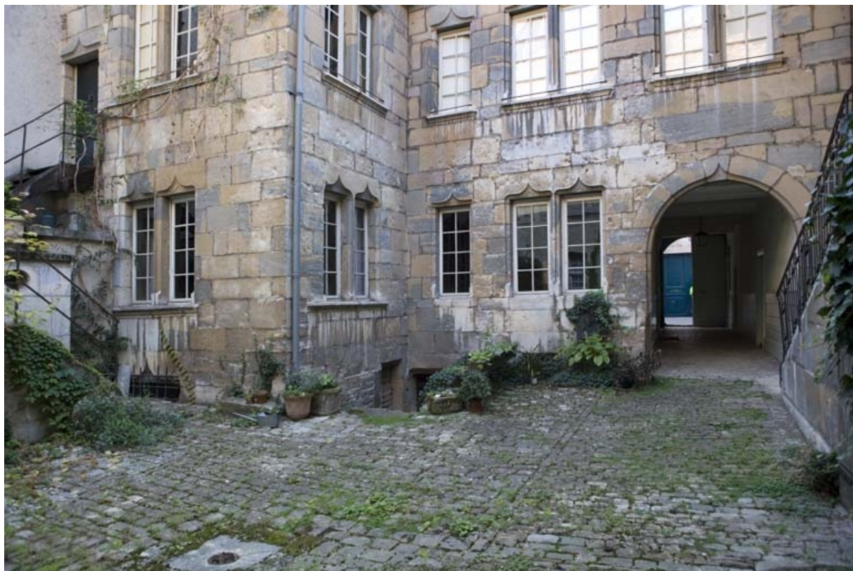
Rez-de-chaussée de la façade postérieure du logis, de trois quarts droit.

25, Besançon, 36 rue Renan, lieudit : îlot Ronchaux