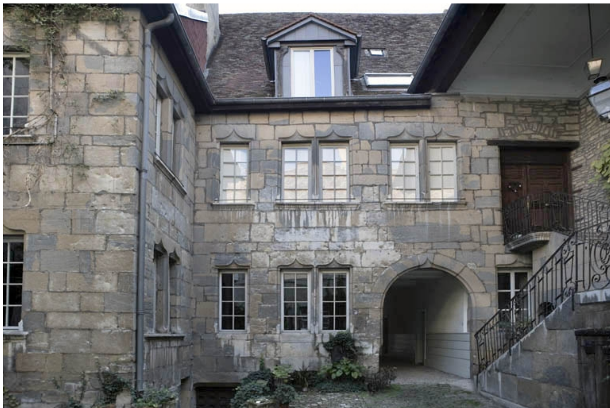
Façade postérieure du logis, de face.

25, Besançon, 36 rue Renan, lieudit : îlot Ronchaux