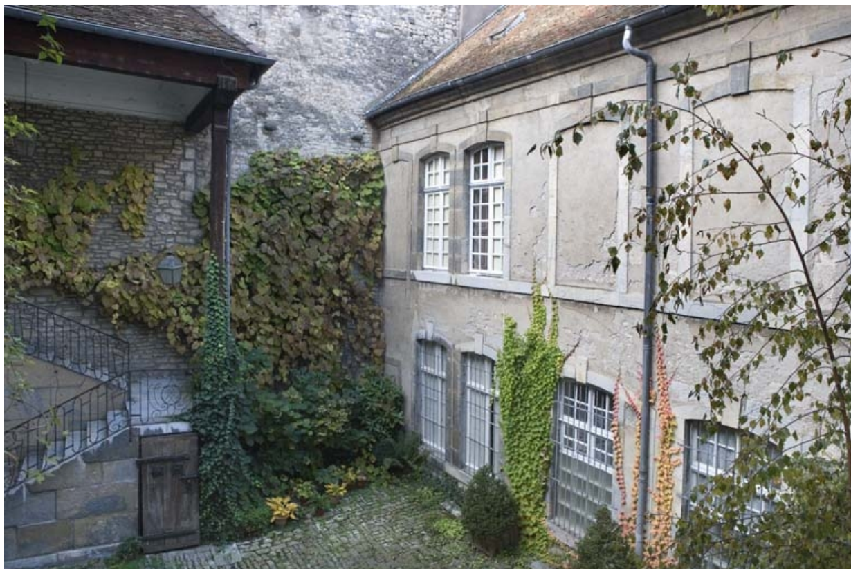
Détail du fond de la cour, de trois quarts droit.

25, Besançon, 36 rue Renan, lieudit : îlot Ronchaux