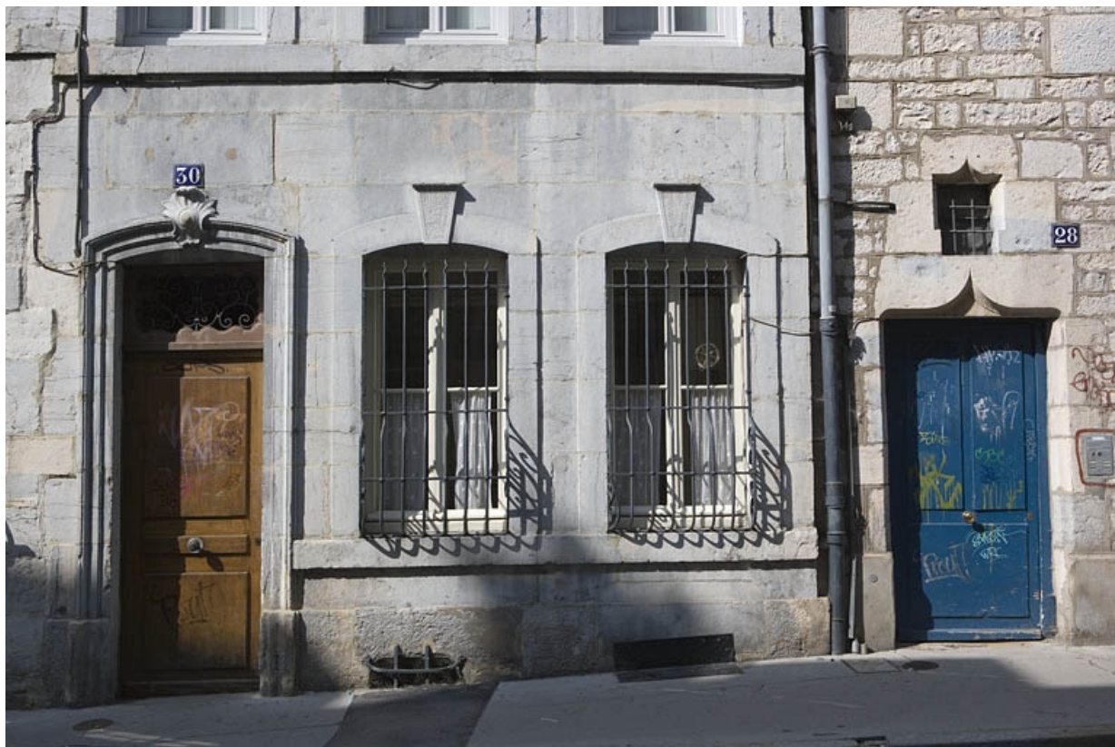
Détail du rez-de-chaussée de la façade sur rue, de face.

25, Besançon, 30 rue Renan, lieudit : îlot Ronchaux