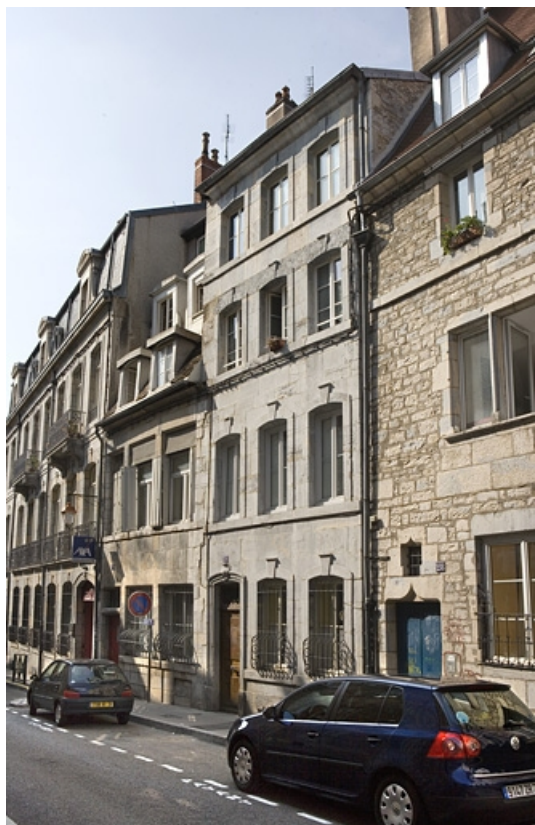
Vue d'ensemble de la façade sur rue, de trois quarts droit.

25, Besançon, 30 rue Renan, lieudit : îlot Ronchaux