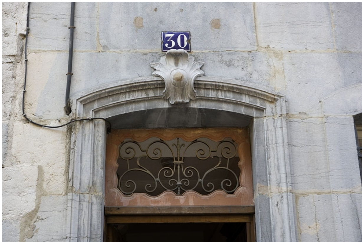
Façade sur rue : détail du dessus de porte du couloir d'entrée.

25, Besançon, 30 rue Renan, lieudit : îlot Ronchaux