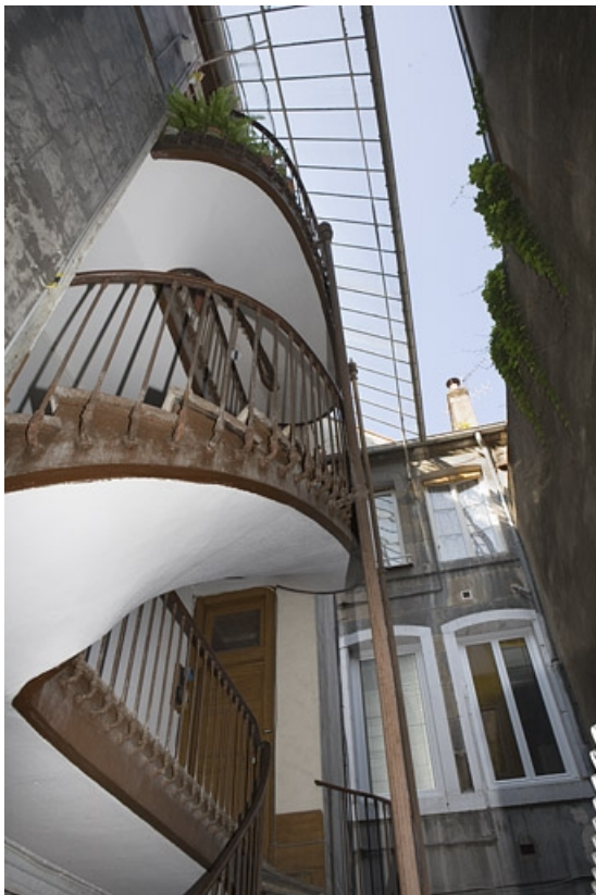
Vue d'ensemble de l'escalier à cage ouverte de la première cour.

25, Besançon, 30 rue Renan, lieudit : îlot Ronchaux