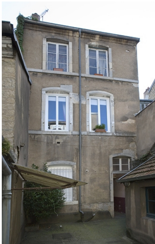
Vue d'ensemble de la façade postérieure du premier logis secondaire.

25, Besançon, 30 rue Renan, lieudit : îlot Ronchaux