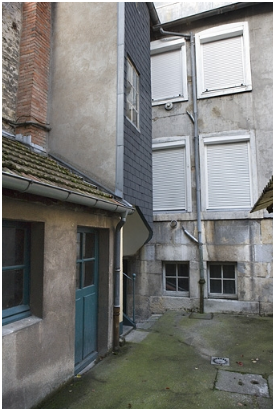
Vue d'ensemble de la façade antérieure du deuxième logis secondaire.

25, Besançon, 30 rue Renan, lieudit : îlot Ronchaux