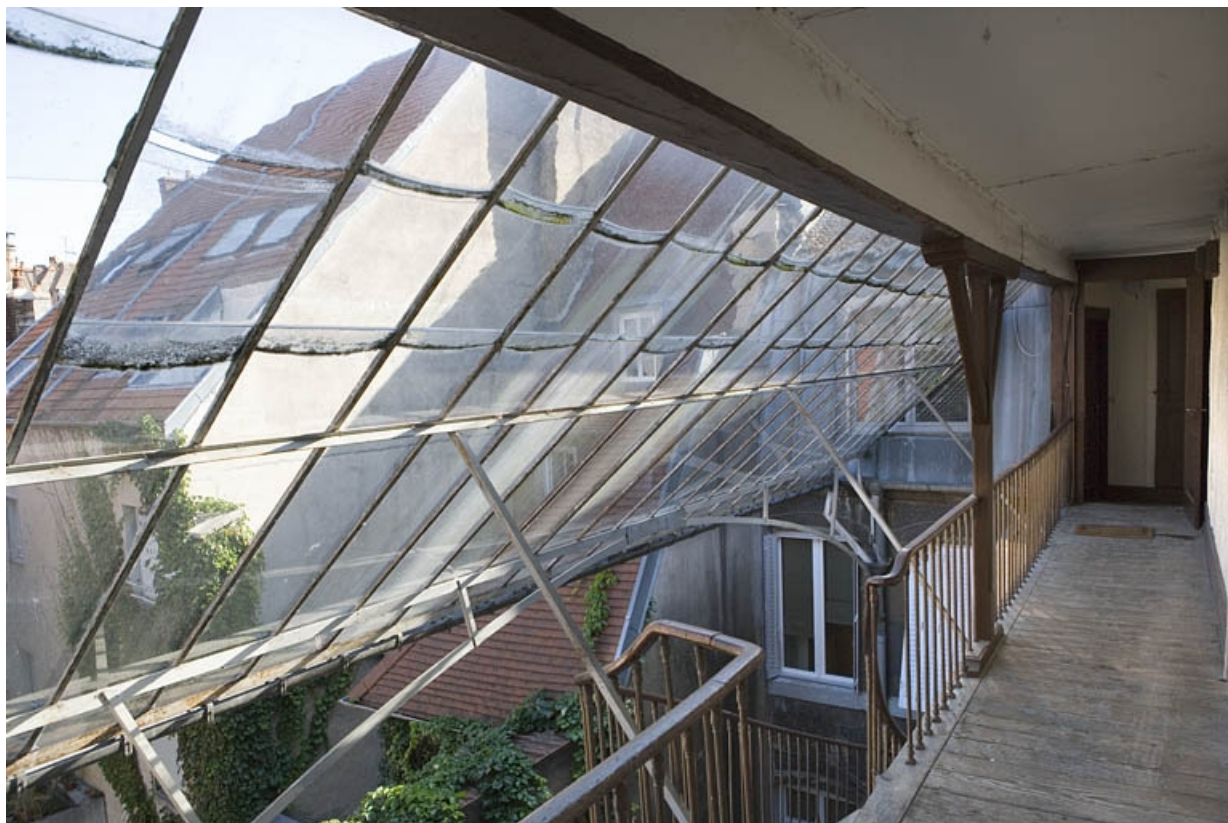
Détail de la verrière sur l'escalier à cage ouverte de la première cour.

25, Besançon, 30 rue Renan, lieudit : îlot Ronchaux