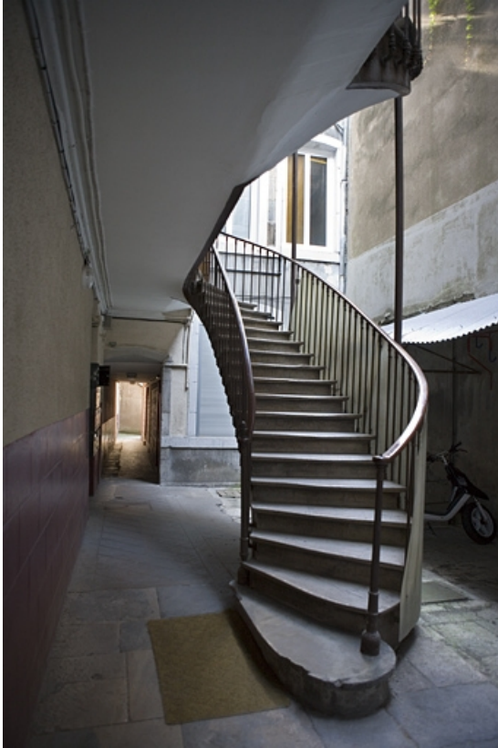
Détail de l'escalier à cage ouverte sur cour, depuis l'entrée de la première cour. 25, Besançon, 30 rue Renan, lieudit : îlot Ronchaux