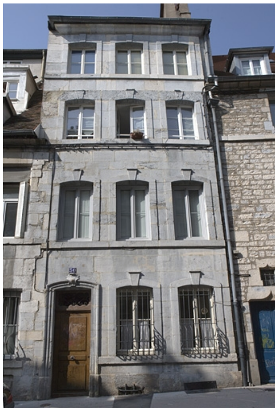
Vue d'ensemble de la façade sur rue, de face.

25, Besançon, 30 rue Renan, lieudit : îlot Ronchaux