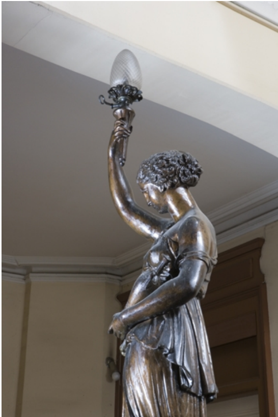
Détail du départ de l'escalier principal : statue vue à mi-corps, de profil.

25, Besançon, 34 rue Renan, lieudit : îlot Ronchaux