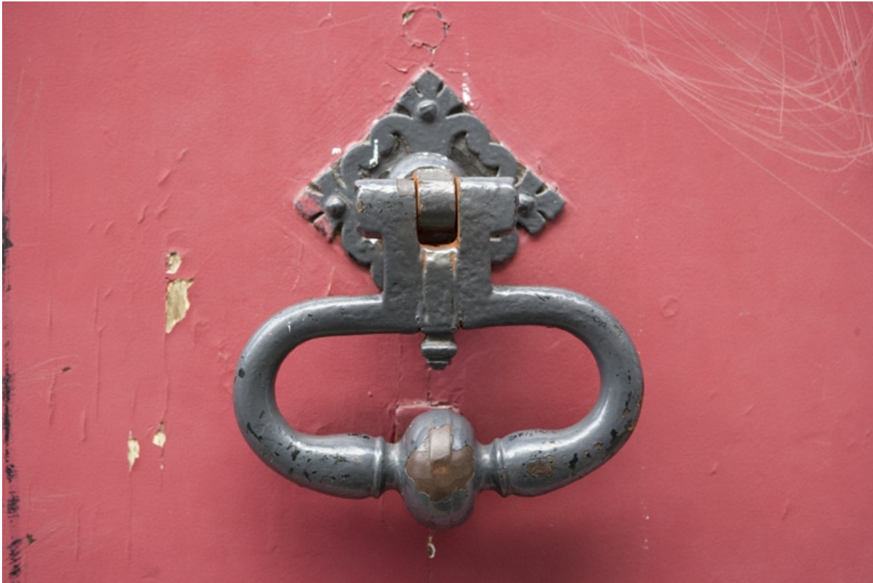
Portail d'entrée : détail du heurtor.

25, Besançon, 34 rue Renan, lieudit : îlot Ronchaux