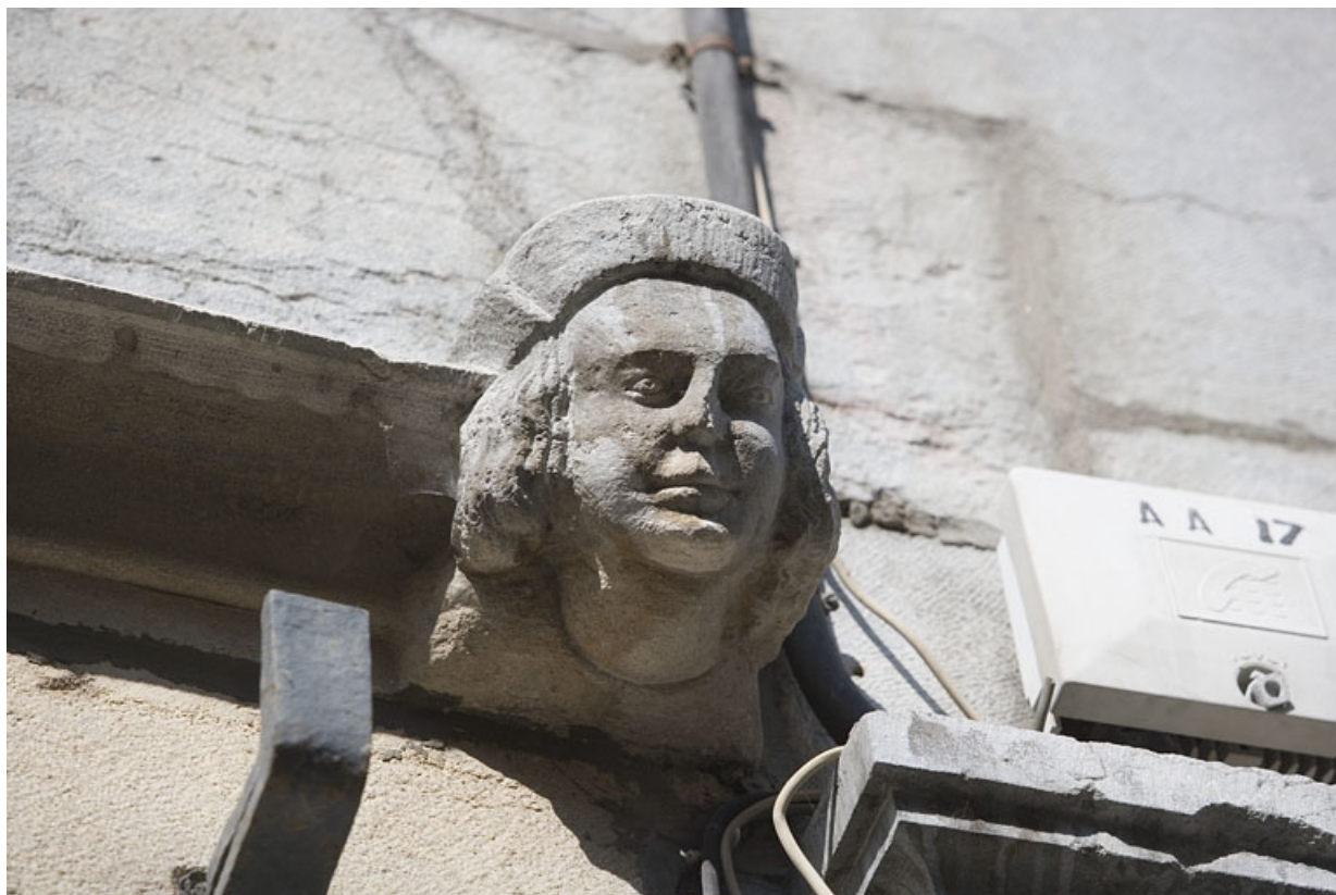
Façade sur rue : détail d'une tête d'homme à l'extrémité droite du bandeau d'appui.

25, Besançon, 20 rue Renan, lieudit : îlot Ronchaux