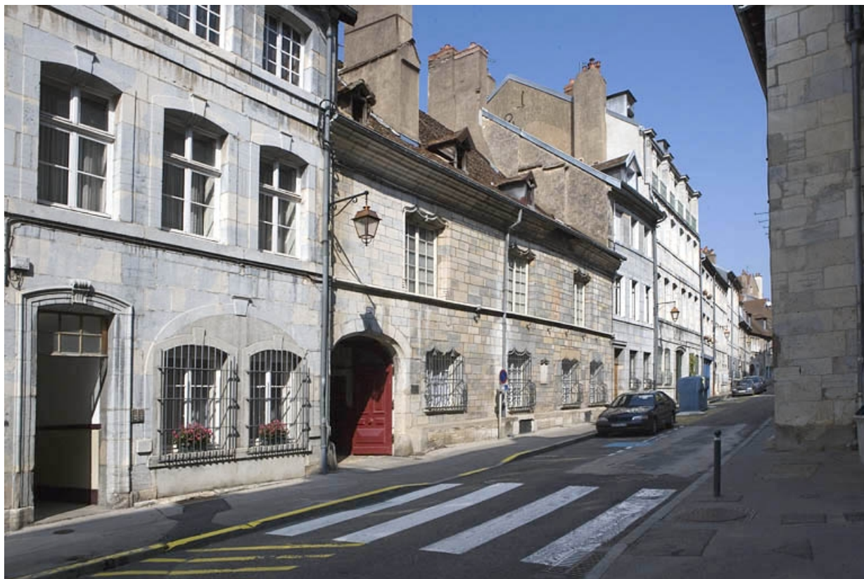
Vue d'ensemble dans l'alignement de la rue, de trois quarts gauche.

25, Besançon, 20 rue Renan, lieudit : îlot Ronchaux