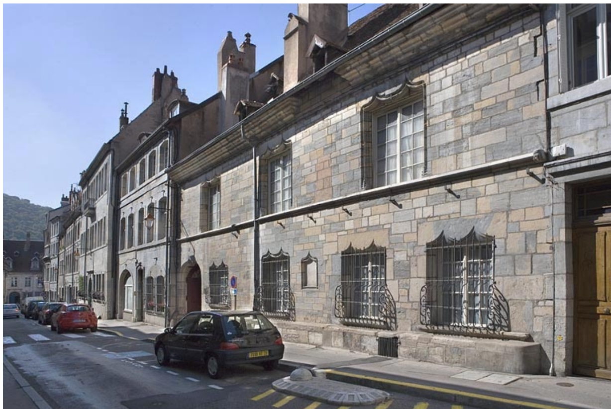
Vue d'ensemble de la façade sur rue, de trois quarts droit.

25, Besançon, 20 rue Renan, lieudit : îlot Ronchaux