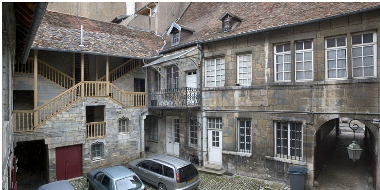
Vue d'ensemble de la façade postérieure du logis sur rue et de l'escalier à cage ouverte sur cour. 25, Besançon, 20 rue Renan, lieudit : îlot Ronchaux