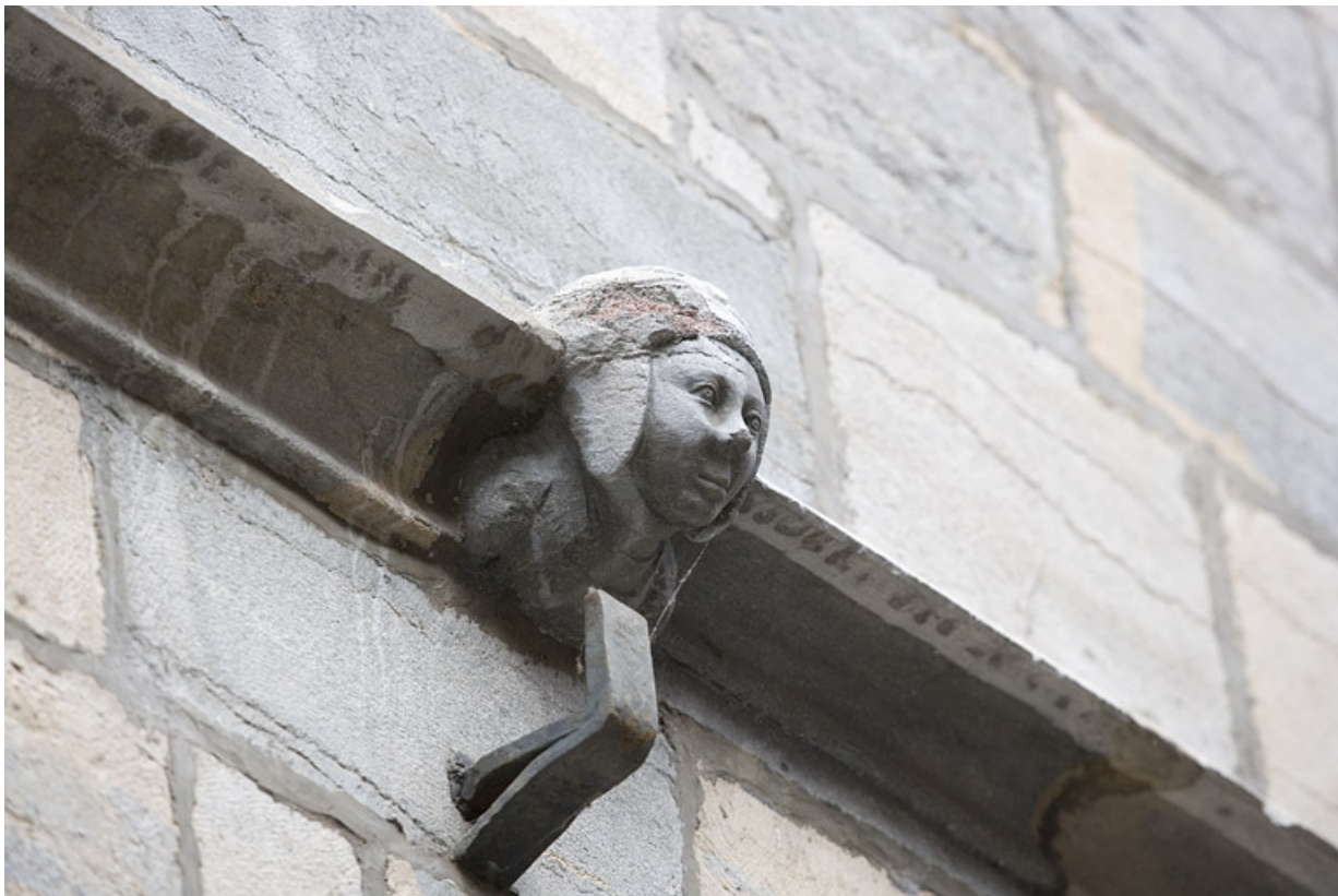
Façade sur rue : détail d'une tête de femme sur le bandeau d'appui, de trois quarts gauche.

25, Besançon, 20 rue Renan, lieudit : îlot Ronchaux