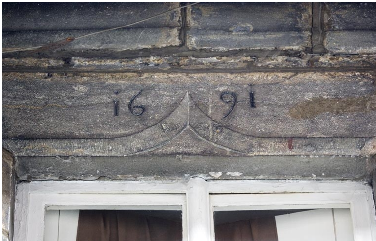
Logis secondaire : détail de la date 1691 sur une fenêtre du premier étage.

25, Besançon, 20 rue Renan, lieudit : îlot Ronchaux