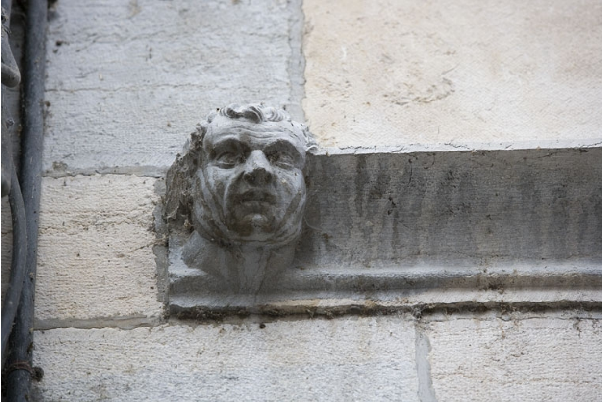
Façade sur rue : détail d'une tête d'homme à l'extrémité gauche du bandeau d'appui.

25, Besançon, 20 rue Renan, lieudit : îlot Ronchaux