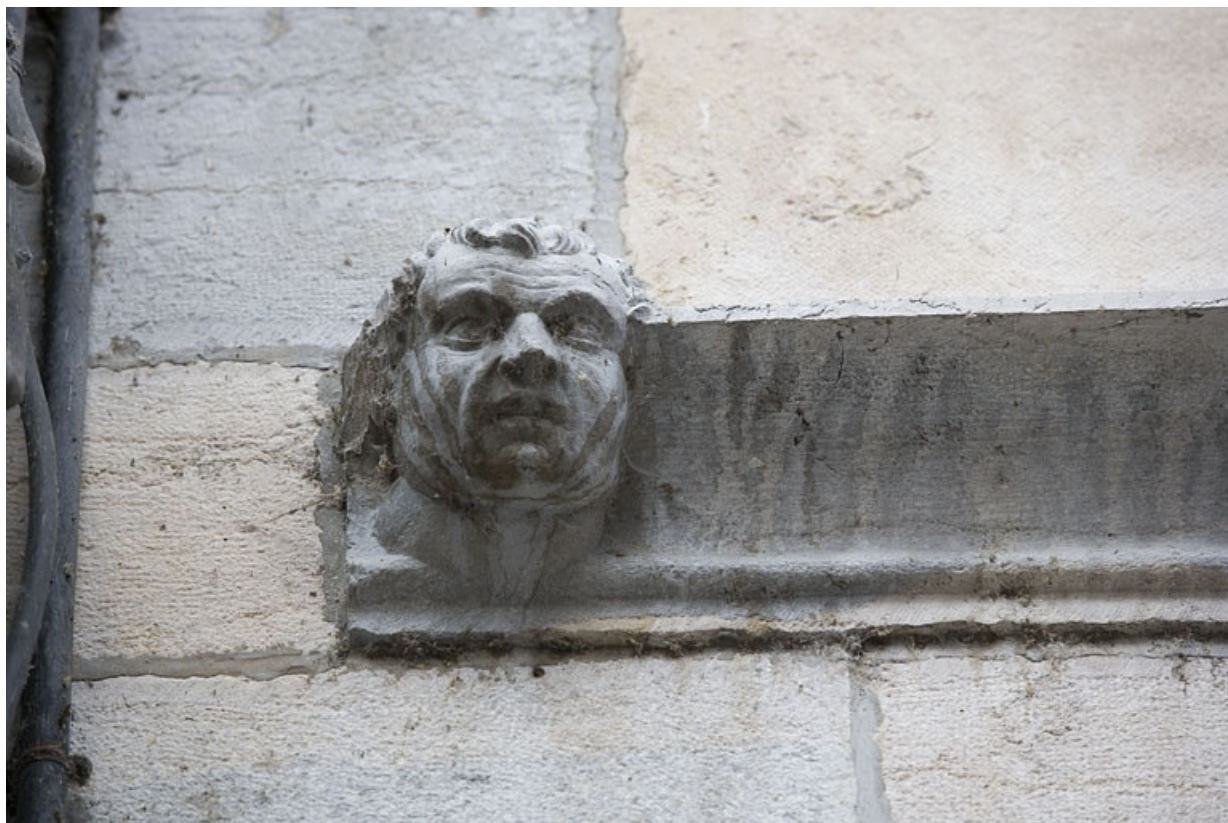
Façade sur rue : détail d'une tête d'homme à l'extrémité gauche du bandeau d'appui.

25, Besançon, 20 rue Renan, lieudit : îlot Ronchaux