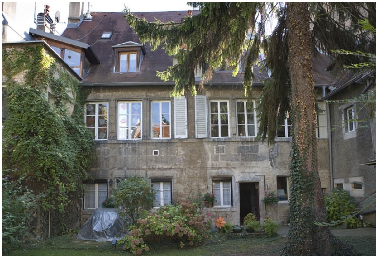
Vue d'ensemble de la façade postérieure du logis secondaire.

25, Besançon, 20 rue Renan, lieudit : îlot Ronchaux