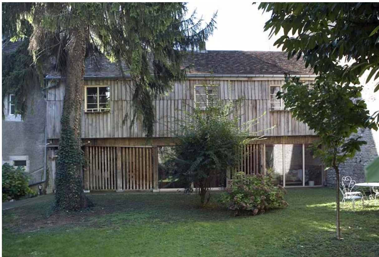
Vue d'ensemble du bûcher, de face.

25, Besançon, 20 rue Renan, lieudit : îlot Ronchaux