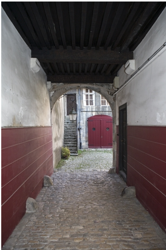
Passage cocher, depuis l'entrée.

25, Besançon, 20 rue Renan, lieudit : îlot Ronchaux