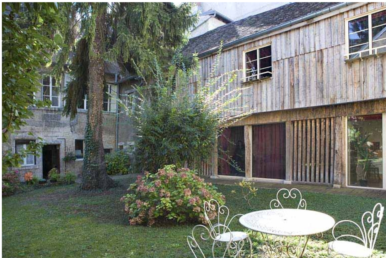
Vue d'ensemble depuis le fond du jardin.

25, Besançon, 20 rue Renan, lieudit : îlot Ronchaux