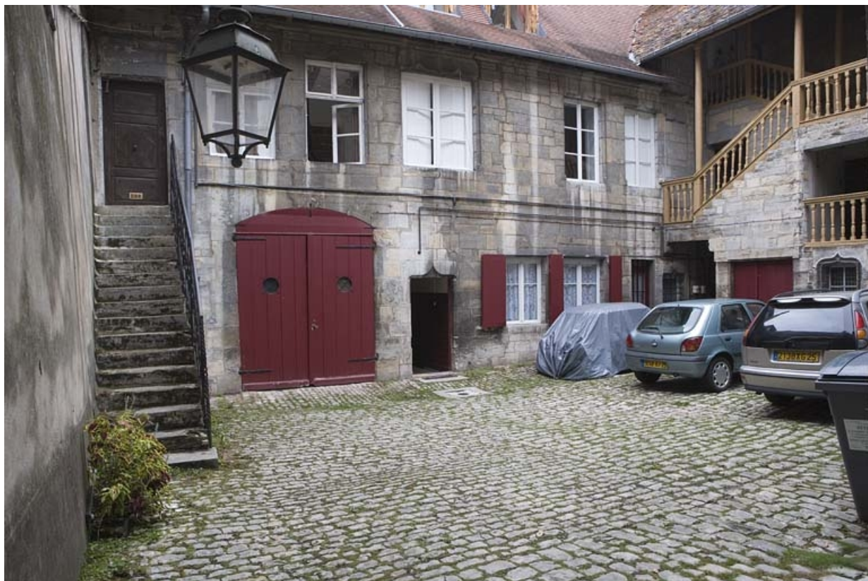
Vue d'ensemble du logis secondaire sur cour.

25, Besançon, 20 rue Renan, lieudit : îlot Ronchaux