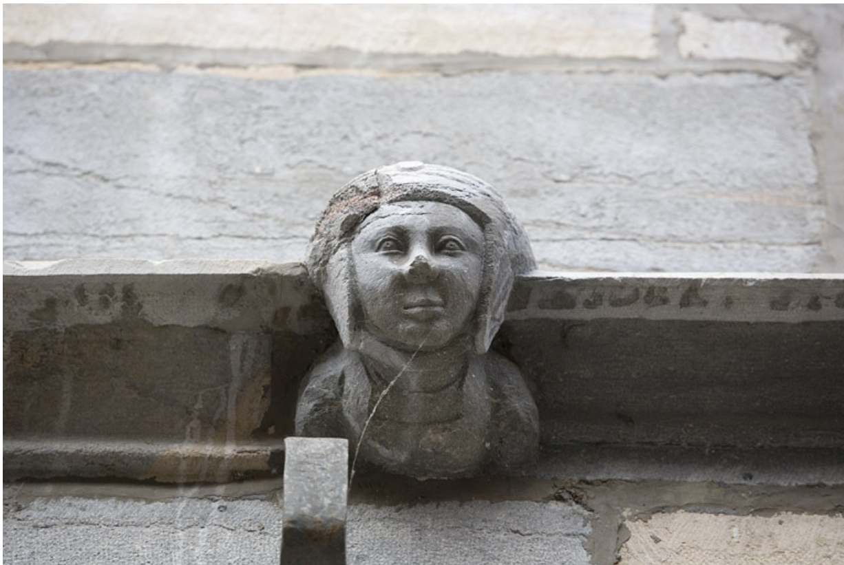
Façade sur rue : détail d'une tête de femme sur le bandeau d'appui, de face.

25, Besançon, 20 rue Renan, lieudit : îlot Ronchaux