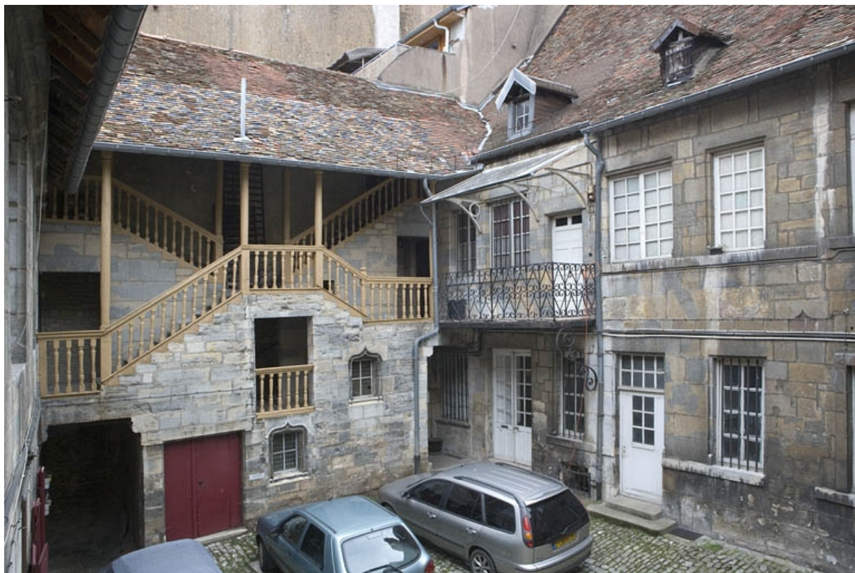
Vue d'ensemble de l'escalier à cage ouverte.

25, Besançon, 20 rue Renan, lieudit : îlot Ronchaux