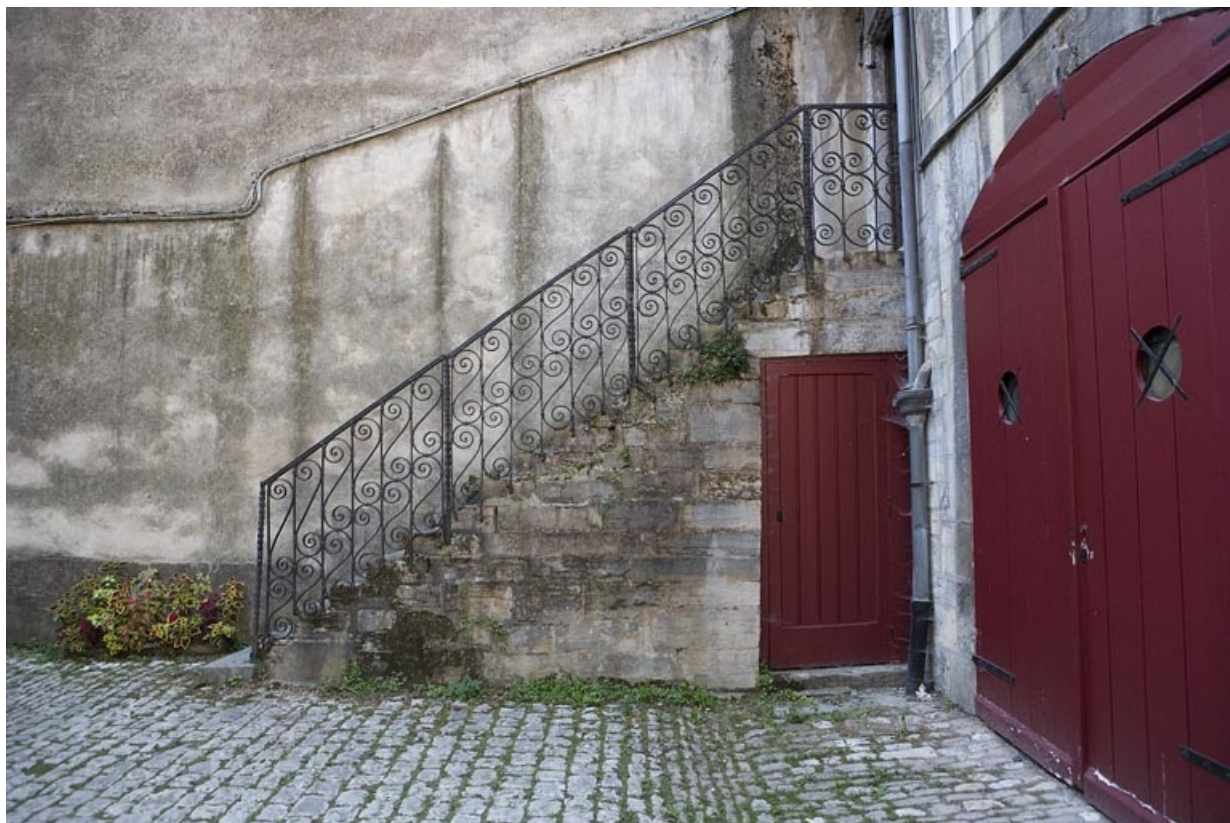
Vue d'ensemble de l'escalier extérieur du logis secondaire.

25, Besançon, 20 rue Renan, lieudit : îlot Ronchaux