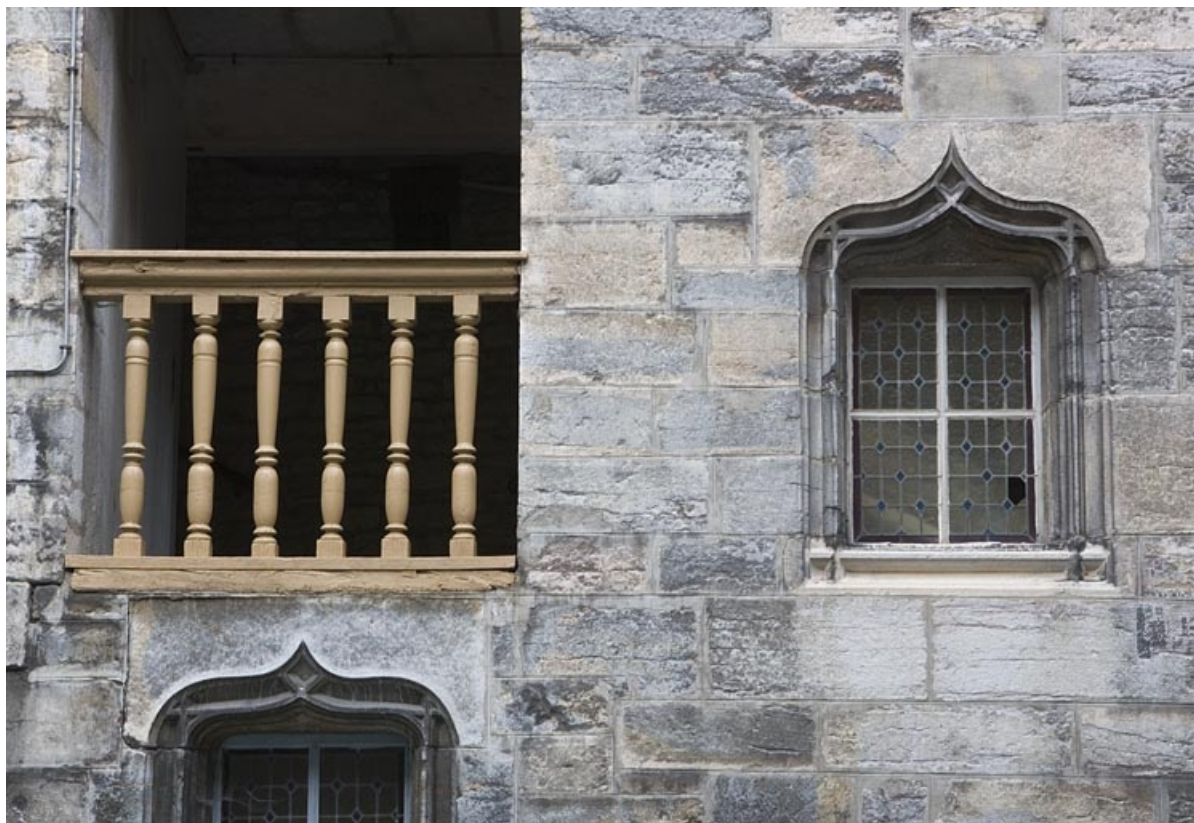
Détail d'une partie du soubassement de l'escalier à cage ouverte.

25, Besançon, 20 rue Renan, lieudit : îlot Ronchaux