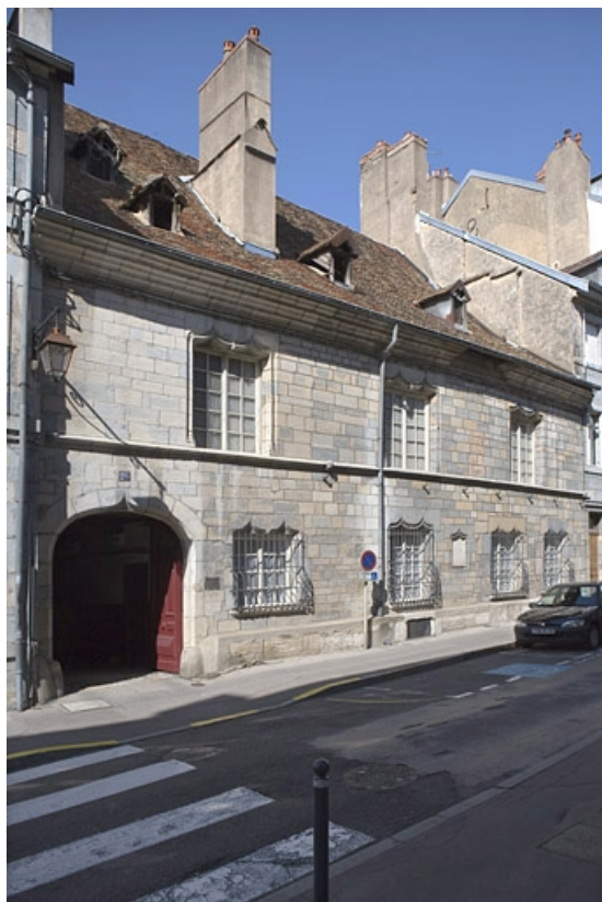
Vue d'ensemble de la façade sur rue, de trois quarts gauche.

25, Besançon, 20 rue Renan, lieudit : îlot Ronchaux