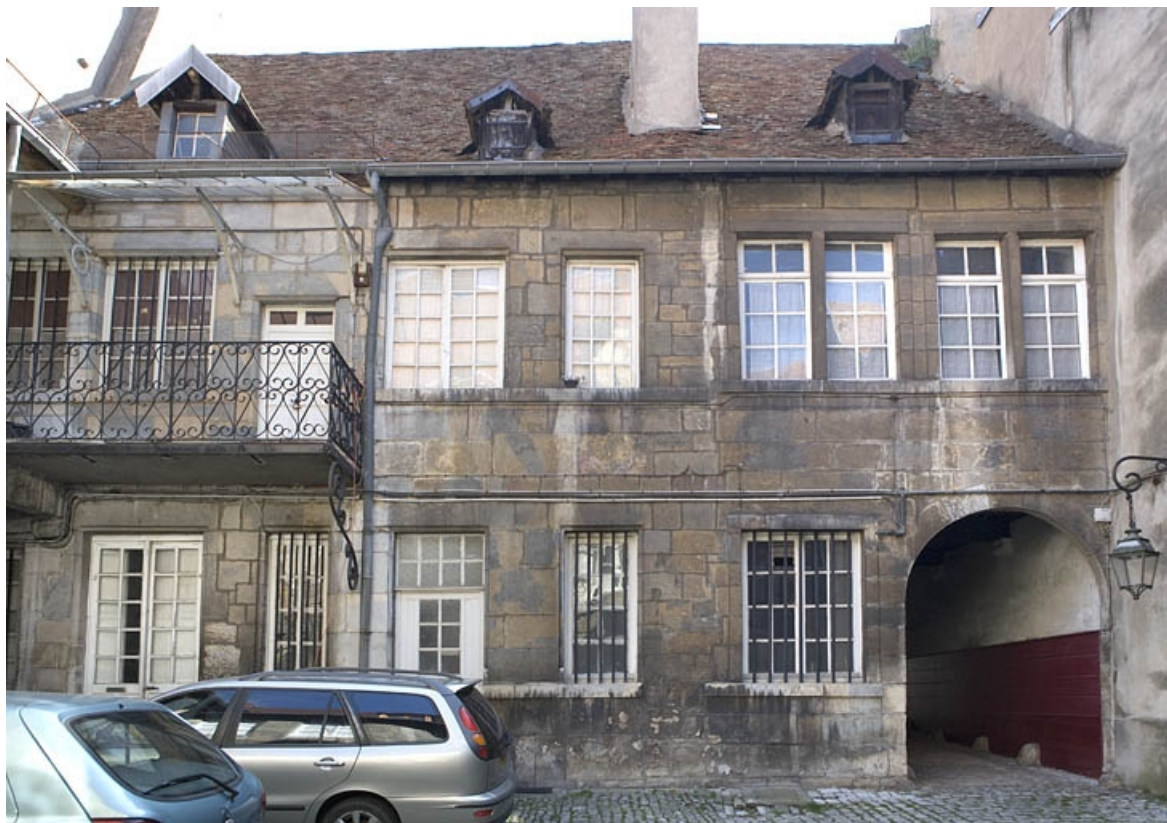
Vue d'ensemble de la façade postérieure du logis sur rue.

25, Besançon, 20 rue Renan, lieudit : îlot Ronchaux