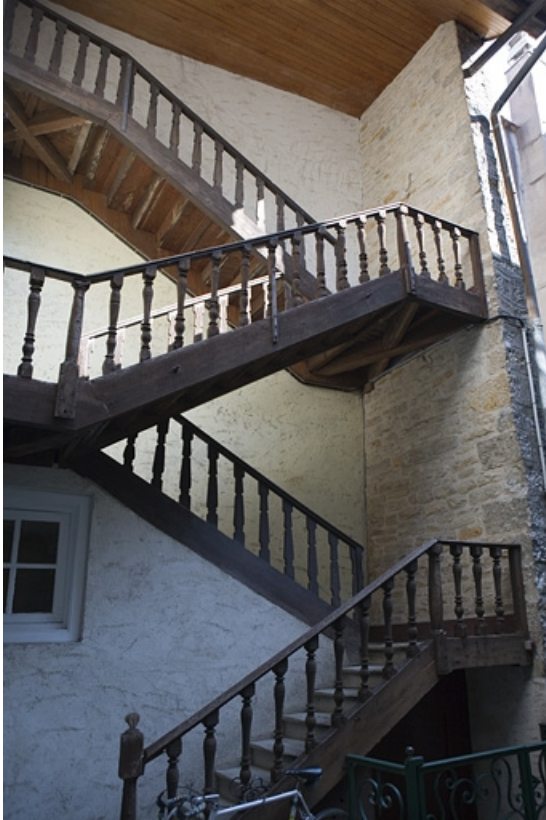
Détail de l'escalier à cage ouverte du logis secondaire. 25, Besançon, 22 rue Renan, lieudit : îlot Ronchaux