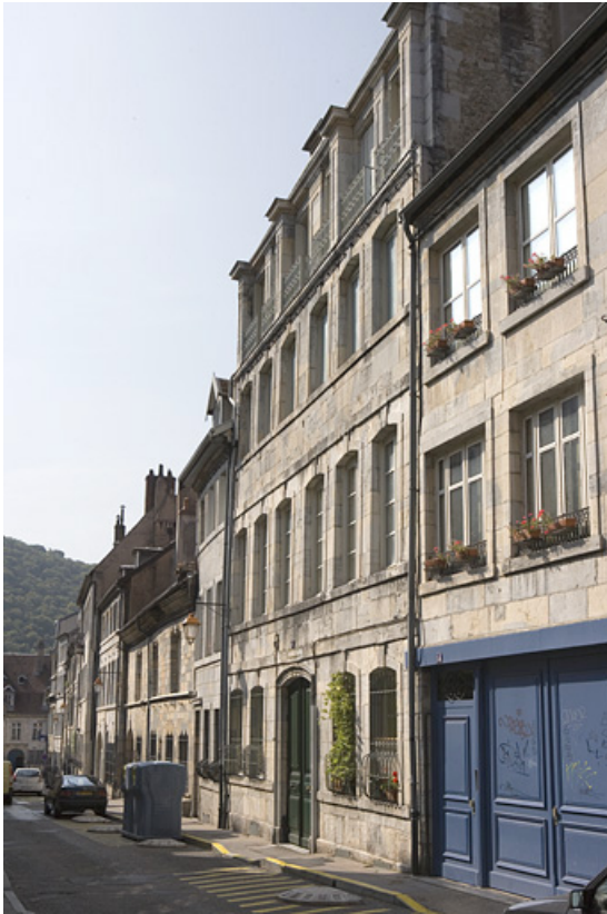
Vue d'ensemble de la façade principale, de trois quarts droit.

25, Besançon, 16 rue Renan, lieudit : îlot Ronchaux