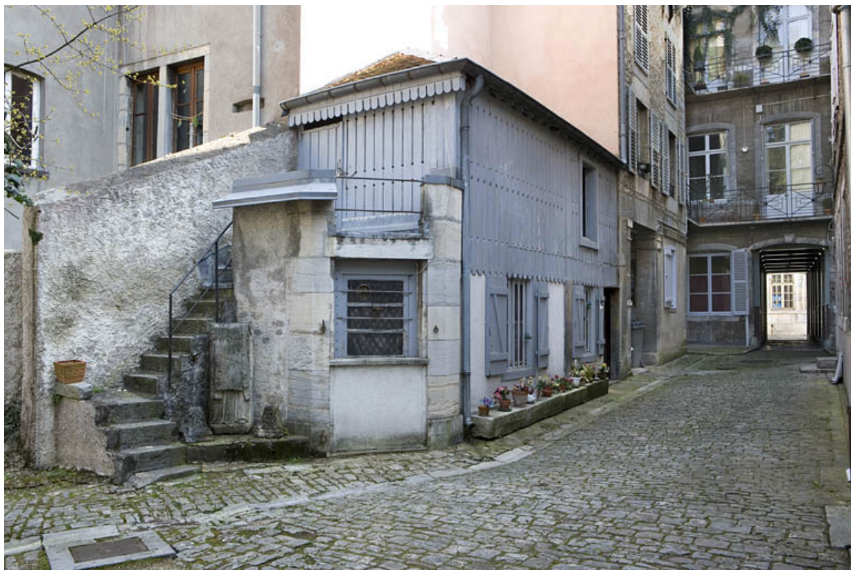
Vue d'ensemble du séchoir à linge avec logement au rez-de-chaussée.

25, Besançon, 16 rue Renan, lieudit : îlot Ronchaux