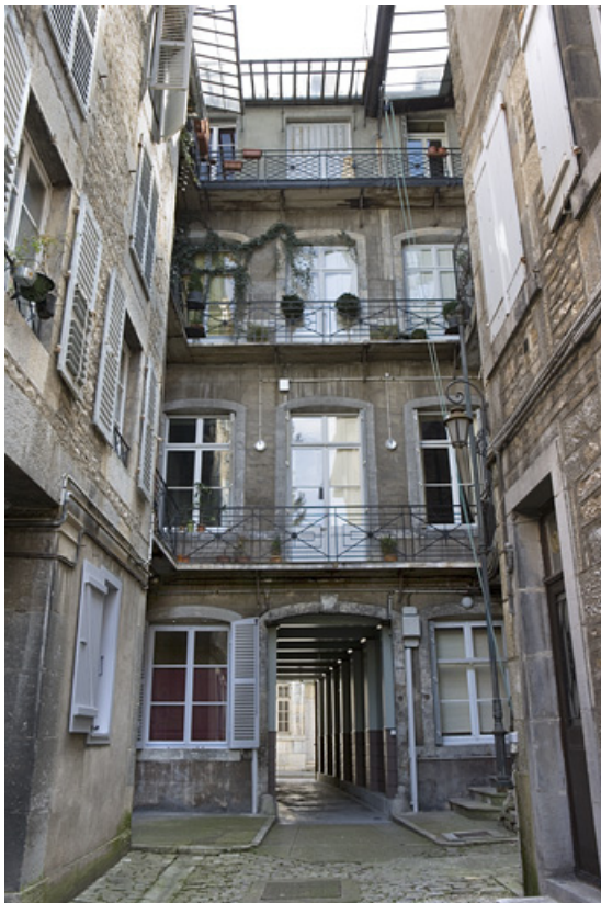
Vue d'ensemble de la façade postérieure du logis principal.

25, Besançon, 16 rue Renan, lieudit : îlot Ronchaux