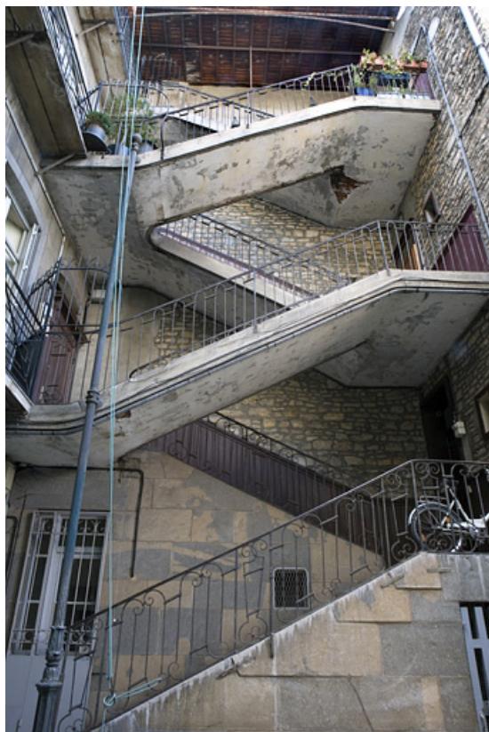
Vue d'ensemble de l'escalier à cage ouverte sur cour.

25, Besançon, 16 rue Renan, lieudit : îlot Ronchaux