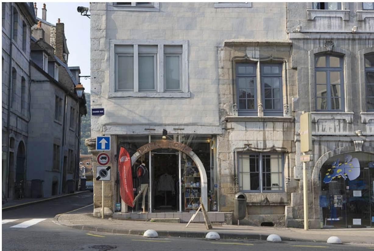
Détail du rez-de-chaussée et du premier étage de la façade sur la Grande Rue. 25, Besançon, 2 rue Renan, lieudit : îlot Ronchaux