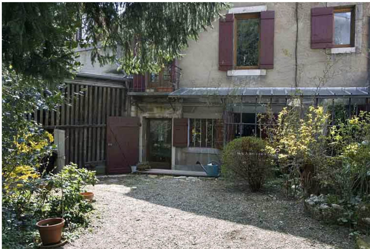
Détail du rez-de-chaussée du logis secondaire situé au fond de la parcelle.

25, Besançon, 2 rue Renan, lieudit : îlot Ronchaux