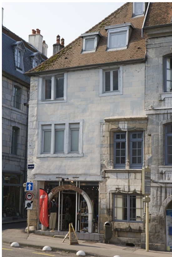
Vue d'ensemble de la façade sur la Grande Rue, de trois quarts droite.

25, Besançon, 2 rue Renan, lieudit : îlot Ronchaux