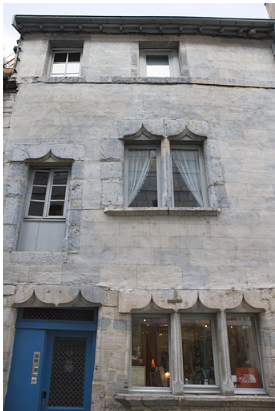
Vue d'ensemble de la façade sur la rue Renan, de face.

25, Besançon, 2 rue Renan, lieudit : îlot Ronchaux