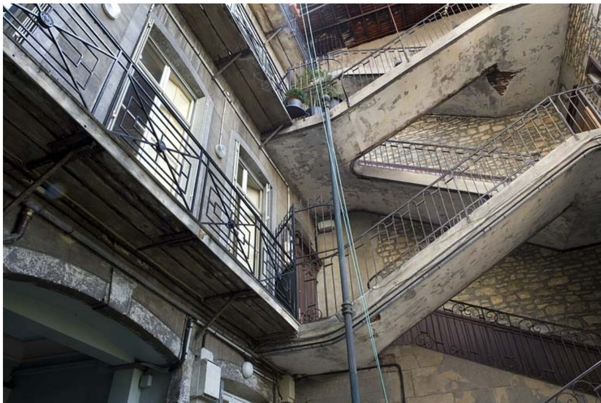
Détail de l'escalier à cage ouverte et d'une coursière sur la façade postérieure du logis principal.

25, Besançon, 2 rue Renan, lieudit : îlot Ronchaux