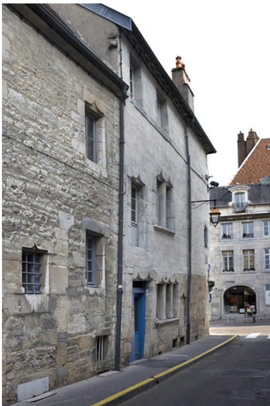
Vue d'ensemble de la façade sur la rue Renan, de trois quarts gauche.

25, Besançon, 2 rue Renan, lieudit : îlot Ronchaux