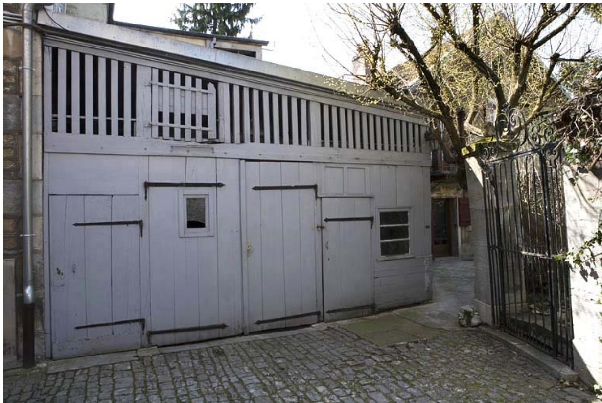
Vue d'ensemble des bûchers au fond de la cour.

25, Besançon, 2 rue Renan, lieudit : îlot Ronchaux