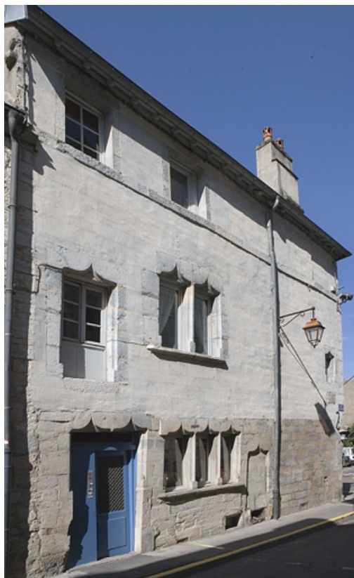
Vue d'ensemble de façade sur la rue Renan, de trois quarts gauche.

25, Besançon, 2 rue Renan, lieudit : îlot Ronchaux