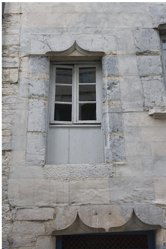
Rue Renan, détail d'une ancienne porte transformée en fenêtre au premier étage.

25, Besançon, 2 rue Renan, lieudit : îlot Ronchaux