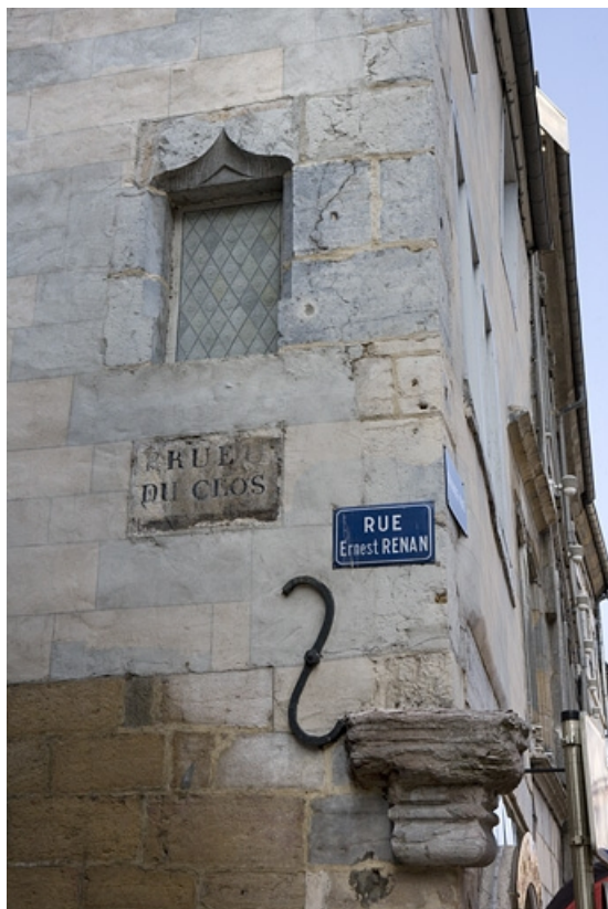
Détail de l'angle avec la mention "rue du Clos".

25, Besançon, 2 rue Renan, lieudit : îlot Ronchaux