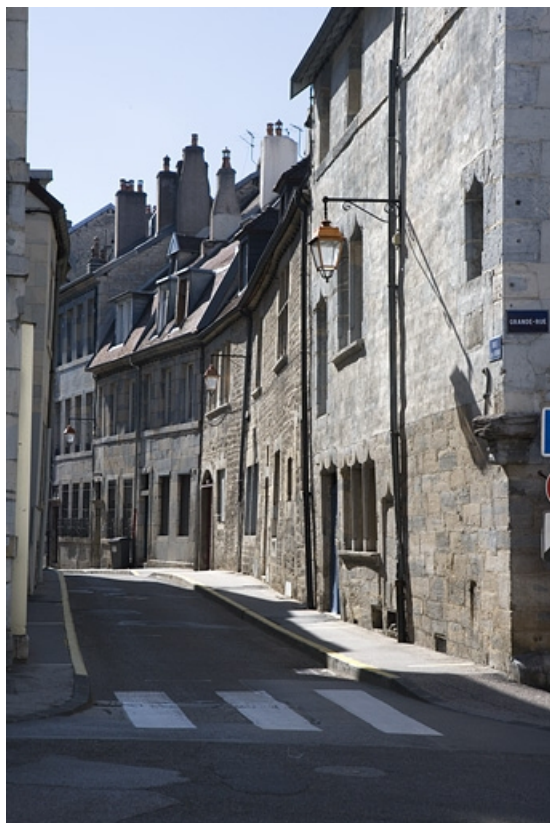
Vue d'ensemble de façade sur la rue Renan, de trois quarts droit.

25, Besançon, 2 rue Renan, lieudit : îlot Ronchaux