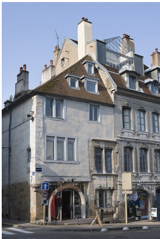
Vue d'ensemble de la façade sur la Grande Rue.

25, Besançon, 2 rue Renan, lieudit : îlot Ronchaux