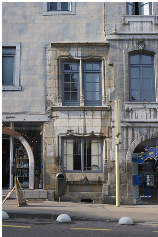
Détail de la partie droite en pierre de la façade sur la Grande Rue.

25, Besançon, 2 rue Renan, lieudit : îlot Ronchaux