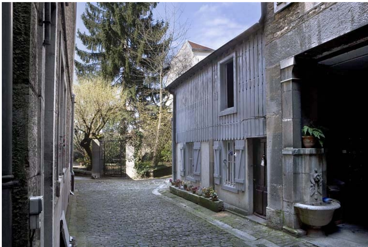
Vue d'ensemble du séchoir avec habitation en rez-de-chaussée, de trois quarts droit.

25, Besançon, 2 rue Renan, lieudit : îlot Ronchaux