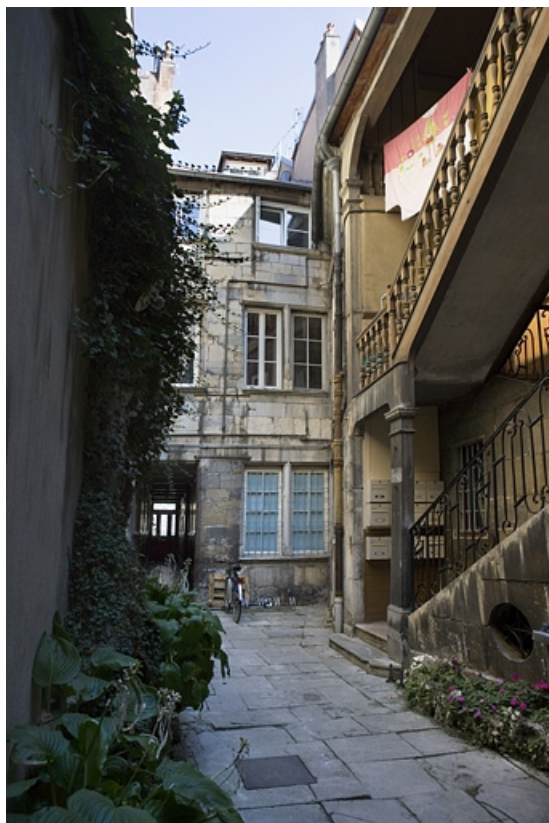
Vue d'ensemble de la façade postérieure du logis principal, depuis le fond de la cour.

25, Besançon Grande Rue 136, lieudit : îlot Ronchaux