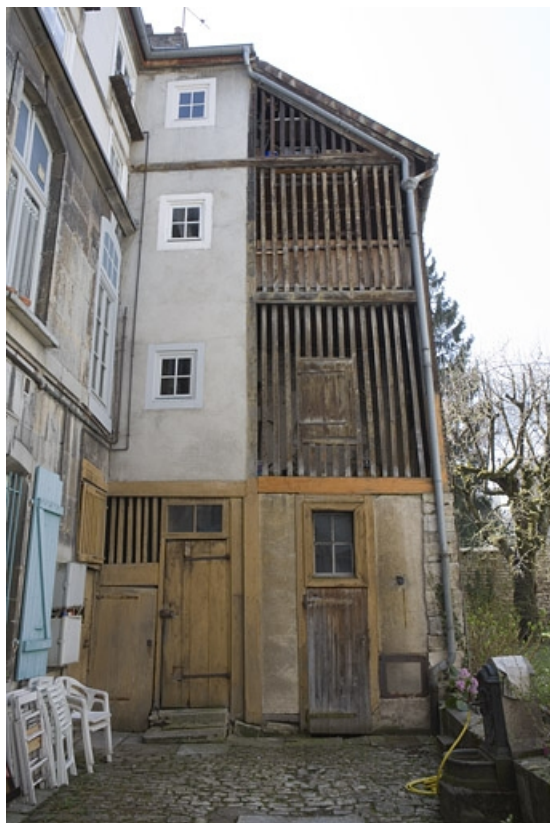
Détail de l'aile des bûchers sur jardin.

25, Besançon Grande Rue 136, lieudit : îlot Ronchaux