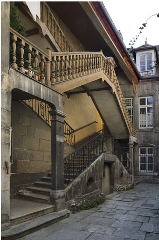
Vue d'ensemble de l'escalier à cage ouverte sur cour, de trois quarts gauche.

25, Besançon Grande Rue 136, lieudit : îlot Ronchaux