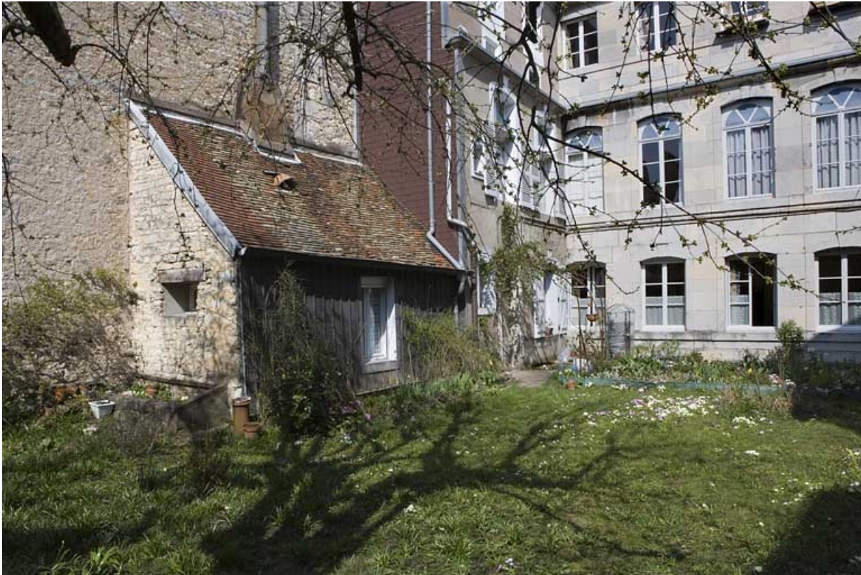
Détail de l'édicule adossé (buanderie ?) contre le mur droit du jardin.

25, Besançon Grande Rue 136, lieudit : îlot Ronchaux