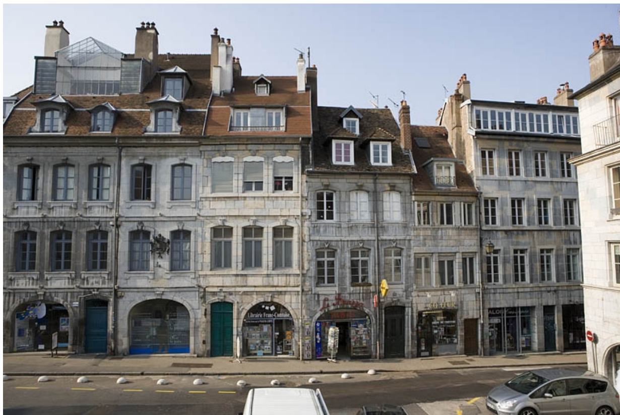
Vue d'ensemble dans l'alignement de la rue, depuis le fond de la place Victor Hugo.

25, Besançon Grande Rue 136, lieudit : îlot Ronchaux