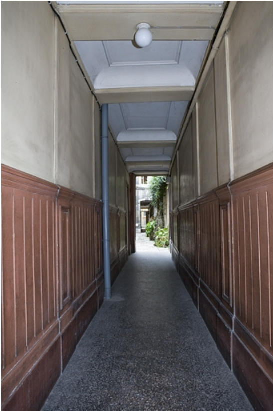
Vue d'ensemble du couloir d'entrée.

25, Besançon Grande Rue 136, lieudit : îlot Ronchaux