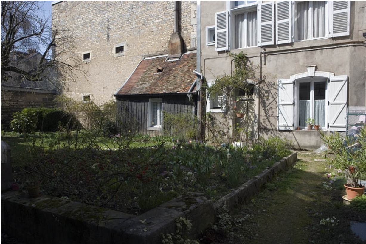
Vue d'une partie du jardin depuis l'entrée.

25, Besançon Grande Rue 136, lieudit : îlot Ronchaux