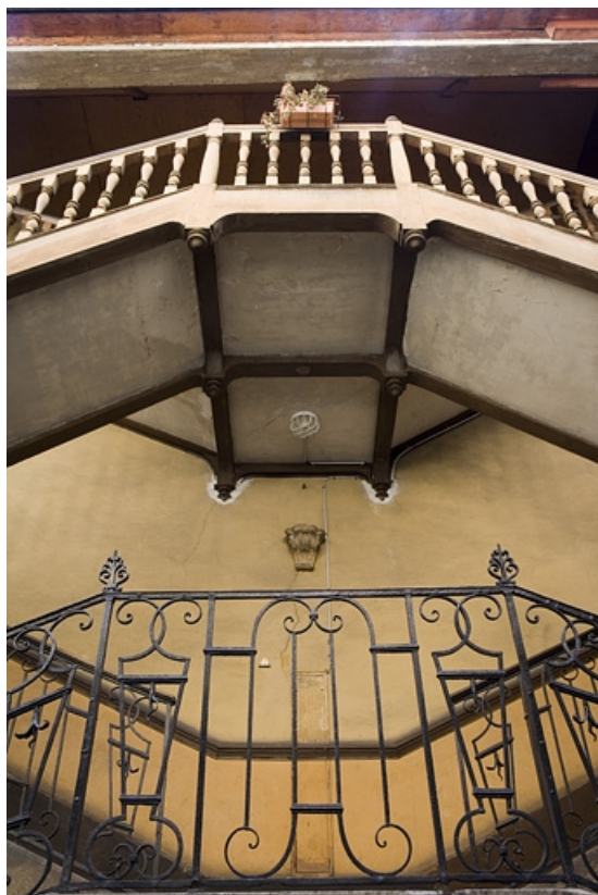
Détail de la partie centrale de l'escalier à cage ouverte sur cour, de face.

25, Besançon Grande Rue 136, lieudit : îlot Ronchaux