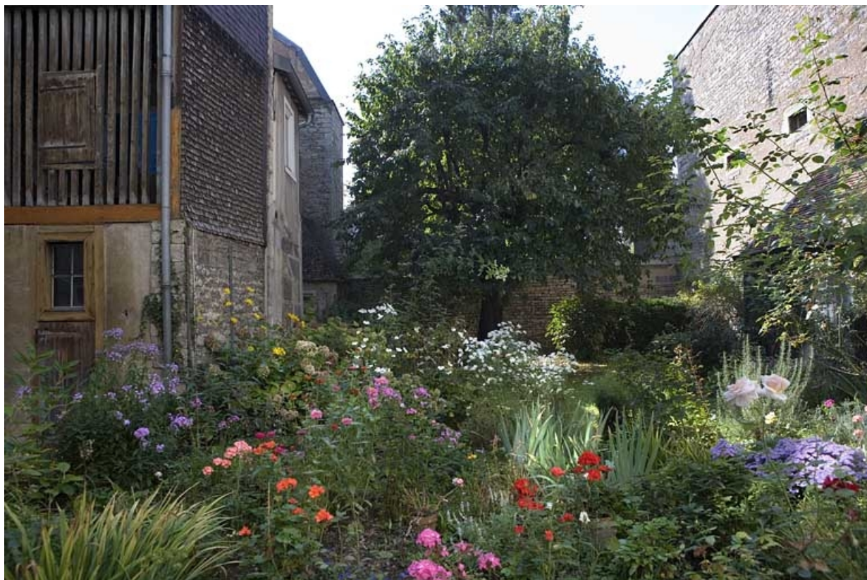
Vue du jardin, de face.

25, Besançon Grande Rue 136, lieudit : îlot Ronchaux