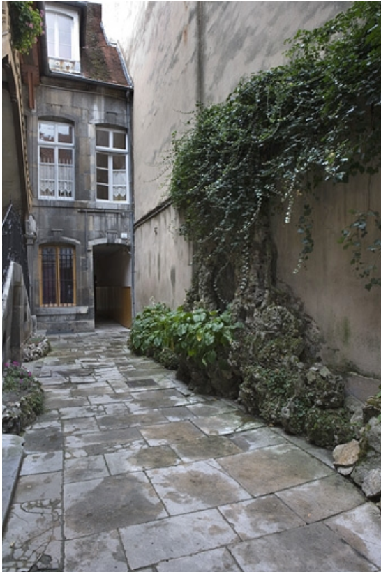
Façade antérieure du logis secondaire sur cour.

25, Besançon Grande Rue 136, lieudit : îlot Ronchaux