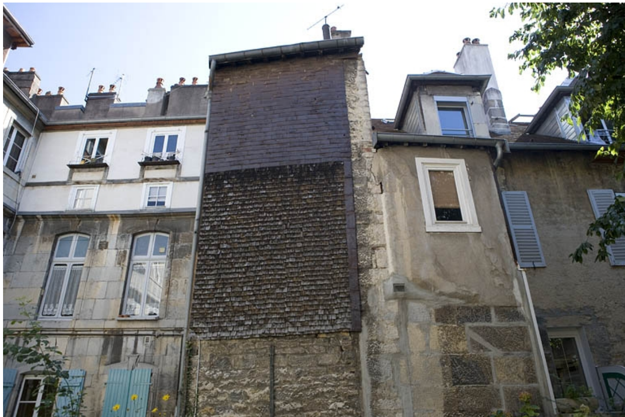
Détail de la façade postérieure de l'aile des bûchers sur jardin.

25, Besançon Grande Rue 136, lieudit : îlot Ronchaux