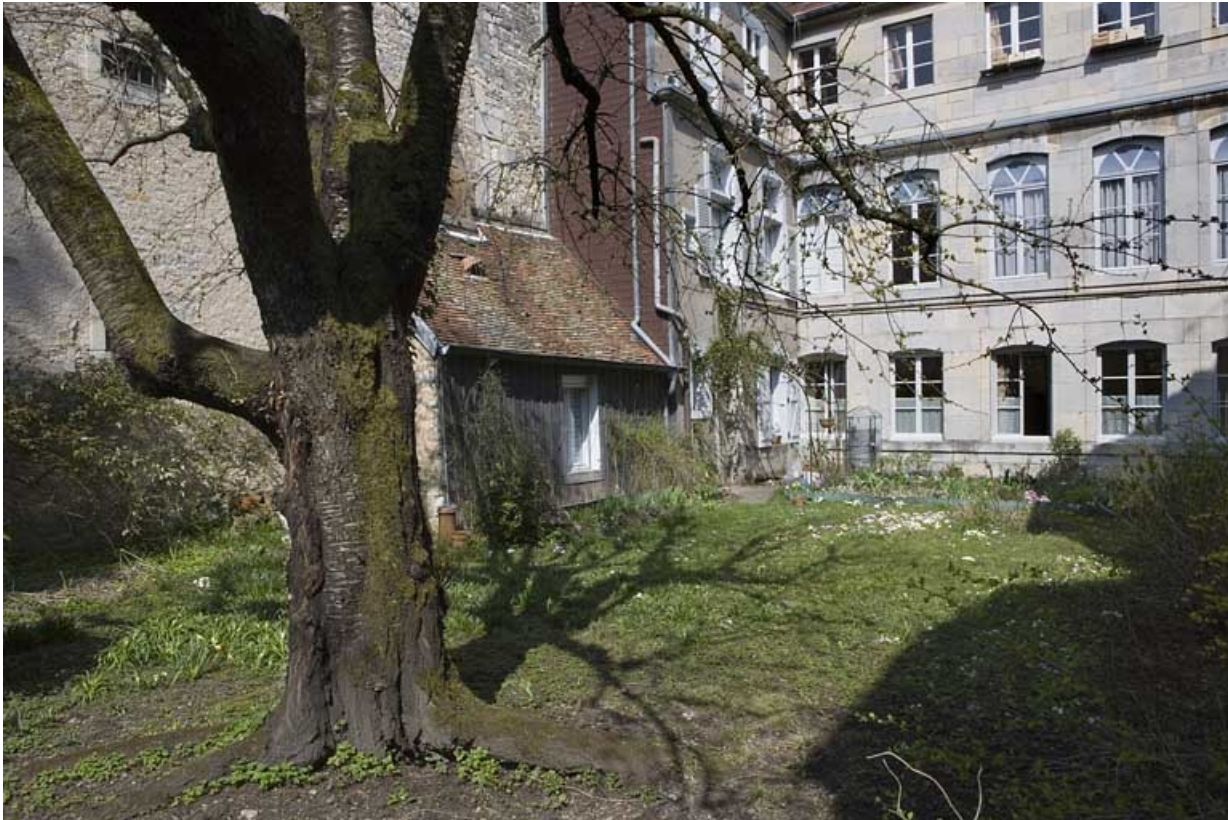
Vue partielle de la façade postérieure du logis secondaire depuis le fond du jardin.

25, Besançon Grande Rue 136, lieudit : îlot Ronchaux