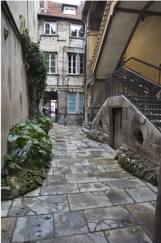
Façade postérieure du logis principal sur cour.

25, Besançon Grande Rue 136, lieudit : îlot Ronchaux