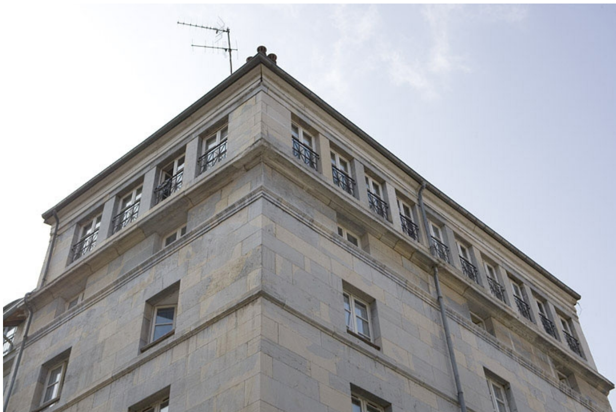
Vue d'ensemble de l'étage de surélévation de l'immeuble d'angle.

25, Besançon Grande Rue 132, 130, 128, lieudit : îlot Ronchaux