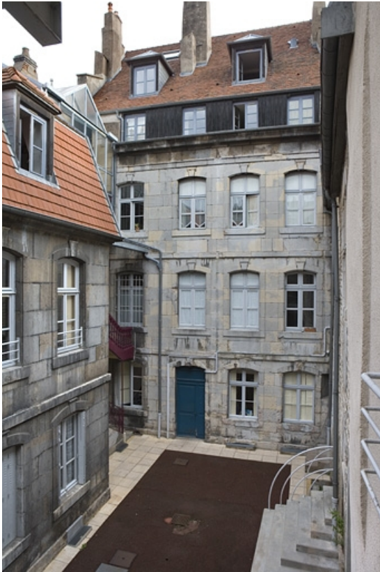
Vue d'ensemble de la cour depuis le fond.

25, Besançon Grande Rue 140, lieudit : îlot Ronchaux