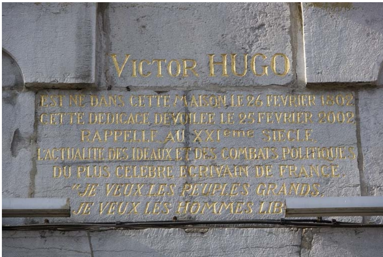
Façade sur rue : détail de l'inscription sous la plaque commémorative dédiée à Victor Hugo.

25, Besançon Grande Rue 140, lieudit : îlot Ronchaux