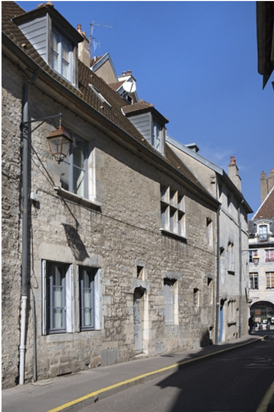
Façade latérale gauche, vue partielle.

25, Besançon Grande Rue 140, lieudit : îlot Ronchaux