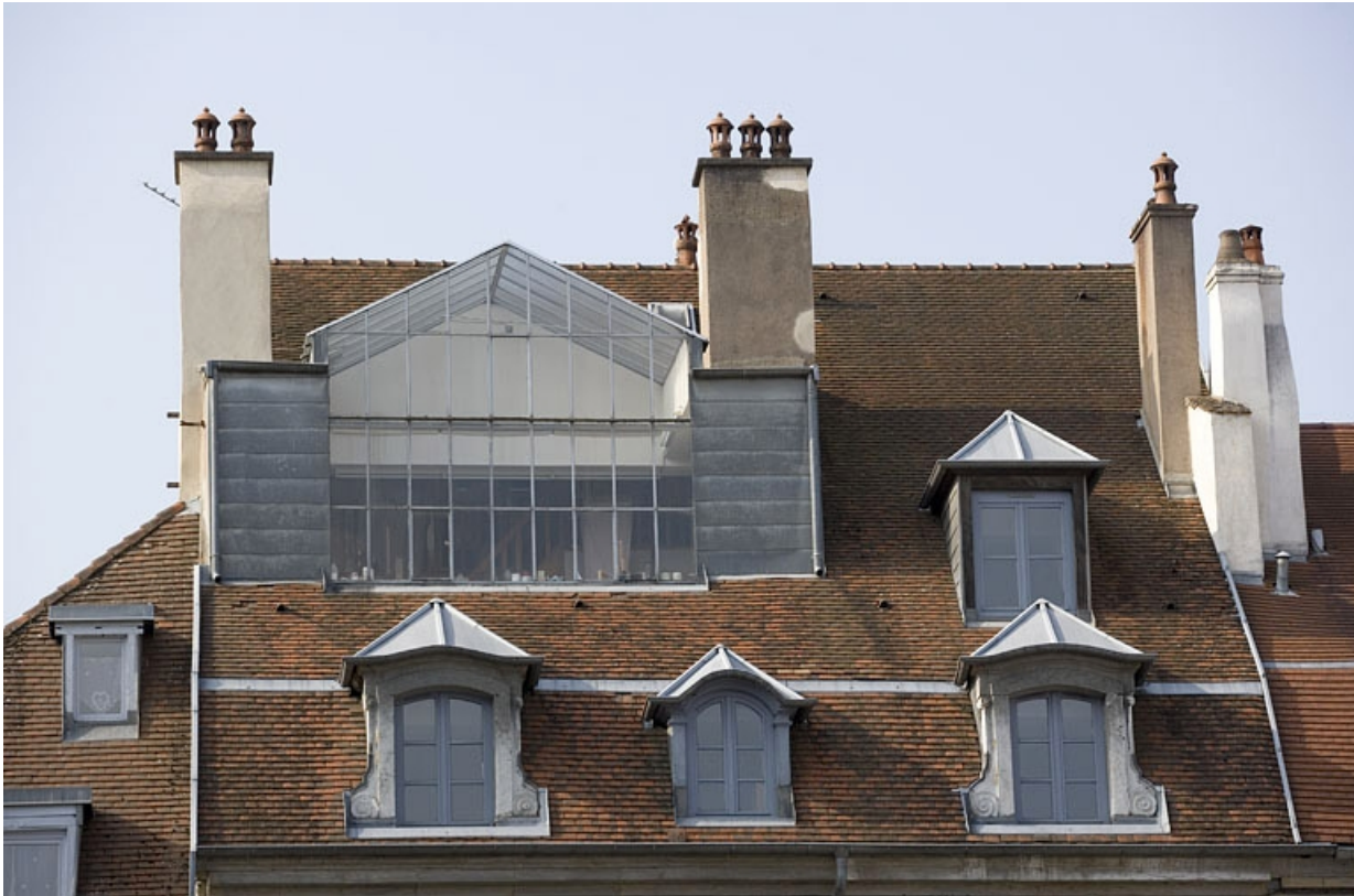
Toiture : détail de la verrière de l'atelier d'artiste.

25, Besançon Grande Rue 140, lieudit : îlot Ronchaux