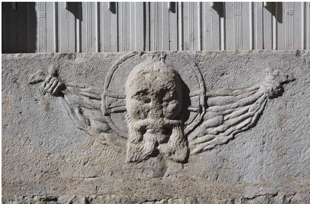
Façade latérale gauche : détail du bas-relief représentant une tête de Christ sur un linge.

25, Besançon Grande Rue 140, lieudit : îlot Ronchaux