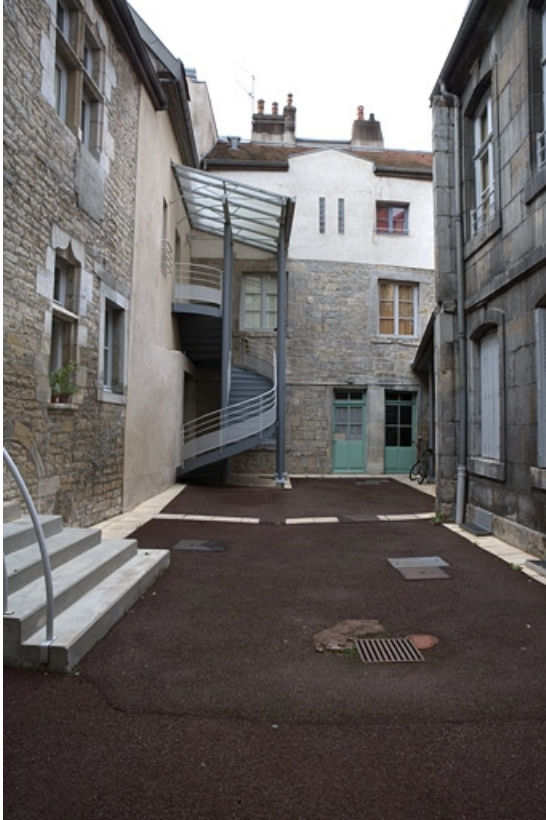
Vue d'ensemble de la cour depuis l'entrée.

25, Besançon Grande Rue 140, lieudit : îlot Ronchaux