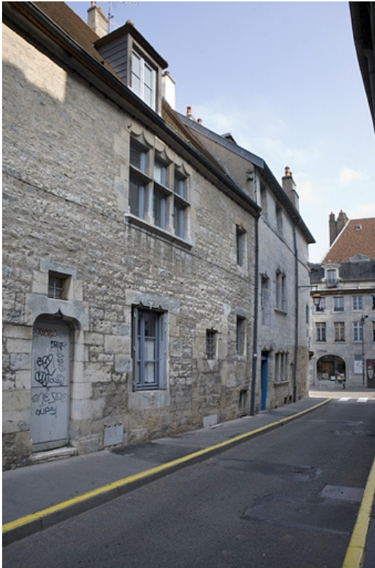
Façade latérale gauche : vue partielle.

25, Besançon Grande Rue 140, lieudit : îlot Ronchaux