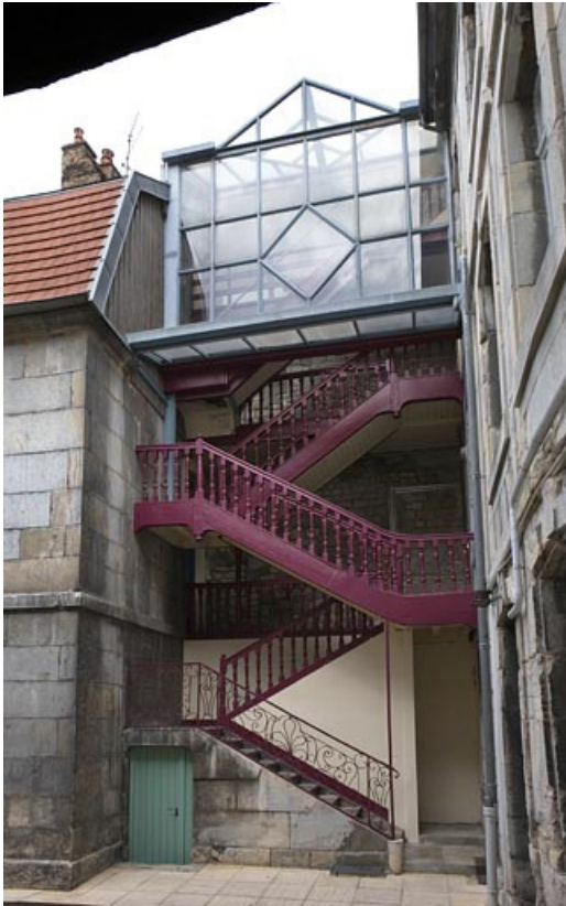
Vue d'ensemble de l'escalier à cage ouverte.

25, Besançon Grande Rue 140, lieudit : îlot Ronchaux