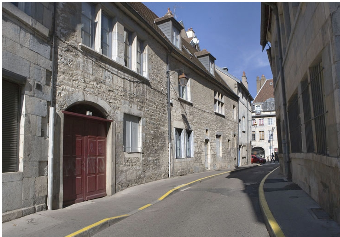
Façade latérale gauche, vue d'ensemble.

25, Besançon Grande Rue 140, lieudit : îlot Ronchaux