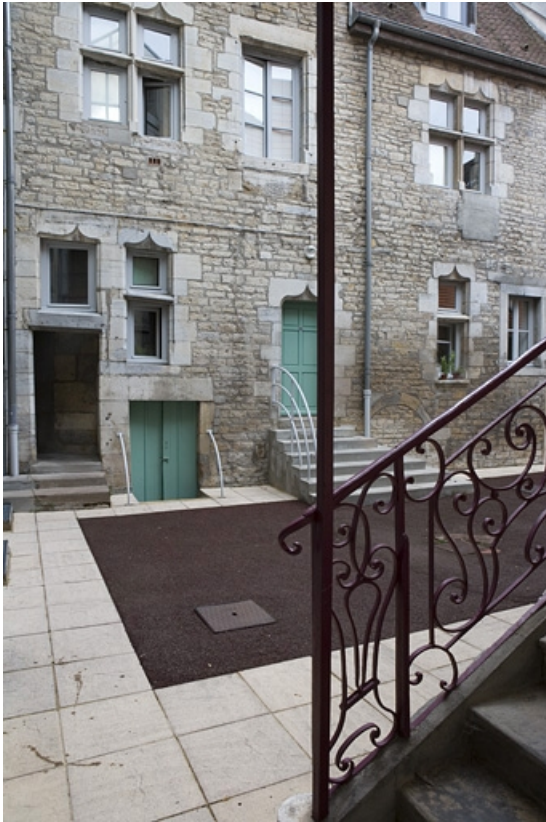
Vue de l'aile gauche depuis l'escalier à cage ouverte.

25, Besançon Grande Rue 140, lieudit : îlot Ronchaux