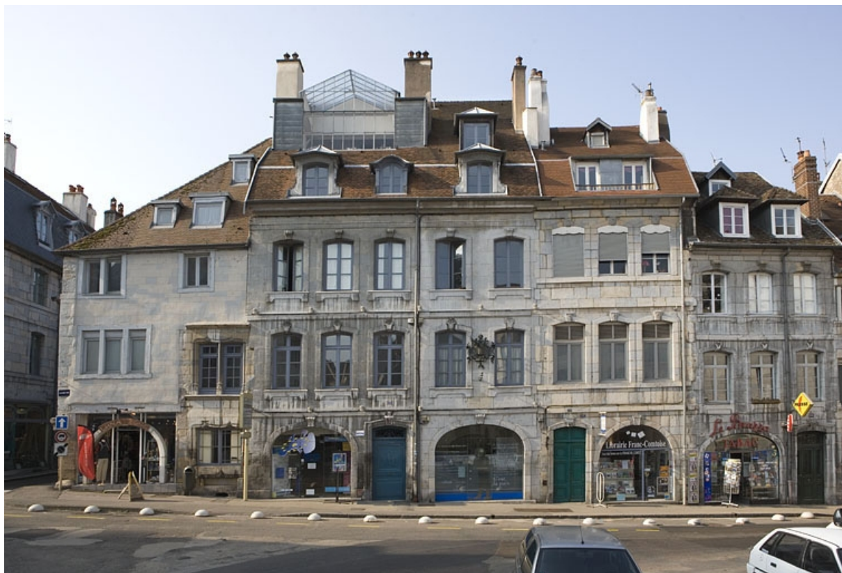
Vue d'ensemble de la façade sur rue, de face.

25, Besançon Grande Rue 140, lieudit : îlot Ronchaux