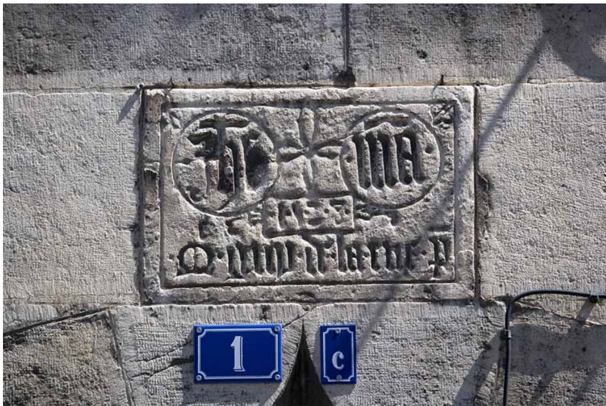
Détail de l'inscription au dessus de la porte d'entrée.

25, Besançon, 1 rue Mégevand, lieudit : îlot Terrier de Santans