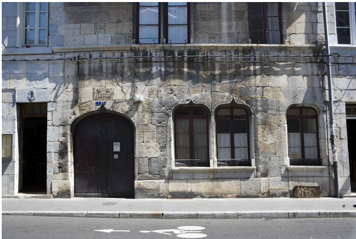
Détail du rez-de-chaussée sur rue.

25, Besançon, 1 rue Mégevand, lieudit : îlot Terrier de Santans