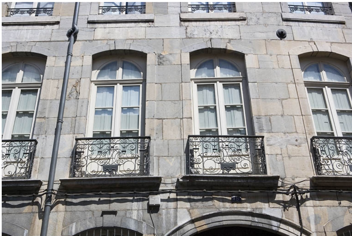
Logis principal : détail des garde-corps des fenêtres du premier étage sur rue. 25, Besançon, 19 rue Mégevand, lieudit : îlot Terrier de Santans