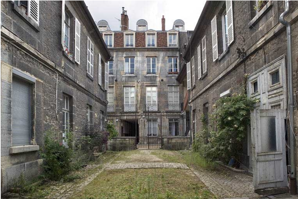
Vue d'ensemble de l'édifice depuis le fond de la deuxième cour.

25, Besançon, 19 rue Mégevand, lieudit : îlot Terrier de Santans