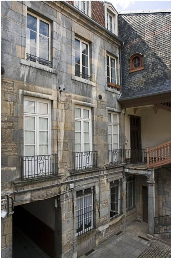
Vue de la façade postérieure du logis principal de trois quarts gauche.

25, Besançon, 19 rue Mégevand, lieudit : îlot Terrier de Santans