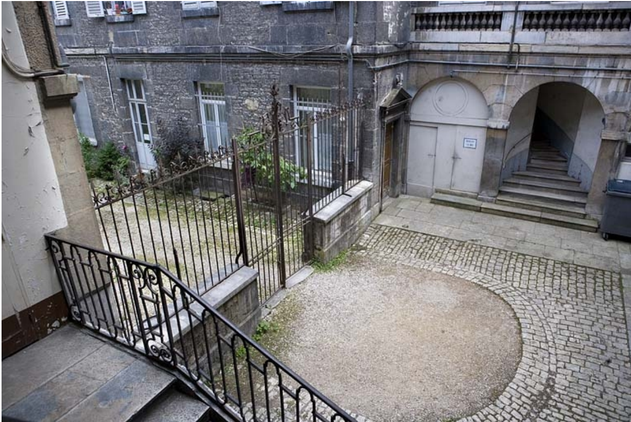
Vue de la première cour depuis l'escalier à cage ouverte.

25, Besançon, 19 rue Mégevand, lieudit : îlot Terrier de Santans