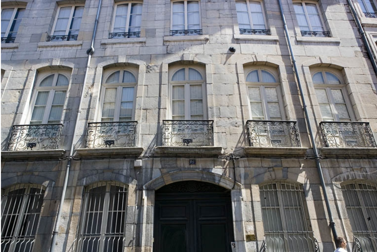
Logis principal : détail du premier étage sur rue.

25, Besançon, 19 rue Mégevand, lieudit : îlot Terrier de Santans