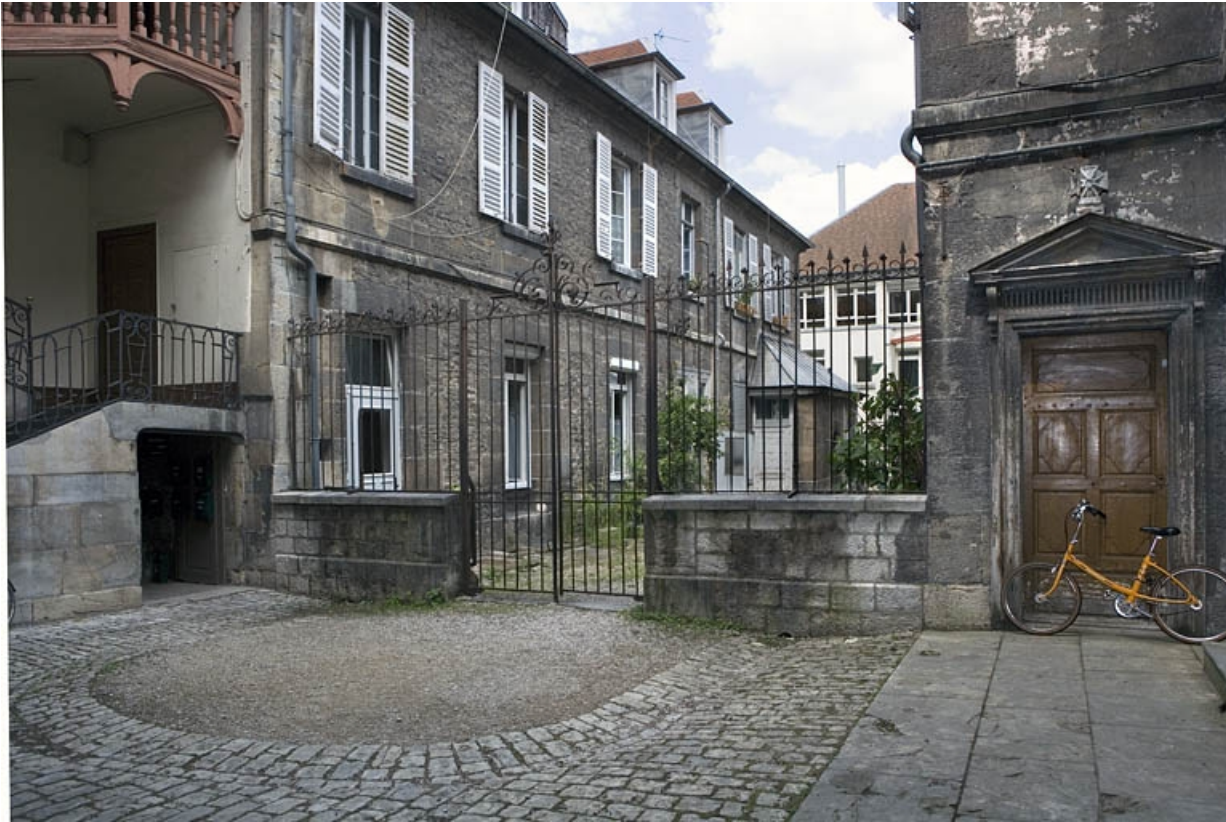
Vue de l'aile gauche dans la deuxième cour depuis la première cour.

25, Besançon, 19 rue Mégevand, lieudit : îlot Terrier de Santans