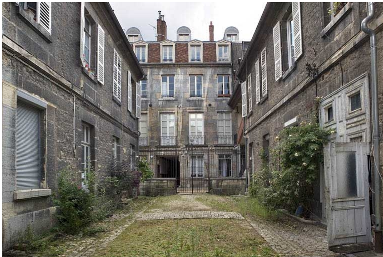
Vue d'ensemble de l'édifice depuis le fond de la deuxième cour.

25, Besançon, 19 rue Mégevand, lieudit : îlot Terrier de Santans