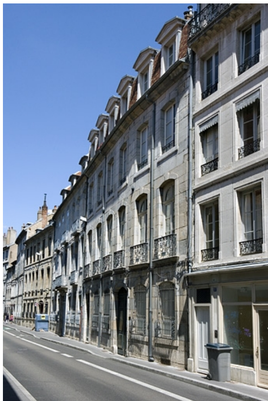
Logis principal : vue d'ensemble dans l'enfilade de la rue. 25, Besançon, 19 rue Mégevand, lieudit : îlot Terrier de Santans