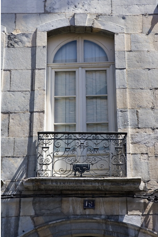
Logis principal : détail d'une fenêtre du premier étage sur rue.

25, Besançon, 19 rue Mégevand, lieudit : îlot Terrier de Santans