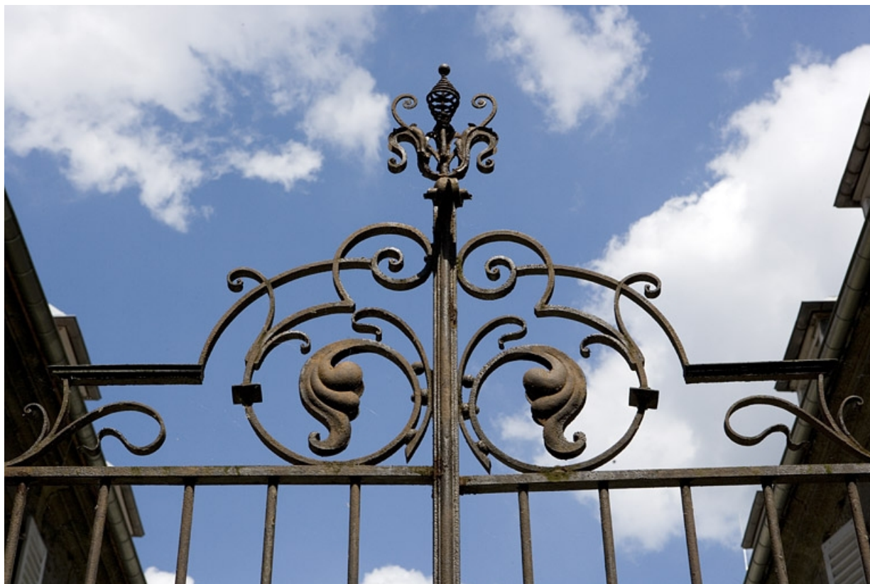
Détail de la partie supérieure de la grille séparant les deux cours.

25, Besançon, 19 rue Mégevand, lieudit : îlot Terrier de Santans