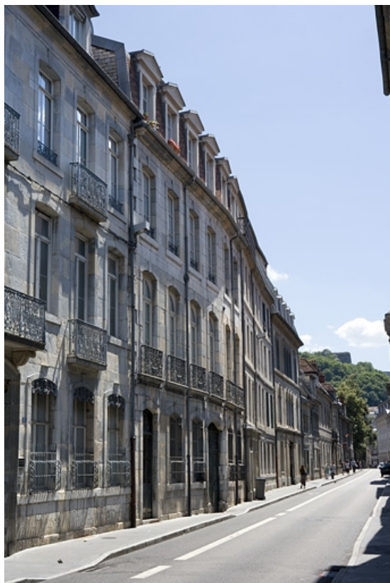
Logis principal : vue d'ensemble depuis la rue, de trois-quarts gauche. 25, Besançon, 19 rue Mégevand, lieudit : îlot Terrier de Santans