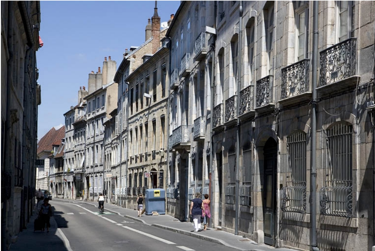
Logis principal : vue de trois quarts droit depuis la rue. 25, Besançon, 19 rue Mégevand, lieudit : îlot Terrier de Santans