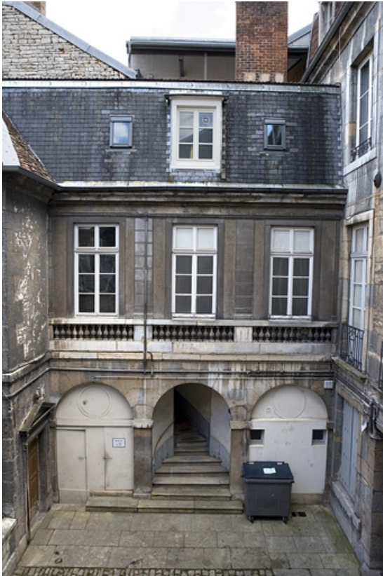
Vue éloignée de face de l'aile droite dans la première cour. 25, Besançon, 19 rue Mégevand, lieudit : îlot Terrier de Santans