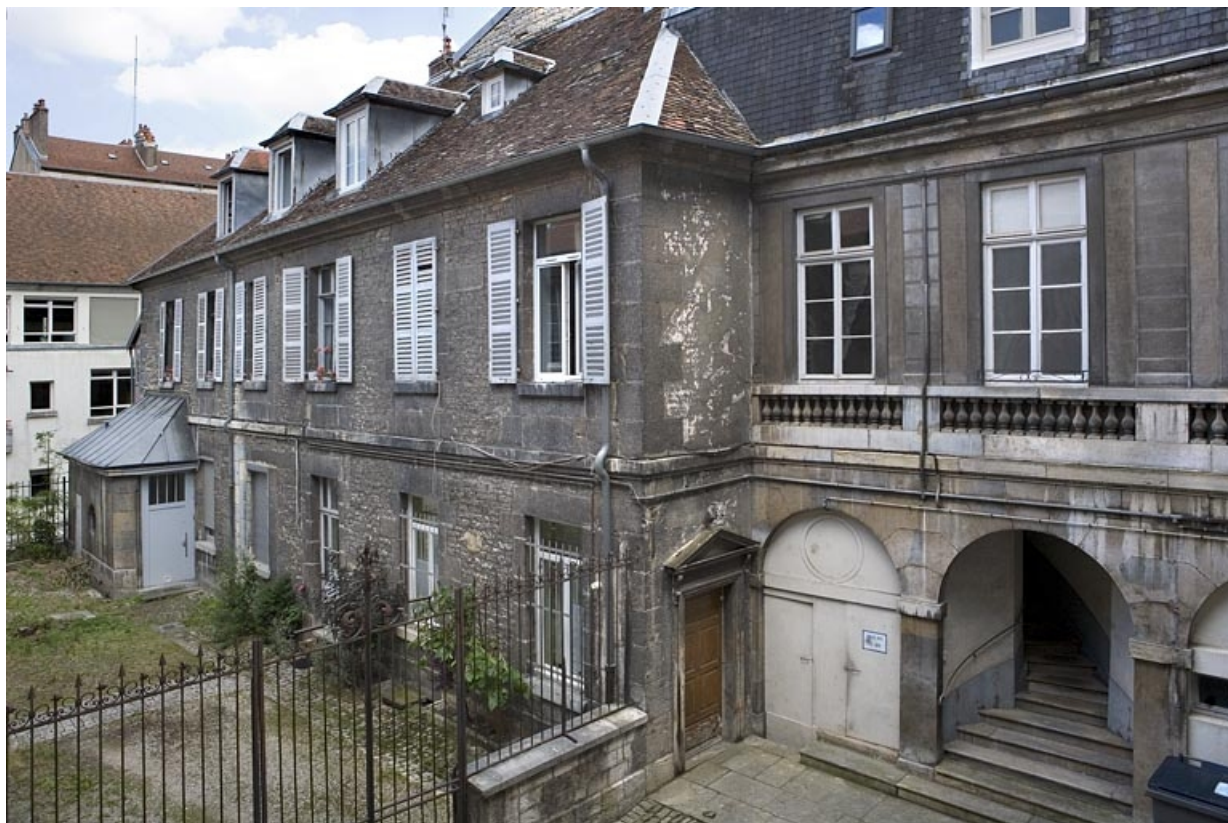
Vue des ailes droites de la première et de la deuxième cours : de trois quarts. 25, Besançon, 19 rue Mégevand, lieudit : îlot Terrier de Santans