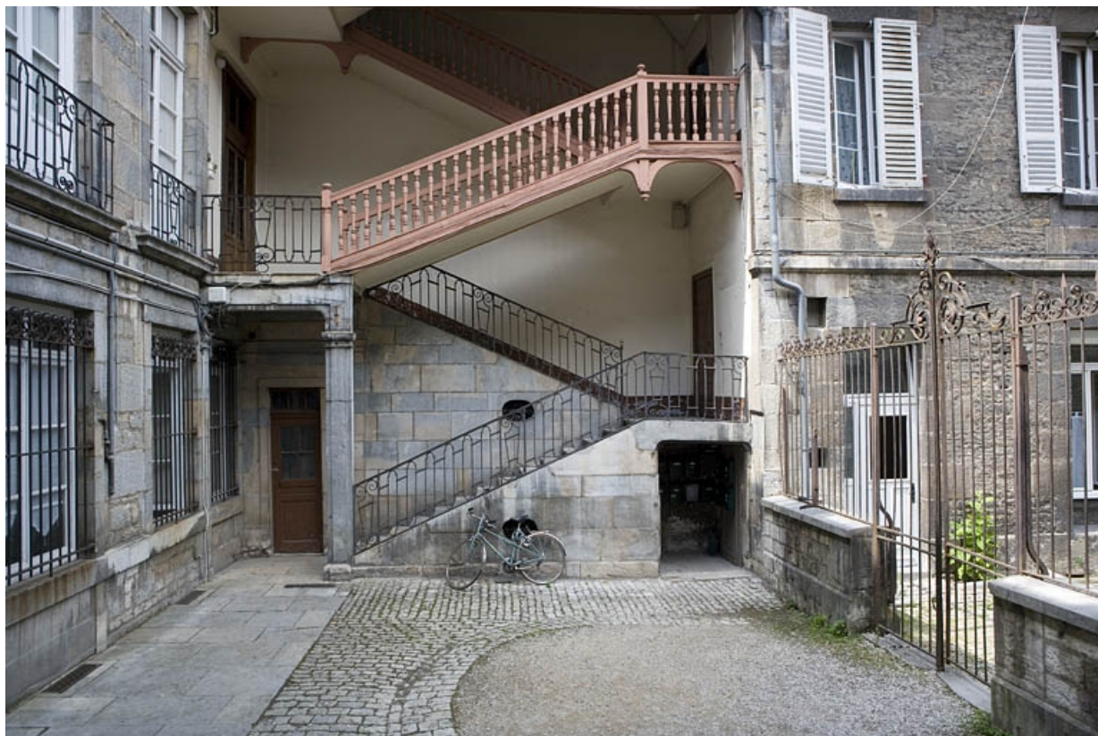
Vue de l'escalier à cage ouverte à gauche de la cour : de face.

25, Besançon, 19 rue Mégevand, lieudit : îlot Terrier de Santans