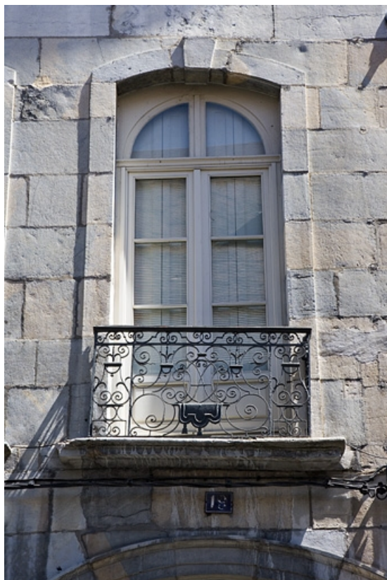
Logis principal : détail d'une fenêtre du premier étage sur rue. 25, Besançon, 19 rue Mégevand, lieudit : îlot Terrier de Santans