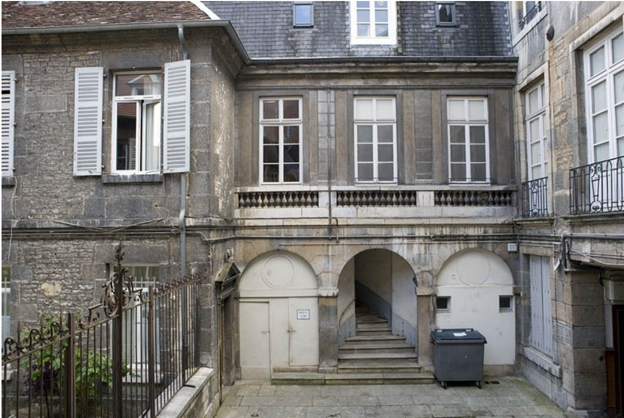
Vue de l'aile à droite de la première cour contenant l'escalier : de face.

25, Besançon, 19 rue Mégevand, lieudit : îlot Terrier de Santans