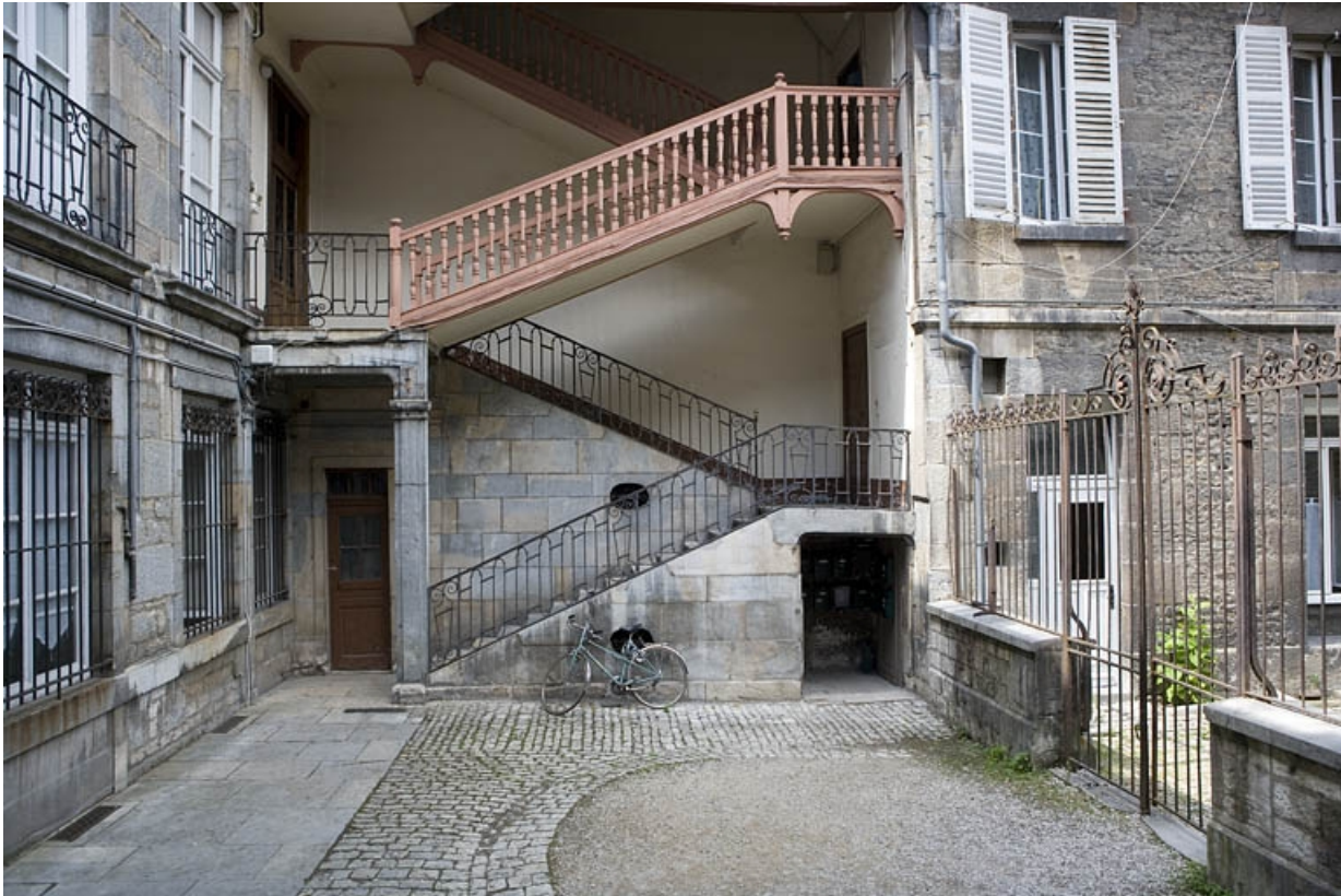
Vue de l'escalier à cage ouverte à gauche de la cour : de face.

25, Besançon, 19 rue Mégevand, lieudit : îlot Terrier de Santans