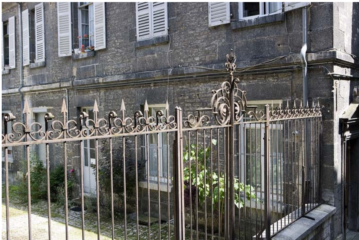
Vue de la grille séparant les deux cours, de trois quarts gauche.

25, Besançon, 19 rue Mégevand, lieudit : îlot Terrier de Santans