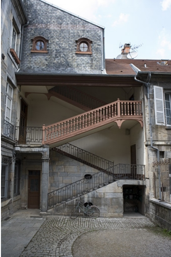
Vue de l'escalier à cage ouverte à gauche de la cour.

25, Besançon, 19 rue Mégevand, lieudit : îlot Terrier de Santans