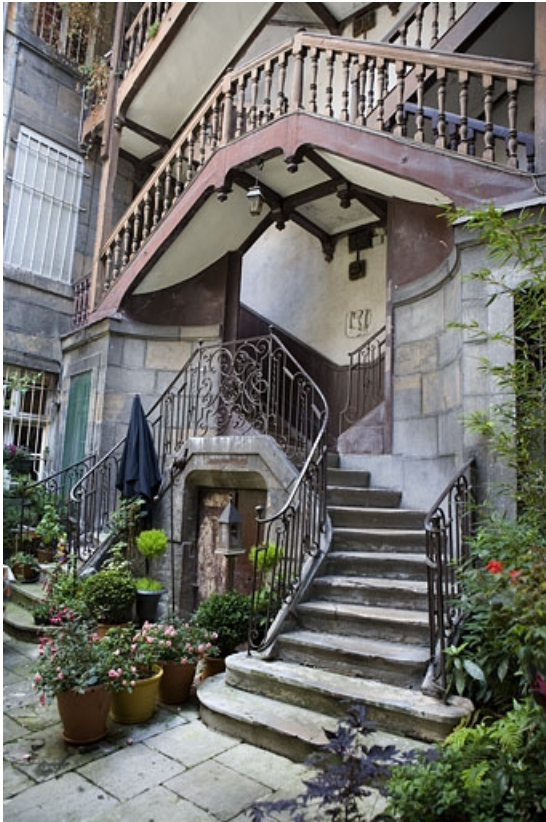
Vue de l'escalier à cage ouverte, de trois quart droit.

25, Besançon, 5 rue Mégevand, lieudit : îlot Terrier de Santans