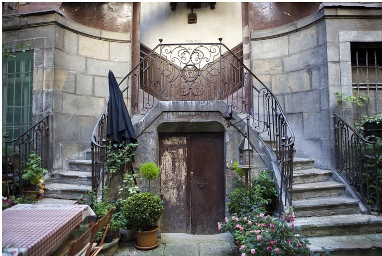
Détail de l'entrée de cave.

25, Besançon, 5 rue Mégevand, lieudit : îlot Terrier de Santans