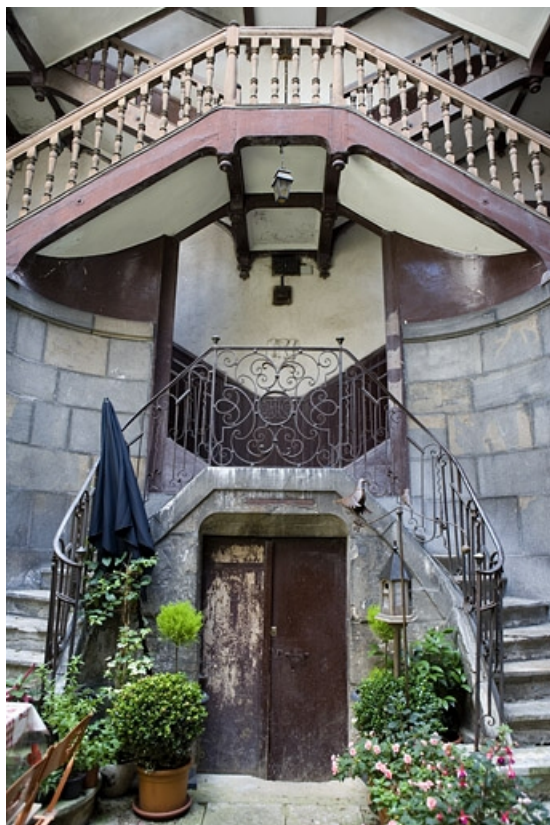
Détail de la partie inférieure de l'escalier à cage ouverte avec l'entrée de cave. 25, Besançon, 5 rue Mégevand, lieudit : îlot Terrier de Santans