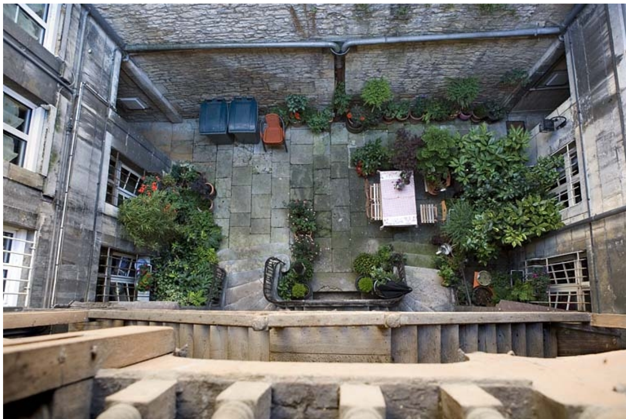
Vue d'ensemble de la cour depuis la partie supérieure de l'escalier à cage ouverte.

25, Besançon, 5 rue Mégevand, lieudit : îlot Terrier de Santans