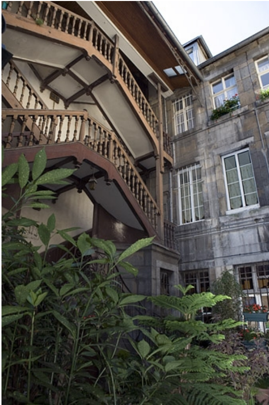
Vue de l'escalier à cage ouverte, de trois quart gauche.

25, Besançon, 5 rue Mégevand, lieudit : îlot Terrier de Santans