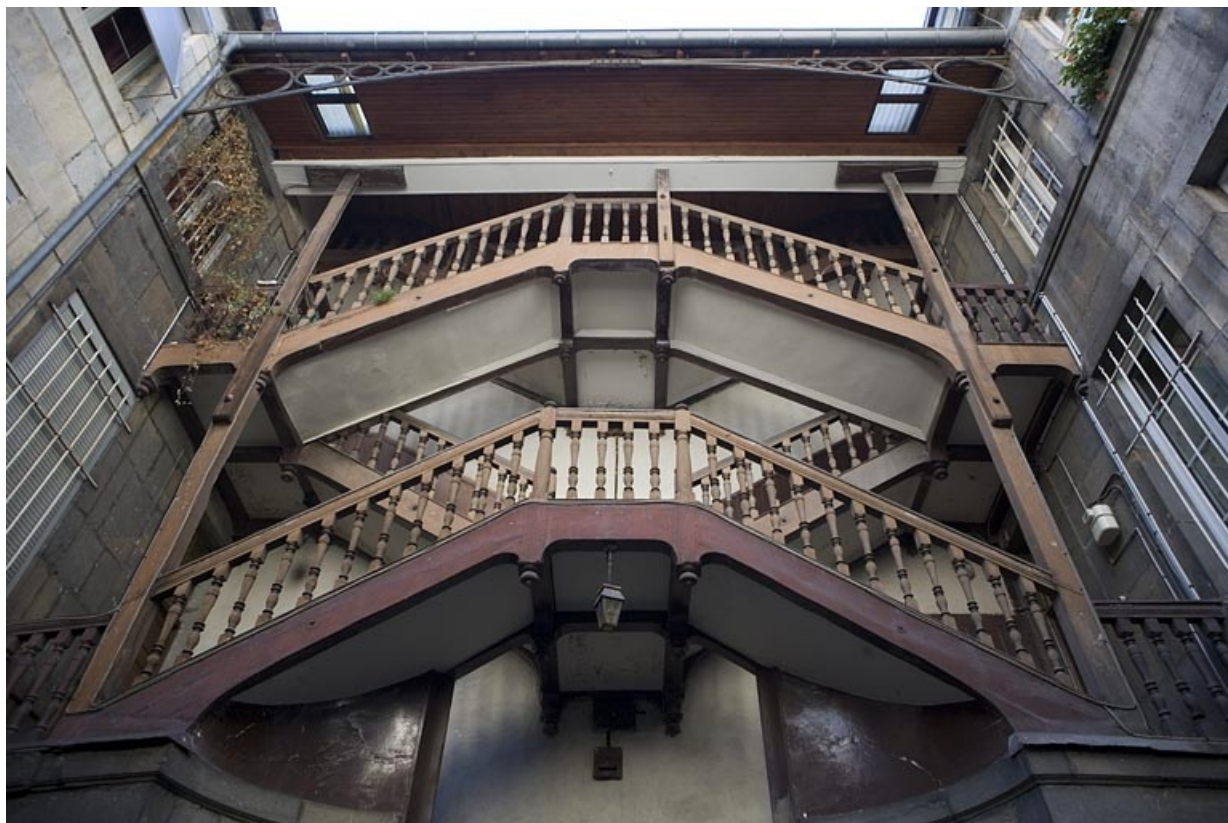
Détail de la partie supérieure de l'escalier à cage ouverte.

25, Besançon, 5 rue Mégevand, lieudit : îlot Terrier de Santans