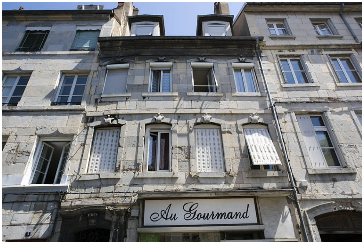
Vue rapprochée de la façade sur rue, de face.

25, Besançon, 5 rue Mégevand, lieudit : îlot Terrier de Santans