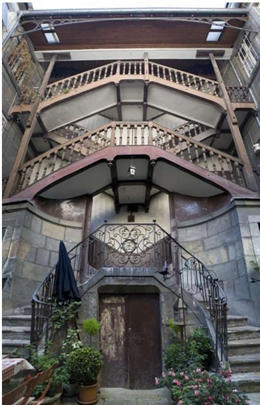
Vue d'ensemble de l'escalier à cage ouverte sur cour, de face.

25, Besançon, 5 rue Mégevand, lieudit : îlot Terrier de Santans