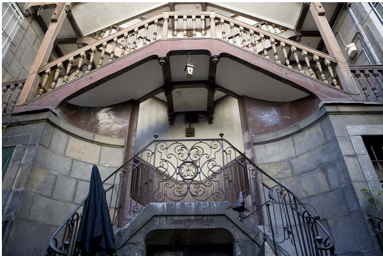
Détail de la partie inférieure de l'escalier à cage ouverte.

25, Besançon, 5 rue Mégevand, lieudit : îlot Terrier de Santans