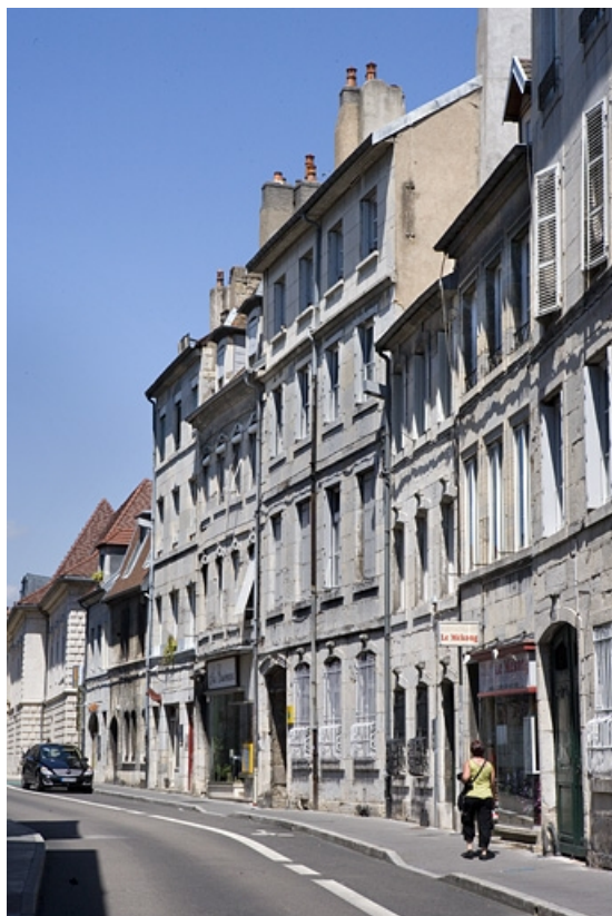
Vue d'ensemble de la maison dans l'alignement de la rue.

25, Besançon, 5 rue Mégevand, lieudit : îlot Terrier de Santans