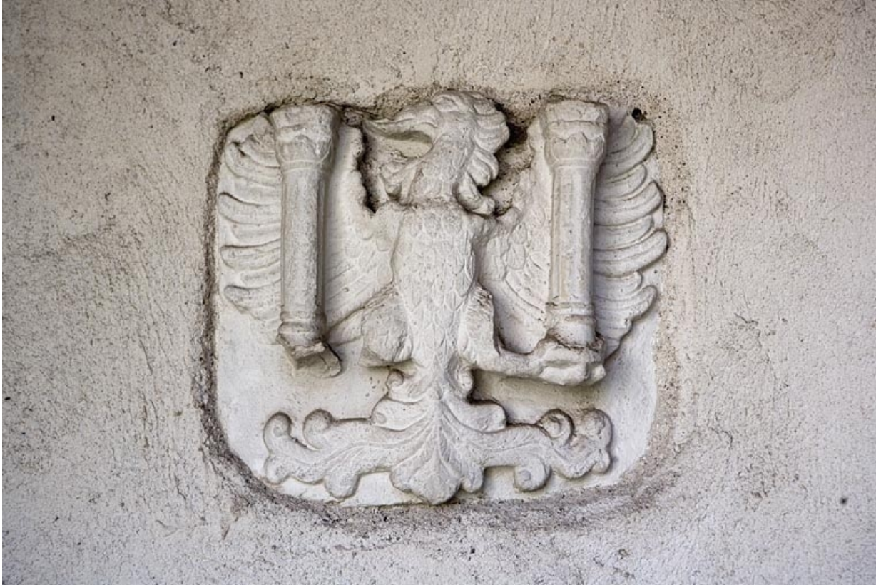
Détail du bas-relief représentant les armoiries de la ville situé dans l'escalier.

25, Besançon, 5 rue Mégevand, lieudit : îlot Terrier de Santans