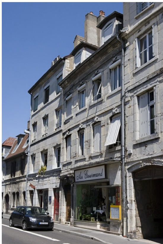
Vue d'ensemble de la façade sur rue, de trois quarts droit. 25, Besançon, 5 rue Mégevand, lieudit : îlot Terrier de Santans