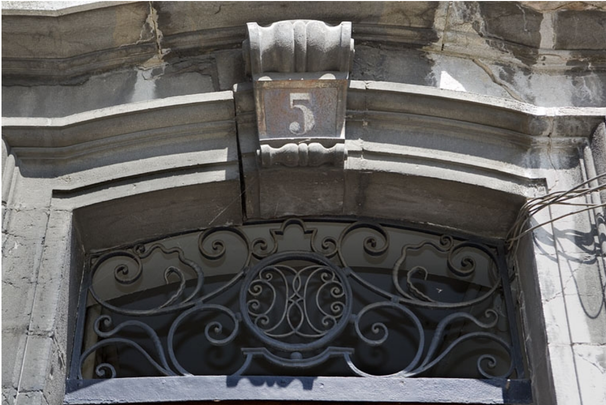
Détail de l'imposte en ferronnerie de la porte du couloir.

25, Besançon, 5 rue Mégevand, lieudit : îlot Terrier de Santans