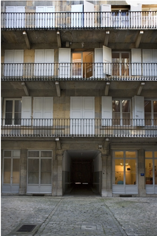
Vue de la façade postérieure du logis sur rue.

25, Besançon Grande Rue 70, lieudit : îlot Terrier de Santans