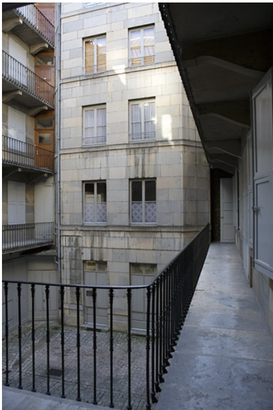
Vue de l'aile gauche sur cour de trois quarts droit.

25, Besançon Grande Rue 70, lieudit : îlot Terrier de Santans