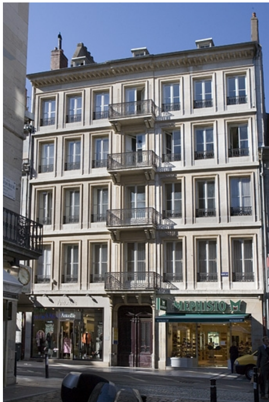
Vue d'ensemble de l'édifice depuis la rue.

25, Besançon Grande Rue 70, lieudit : îlot Terrier de Santans