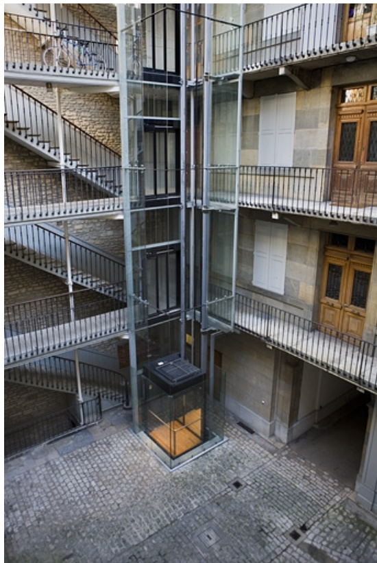
Vue de l'ascenseur situé à un angle de la cour.

25, Besançon Grande Rue 70, lieudit : îlot Terrier de Santans