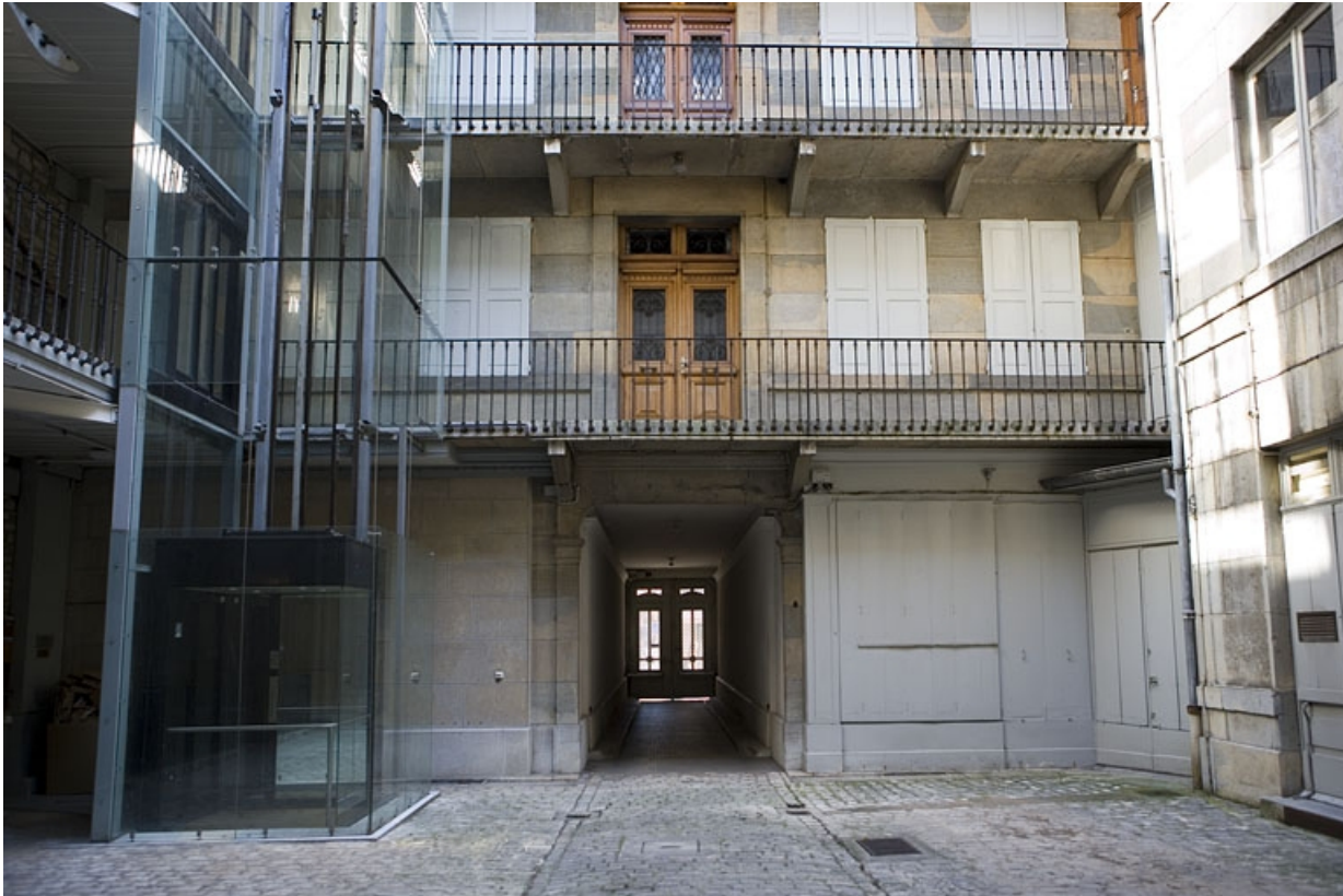
Vue du logis en fond de cour avec son passage cocher.

25, Besançon Grande Rue 70, lieudit : îlot Terrier de Santans