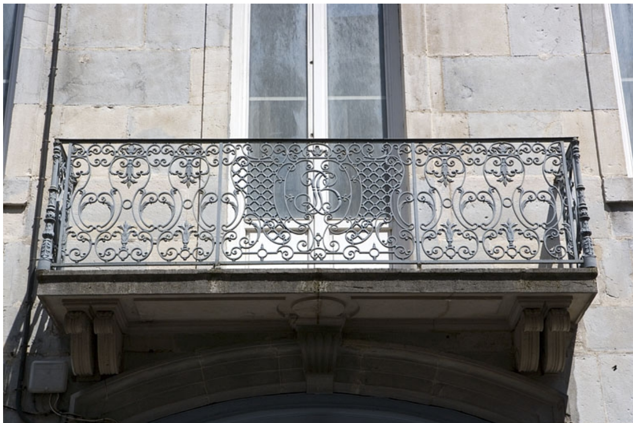
Logis principal : détail du balcon au-dessus du portail d'entrée.

25, Besançon, 17 rue Mégevand, lieudit : îlot Terrier de Santans