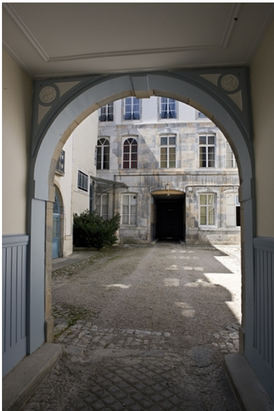
Vue de la première cour depuis le passage cocher du logis secondaire.

25, Besançon, 17 rue Mégevand, lieudit : îlot Terrier de Santans