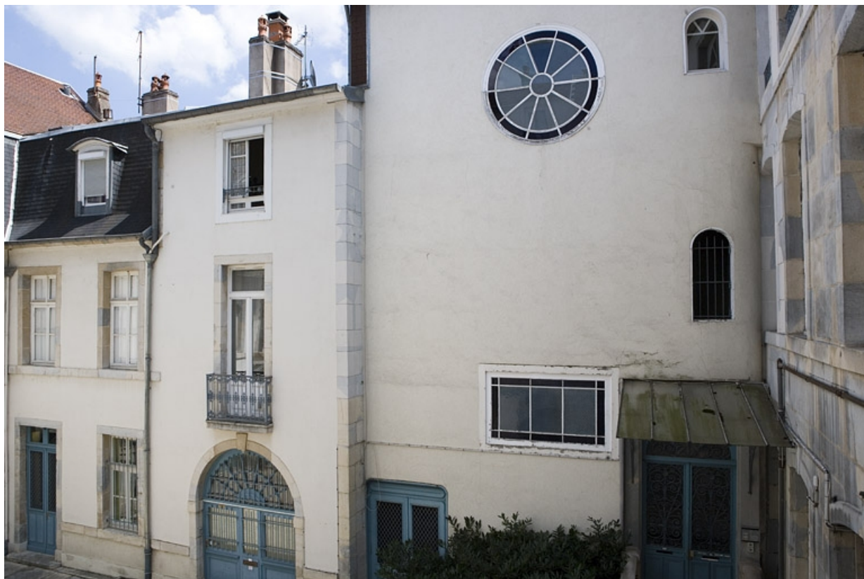
Vue d'ensemble de l'aile droite sur cour.

25, Besançon, 17 rue Mégevand, lieudit : îlot Terrier de Santans