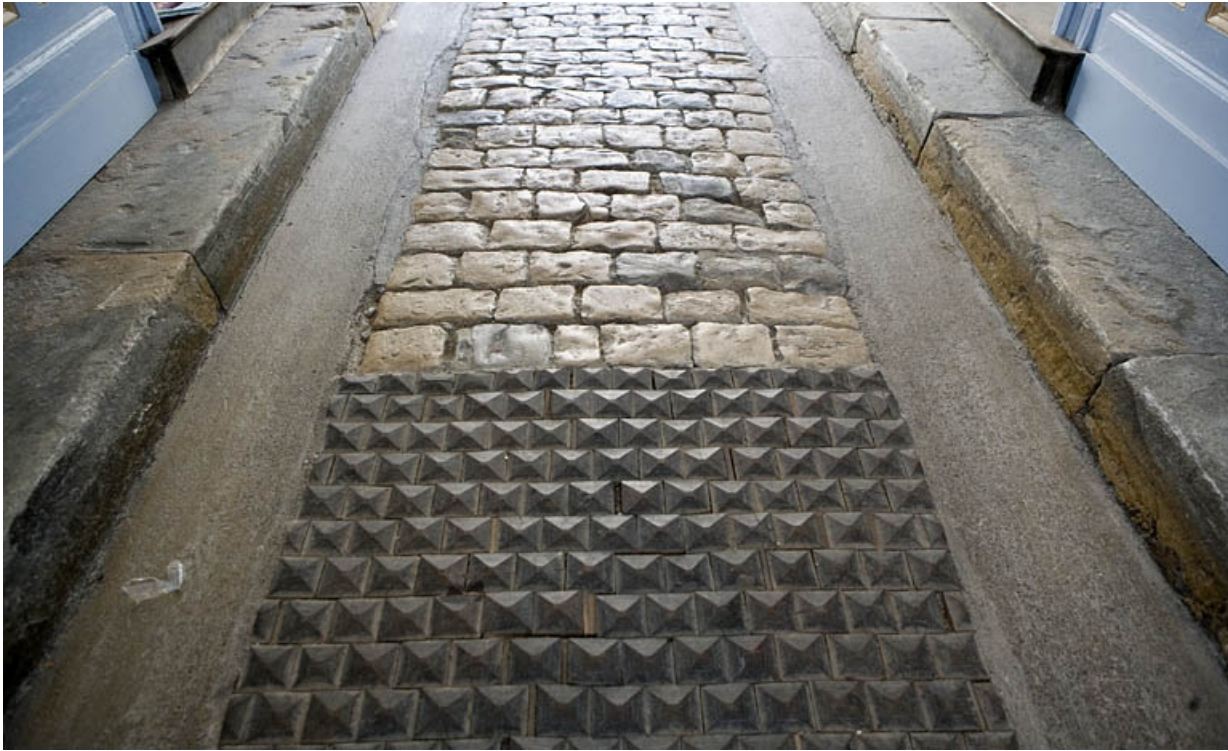
Logis principal : détail des pavés en bois et en pierre du passage cocher. 25, Besançon, 17 rue Mégevand, lieudit : îlot Terrier de Santans