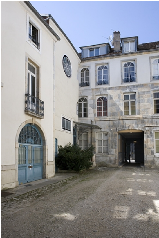
Vue de la façade postérieure du logis principal et de l'aile à droite de la cour. 25, Besançon, 17 rue Mégevand, lieudit : îlot Terrier de Santans