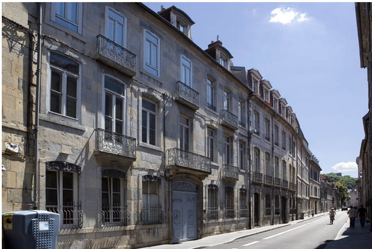
Vue d'ensemble depuis la rue, de trois quarts gauche.

25, Besançon, 17 rue Mégevand, lieudit : îlot Terrier de Santans