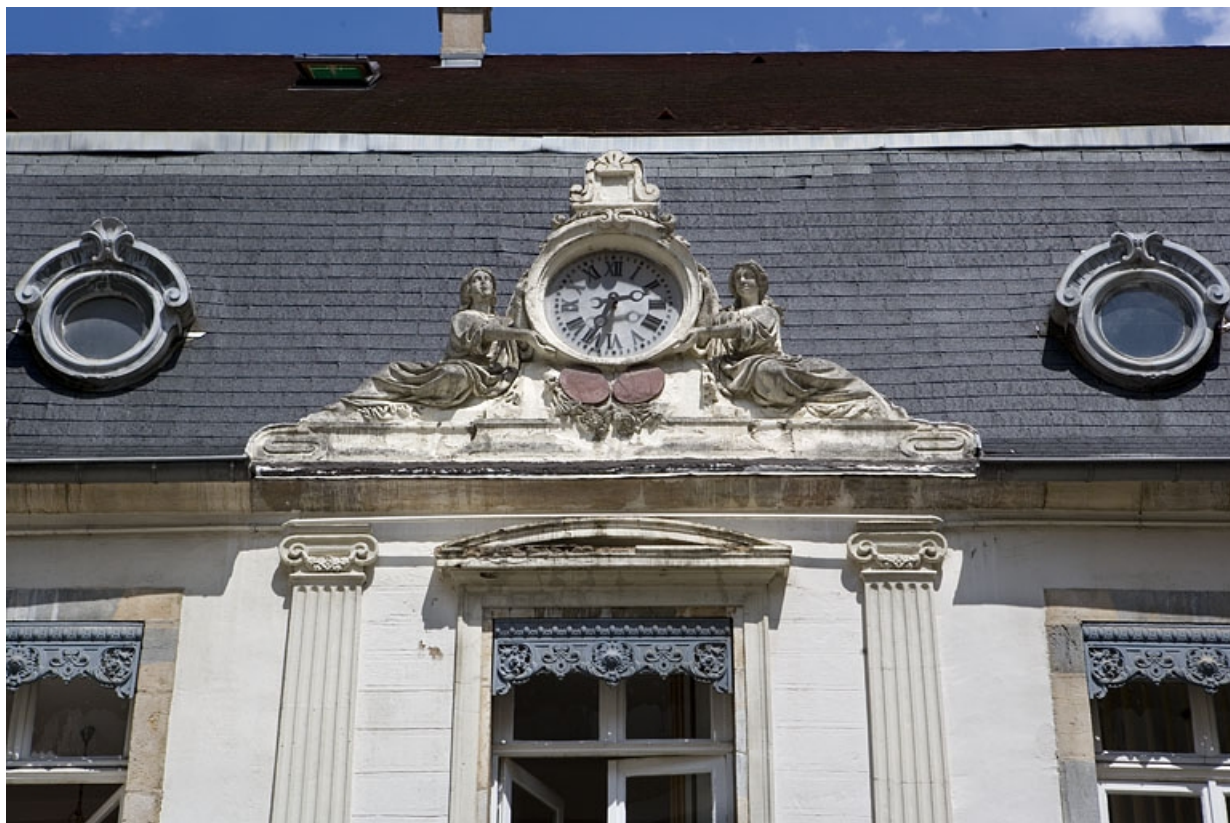
Détail de l'horloge couronnant la partie centrale du logis au fond de la première cour.

25, Besançon, 17 rue Mégevand, lieudit : îlot Terrier de Santans