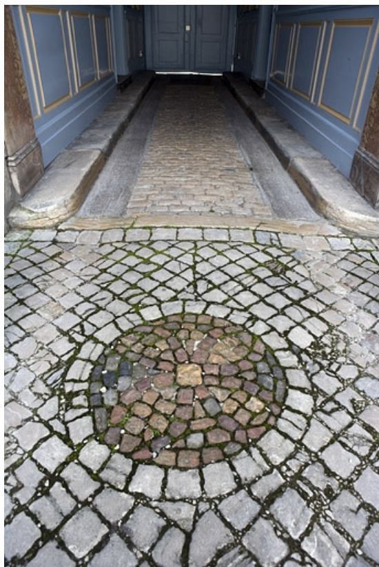
Première cour : détail d'un décor du pavage.

25, Besançon, 17 rue Mégevand, lieudit : îlot Terrier de Santans