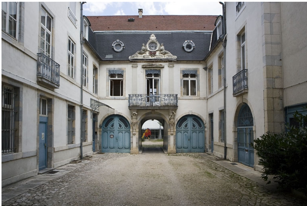
Vue d'ensemble de la cour depuis l'entrée.

25, Besançon, 17 rue Mégevand, lieudit : îlot Terrier de Santans