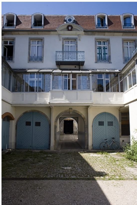
Vue de la partie centrale de la façade postérieure du logis secondaire, de face. 25, Besançon, 17 rue Mégevand, lieudit : îlot Terrier de Santans