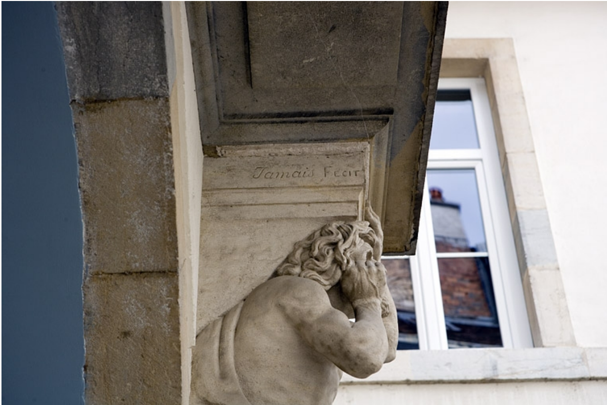
Détail de la tête de l'atlante droit, de profil.

25, Besançon, 17 rue Mégevand, lieudit : îlot Terrier de Santans