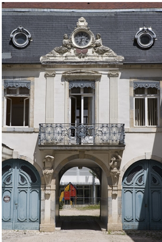
Détail de la partie centrale du logis au fond de la première cour.

25, Besançon, 17 rue Mégevand, lieudit : îlot Terrier de Santans