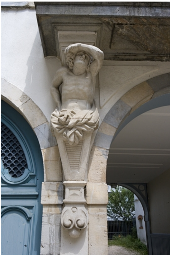
Détail de l'atlante gauche supportant le balcon du logis en fond de cour.

25, Besançon, 17 rue Mégevand, lieudit : îlot Terrier de Santans