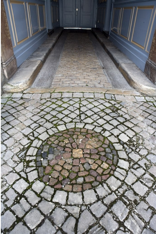
Première cour : détail d'un décor du pavage.

25, Besançon, 17 rue Mégevand, lieudit : îlot Terrier de Santans