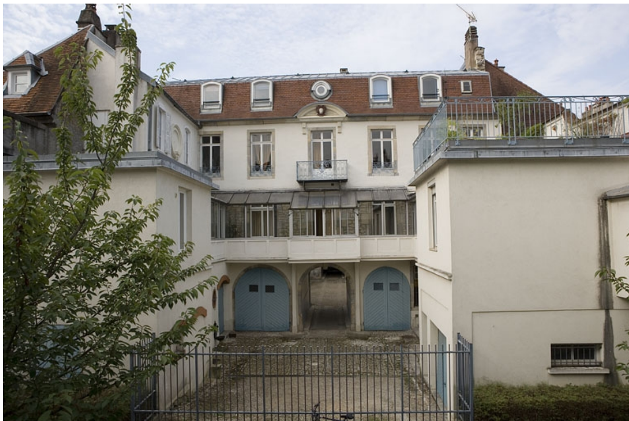
Logis secondaire : vue d'ensemble des bâtiments autour de la deuxième cour.

25, Besançon, 17 rue Mégevand, lieudit : îlot Terrier de Santans