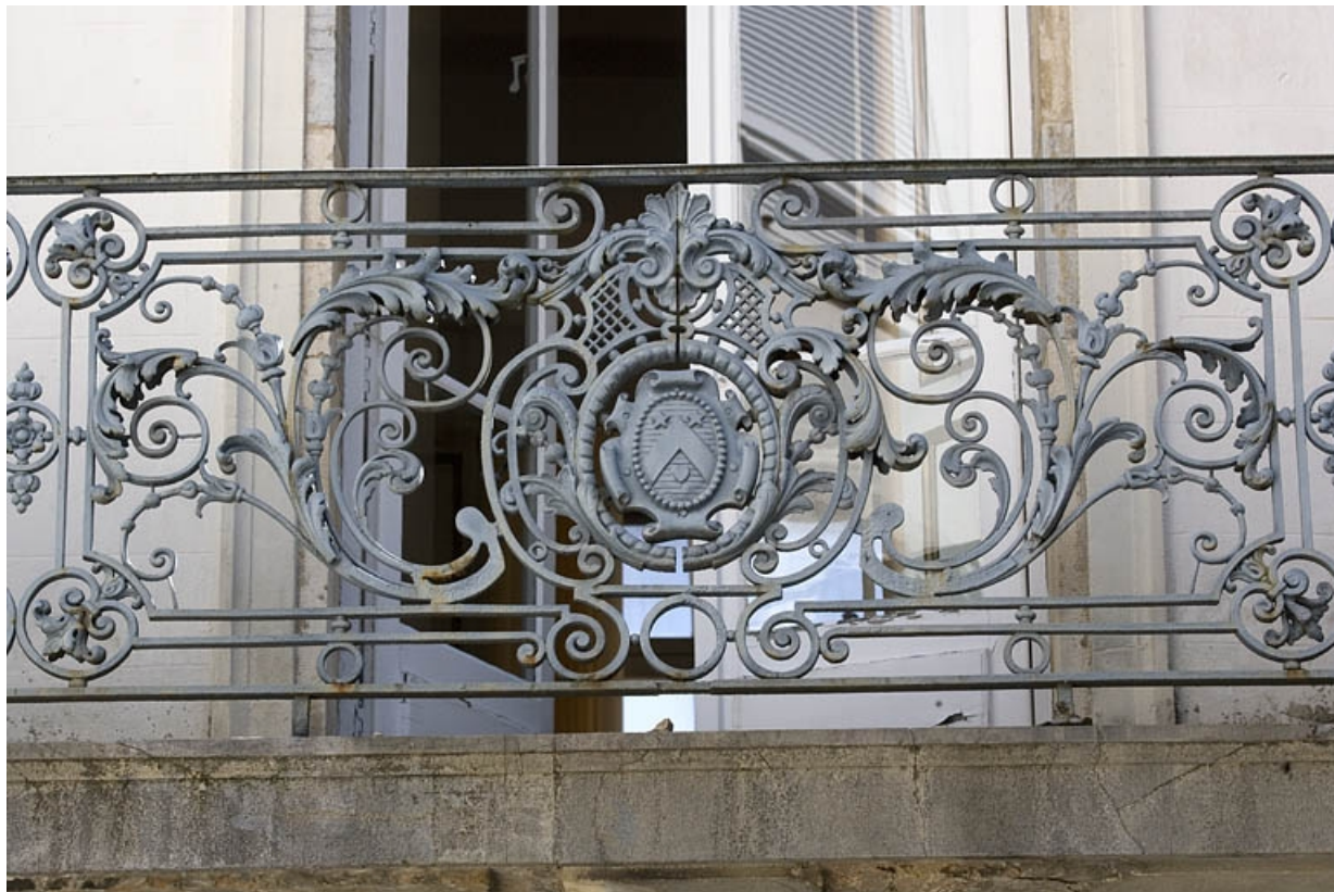
Détail des armoiries des Courlet de Boulot sur le balcon du logis en fond de cour.

25, Besançon, 17 rue Mégevand, lieudit : îlot Terrier de Santans