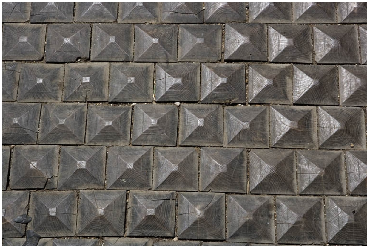
Logis principal : détail des pavés en bois du passage cocher.

25, Besançon, 17 rue Mégevand, lieudit : îlot Terrier de Santans