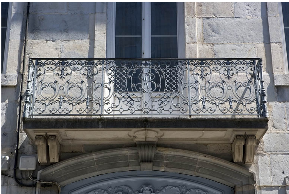
Logis principal : détail du balcon situé au-dessus du portail d'entrée.

25, Besançon, 17 rue Mégevand, lieudit : îlot Terrier de Santans