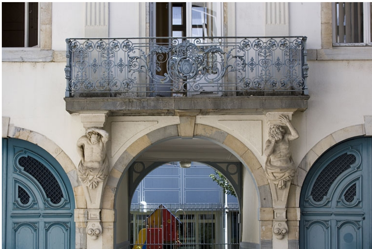
Détail du balcon : logis en fond de cour.

25, Besançon, 17 rue Mégevand, lieudit : îlot Terrier de Santans