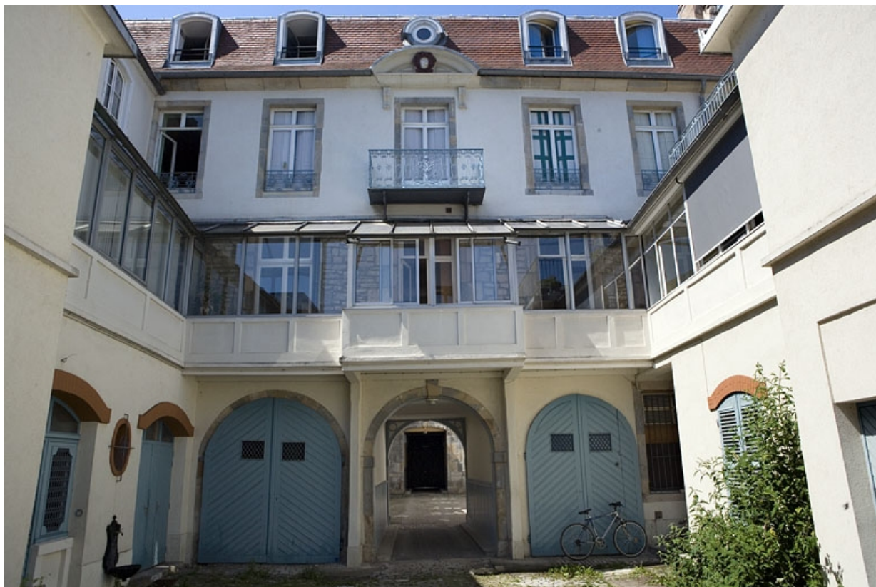
Façade postérieure du logis secondaire, de face.

25, Besançon, 17 rue Mégevand, lieudit : îlot Terrier de Santans