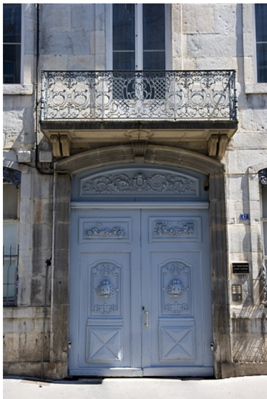
Logis principal : détail du portail d'entrée.

25, Besançon, 17 rue Mégevand, lieudit : îlot Terrier de Santans