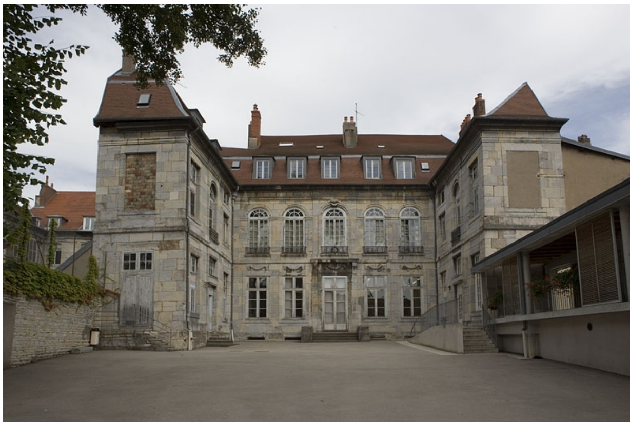
Vue d'ensemble de la façade postérieure du logis principal depuis l'ancien jardin.

25, Besançon Grande Rue 68, lieudit : îlot Terrier de Santans