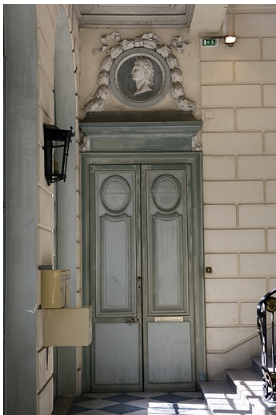
Escalier d'honneur : vue de la porte gauche située au rez-de-chaussée.

25, Besançon Grande Rue 68, lieudit : îlot Terrier de Santans