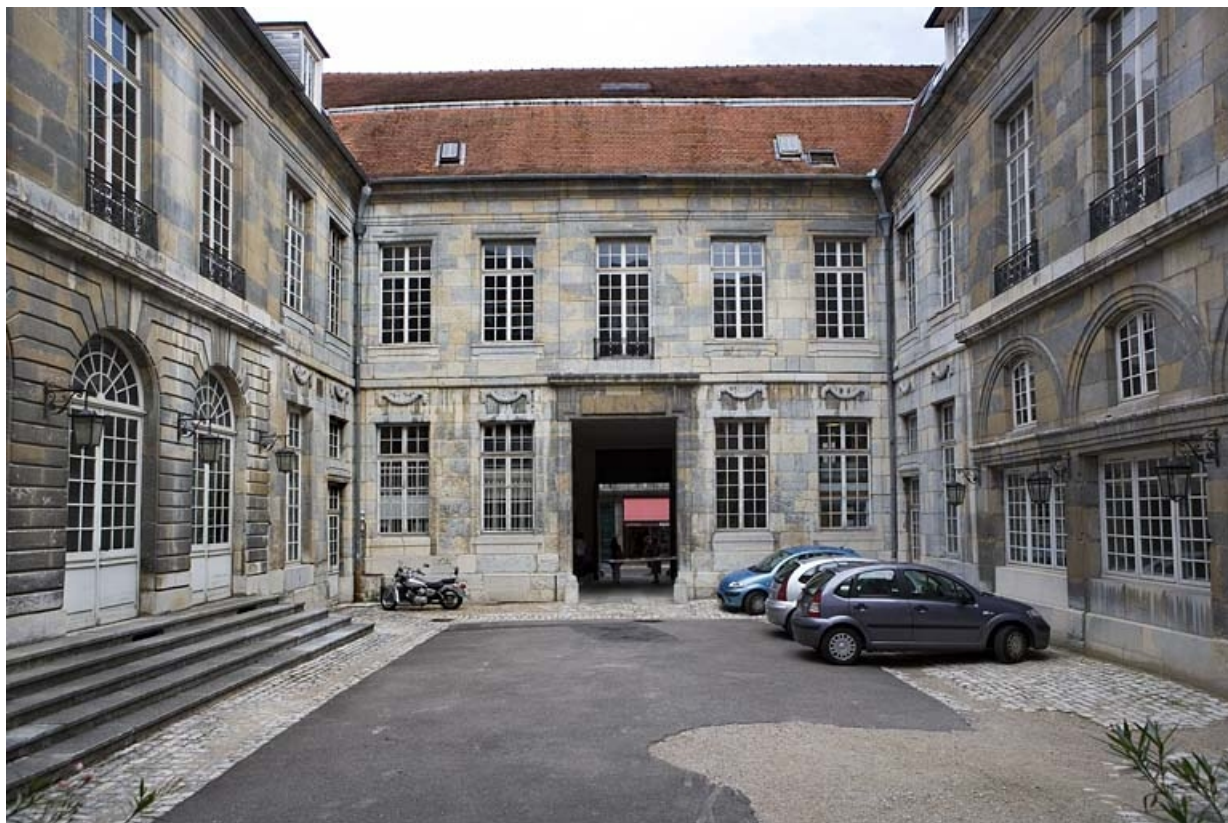
Vue d'ensemble des bâtiments depuis le fond de la cour d'honneur.

25, Besançon Grande Rue 68, lieudit : îlot Terrier de Santans