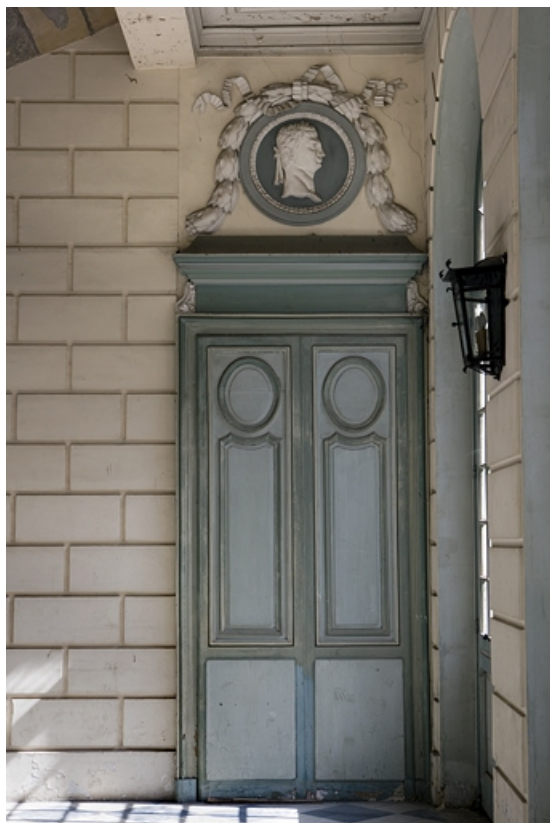
Escalier d'honneur : vue de la porte droite située au rez-de-chaussée.

25, Besançon Grande Rue 68, lieudit : îlot Terrier de Santans