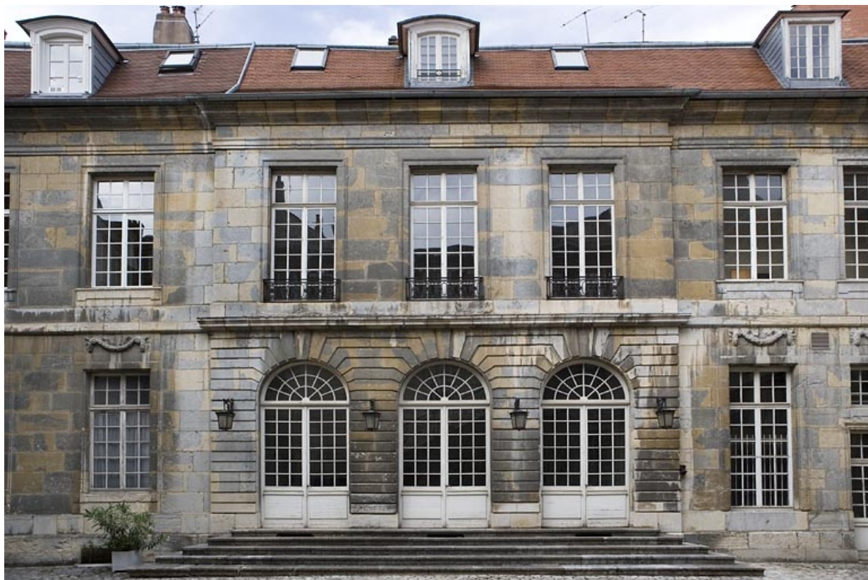
Aile à droite de la cour d'honneur contenant l'escalier.

25, Besançon Grande Rue 68, lieudit : îlot Terrier de Santans