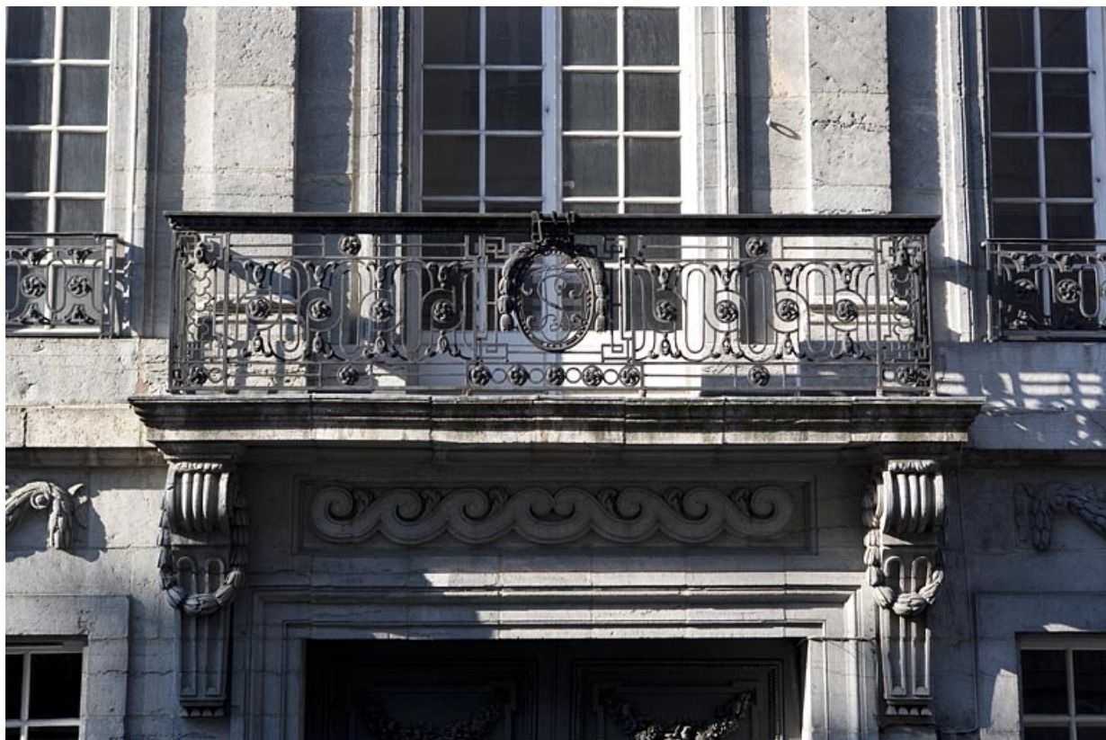
Détail du balcon en ferronnerie, au premier étage sur rue, comportant les armoiries des Terrier de Santans.

25, Besançon Grande Rue 68, lieudit : îlot Terrier de Santans