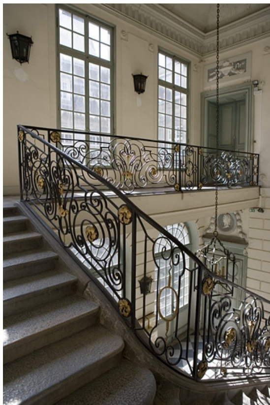
Escalier d'honneur : détail de la dernière volée et du palier.

25, Besançon Grande Rue 68, lieudit : îlot Terrier de Santans