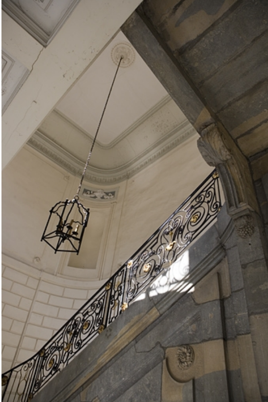
Escalier d'honneur : vue en contre-plongée.

25, Besançon Grande Rue 68, lieudit : îlot Terrier de Santans