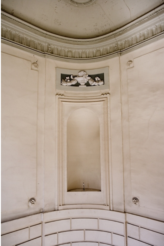
Escalier d'honneur : détail d'une niche située dans la montée d'escalier.

25, Besançon Grande Rue 68, lieudit : îlot Terrier de Santans