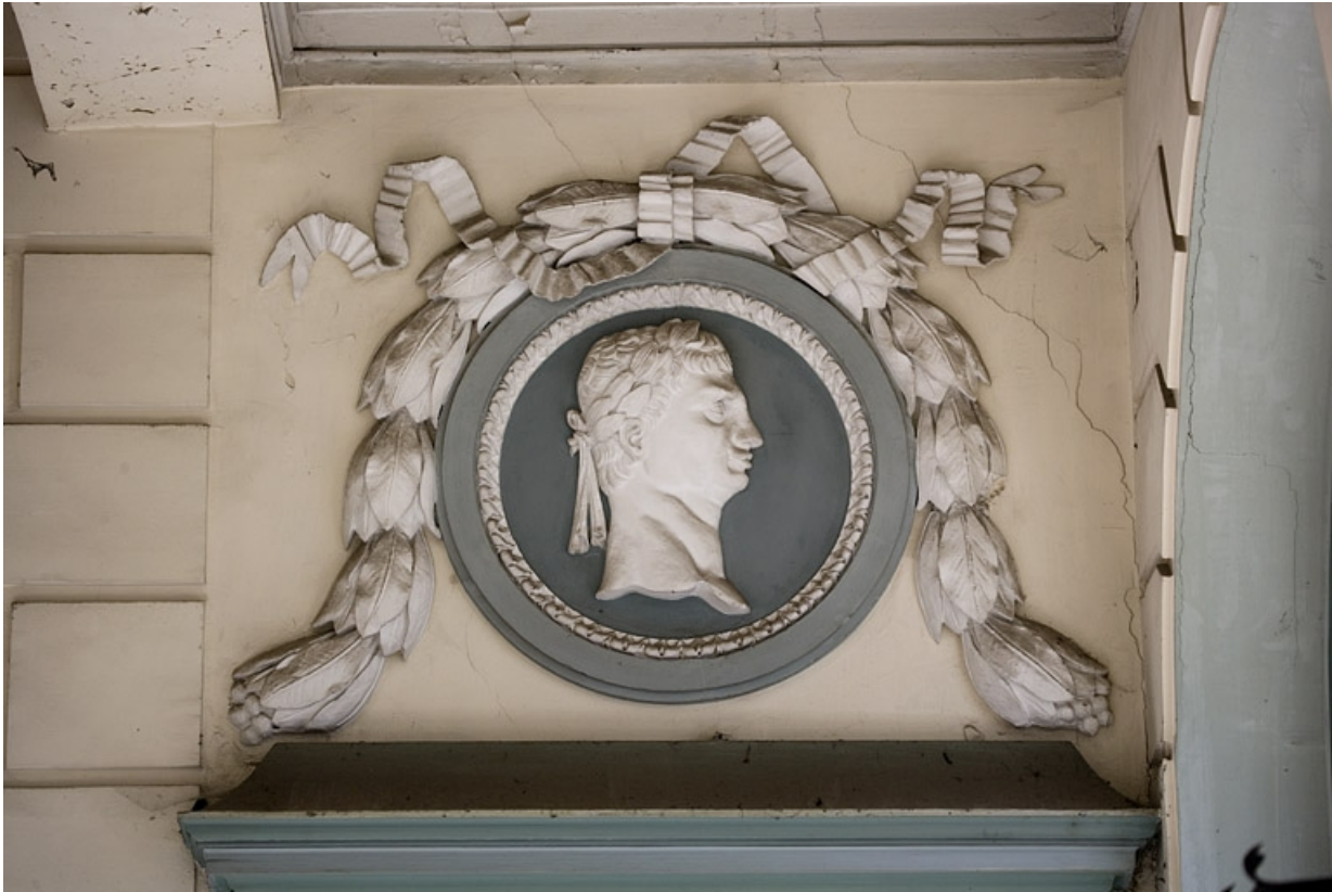
Escalier d'honneur, rez-de-chaussée : détail du dessus de porte droit.

25, Besançon Grande Rue 68, lieudit : îlot Terrier de Santans