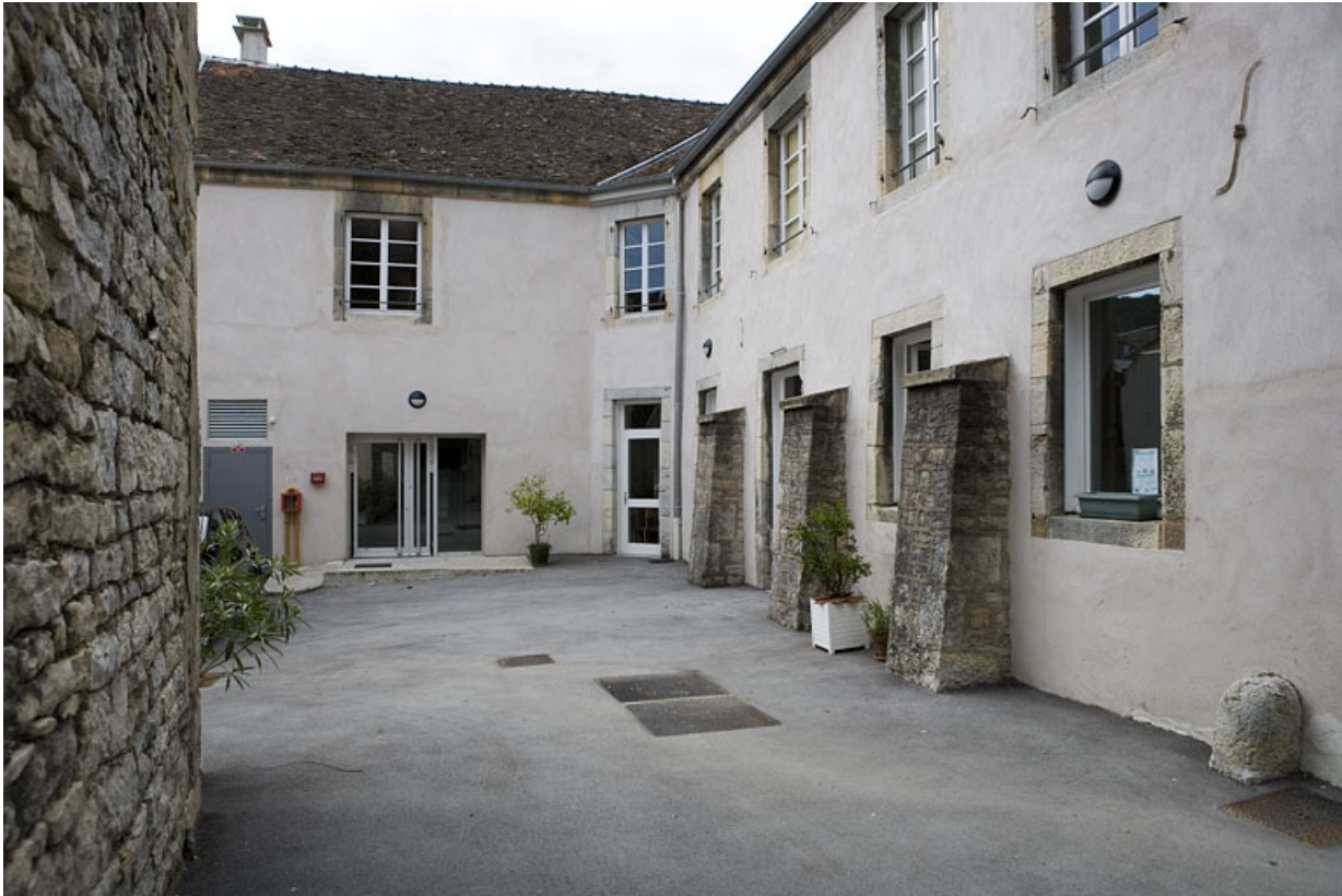
Vue d'ensemble des bâtiments situés dans la cour des communs.

25, Besançon Grande Rue 68, lieudit : îlot Terrier de Santans