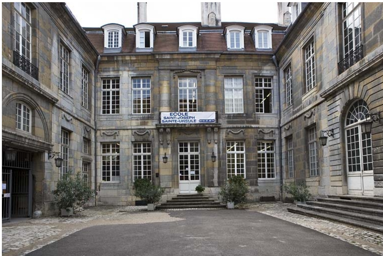
Vue d'ensemble des bâtiments autour de la cour d'honneur depuis l'entrée.

25, Besançon Grande Rue 68, lieudit : îlot Terrier de Santans