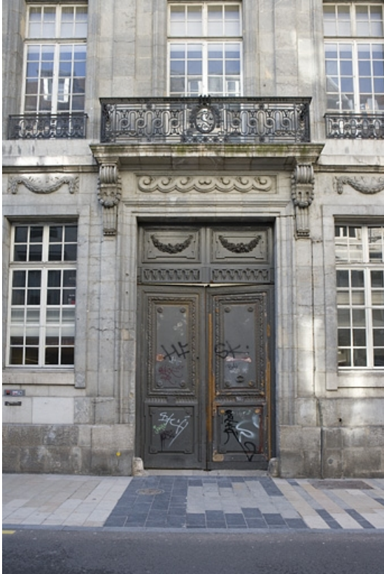
Détail du portail d'entrée, de face.

25, Besançon Grande Rue 68, lieudit : îlot Terrier de Santans