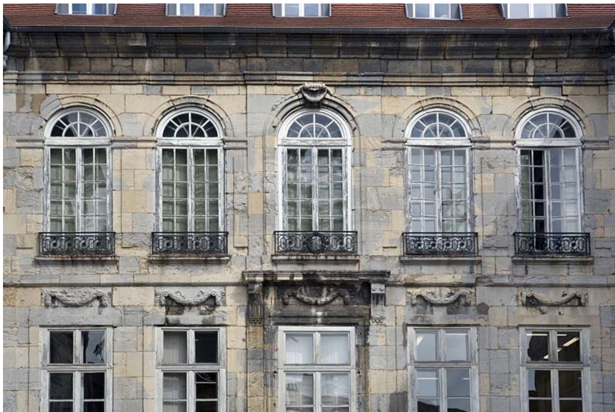
Façade postérieure du logis principal : détail de la partie centrale.

25, Besançon Grande Rue 68, lieudit : îlot Terrier de Santans