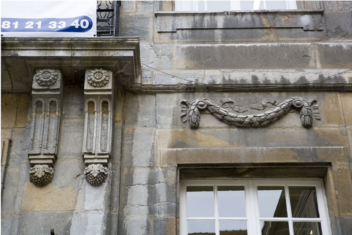
Détail d'une guirlande de feuillage décorant les façades sur cour.

25, Besançon Grande Rue 68, lieudit : îlot Terrier de Santans