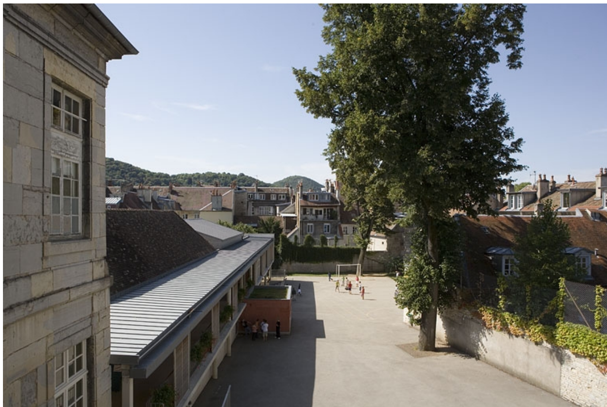
Vue d'ensemble de la cour de l'école, à l'emplacement de l'ancien jardin.

25, Besançon Grande Rue 68, lieudit : îlot Terrier de Santans