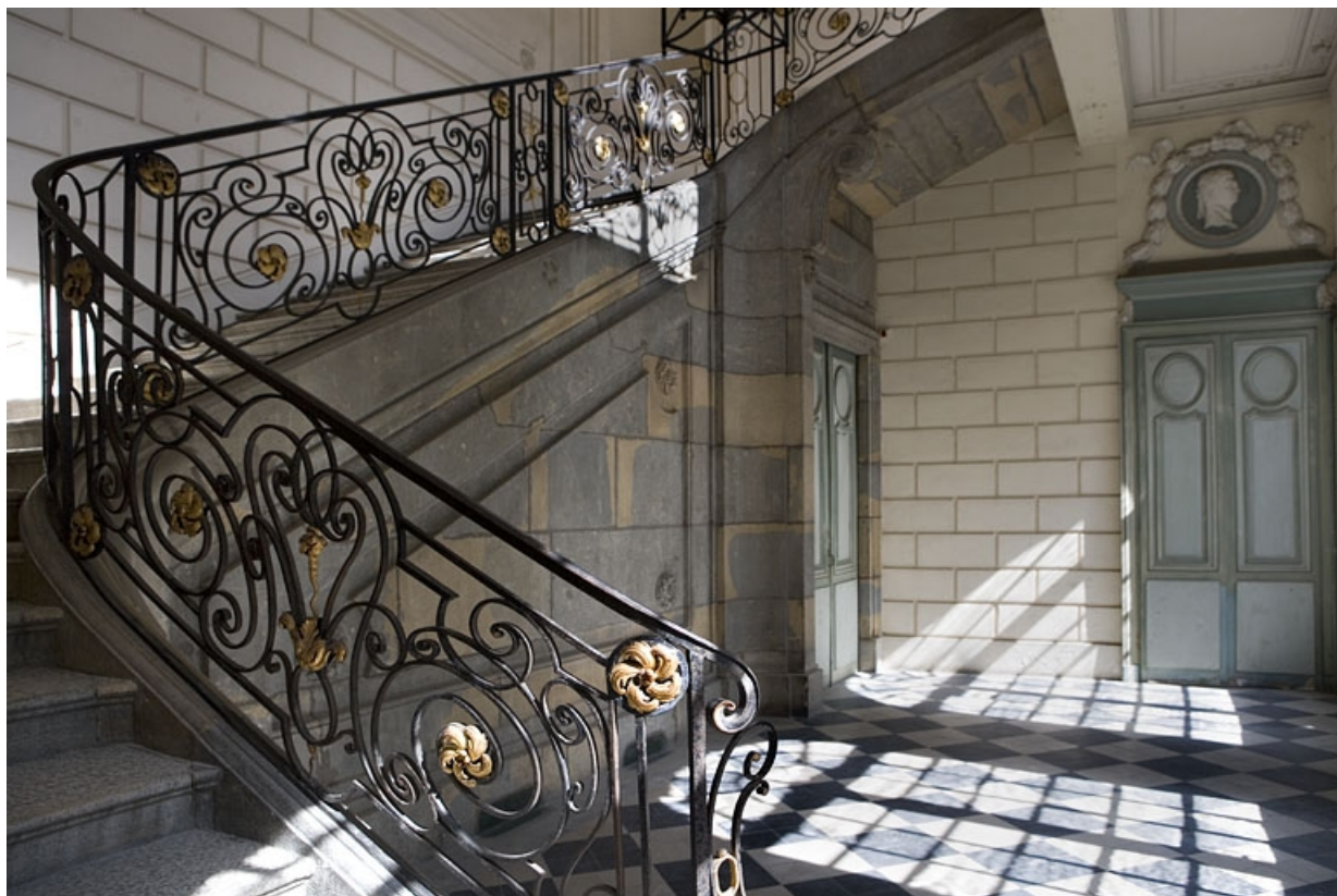
Escalier d'honneur : vue d'ensemble de la rampe en ferronnerie.

25, Besançon Grande Rue 68, lieudit : îlot Terrier de Santans