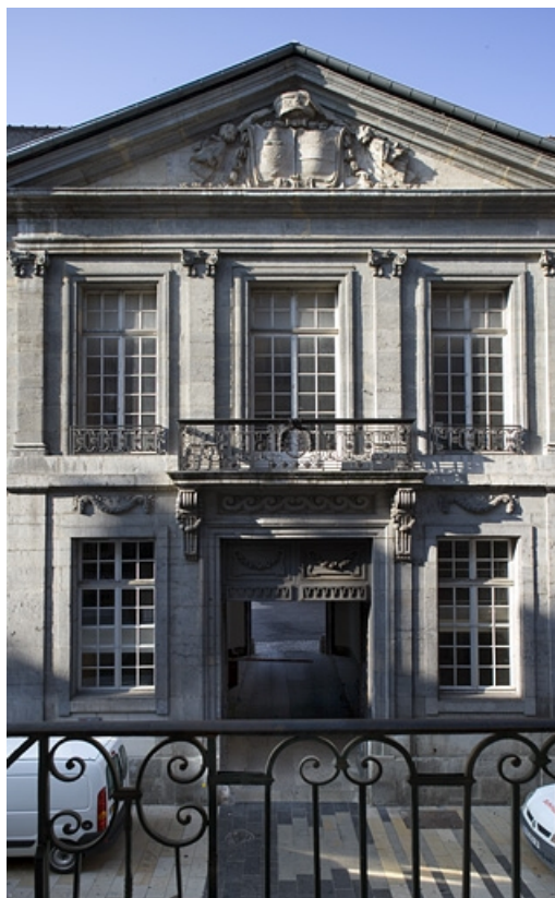
Vue d'ensemble de la partie centrale de la façade sur rue, de face.

25, Besançon Grande Rue 68, lieudit : îlot Terrier de Santans