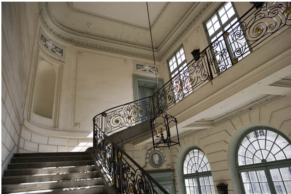
Escalier d'honneur : vue d'ensemble de la cage d'escalier depuis le haut de la dernière volée.

25, Besançon Grande Rue 68, lieudit : îlot Terrier de Santans