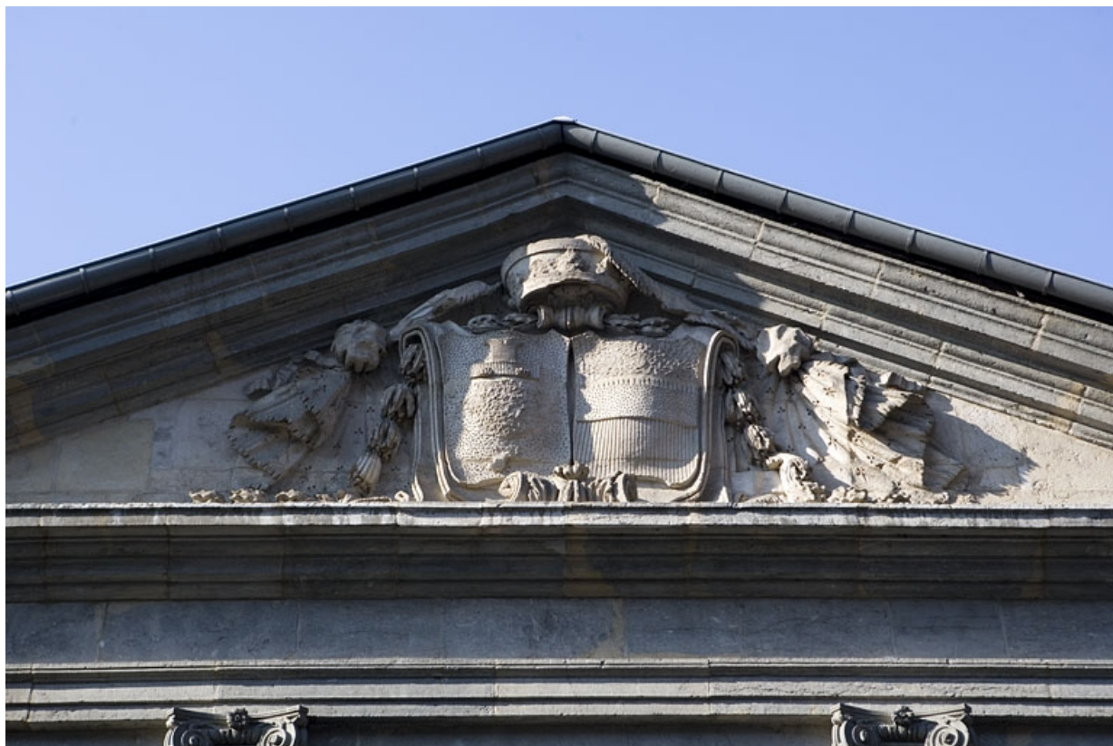
Détail des armoiries bûchées situées dans le fronton couronnant la façade sur rue.

25, Besançon Grande Rue 68, lieudit : îlot Terrier de Santans