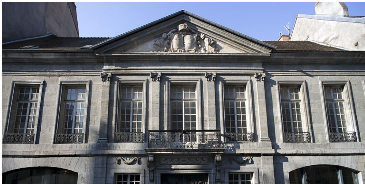
Vue d'ensemble du premier étage de la façade sur rue, de face.

25, Besançon Grande Rue 68, lieudit : îlot Terrier de Santans