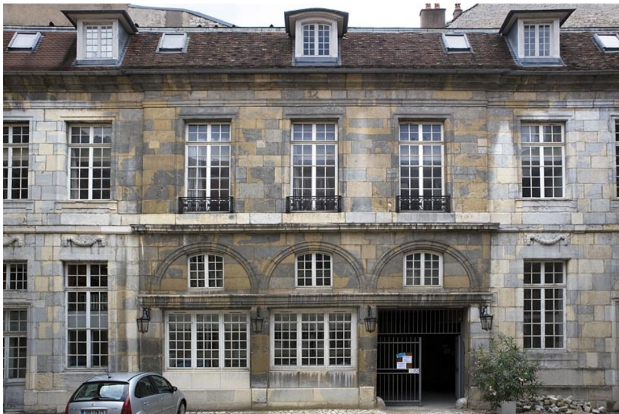
Aile à gauche de la cour d'honneur contenant le passage donnant sur la cour des communs.

25, Besançon Grande Rue 68, lieudit : îlot Terrier de Santans