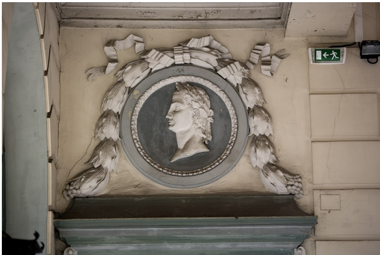
Escalier d'honneur, rez-de-chaussée : détail du dessus de porte gauche.

25, Besançon Grande Rue 68, lieudit : îlot Terrier de Santans