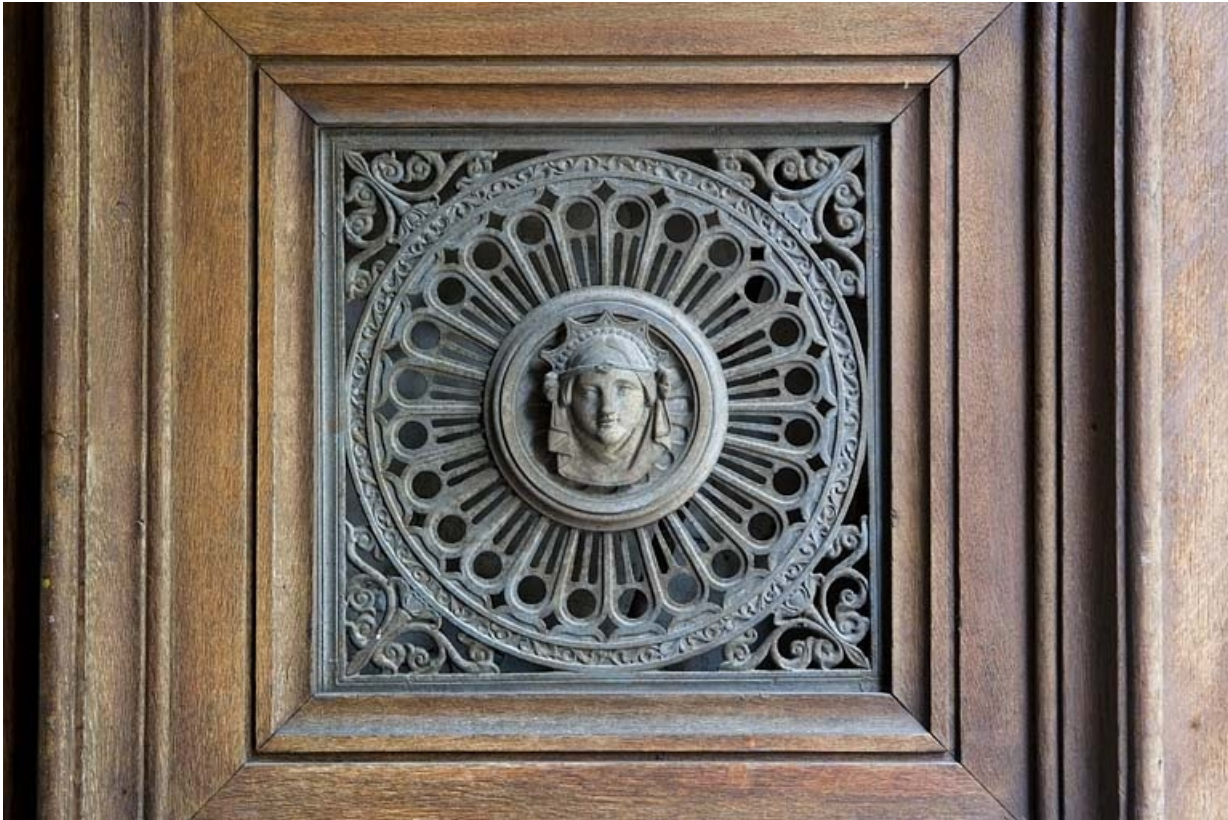
Détail du décor en fonte d'un des vantaux du portail d'entrée : tête de femme. 25, Besançon, 10 rue de la Préfecture, lieudit : îlot Terrier de Santans