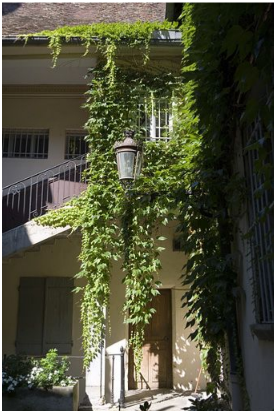
Vue de la partie droite de l'escalier à cage ouverte.

25, Besançon, 12 rue Pasteur, lieudit : îlot d' Anvers