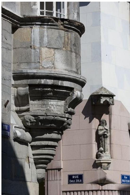
Détail de l'oriel, avec la niche d'angle de l'hôtel d'Hennezel.

25, Besançon, 12 rue Pasteur, lieudit : îlot d' Anvers