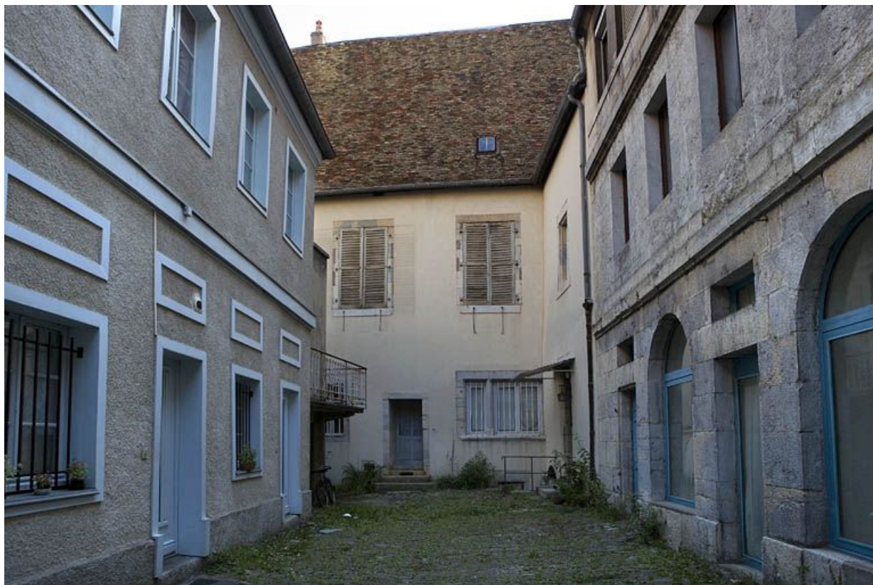
Vue de la cour des comuns depuis l'entrée.

25, Besançon, 12 rue Pasteur, lieudit : îlot d' Anvers