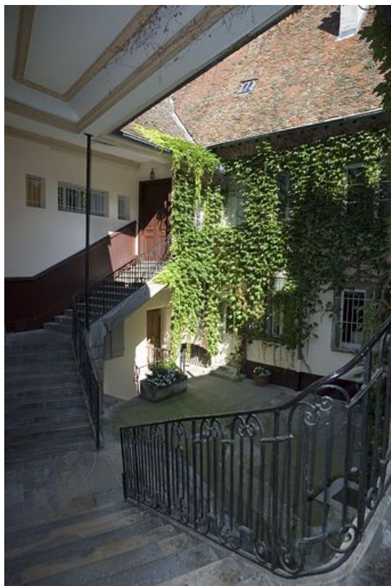
Vue de la cour depuis l'escalier à cage ouverte.

25, Besançon, 12 rue Pasteur, lieudit : îlot d' Anvers