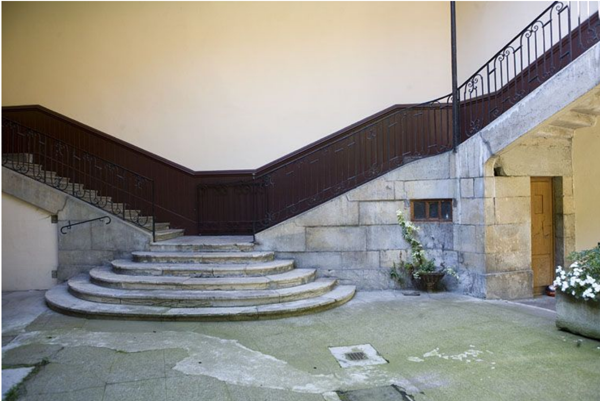
Détail du départ de l'escalier à cage ouverte.

25, Besançon, 12 rue Pasteur, lieudit : îlot d' Anvers