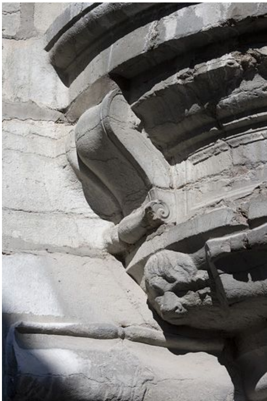
Détail d'une tête sur le culot de l'oriel.

25, Besançon, 12 rue Pasteur, lieudit : îlot d' Anvers