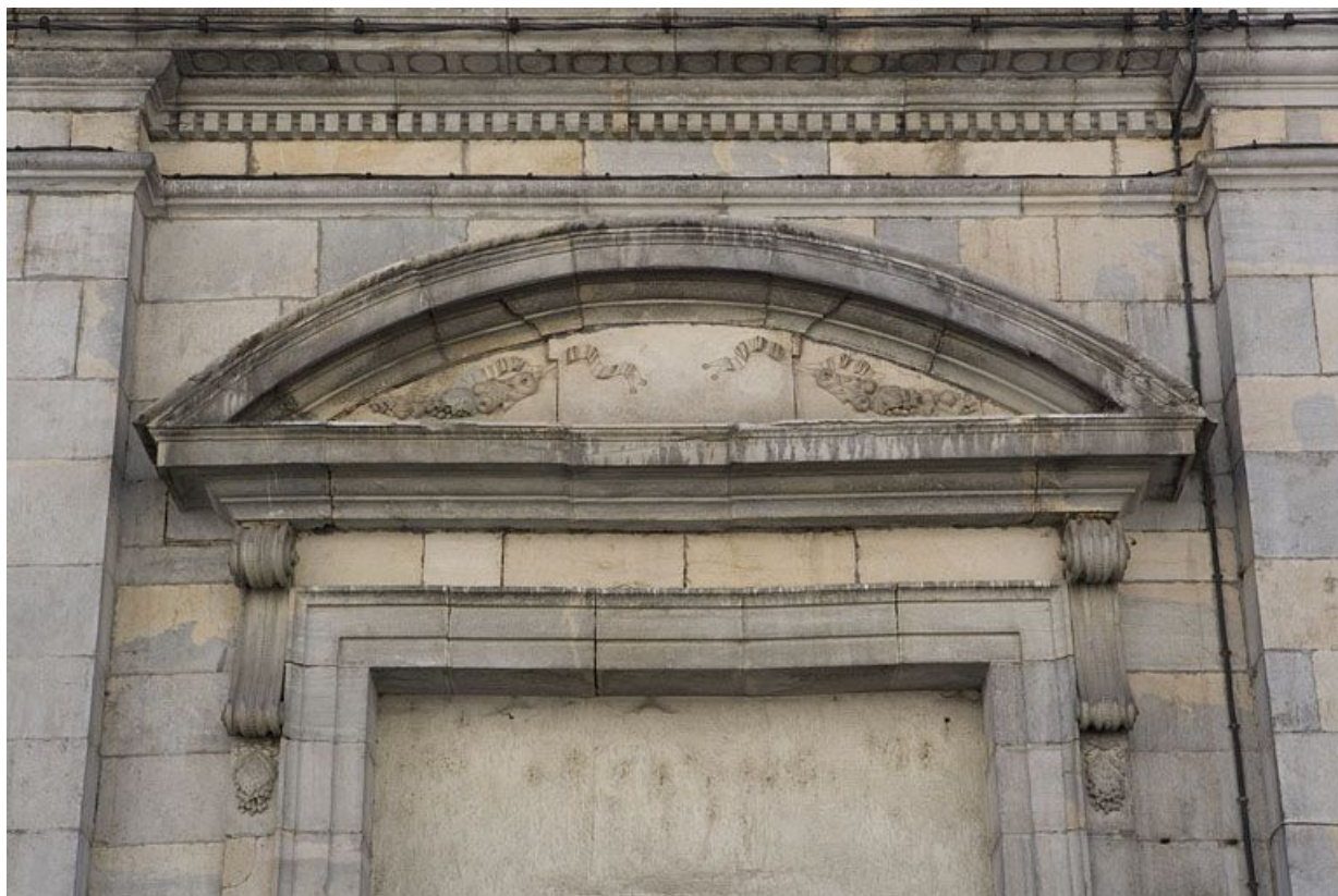
Détail du fronton cintré sur le portail d'entrée des communs.

25, Besançon, 12 rue Pasteur, lieudit : îlot d' Anvers