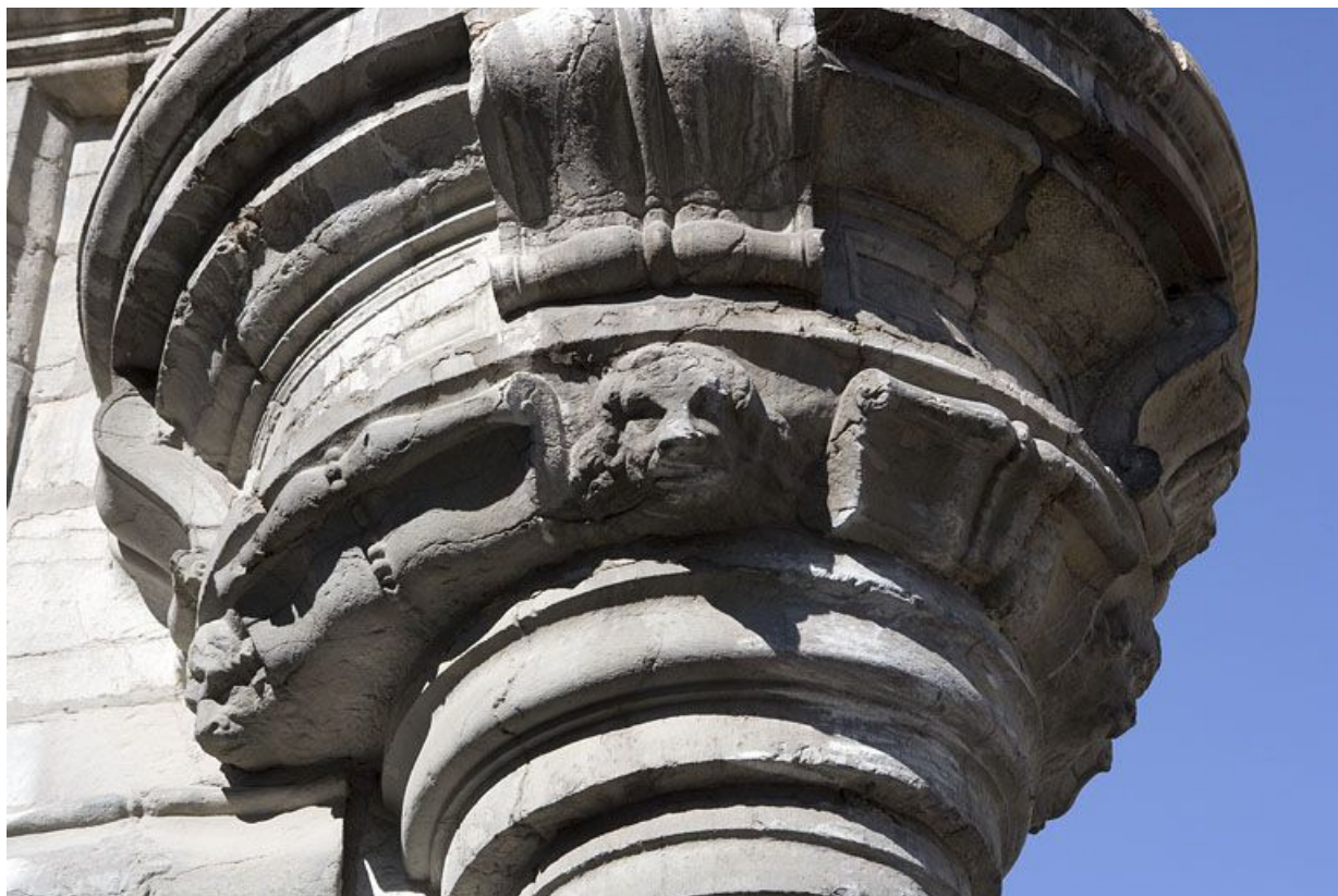
Détail du décor sur le culot de l'oriel.

25, Besançon, 12 rue Pasteur, lieudit : îlot d' Anvers