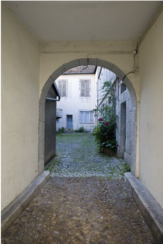
Vue de la cour des communs depuis le portail d'entrée.

25, Besançon, 12 rue Pasteur, lieudit : îlot d' Anvers