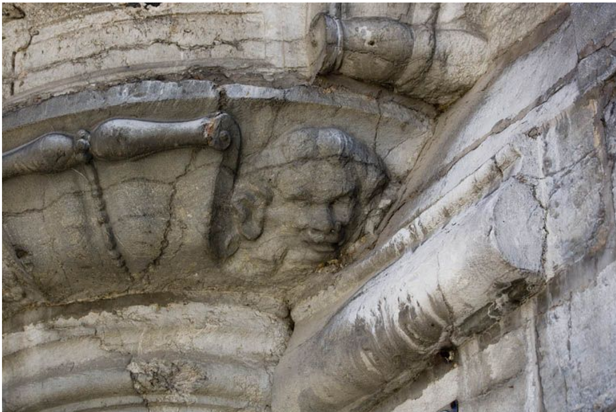
Détail d'une tête sur le culot de l'oriel.

25, Besançon, 12 rue Pasteur, lieudit : îlot d' Anvers