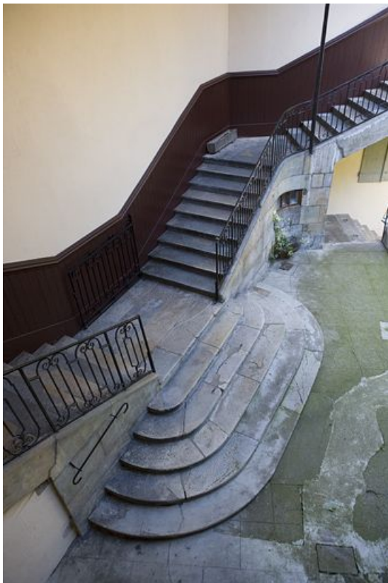
Vue de l'escalier à cage ouverte, en plongée.

25, Besançon, 12 rue Pasteur, lieudit : îlot d' Anvers