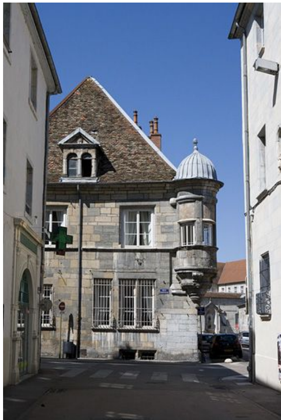
Vue d'une partie du logis principal, de face, depuis la rue d'Anvers.

25, Besançon, 12 rue Pasteur, lieudit : îlot d' Anvers