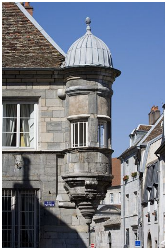
Détail de l'oriel, de face.

25, Besançon, 12 rue Pasteur, lieudit : îlot d' Anvers