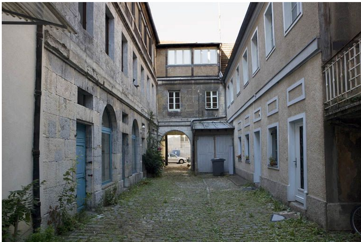
Vue de la cour des communs depuis le fond de l'espace libre.

25, Besançon, 12 rue Pasteur, lieudit : îlot d' Anvers