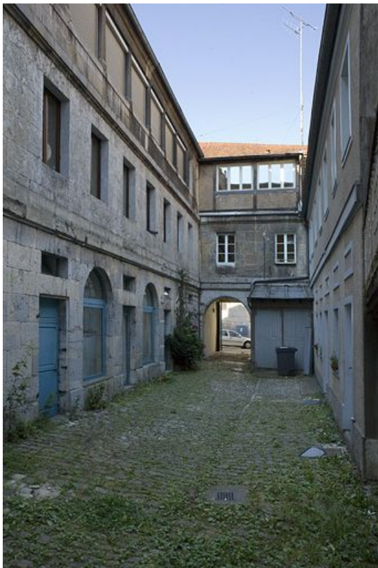
Vue d'ensemble de la cour des communs depuis le fond de l'espace libre.

25, Besançon, 12 rue Pasteur, lieudit : îlot d' Anvers