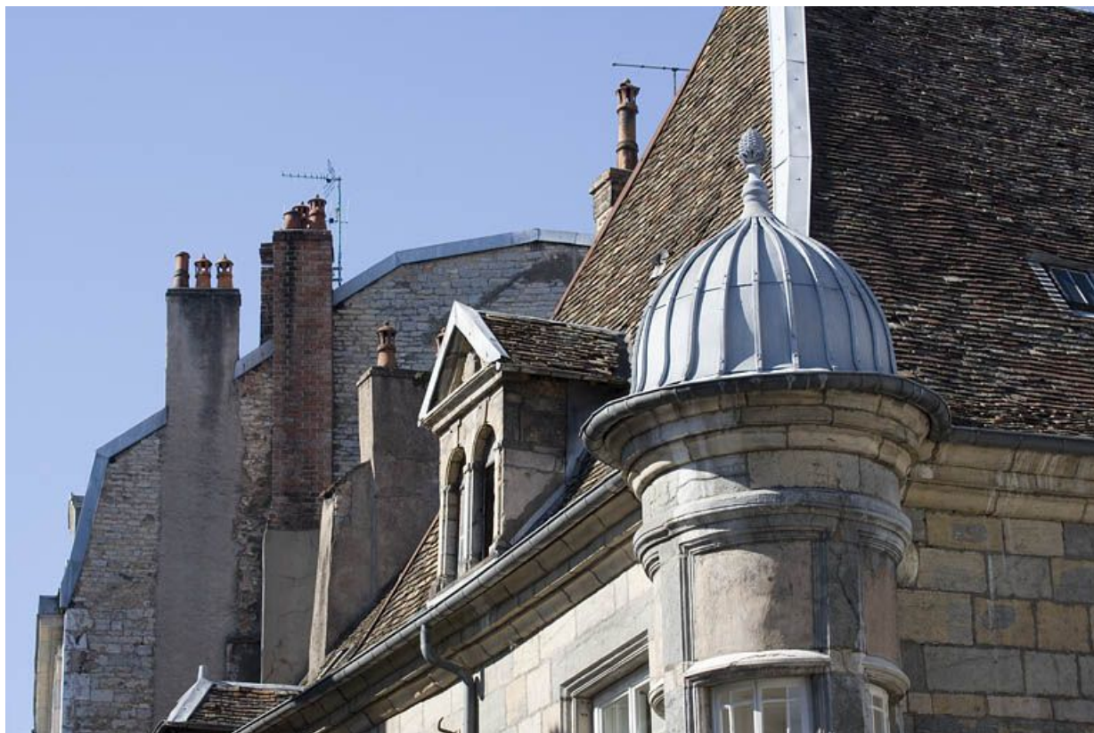
Détail des matériaux de couverture de l'oriel et du logis.

25, Besançon, 12 rue Pasteur, lieudit : îlot d' Anvers