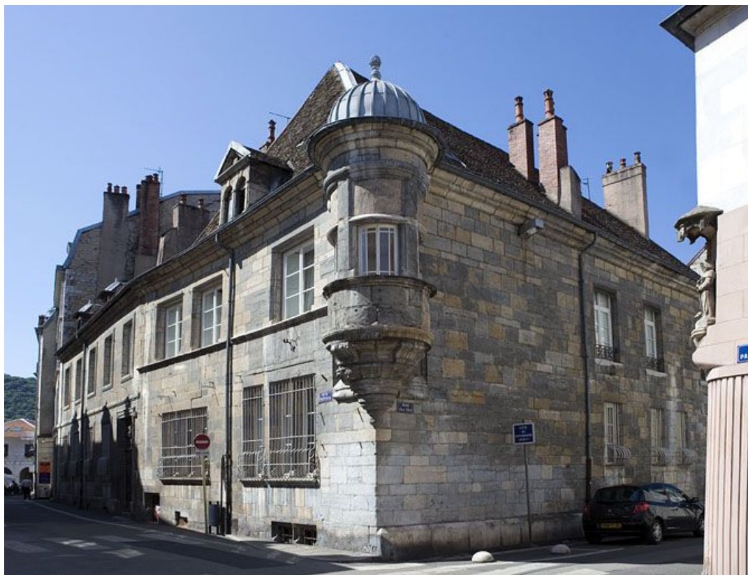
Vue d'ensemble du logis principal, de trois quarts droit.

25, Besançon, 12 rue Pasteur, lieudit : îlot d' Anvers