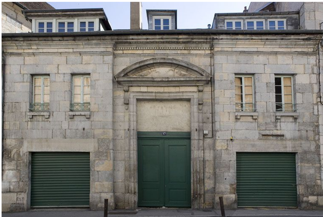
Vue d'ensemble du portail d'entrée des communes depuis la rue du Lycée.

25, Besançon, 12 rue Pasteur, lieudit : îlot d' Anvers