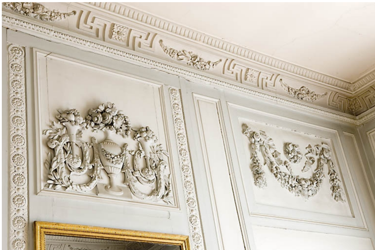
Détail des décors au-dessus de la cheminée et d'une porte : chambre à gauche du salon. 25, Besançon, 7 rue Charles Nodier, lieudit : îlot Banque de France