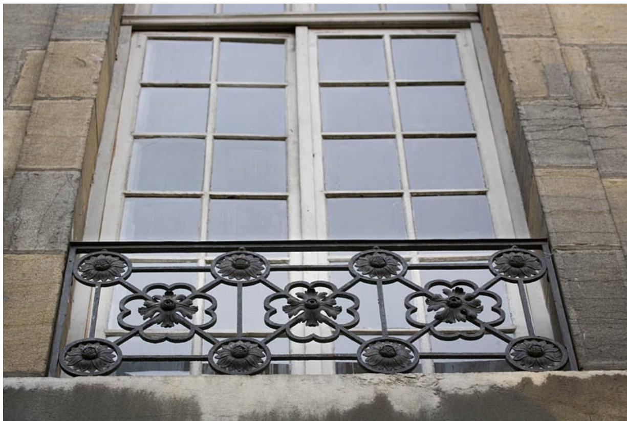
Détail de la ferronnerie d'un garde corps d'une fenêtre du logis principal au premier étage sur cour.

25, Besançon, 7 rue Charles Nodier, lieudit : îlot Banque de France