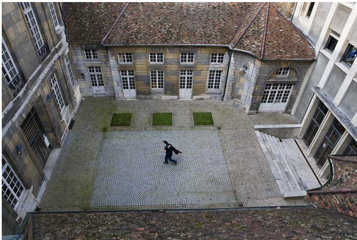
Vue d'ensemble de l'aile des communs à gauche de la cour.

25, Besançon, 7 rue Charles Nodier, lieudit : îlot Banque de France