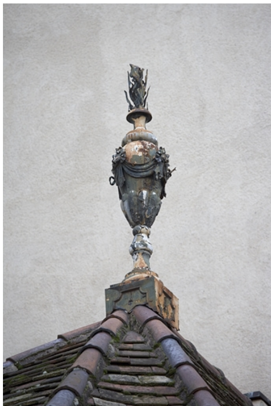
Détail d'un épi de faîtage sur l' une des toiture des communs.

25, Besançon, 7 rue Charles Nodier, lieudit : îlot Banque de France