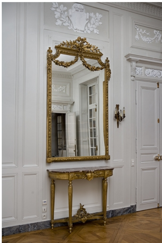
Détail du miroir et de la console situés dans l'antichambre.

25, Besançon, 7 rue Charles Nodier, lieudit : îlot Banque de France