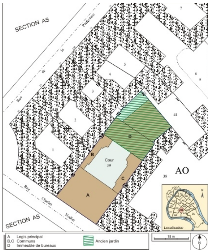
Plan masse et de situation. Extrait du plan cadastral, 1993, section AO. 25, Besançon, 7 rue Charles Nodier, lieudit : îlot Banque de France