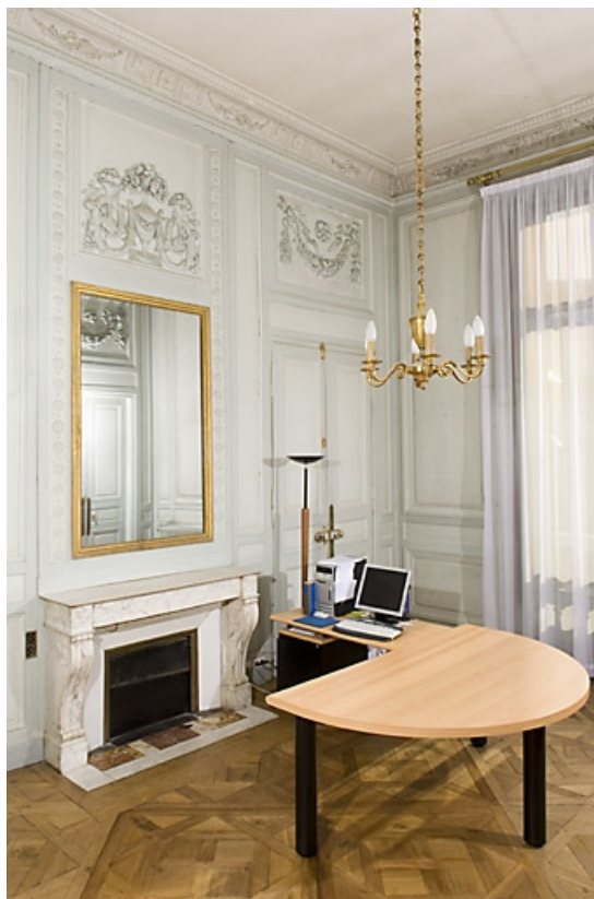
Détail de la cheminée de la chambre à gauche du salon.

25, Besançon, 7 rue Charles Nodier, lieudit : îlot Banque de France