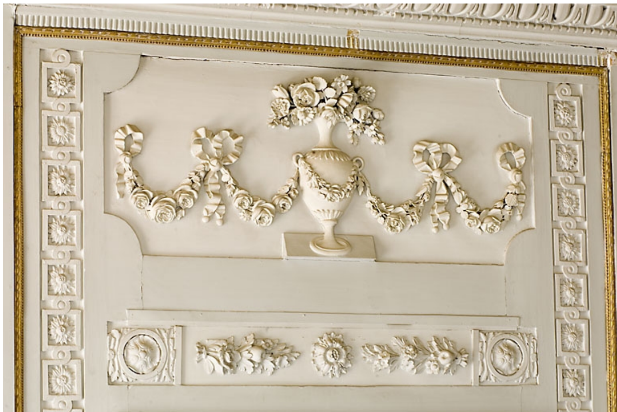
Détail d'un décor au-dessus d'une glace du salon.

25, Besançon, 7 rue Charles Nodier, lieudit : îlot Banque de France