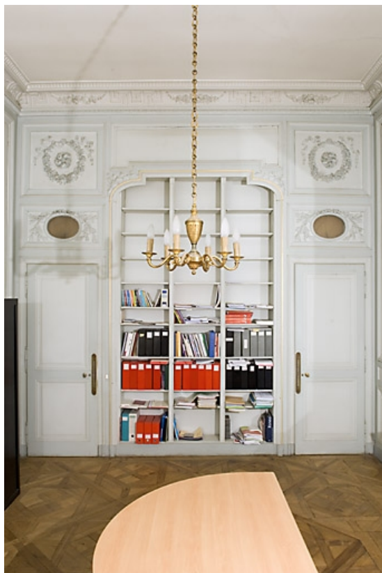
Détail de l'ancienne l'alcove de la chambre à gauche du salon. 25, Besançon, 7 rue Charles Nodier, lieudit : îlot Banque de France