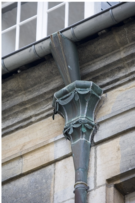
Détail d'une cuvette de descente des eaux sur la façade postérieure du logis principal. 25, Besançon, 7 rue Charles Nodier, lieudit : îlot Banque de France