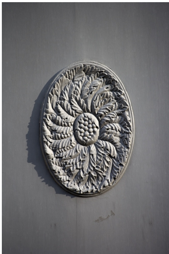
Détail d'un décor sur l'un des vantaux du portail d'entrée.

25, Besançon, 7 rue Charles Nodier, lieudit : îlot Banque de France