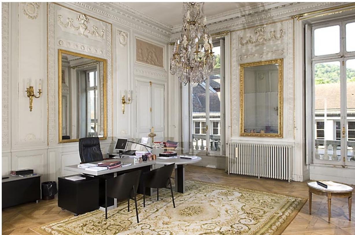
Vue d'ensemble du salon depuis l'entrée.

25, Besançon, 7 rue Charles Nodier, lieudit : îlot Banque de France