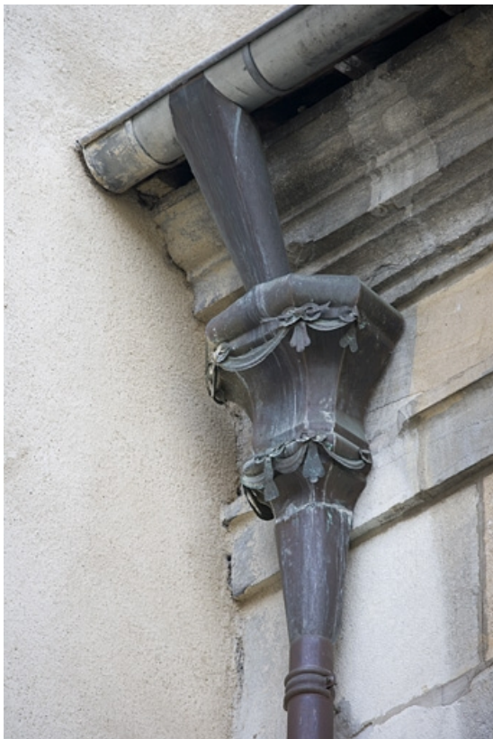
Détail d'une cuvette de descente des eaux sur la façade postérieure du logis principal. 25, Besançon, 7 rue Charles Nodier, lieudit : îlot Banque de France