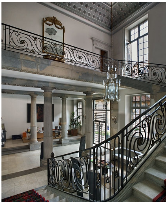
Vue d'ensemble de l'escalier d'honneur depuis le premier palier. 25, Besançon, 7 rue Charles Nodier, lieudit : îlot Banque de France