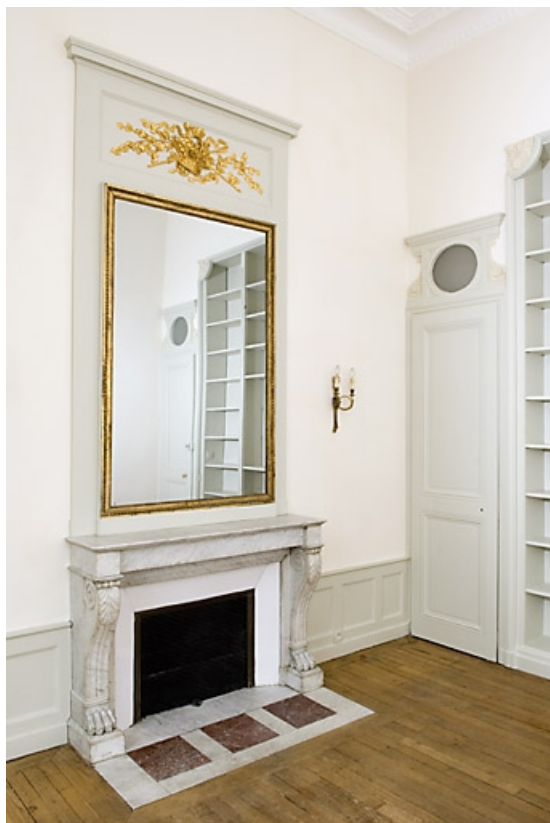
Détail de la cheminée de la chambre à droite du salon.

25, Besançon, 7 rue Charles Nodier, lieudit : îlot Banque de France