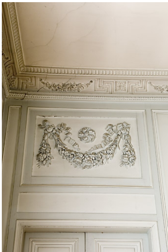
Détail du décor au-dessus d'une porte de la chambre à gauche du salon.

25, Besançon, 7 rue Charles Nodier, lieudit : îlot Banque de France