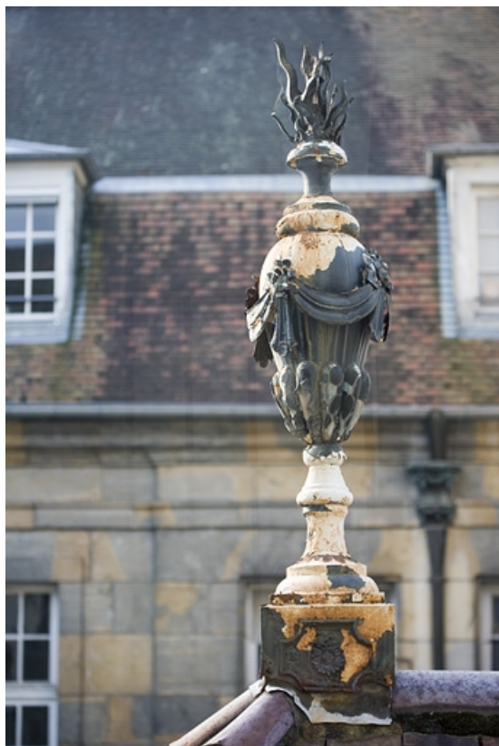
Détail d'un épi de faîtage sur le bâtiment droit des communs. 25, Besançon, 7 rue Charles Nodier, lieudit : îlot Banque de France