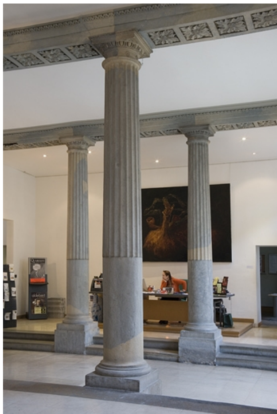
Vue d'ensemble de l'entrée depuis la cage d'escalier.

25, Besançon, 7 rue Charles Nodier, lieudit : îlot Banque de France