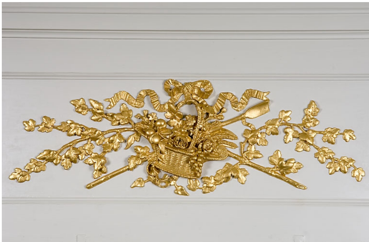
Détail du décor au-dessus de la glace de la cheminée : chambre à droite du salon.

25, Besançon, 7 rue Charles Nodier, lieudit : îlot Banque de France