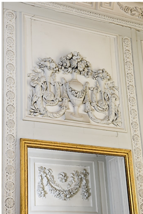
Détail du décor au-dessus d'une des glaces du salon.

25, Besançon, 7 rue Charles Nodier, lieudit : îlot Banque de France