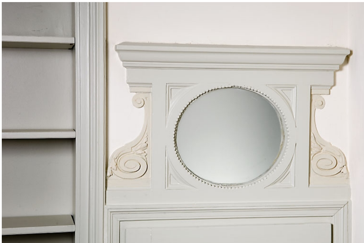
Détail du dessus de porte à droite de l'alcove : chambre à droite du salon.

25, Besançon, 7 rue Charles Nodier, lieudit : îlot Banque de France