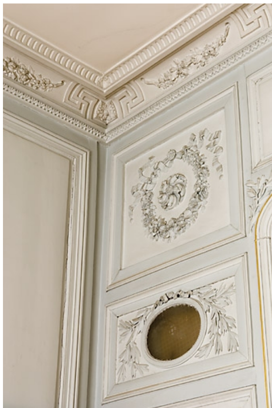
Détail du décor au-dessus de la porte à gauche de l'alcove : chambre à gauche du salon. 25, Besançon, 7 rue Charles Nodier, lieudit : îlot Banque de France