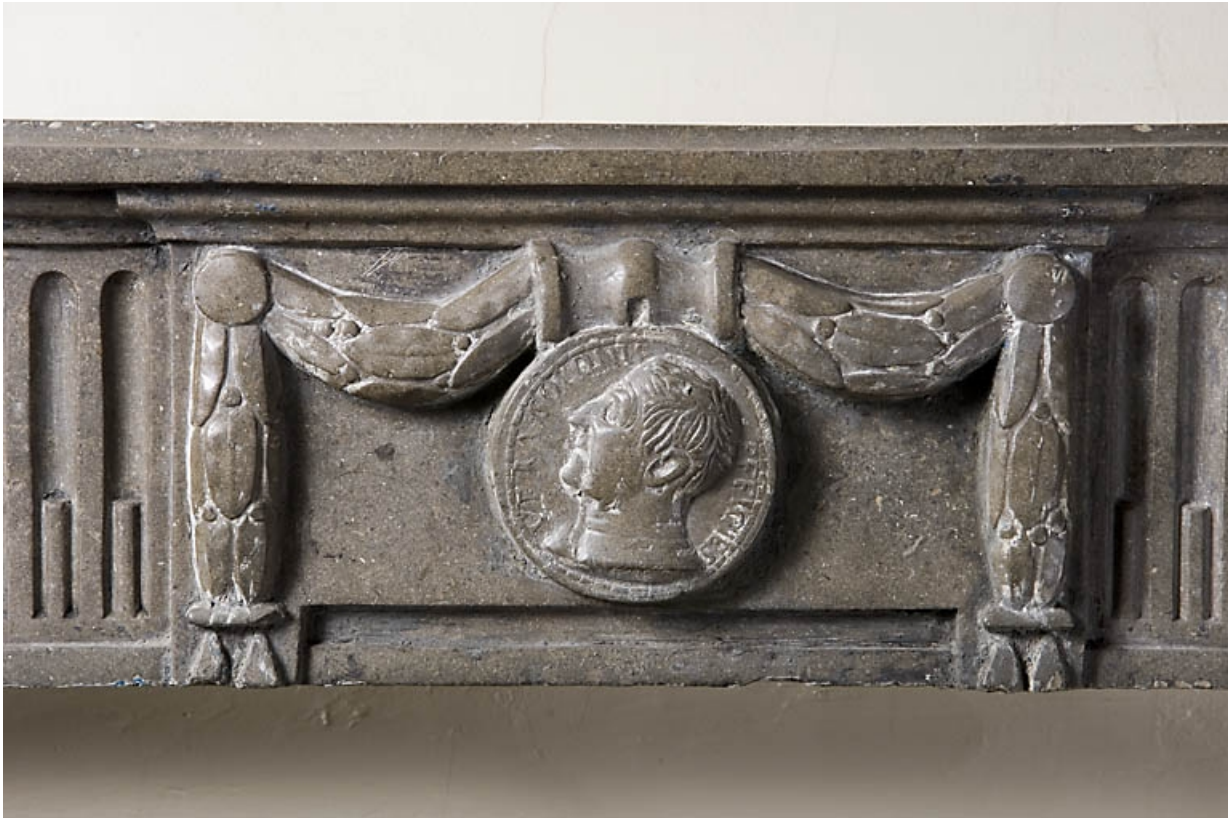
Détail du décor d'une cheminée : pièce au rez-de-chaussée.

25, Besançon, 9, 9 bis rue Charles Nodier, lieudit : îlot Banque de France