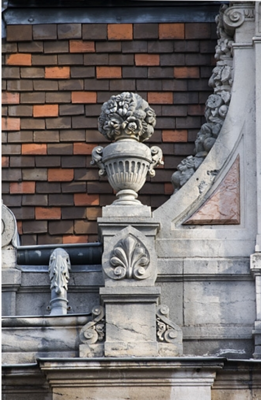
Détail de l'aileron gauche d'une lucarne.

25, Besançon, 9, 9 bis rue Charles Nodier, lieudit : îlot Banque de France