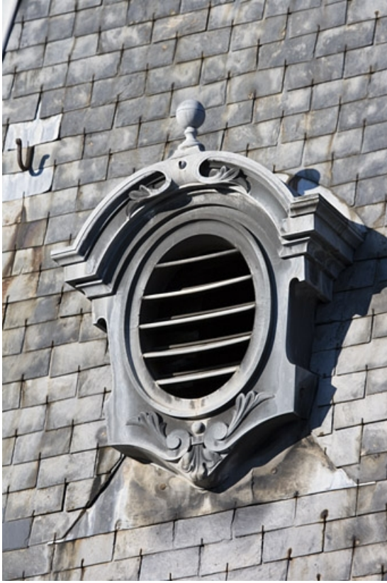
Détail d'une lucarne sur la toiture de la tourelle d'escalier.

25, Besançon, 9, 9 bis rue Charles Nodier, lieudit : îlot Banque de France