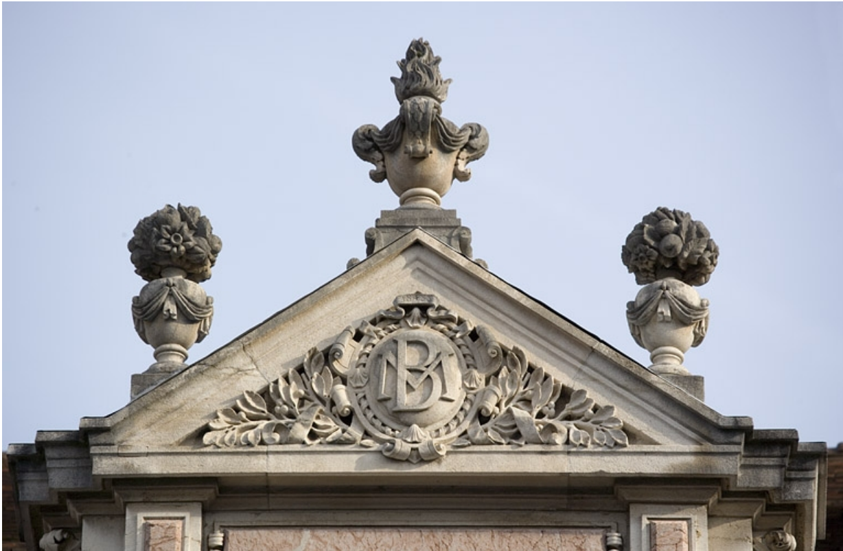
Détail du fronton d'une lucarne.

25, Besançon, 9, 9 bis rue Charles Nodier, lieudit : îlot Banque de France