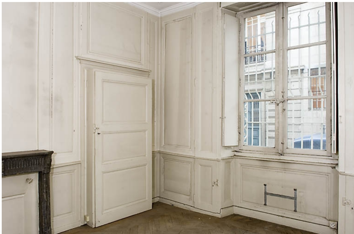
Détail d'une porte dans une pièce du rez-de-chaussée sur rue.

25, Besançon, 9, 9 bis rue Charles Nodier, lieudit : îlot Banque de France