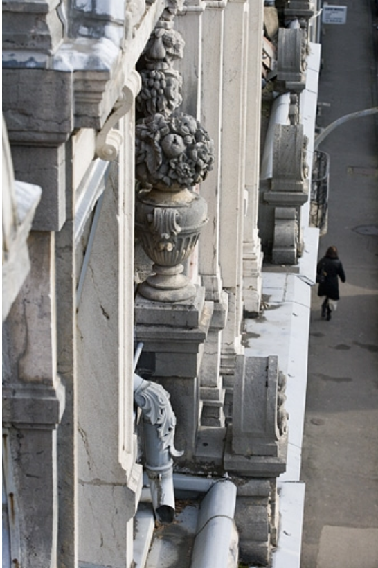
Détail d'un pot à fleurs décorant la façade sur rue : de profil.

25, Besançon, 9, 9 bis rue Charles Nodier, lieudit : îlot Banque de France