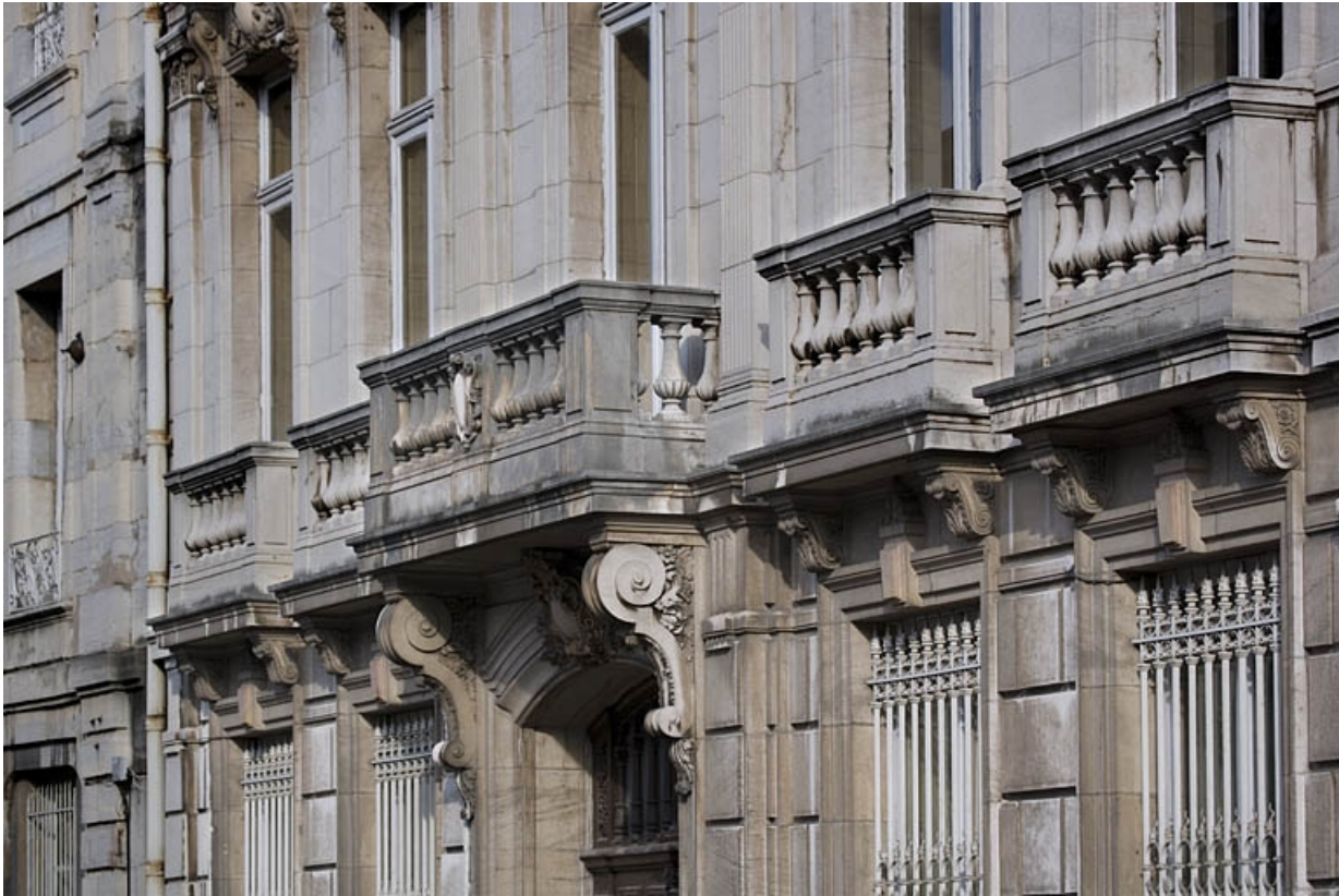
Détail des garde-corps et du balcon du premier étage sur rue.

25, Besançon, 9, 9 bis rue Charles Nodier, lieudit : îlot Banque de France