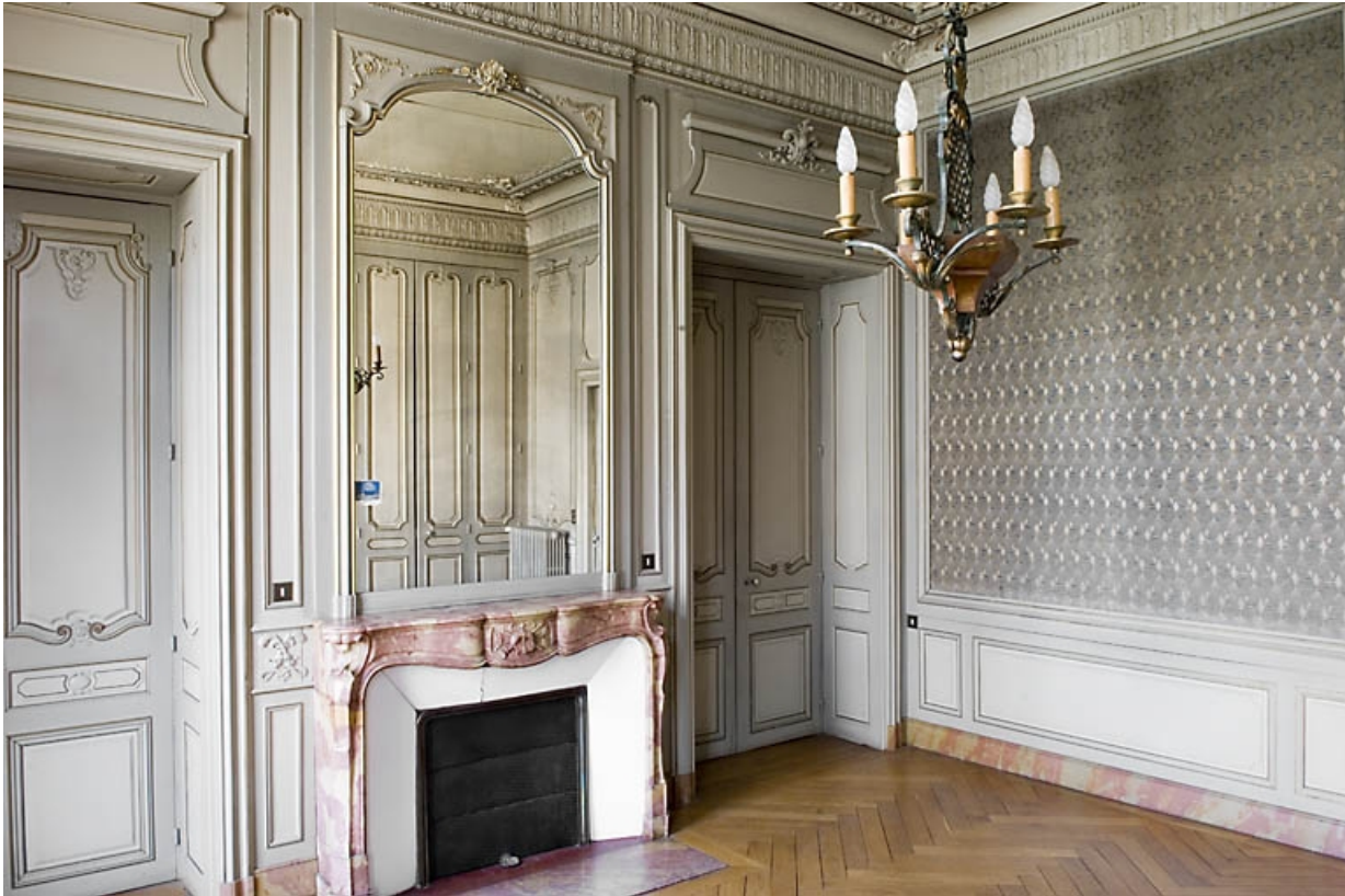
Pièce à gauche du grand salon, vue d'angle avec la cheminée.

25, Besançon, 9, 9 bis rue Charles Nodier, lieudit : îlot Banque de France