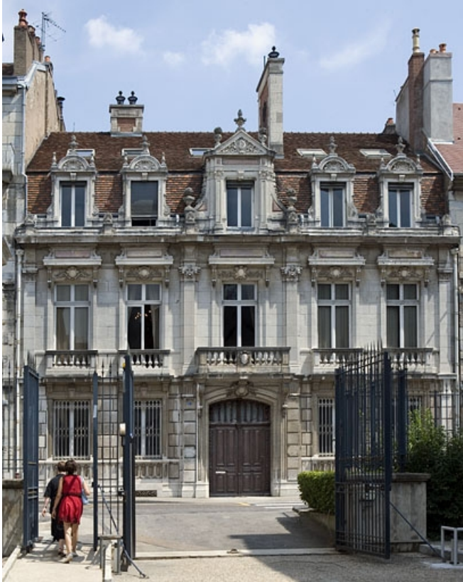
Vue d'ensemble de la façade sur rue, 9 bis rue Charles Nodier, de face.

25, Besançon, 7 rue Charles Nodier, lieudit : îlot Banque de France