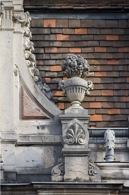
Détail de l'aileron droit d'une lucarne.

25, Besançon, 9, 9 bis rue Charles Nodier, lieudit : îlot Banque de France