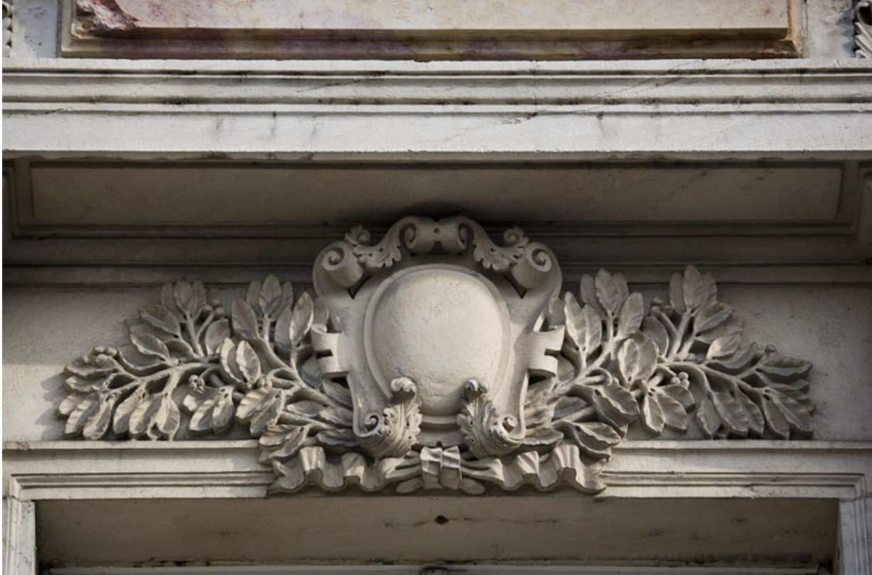
Détail du décor sculpté sur l'une des fenêtres du premier étage.

25, Besançon, 9, 9 bis rue Charles Nodier, lieudit : îlot Banque de France