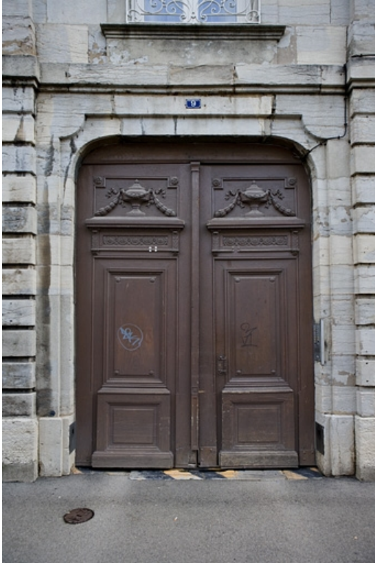
Détail du portail d'entrée, 9 rue Charles Nodier.

25, Besançon, 9, 9 bis rue Charles Nodier, lieudit : îlot Banque de France