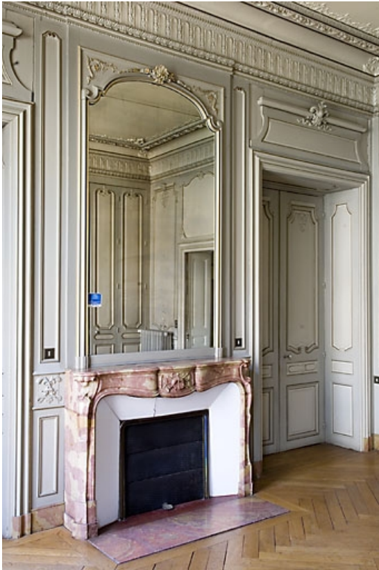
Pièce à gauche du grand salon, vue de la cheminée.

25, Besançon, 9, 9 bis rue Charles Nodier, lieudit : îlot Banque de France