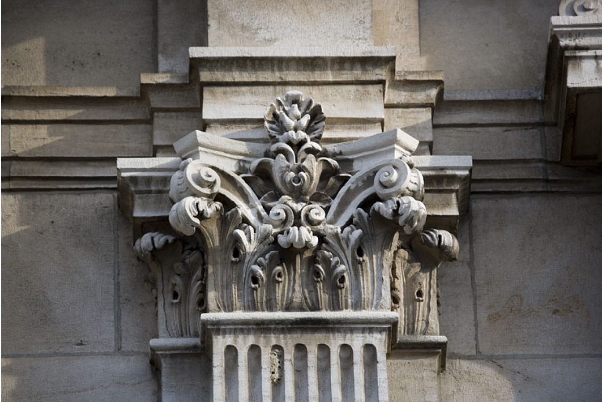
Détail d'un chapiteau sur la façade sur rue.

25, Besançon, 9, 9 bis rue Charles Nodier, lieudit : îlot Banque de France