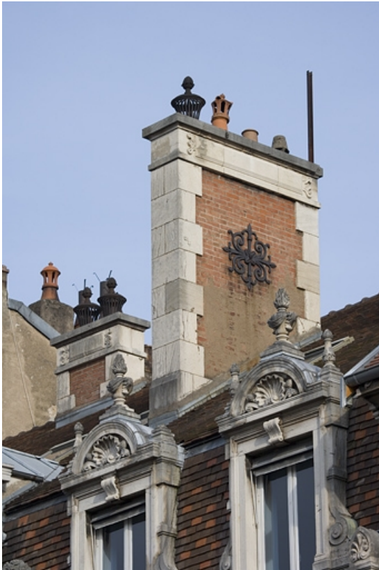
Détail d'une souche de cheminée.

25, Besançon, 9, 9 bis rue Charles Nodier, lieudit : îlot Banque de France