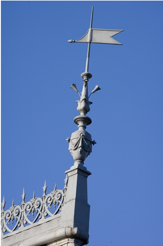
Détail d'un épi de faîtage sur la tourelle de l'escalier.

25, Besançon, 9, 9 bis rue Charles Nodier, lieudit : îlot Banque de France