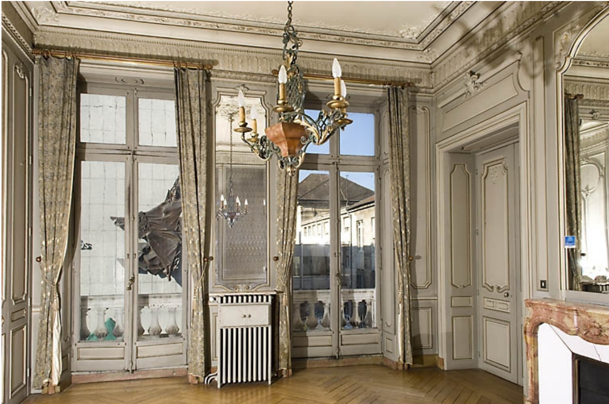
Pièce à gauche du grand salon, vue d'ensemble depuis l'entrée.

25, Besançon, 9, 9 bis rue Charles Nodier, lieudit : îlot Banque de France