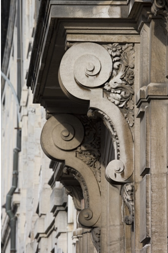
Détail des supports en forme de volutes soutenant le balcon du premier étage.

25, Besançon, 9, 9 bis rue Charles Nodier, lieudit : îlot Banque de France