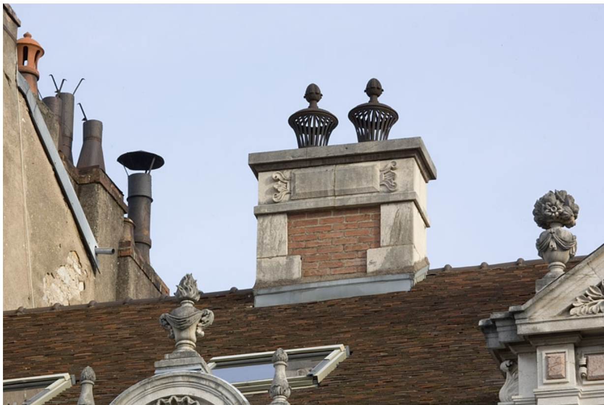
Détail d'une souche de cheminée.

25, Besançon, 9, 9 bis rue Charles Nodier, lieudit : îlot Banque de France