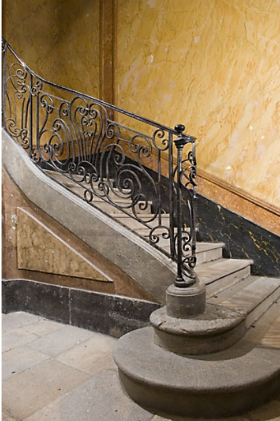
Vue du départ de l'escalier.

25, Besançon, 9, 9 bis rue Charles Nodier, lieudit : îlot Banque de France