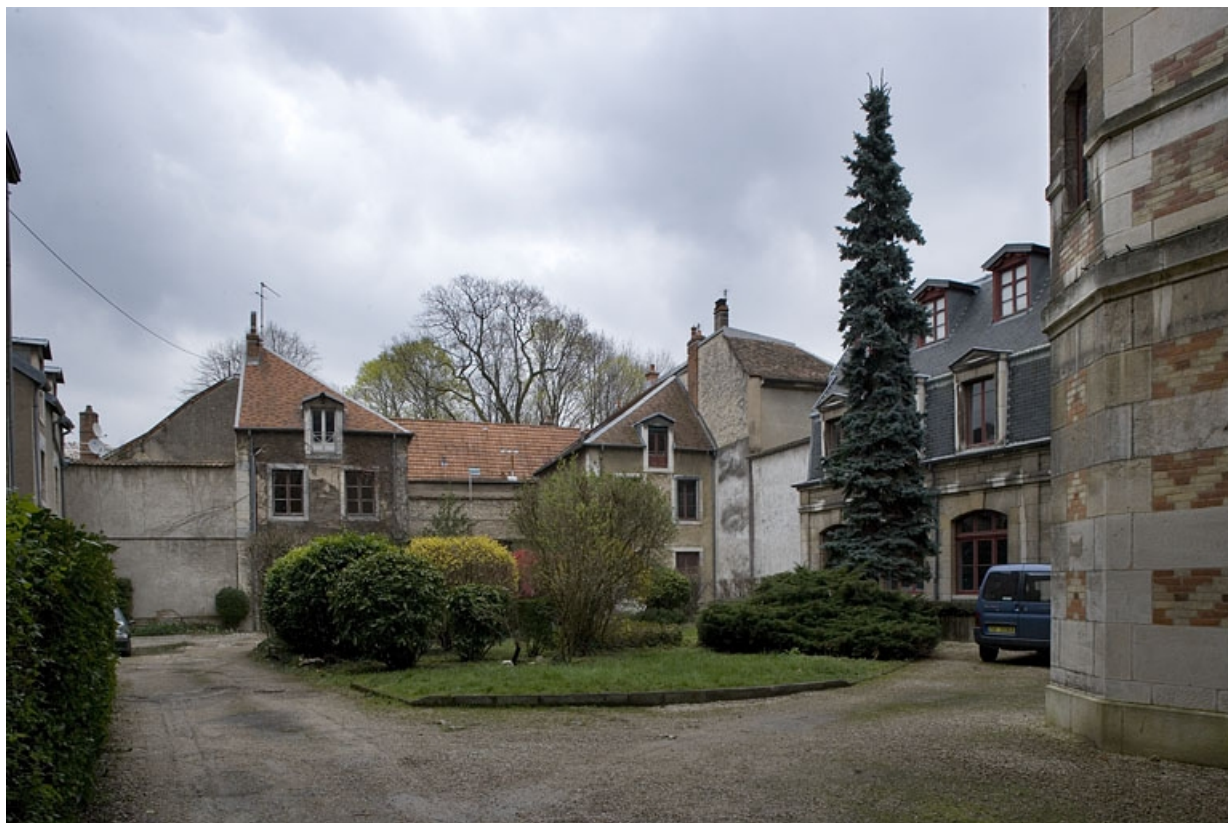
Vue d'ensemble de la cour, depuis l'entrée.

25, Besançon, 9, 9 bis rue Charles Nodier, lieudit : îlot Banque de France