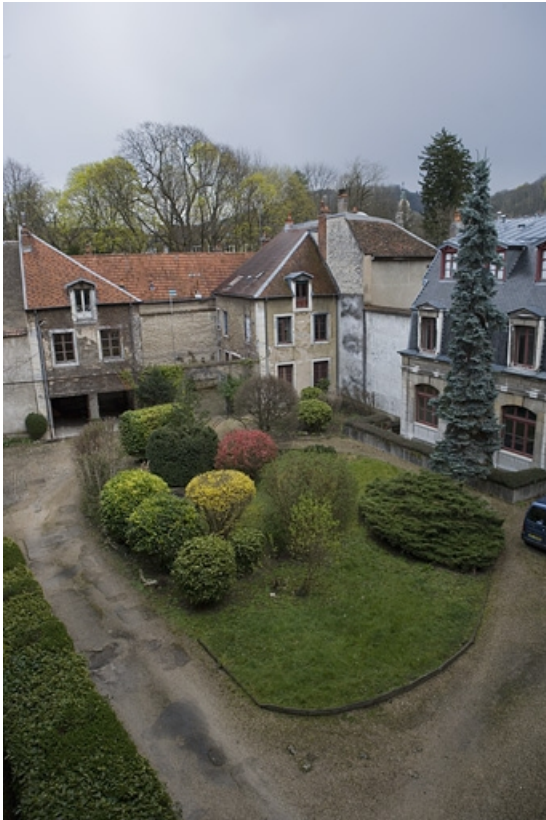
Vue d'ensemble de la cour depuis le logis principal.

25, Besançon, 9, 9 bis rue Charles Nodier, lieudit : îlot Banque de France