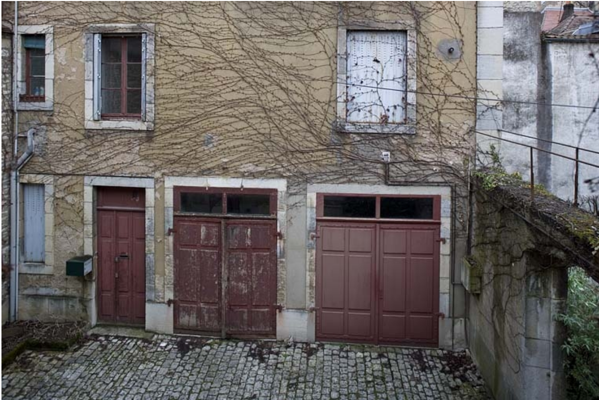
Détail du rez-de-chaussée des communs, à droite de la deuxième cour.

25, Besançon, 9, 9 bis rue Charles Nodier, lieudit : îlot Banque de France