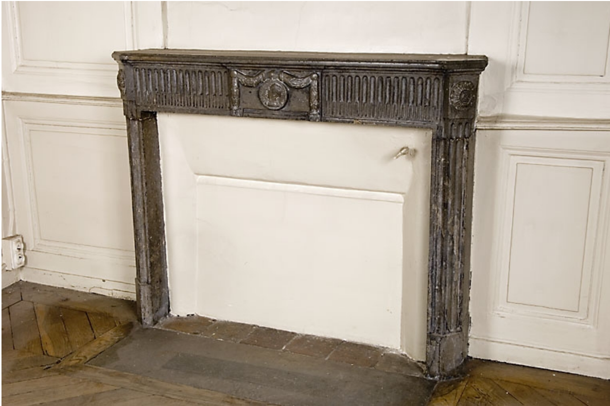
Détail d'une cheminée : pièce au rez-de-chaussée.

25, Besançon, 9, 9 bis rue Charles Nodier, lieudit : îlot Banque de France