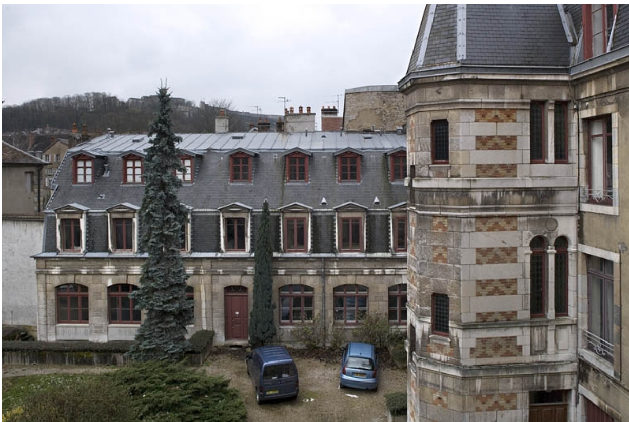
Vue d'ensemble de l'aile droite sur cour, de face.

25, Besançon, 9, 9 bis rue Charles Nodier, lieudit : îlot Banque de France