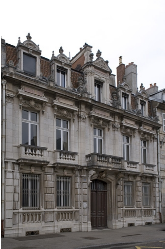
Vue d'ensemble de la façade sur rue, 9 bis rue Charles Nodier, de trois quarts gauche.

25, Besançon, 9, 9 bis rue Charles Nodier, lieudit : îlot Banque de France