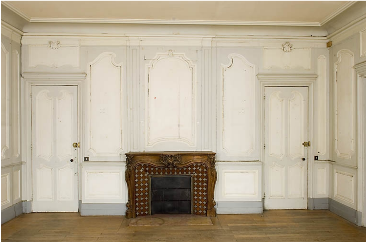
Pièce au rez-de-chaussée, à droite du passage cocher : vue de face avec la cheminée.

25, Besançon, 9, 9 bis rue Charles Nodier, lieudit : îlot Banque de France