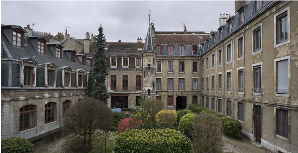
Vue d'ensemble des bâtiments sur cour depuis le fond de la parcelle.

25, Besançon, 9, 9 bis rue Charles Nodier, lieudit : îlot Banque de France