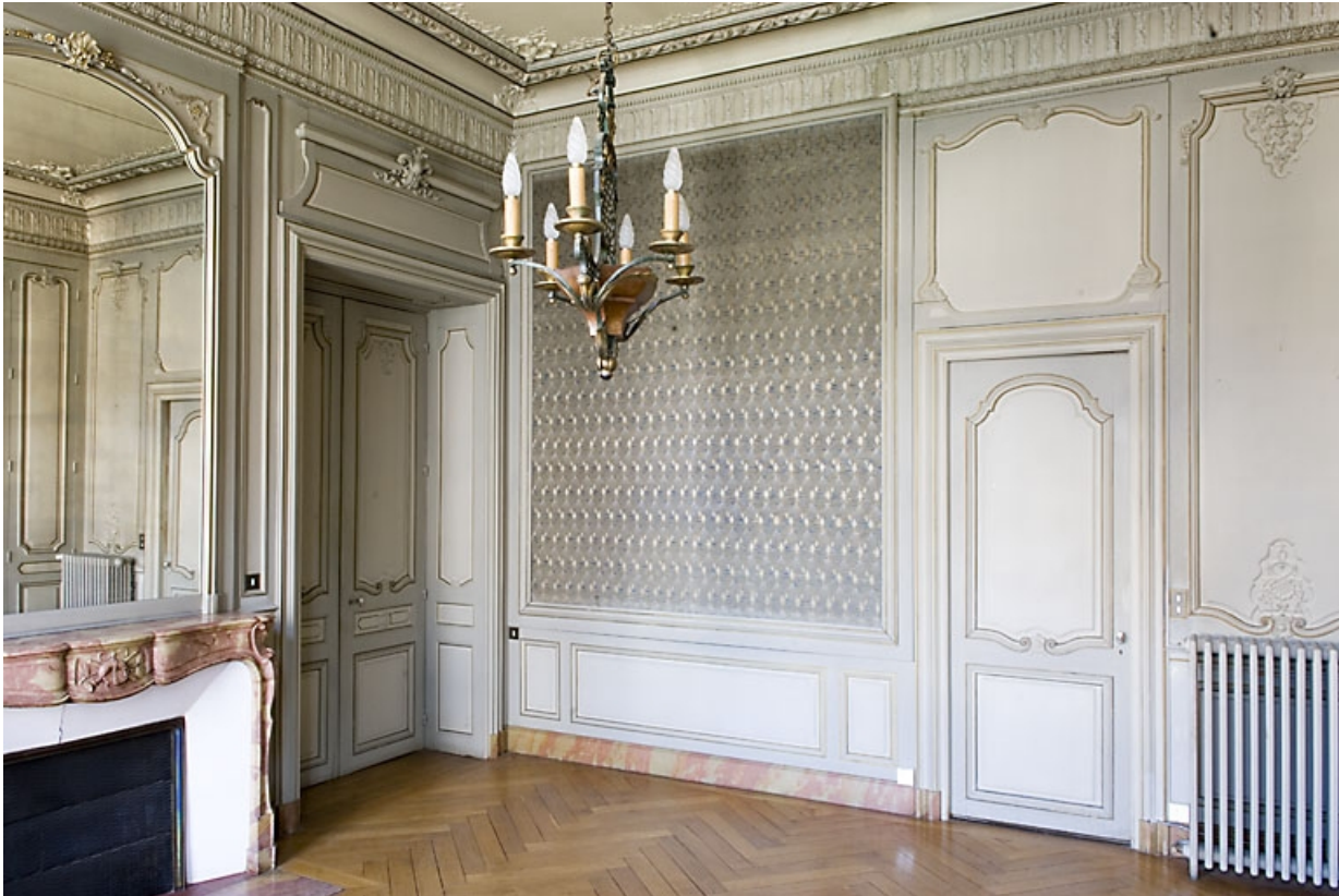
Pièce à gauche du grand salon, vue d'angle depuis le fond.

25, Besançon, 9, 9 bis rue Charles Nodier, lieudit : îlot Banque de France