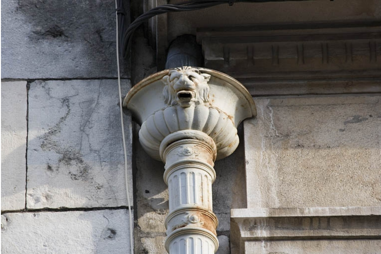
Détail d'une cuvette de descente des eaux.

25, Besançon, 9, 9 bis rue Charles Nodier, lieudit : îlot Banque de France