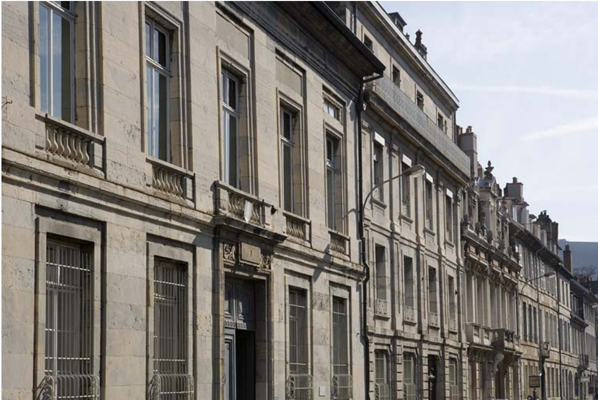
Vue rapprochée de la façade sur rue de trois quarts gauche.

25, Besançon, 7 rue Charles Nodier, lieudit : îlot Banque de France