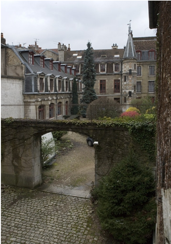
Vue d'ensemble des bâtiments depuis la cour des communs.

25, Besançon, 9, 9 bis rue Charles Nodier, lieudit : îlot Banque de France