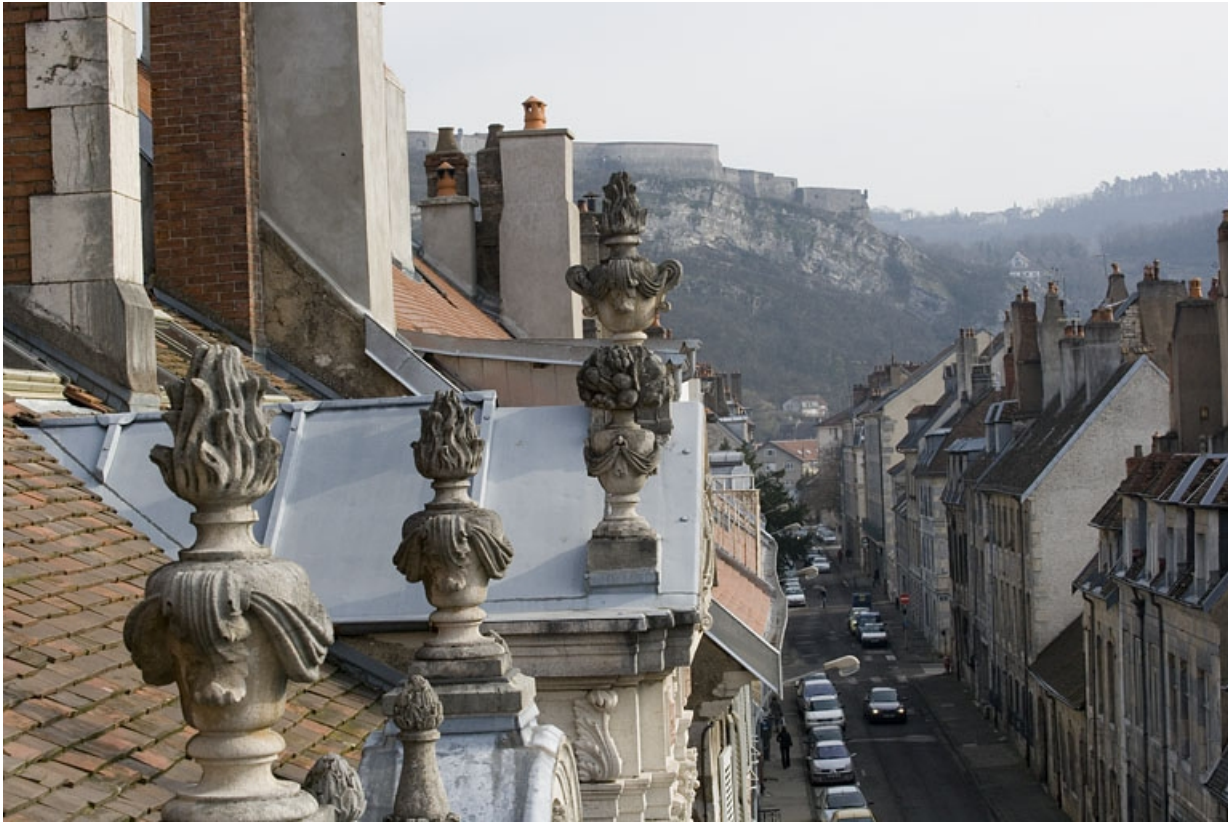
Détail des pots à feu décorant la façade sur rue.

25, Besançon, 9, 9 bis rue Charles Nodier, lieudit : îlot Banque de France