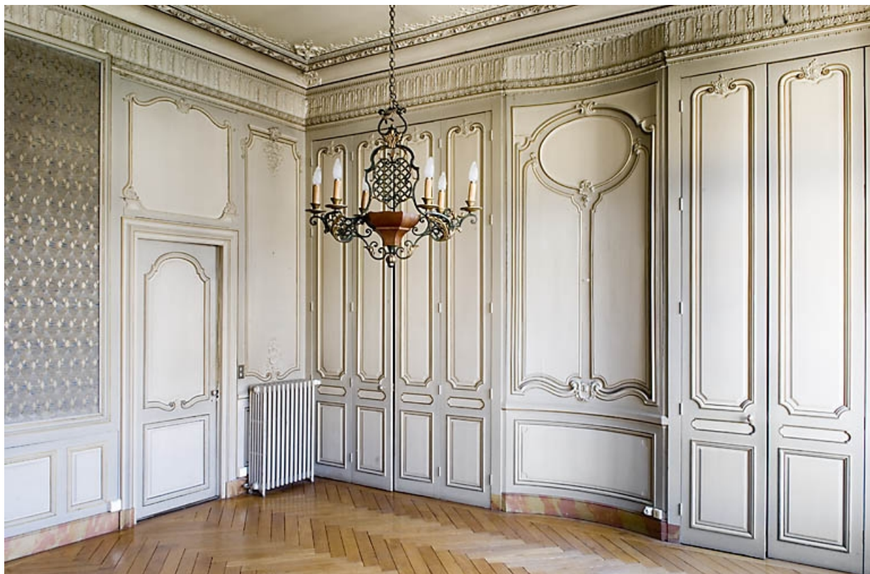
Pièce à gauche du grand salon, vue d'angle avec la porte d'entrée.

25, Besançon, 9, 9 bis rue Charles Nodier, lieudit : îlot Banque de France