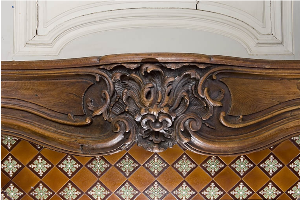
Pièce au rez-de-chaussée, à droite du passage cocher : détail du décor de la cheminée.

25, Besançon, 9, 9 bis rue Charles Nodier, lieudit : îlot Banque de France