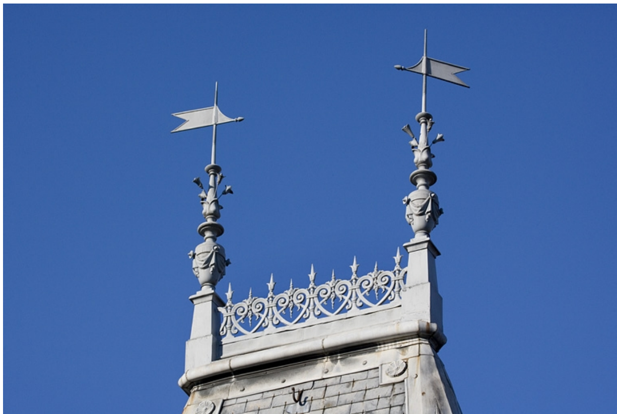
Détail des deux épis de faîtage sur la tourelle de l'escalier.

25, Besançon, 9, 9 bis rue Charles Nodier, lieudit : îlot Banque de France