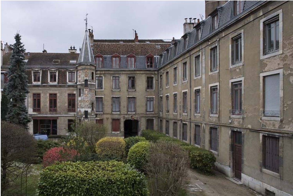
Vue d'ensemble des bâtiments depuis le fond de la cour, de trois quarts droit.

25, Besançon, 9, 9 bis rue Charles Nodier, lieudit : îlot Banque de France