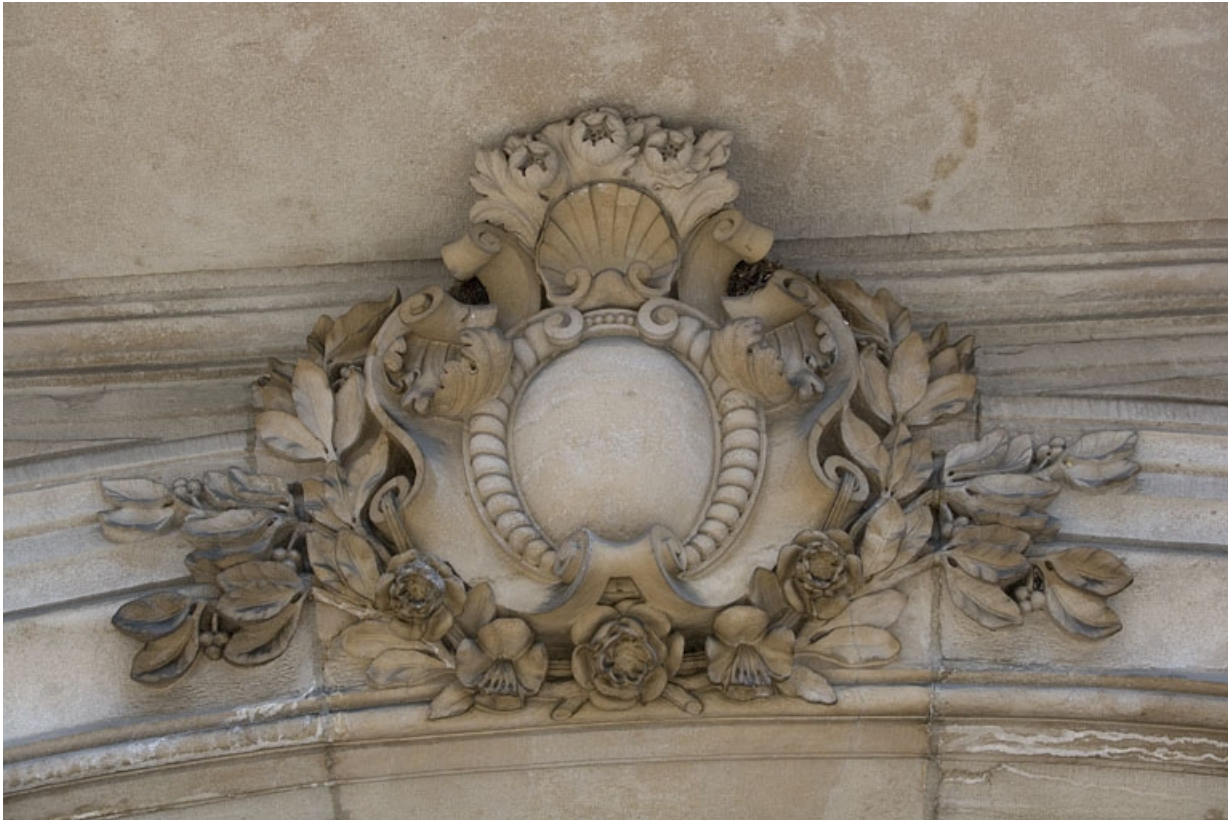
Détail du décor sur le linteau du portail d'entrée.

25, Besançon, 9, 9 bis rue Charles Nodier, lieudit : îlot Banque de France