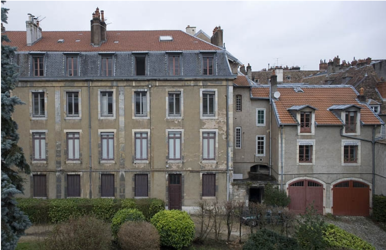
Vue d'ensemble de l'aile à gauche de la cour, de face.

25, Besançon, 9, 9 bis rue Charles Nodier, lieudit : îlot Banque de France