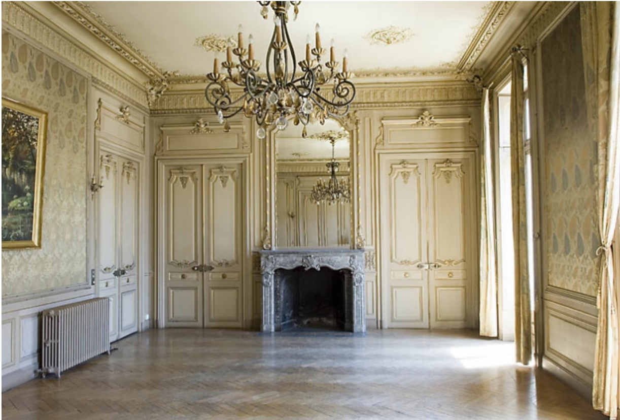
Vue d'ensemble du grand salon avec la cheminée.

25, Besançon, 9, 9 bis rue Charles Nodier, lieudit : îlot Banque de France