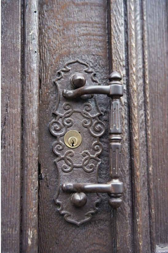
Détail de la poignée de porte du portail d'entrée, 9 rue Charles Nodier. 25, Besançon, 9, 9 bis rue Charles Nodier, lieudit : îlot Banque de France