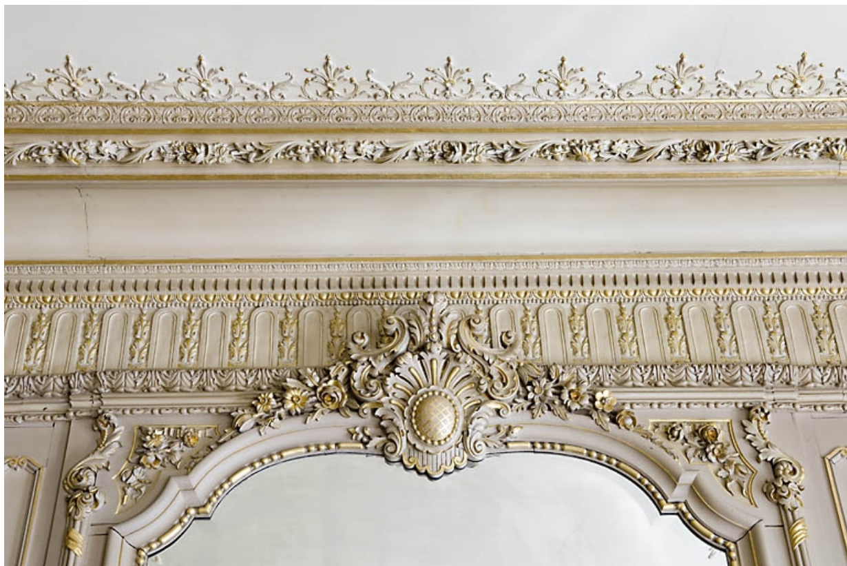
Détail du décor au-dessus de la glace du grand salon.

25, Besançon, 9, 9 bis rue Charles Nodier, lieudit : îlot Banque de France