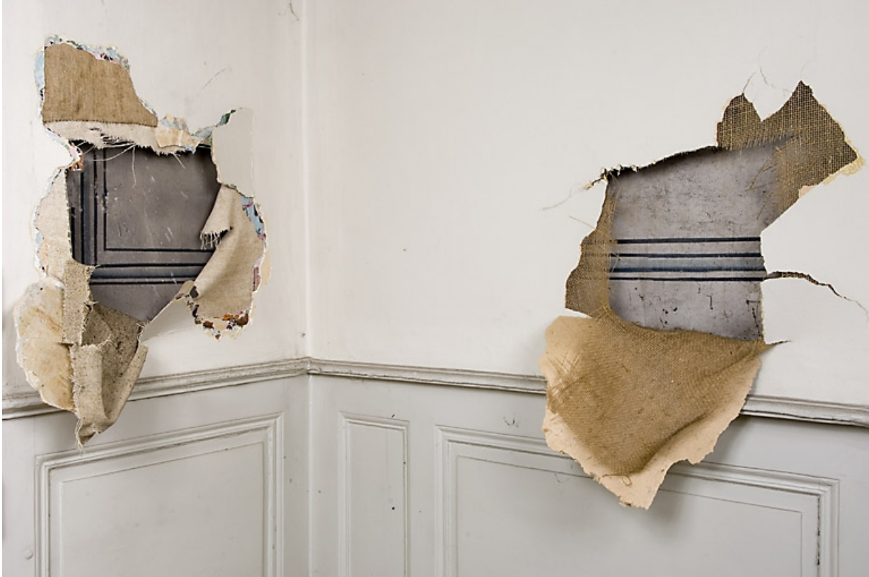
Détail d'un décor peint sous le revêtement actuel : pièce en rez-de-chaussée à gauche de l'escalier principal. 25, Besançon, 9, 9 bis rue Charles Nodier, lieudit : îlot Banque de France