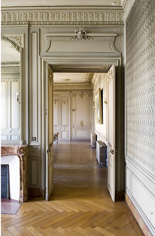
Pièce à gauche du grand salon, vue de l'enfilade sur le grand salon. 25, Besançon, 9, 9 bis rue Charles Nodier, lieudit : îlot Banque de France