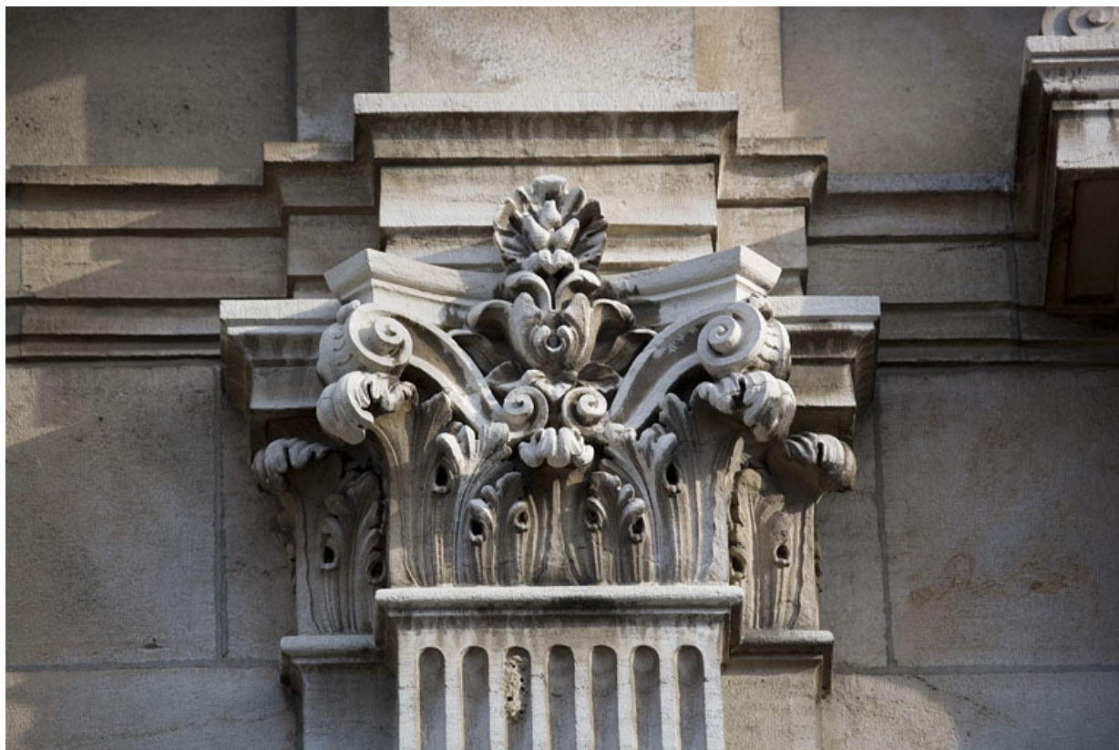
Détail d'un chapiteau sur la façade sur rue.

25, Besançon, 9, 9 bis rue Charles Nodier, lieudit : îlot Banque de France