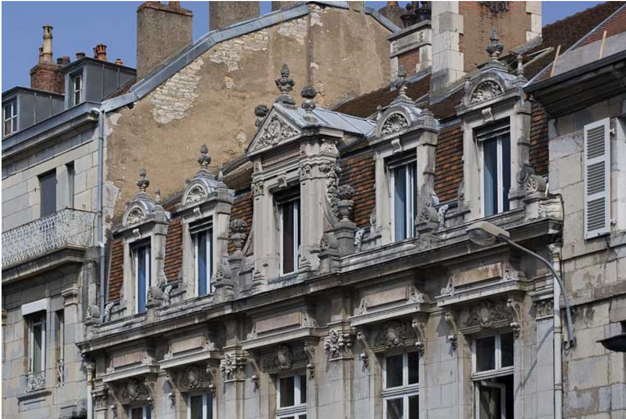
Vue d'ensemble de la partie supérieure de la façade sur rue, de trois quarts droit.

25, Besançon, 9, 9 bis rue Charles Nodier, lieudit : îlot Banque de France