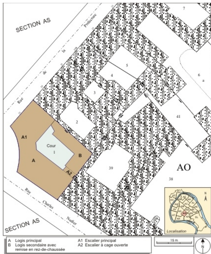
Plan masse et de situation. Extrait du plan cadastral, 1993, section AO. 25, Besançon, 31 rue de la Préfecture, lieudit : îlot Banque de France