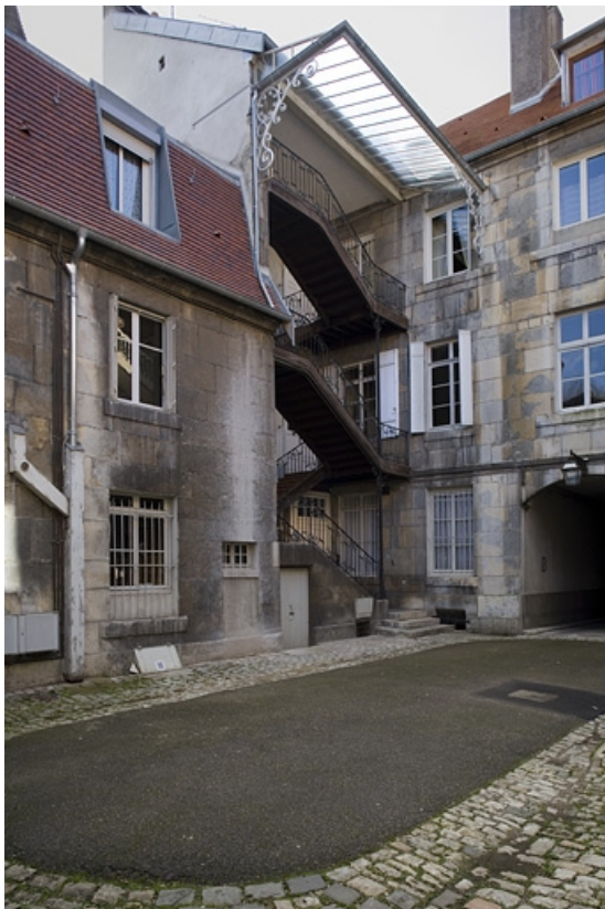
Vue d'ensemble de trois quarts droit depuis le fond de la cour. 25, Besançon, 11 rue Charles Nodier, lieudit : îlot Banque de France