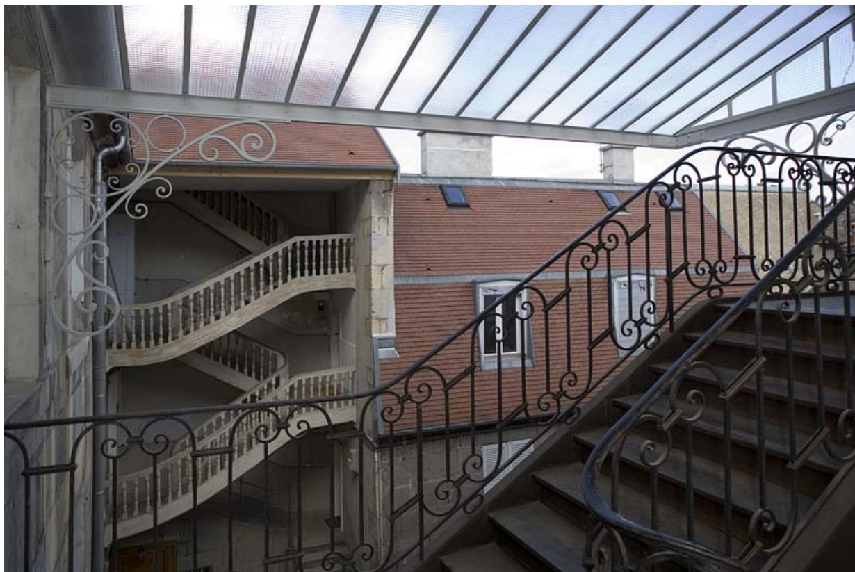
Détail de l'escalier droit depuis l'escalier gauche.

25, Besançon, 11 rue Charles Nodier, lieudit : îlot Banque de France