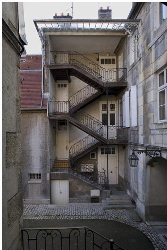
Vue d'ensemble de l'escalier à cage ouverte à gauche de la cour. 25, Besançon, 11 rue Charles Nodier, lieudit : îlot Banque de France