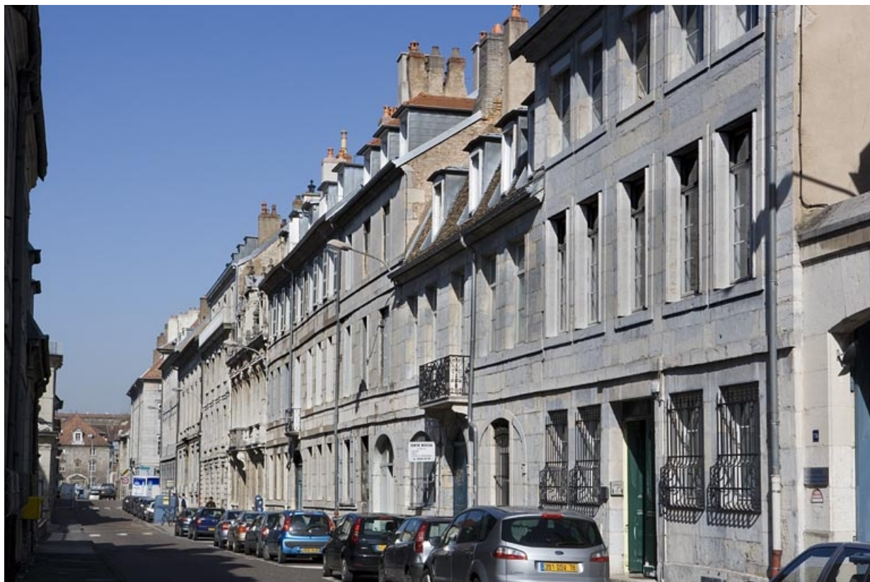
Vue d'ensemble de la maison dans l'alignement de la rue.

25, Besançon, 11 rue Charles Nodier, lieudit : îlot Banque de France