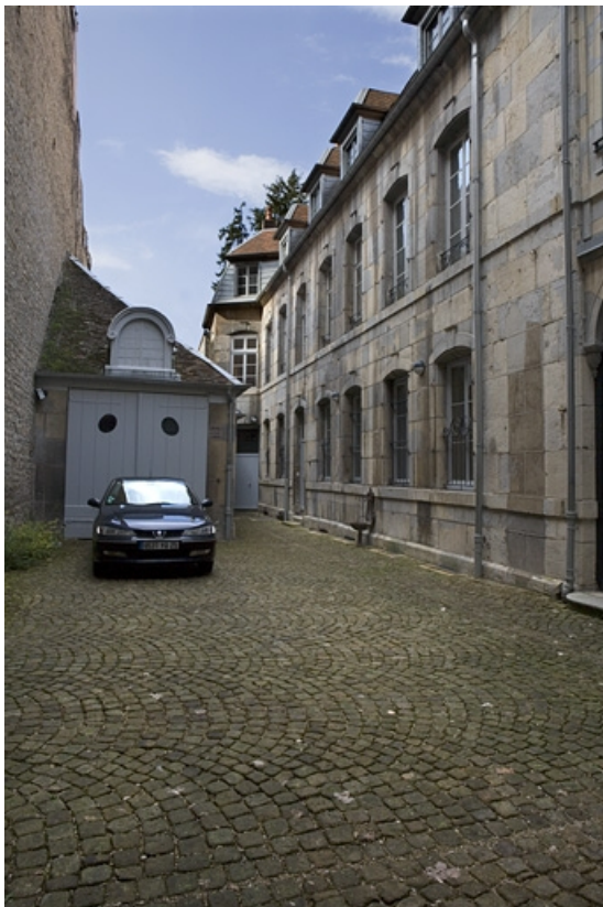
Vue d'ensemble de l' aile sur cour et du bâtiment des remise et écurie.

25, Besançon, 24 rue Chifflet, lieudit : îlot Banque de France