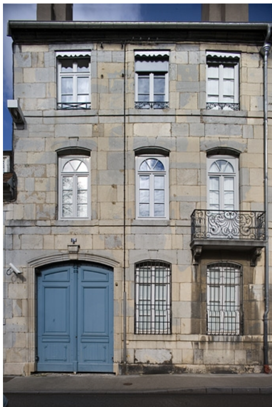
Vue d'ensemble de la façade sur rue : de face.

25, Besançon, 24 rue Chifflet, lieudit : îlot Banque de France