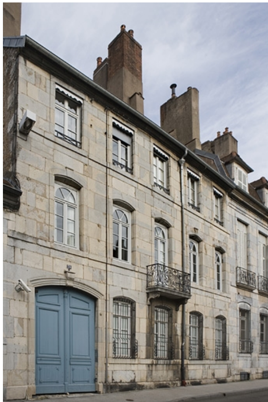
Vue d'ensemble de la façade sur rue de trois quarts gauche.

25, Besançon, 24 rue Chifflet, lieudit : îlot Banque de France