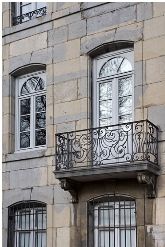
Vue du balcon en fer forgé de trois quarts droit.

25, Besançon, 24 rue Chifflet, lieudit : îlot Banque de France