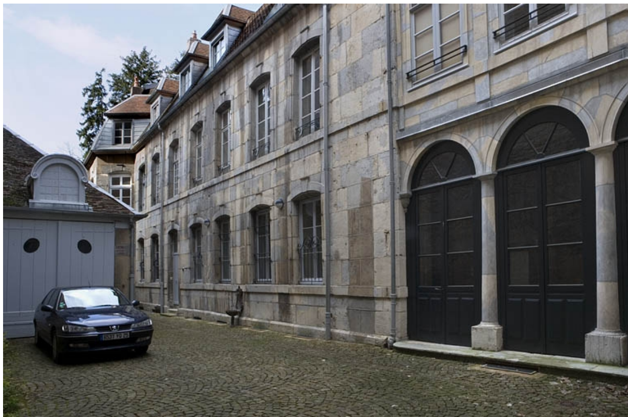
Vue d'ensemble de l' aile sur cour.

25, Besançon, 24 rue Chifflet, lieudit : îlot Banque de France