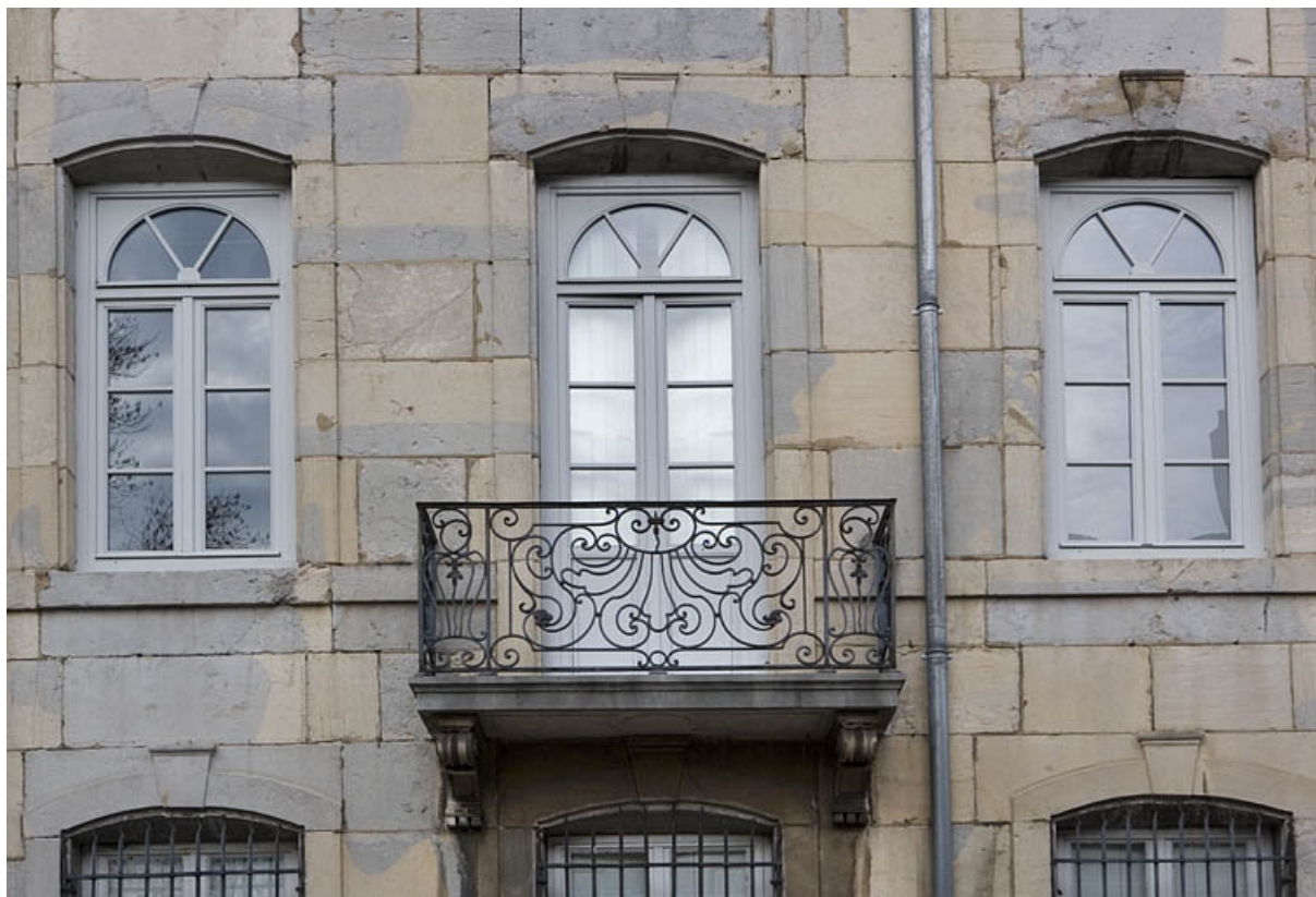
Vue du balcon en fer forgé de face.

25, Besançon, 24 rue Chifflet, lieudit : îlot Banque de France