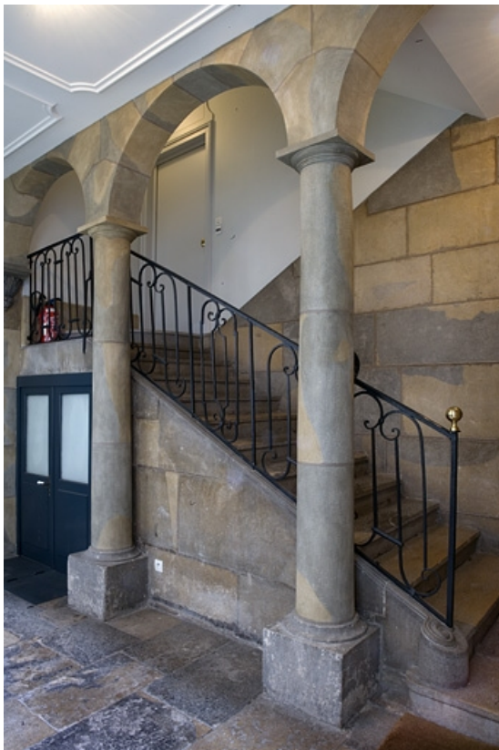
Vue d'ensemble de l'escalier.

25, Besançon, 24 rue Chifflet, lieudit : îlot Banque de France