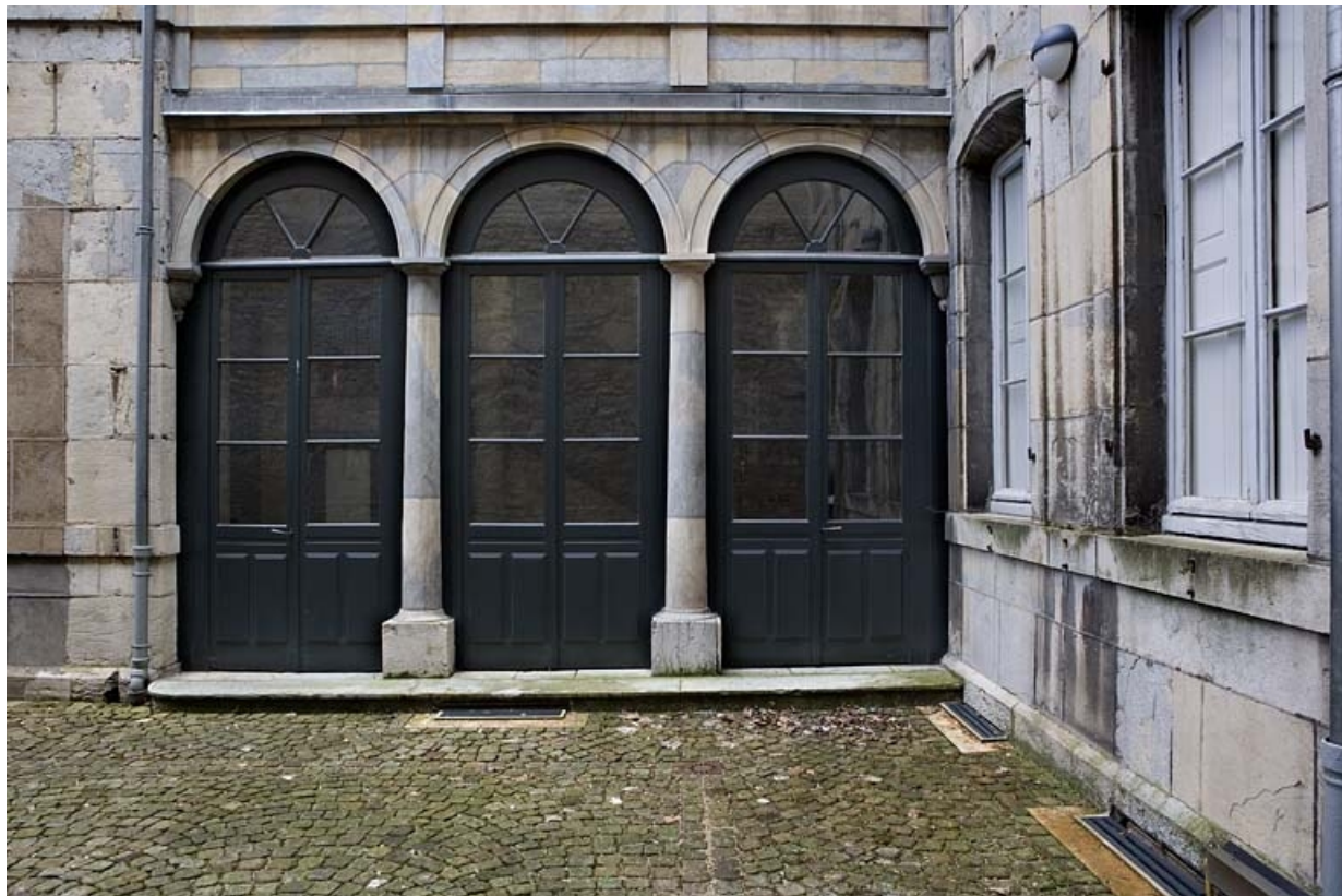
Vue extérieure de l'aile de l'escalier, de face.

25, Besançon, 24 rue Chifflet, lieudit : îlot Banque de France