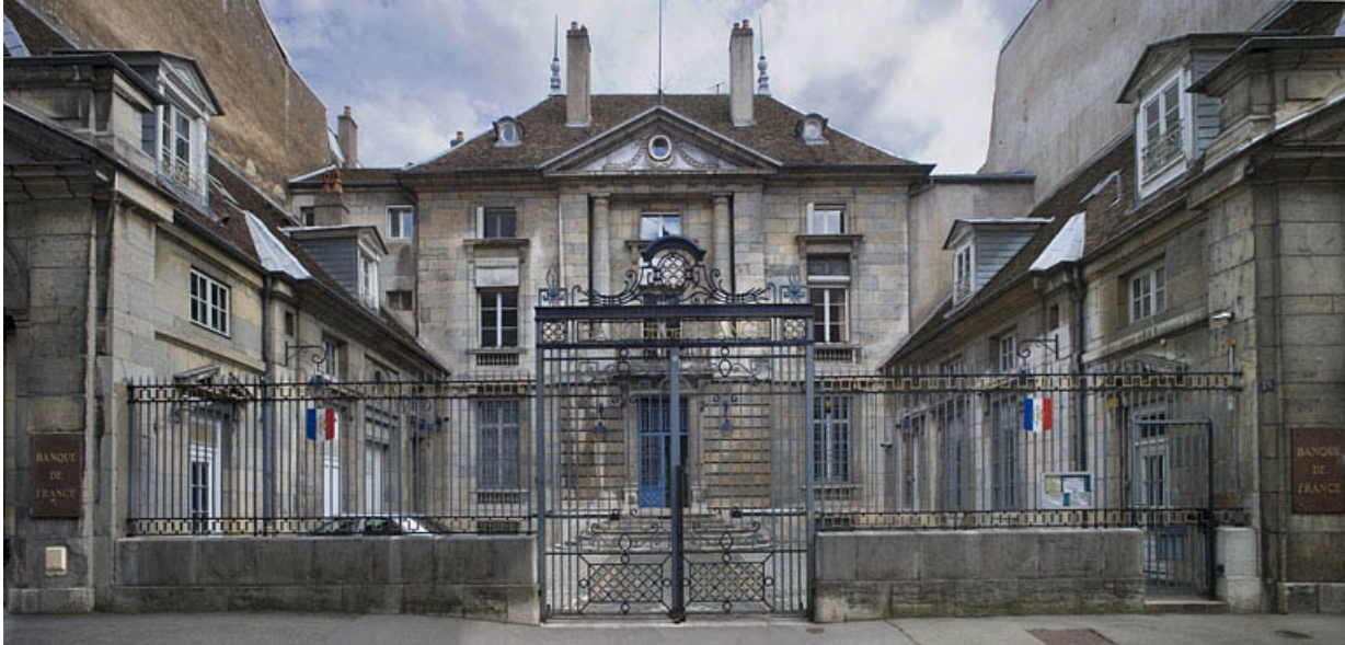
Vue d'ensemble de face depuis la rue.

25, Besançon, 19 rue de la Préfecture, lieudit : îlot Banque de France