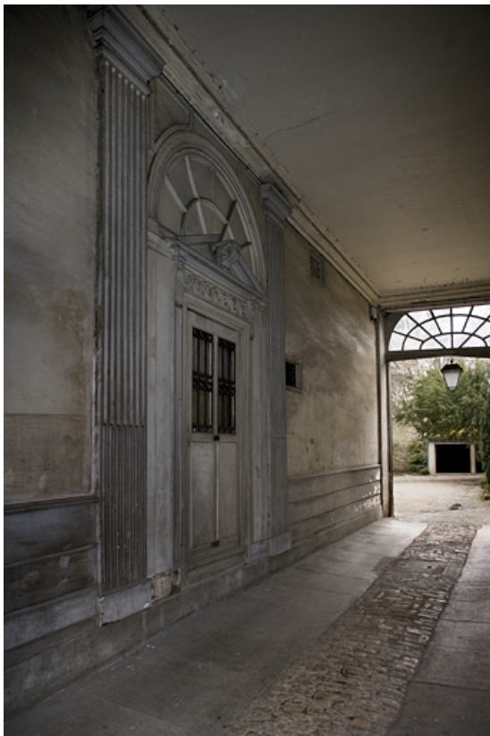
Vue de l'entrée sous le passage cocher.

25, Besançon, 22 rue Chifflet, lieudit : îlot Banque de France