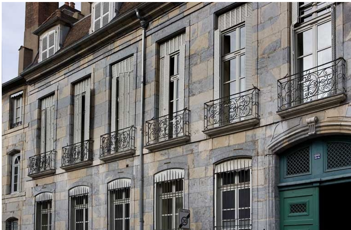
Façade sur rue : détail des baies du premier étage.

25, Besançon, 22 rue Chifflet, lieudit : îlot Banque de France