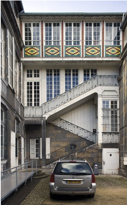
Vue d'ensemble de l'escalier à cage ouverte, de face.

25, Besançon, 22 rue Chifflet, lieudit : îlot Banque de France