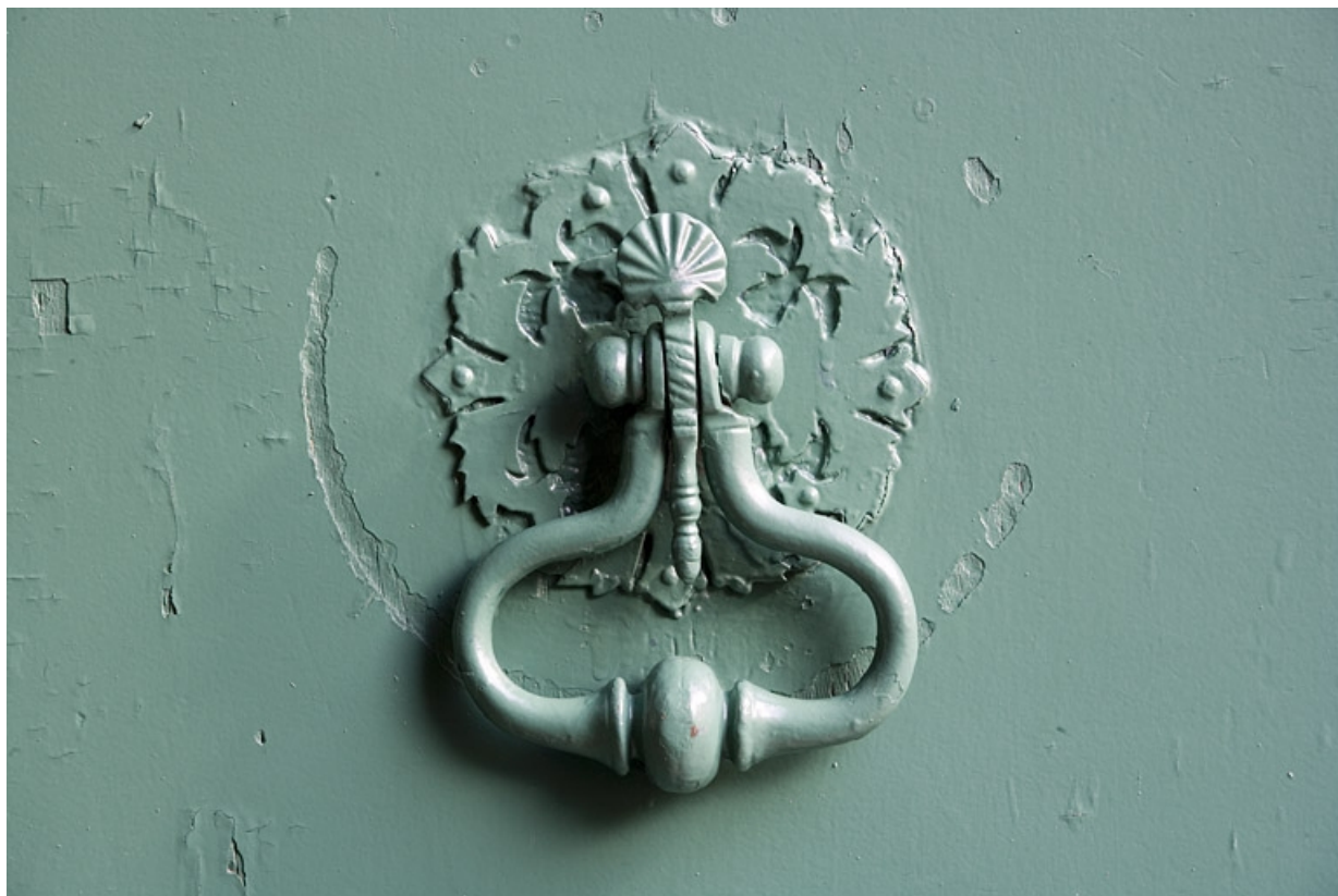
Détail du heurtoir du portail d'entrée.

25, Besançon, 22 rue Chifflet, lieudit : îlot Banque de France