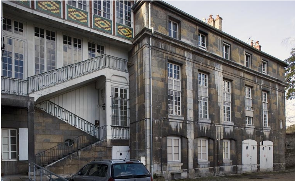
Vue d'ensemble de l'escalier et de l'aile sur cour.

25, Besançon, 22 rue Chifflet, lieudit : îlot Banque de France