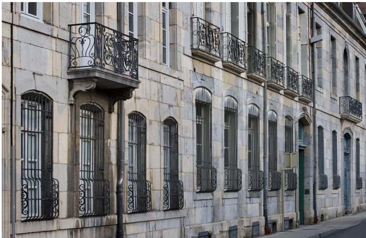
Vue rapprochée de la façade sur rue : de trois-quart gauche.

25, Besançon, 22 rue Chifflet, lieudit : îlot Banque de France