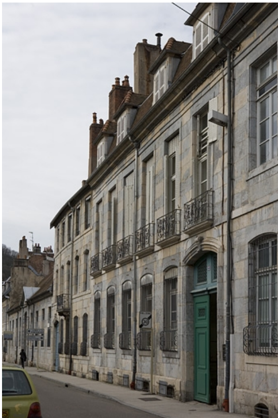
Vue d'ensemble de la façade sur rue : de trois quarts droit.

25, Besançon, 22 rue Chifflet, lieudit : îlot Banque de France