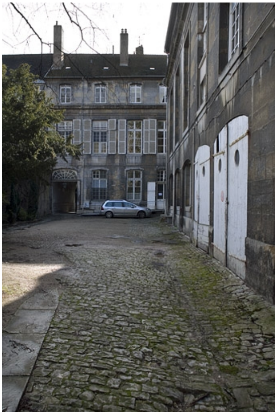
Façade sur cour depuis le fond de la parcelle.

25, Besançon, 22 rue Chifflet, lieudit : îlot Banque de France