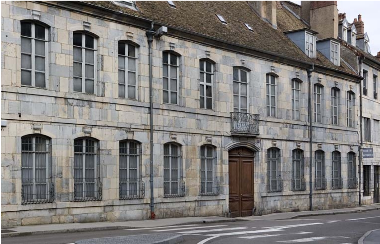
Vue rapprochée de la façade de trois quarts gauche.

25, Besançon, 14 rue Chifflet, lieudit : îlot Banque de France