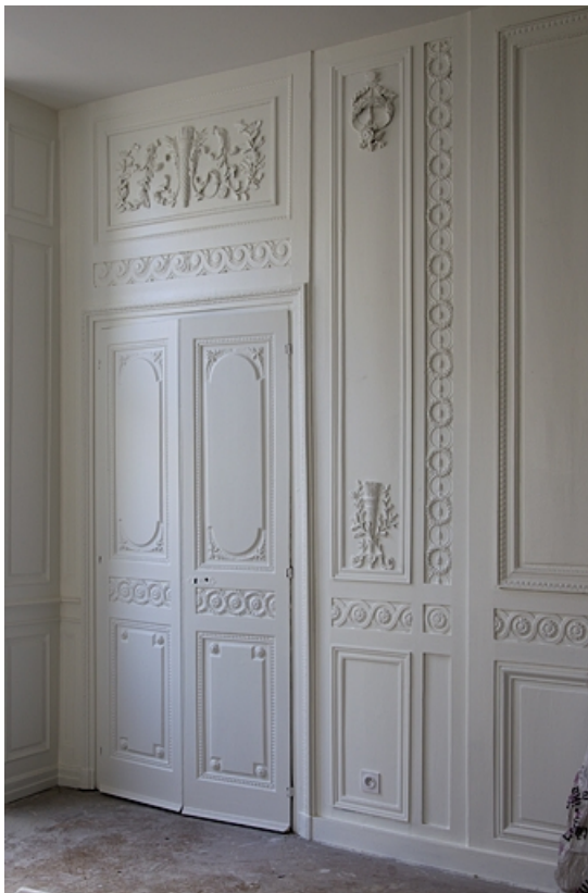
Intérieur : détail d'une partie des lambris d'un salon, au rez-de-chaussée de l'aile gauche. 25, Besançon, 14 rue Chifflet, lieudit : îlot Banque de France