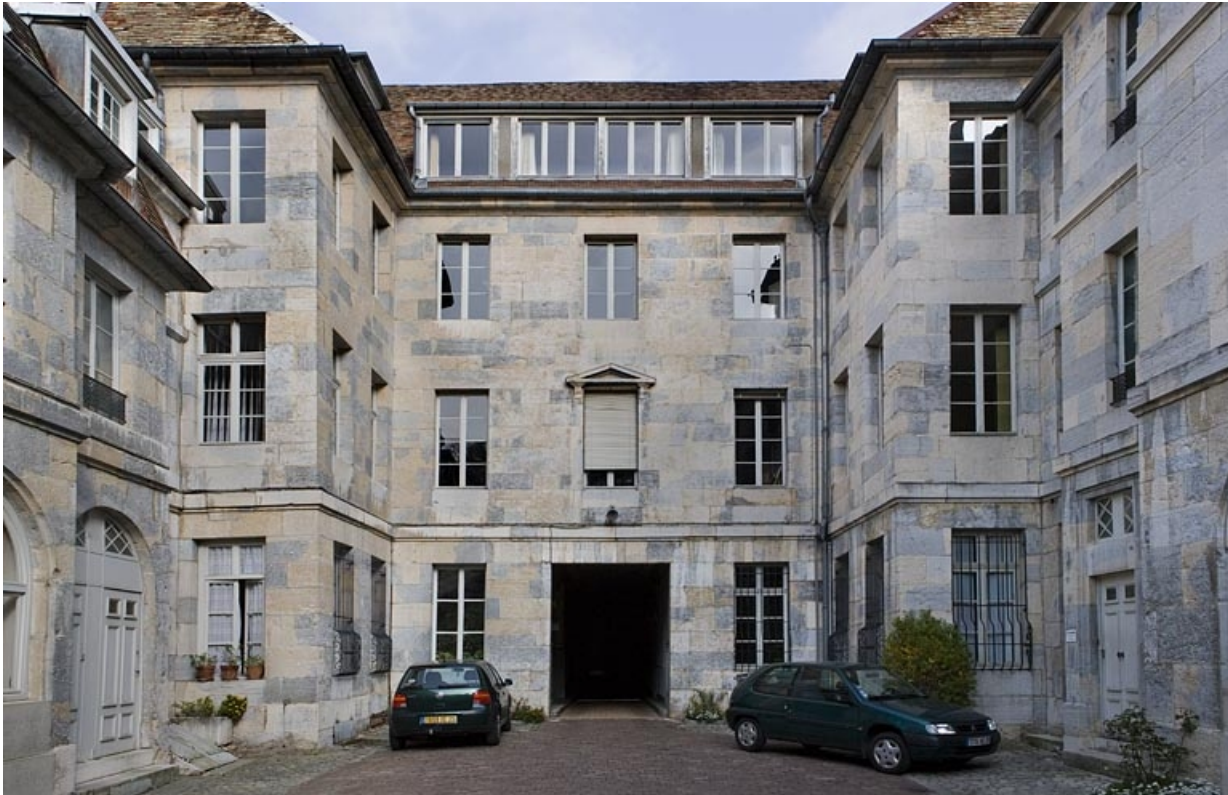
Vue d'ensemble des façades sur cour du logis principal depuis le fond de la cour. 25, Besançon, 21 rue de la Préfecture, lieudit : îlot Banque de France