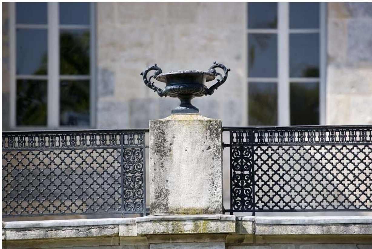
Détail d'un vase en fonte ornant le parapet de la terrasse du jardin d'hiver.

25, Besançon, 21 rue de la Préfecture, lieudit : îlot Banque de France