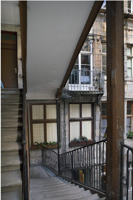
Vue de la façade sur cour du logis principal depuis l'escalier.

25, Besançon, 27 rue de la Préfecture, lieudit : îlot Banque de France