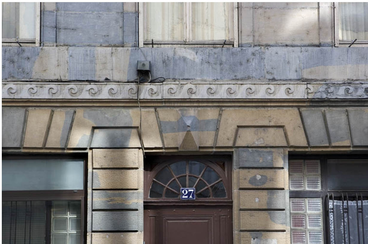
Détail du décor sculpté au-dessus de l'entrée.

25, Besançon, 27 rue de la Préfecture, lieudit : îlot Banque de France