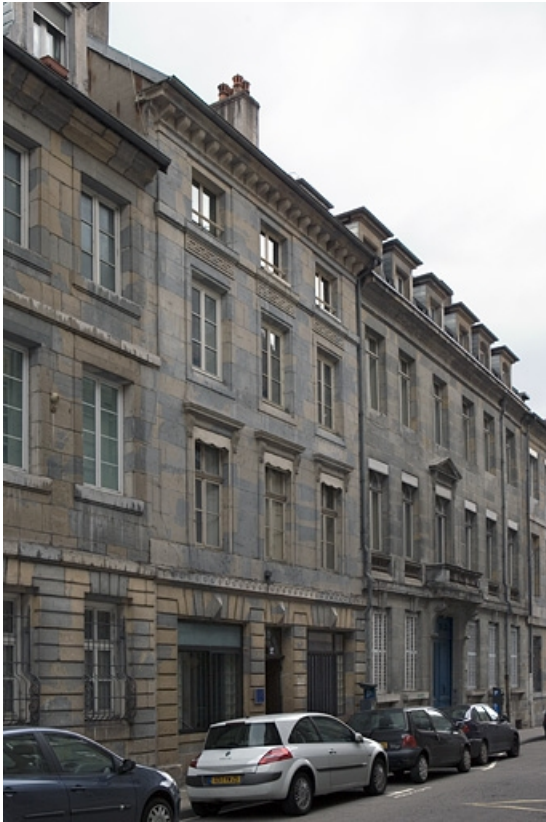
Vue d'ensemble du logis principal depuis la rue, de trois quarts gauche.

25, Besançon, 27 rue de la Préfecture, lieudit : îlot Banque de France