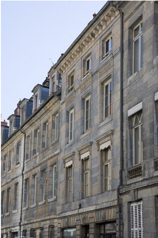
Vue rapprochée de la façade sur rue de trois quarts droit.

25, Besançon, 27 rue de la Préfecture, lieudit : îlot Banque de France