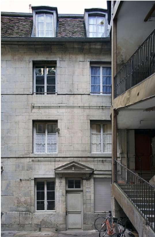
Vue de la façade sur cour du logis secondaire.

25, Besançon, 27 rue de la Préfecture, lieudit : îlot Banque de France