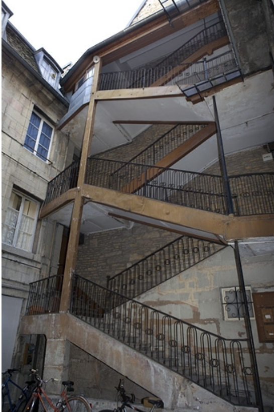
Vue d'ensemble de l'escalier à cage ouverte sur cour.

25, Besançon, 27 rue de la Préfecture, lieudit : îlot Banque de France