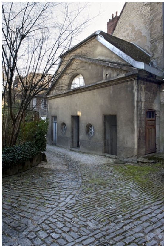
Vue d'ensemble du bâtiment des remise et écurie droit, de trois quarts droit. 25, Besançon, 23 rue de la Préfecture, lieudit : îlot Banque de France