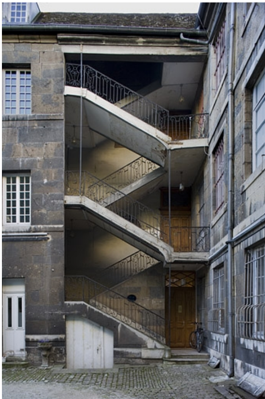
Vue d'ensemble de l'escalier à cage ouverte sur cour.

25, Besançon, 23 rue de la Préfecture, lieudit : îlot Banque de France