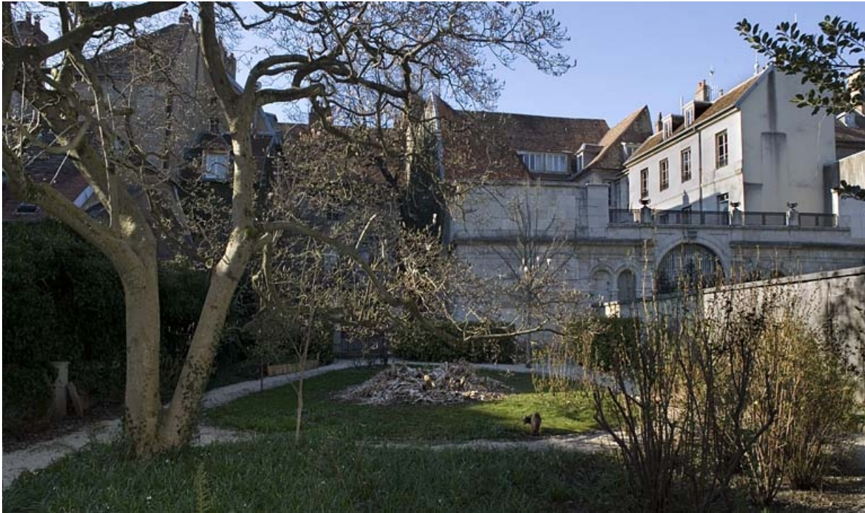
Vue d'ensemble du jardin depuis le fond de la parcelle.

25, Besançon, 23 rue de la Préfecture, lieudit : îlot Banque de France