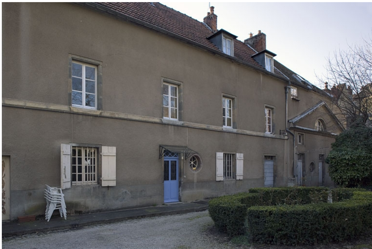
Vue d'ensemble du logis au fond de la deuxième cour.

25, Besançon, 23 rue de la Préfecture, lieudit : îlot Banque de France