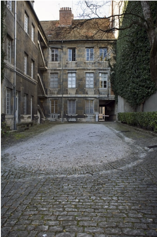
Vue d'ensemble de l'immeuble depuis le fond de la cour.

25, Besançon, 23 rue de la Préfecture, lieudit : îlot Banque de France