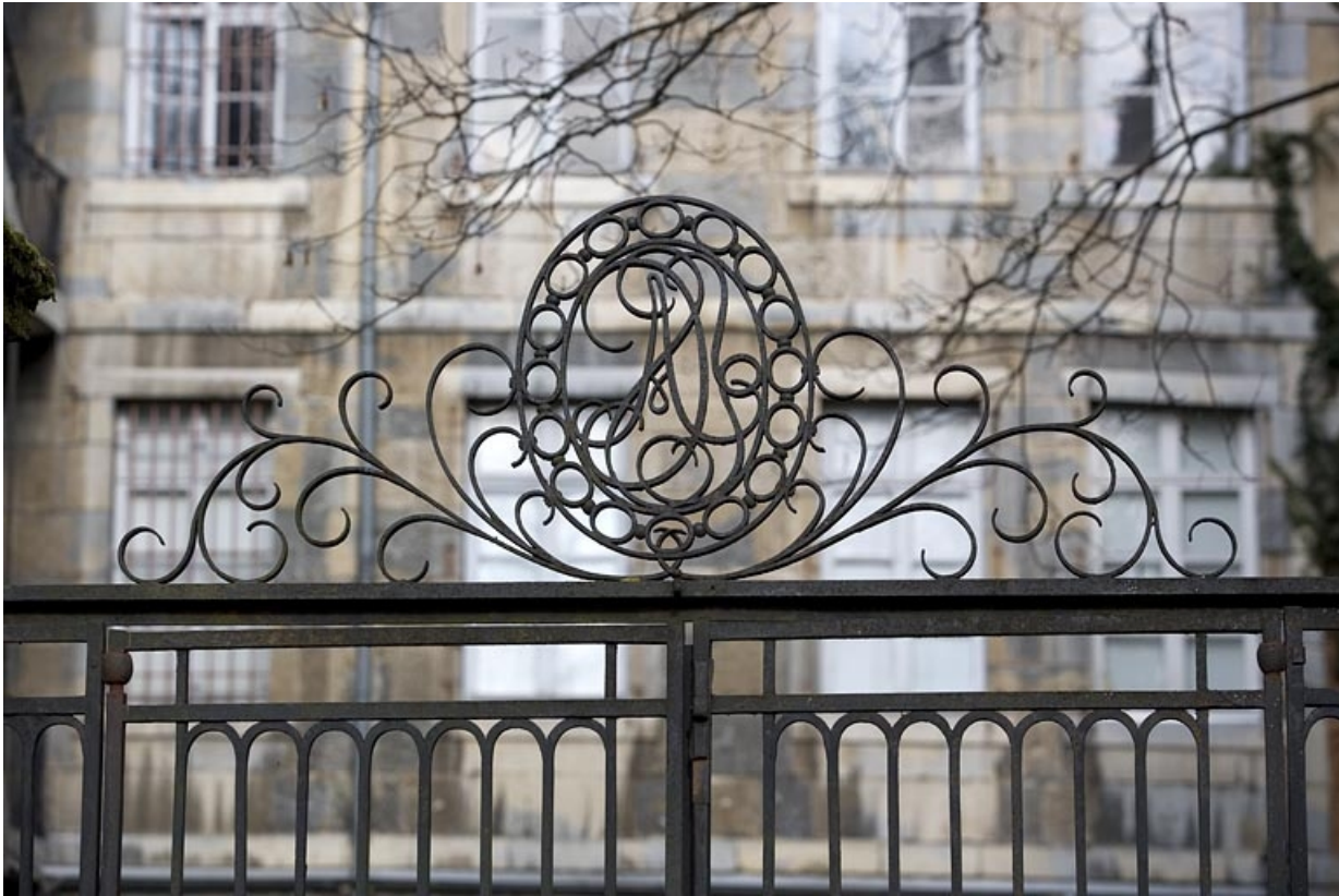
Détail du couronnement de la grille du jardin.

25, Besançon, 23 rue de la Préfecture, lieudit : îlot Banque de France