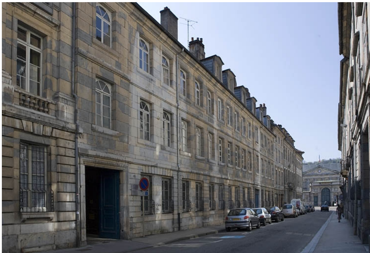
Vue d'ensemble du logis principal depuis la rue, de trois quarts gauche.

25, Besançon, 23 rue de la Préfecture, lieudit : îlot Banque de France