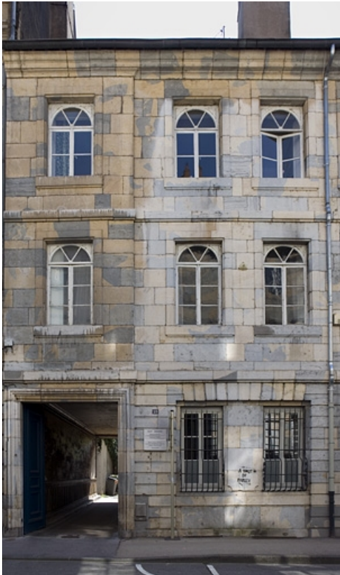
Vue d'ensemble de la partie gauche de la façade sur rue.

25, Besançon, 23 rue de la Préfecture, lieudit : îlot Banque de France