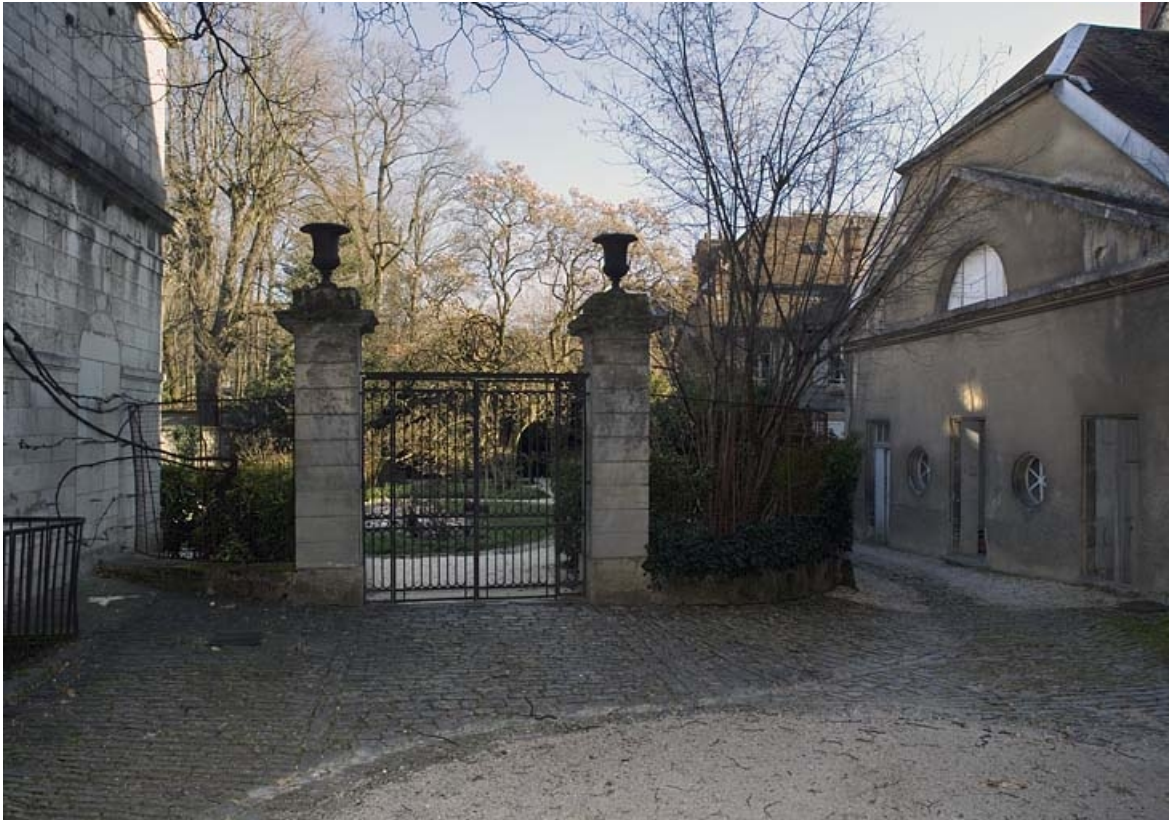
Vue d'ensemble de la première cour depuis l'entrée.

25, Besançon, 23 rue de la Préfecture, lieudit : îlot Banque de France