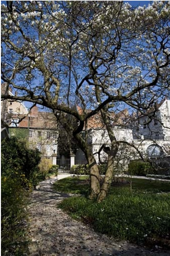
Vue d'ensemble du jardin depuis le fond.

25, Besançon, 23 rue de la Préfecture, lieudit : îlot Banque de France