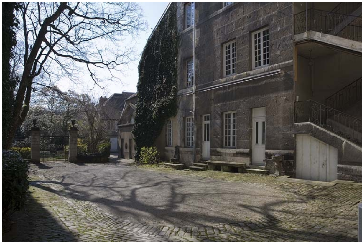
Vue d'ensemble de l'aile sur cour.

25, Besançon, 23 rue de la Préfecture, lieudit : îlot Banque de France