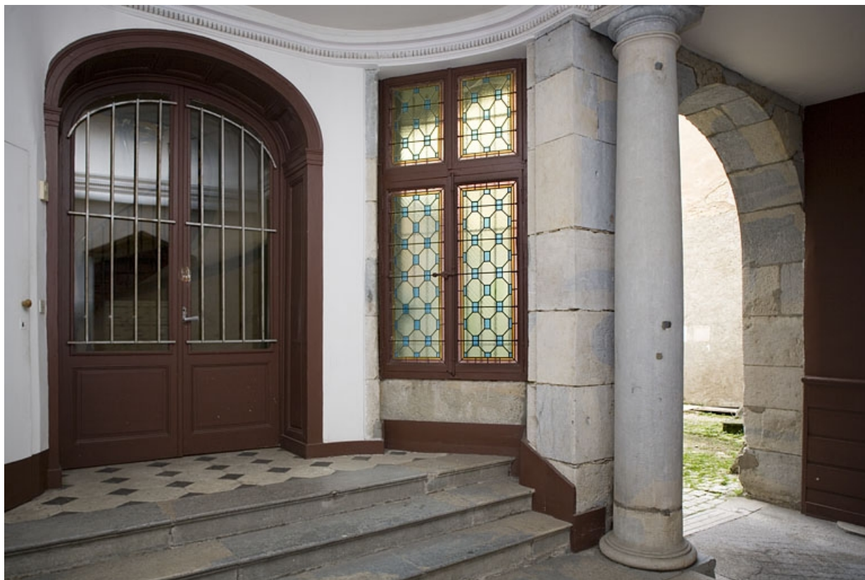
Vue de l'entrée de l'escalier.

25, Besançon, 29 rue de la Préfecture, lieudit : îlot Banque de France