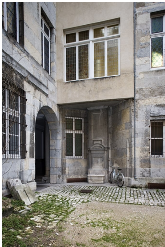
Vue d'ensemble de l'entrée sur cour.

25, Besançon, 29 rue de la Préfecture, lieudit : îlot Banque de France