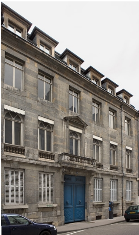
Vue d'ensemble du logis principal depuis la rue, de trois quarts gauche.

25, Besançon, 29 rue de la Préfecture, lieudit : îlot Banque de France