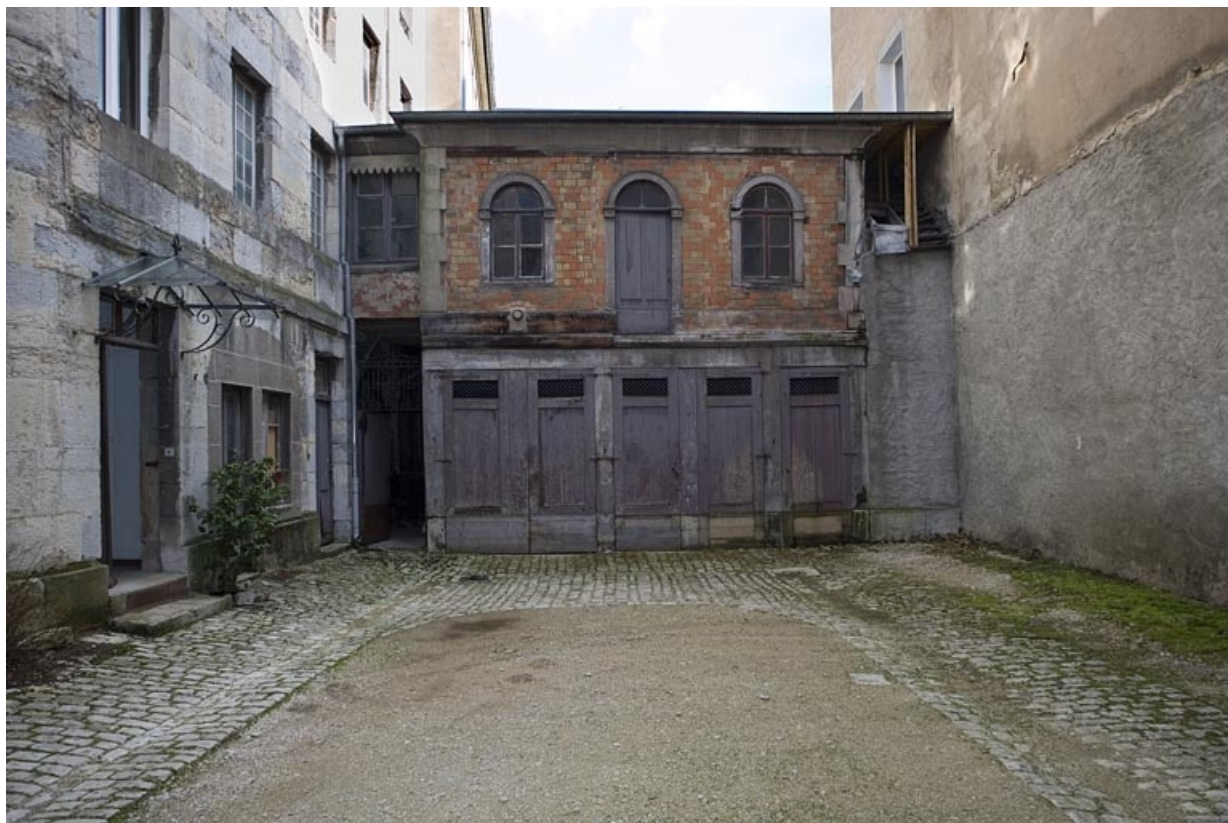
Vue d'ensemble des dépendances en fond de cour, de face.

25, Besançon, 29 rue de la Préfecture, lieudit : îlot Banque de France