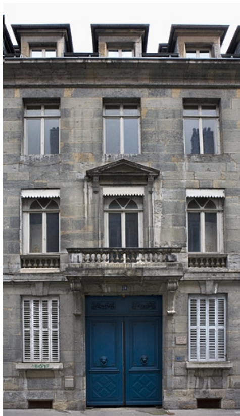
Vue d'ensemble de la partie centrale de la façade sur rue.

25, Besançon, 29 rue de la Préfecture, lieudit : îlot Banque de France