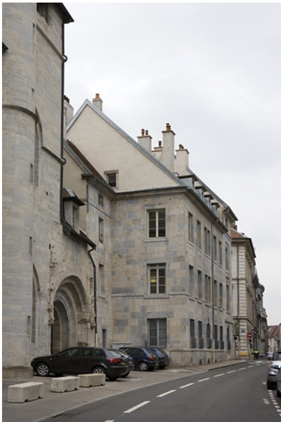
Vue d'ensemble rapprochée depuis la rue Mégevand.

25, Besançon, 13 rue de la Préfecture, lieudit : îlot Banque de France