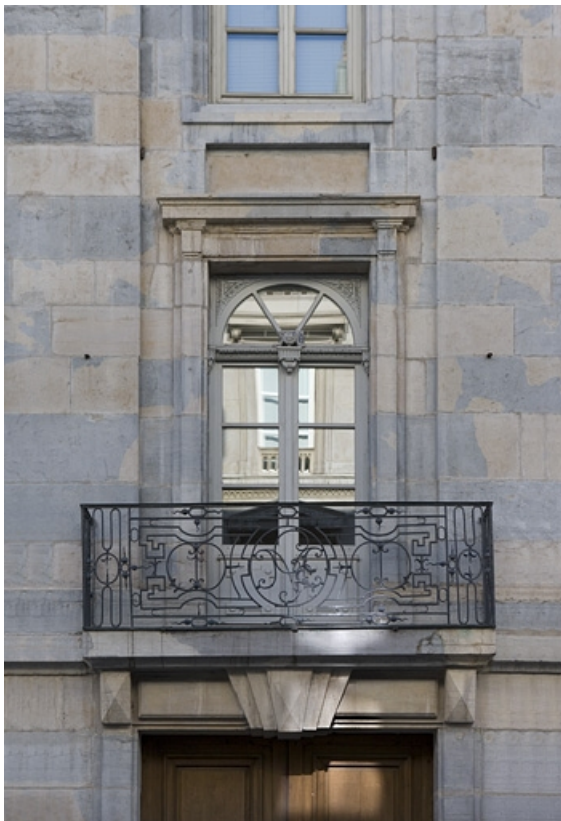
Détail du balcon en ferronnerie sur la façade principale.

25, Besançon, 13 rue de la Préfecture, lieudit : îlot Banque de France