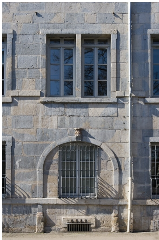
Détail de quelques baies sur la façade latérale gauche.

25, Besançon, 13 rue de la Préfecture, lieudit : îlot Banque de France