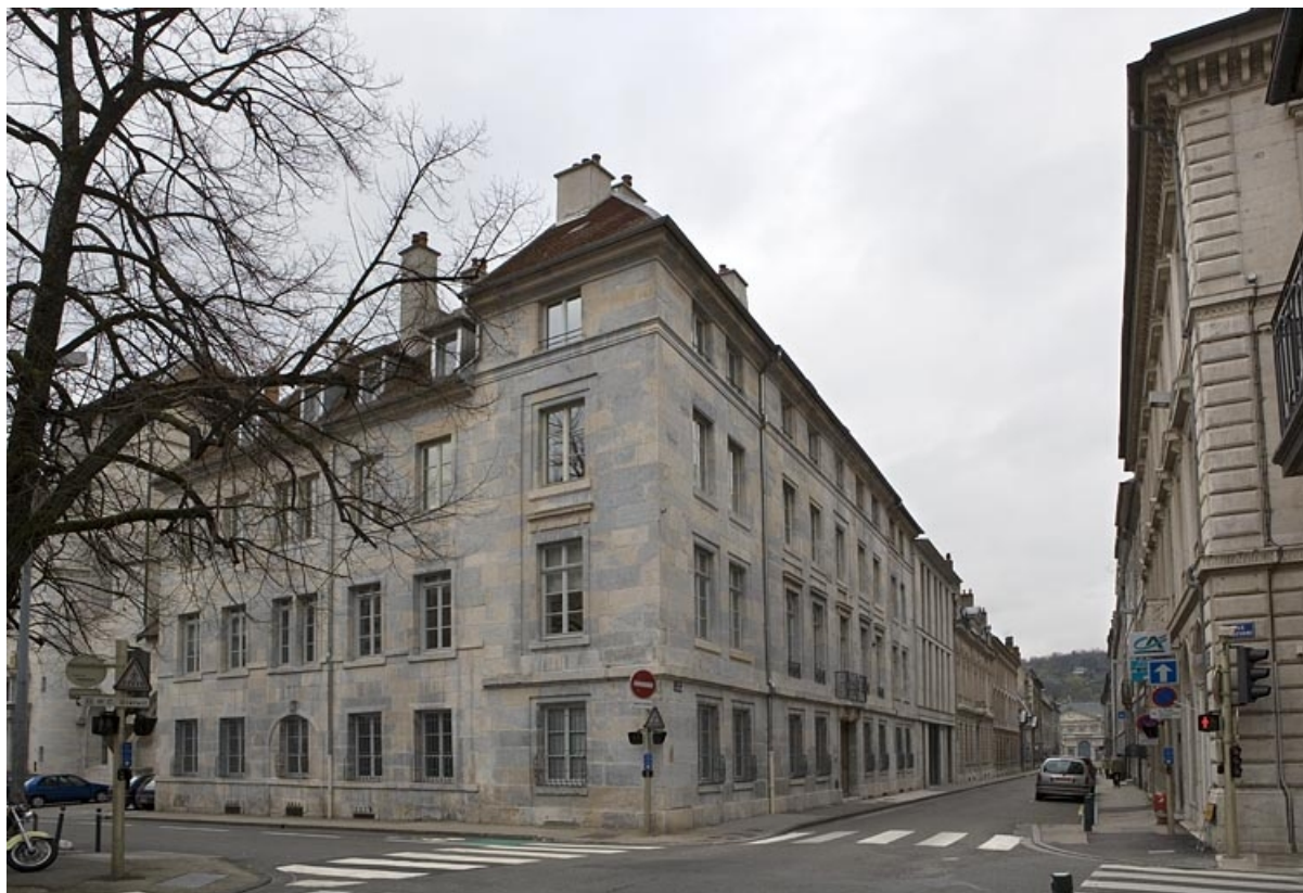
Vue d'angle de l'immeuble avec l'alignement de la rue.

25, Besançon, 13 rue de la Préfecture, lieudit : îlot Banque de France