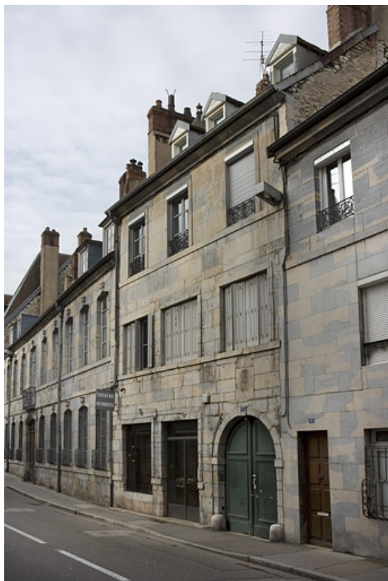
Vue d'ensemble de trois quarts droit.

25, Besançon, 12 rue Chifflet, lieudit : îlot Banque de France