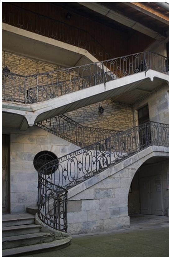
Vue d'ensemble de l'escalier à cage ouverte sur cour.

25, Besançon, 12 rue Chifflet, lieudit : îlot Banque de France