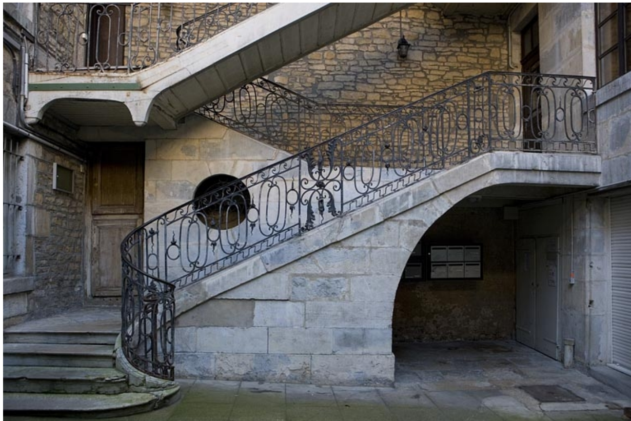
Détail de la première volée de l'escalier à cage ouverte depuis la cour.

25, Besançon, 12 rue Chifflet, lieudit : îlot Banque de France