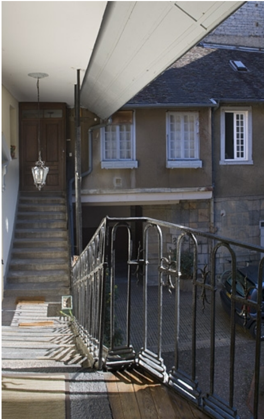
Vue de l'escalier à cage ouverte de profil.

25, Besançon, 38 rue Mégevand, lieudit : îlot Banque de France