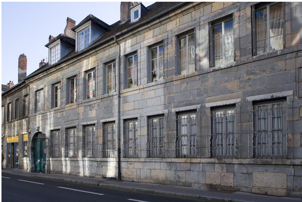
Vue d'ensemble depuis la rue, de trois quarts droit.

25, Besançon, 38 rue Mégevand, lieudit : îlot Banque de France