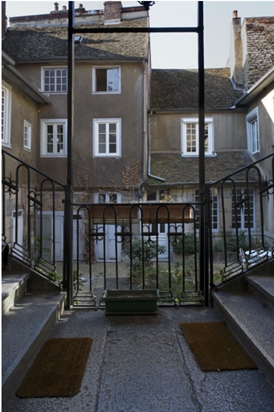
Vue des bâtiments en fond de cour depuis le premier palier de l'escalier.

25, Besançon, 38 rue Mégevand, lieudit : îlot Banque de France