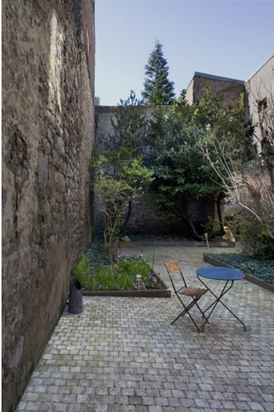
Vue d'ensemble de la deuxième cour.

25, Besançon, 38 rue Mégevand, lieudit : îlot Banque de France