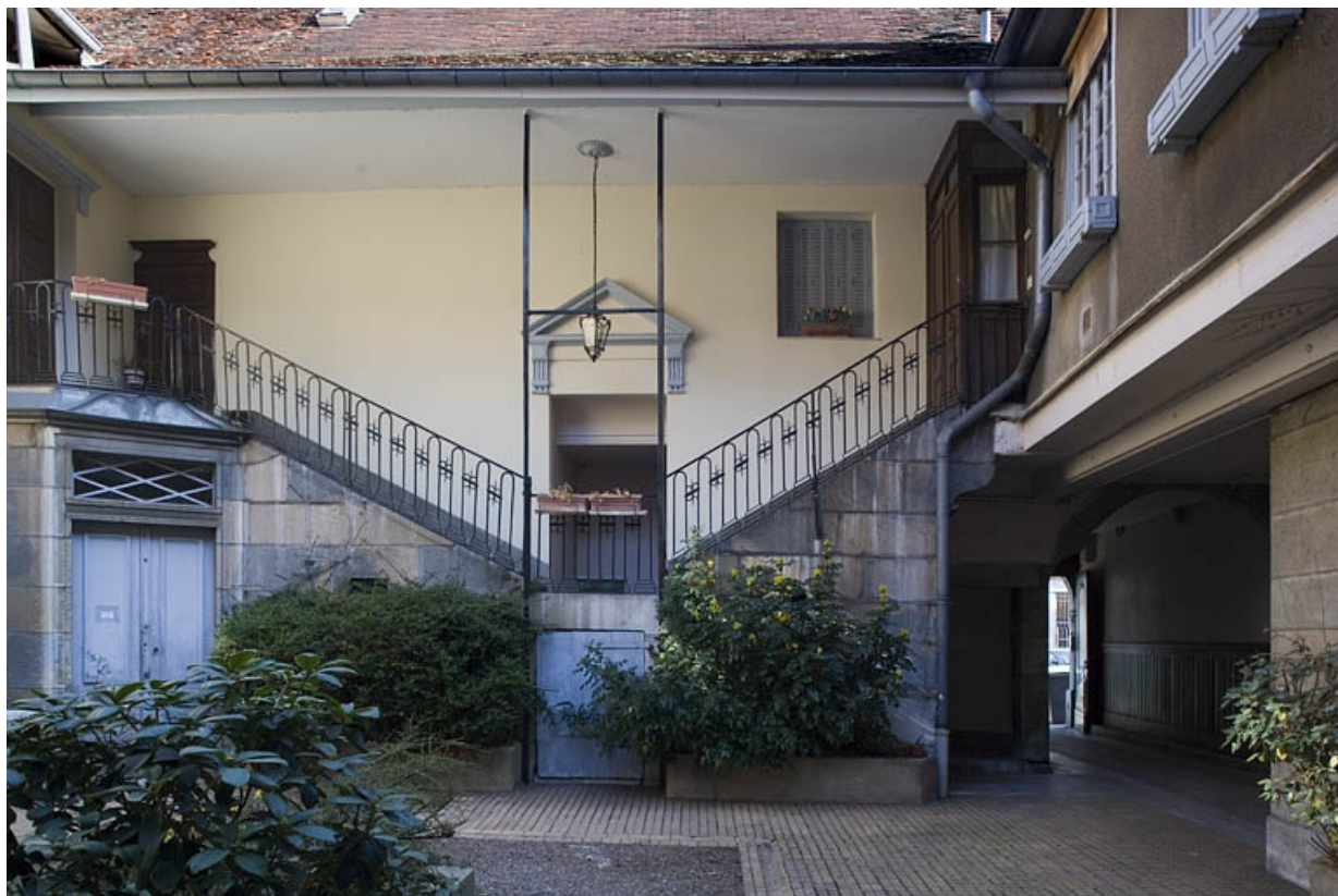
Vue d'ensemble de l'escalier à cage ouverte, de face.

25, Besançon, 38 rue Mégevand, lieudit : îlot Banque de France