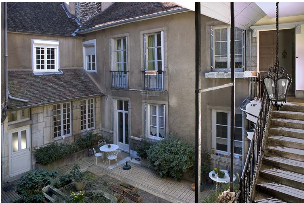
Vue des bâtiments sur cour depuis l'escalier, de trois quarts gauche.

25, Besançon, 38 rue Mégevand, lieudit : îlot Banque de France