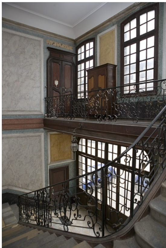
Vue d'ensemble de l'escalier d'honneur.

25, Besançon, 26 rue Chifflet, lieudit : îlot Banque de France