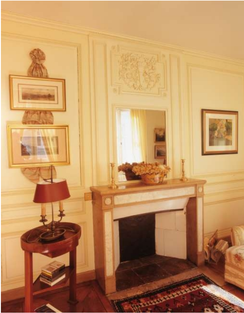
Ancien boudoir de madame : détail de la cheminée.

25, Besançon, 3 rue du Lycée, lieudit : îlot Pasteur