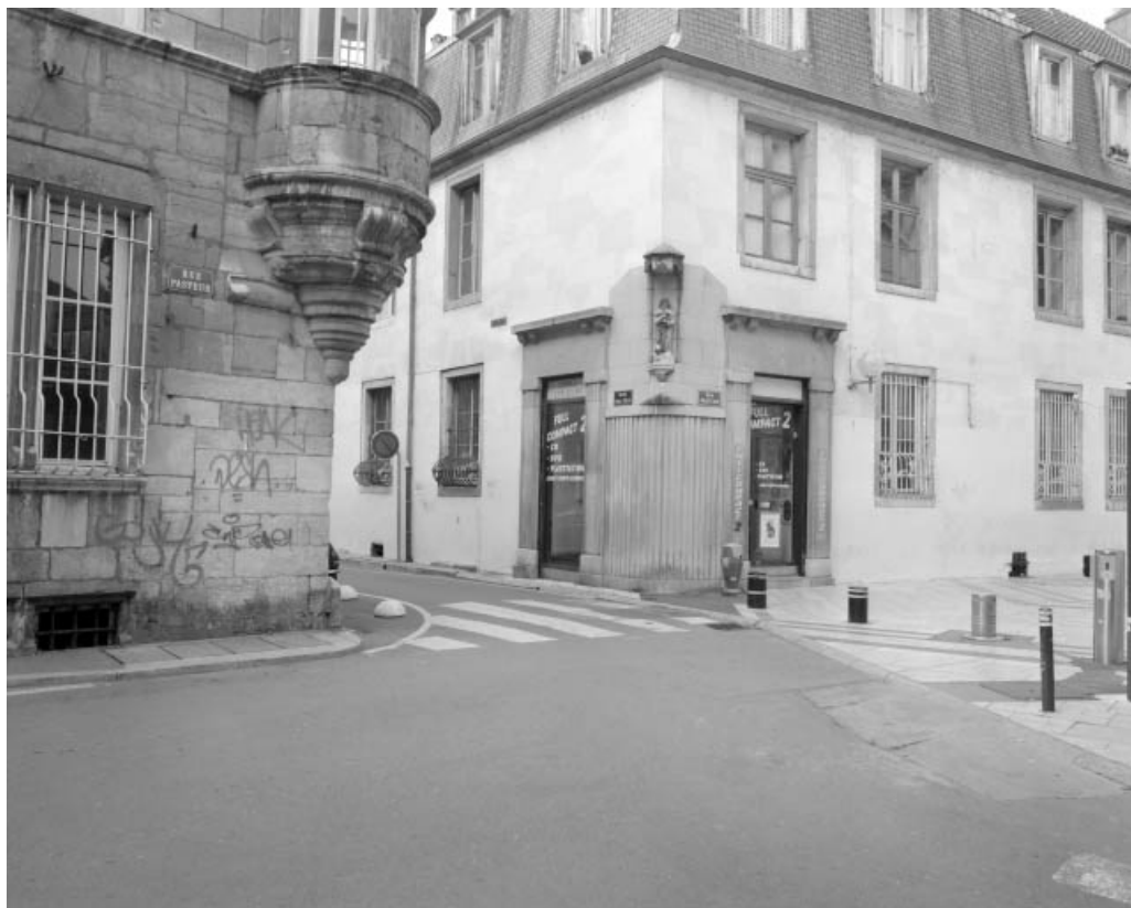
Vue rapprochée de l'angle gauche de l'édifice, entre rue Pasteur et rue Emile Zola.

25, Besançon, 10 rue Pasteur, lieudit : îlot Pasteur