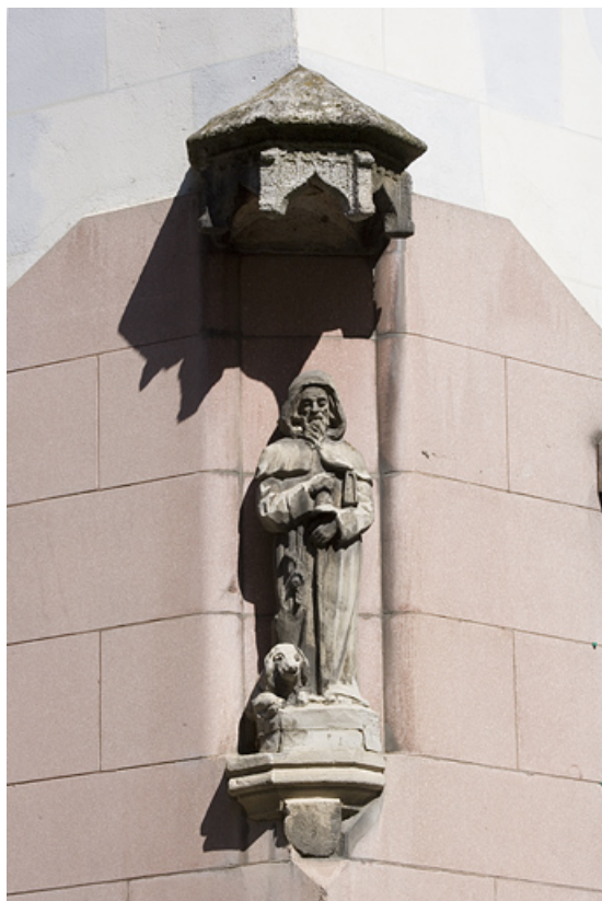
Détail de la niche à l'angle du logis principal.

25, Besançon, 10 rue Pasteur, lieudit : îlot Pasteur