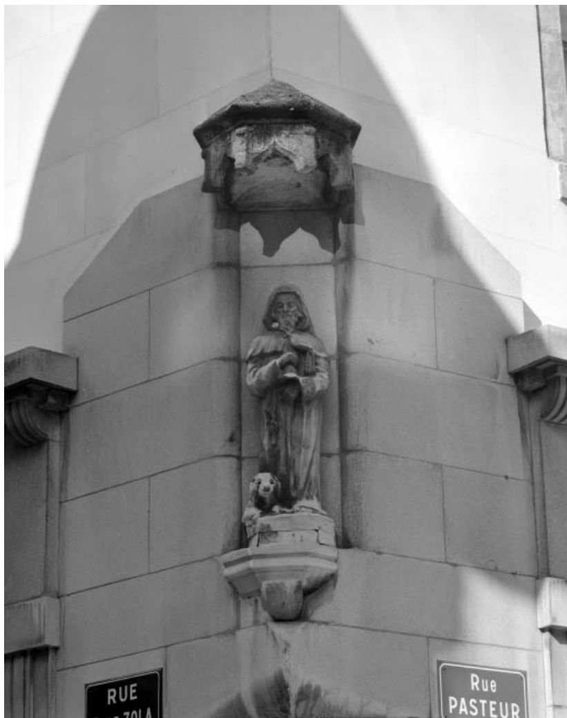
Détail de la niche à l'angle gauche de l'édifice. 25, Besançon, 10 rue Pasteur, lieudit : îlot Pasteur