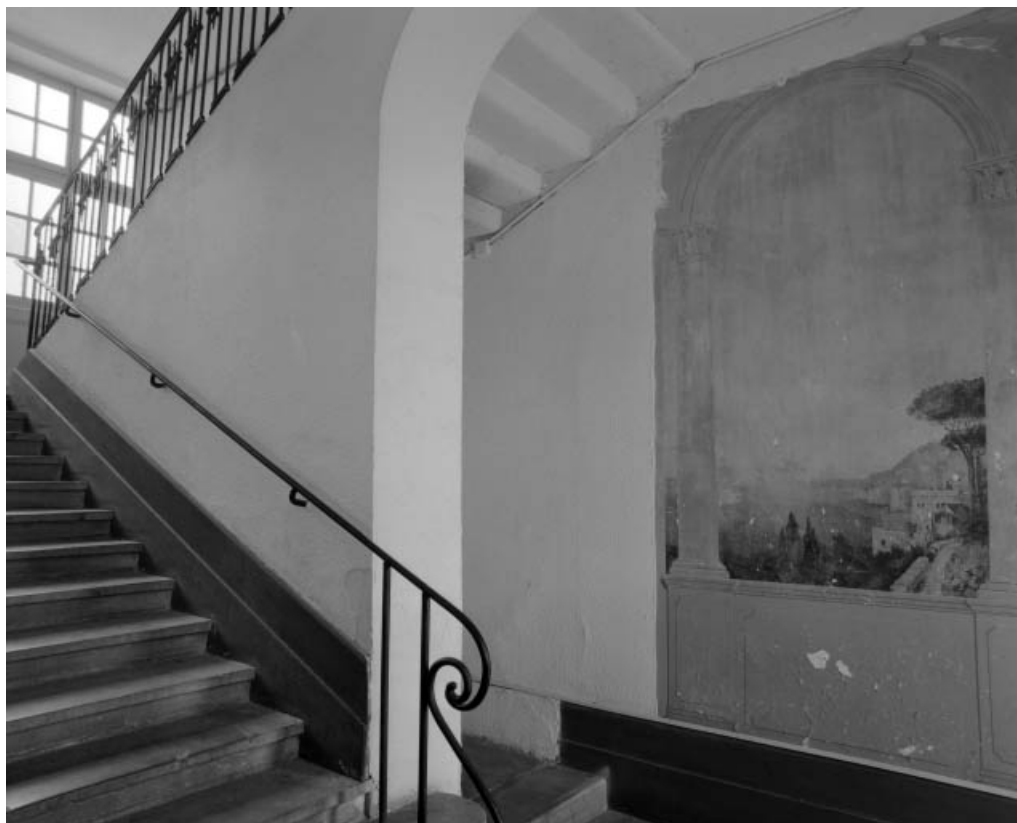
Vue d'ensemble de l'escalier : de trois quarts gauche.

25, Besançon, 10 rue Pasteur, lieudit : îlot Pasteur