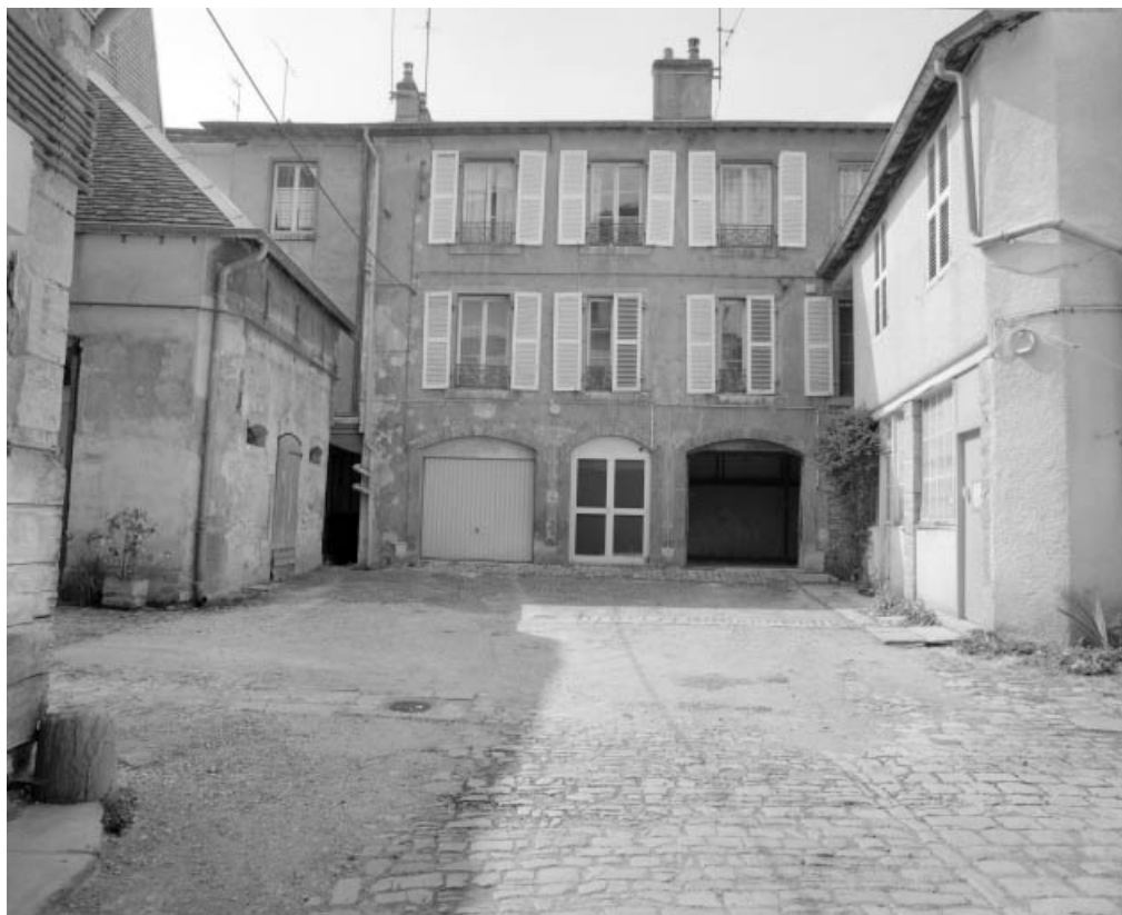
Vue d'ensemble de la cour depuis le passage cocher.

25, Besançon, 10 rue Pasteur, lieudit : îlot Pasteur