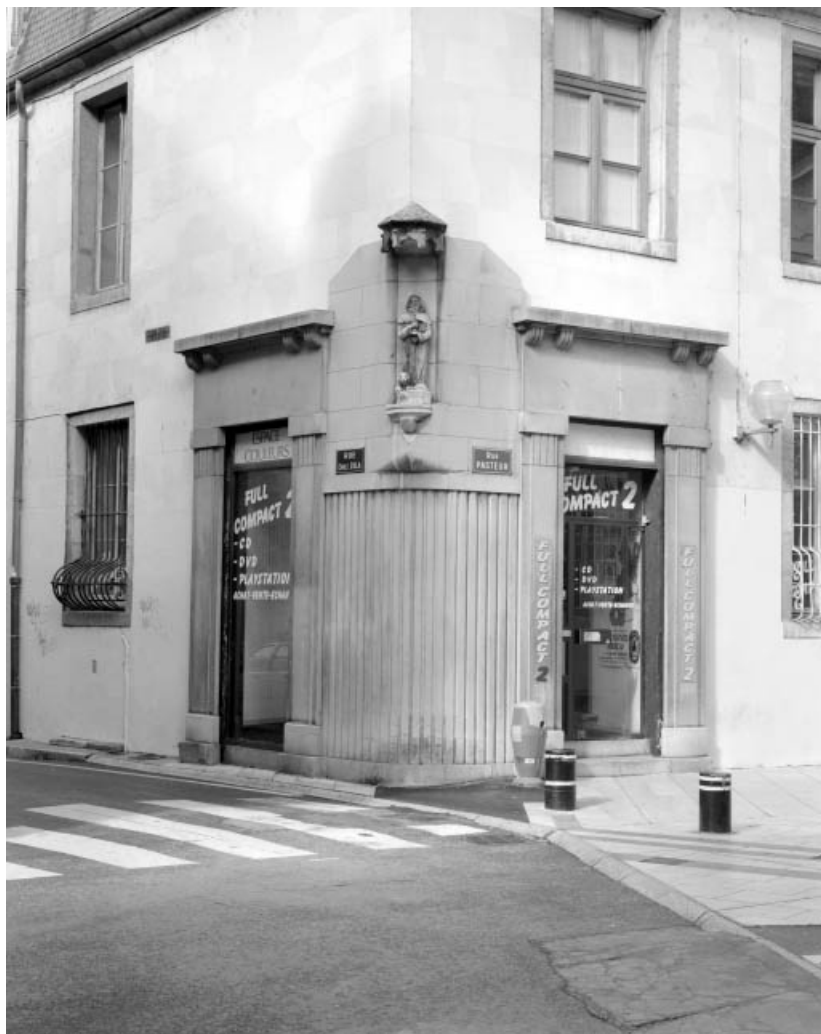
Détail de l'angle gauche de l'édifice, entre rue Pasteur et rue Emile Zola. 25, Besançon, 10 rue Pasteur, lieudit : îlot Pasteur