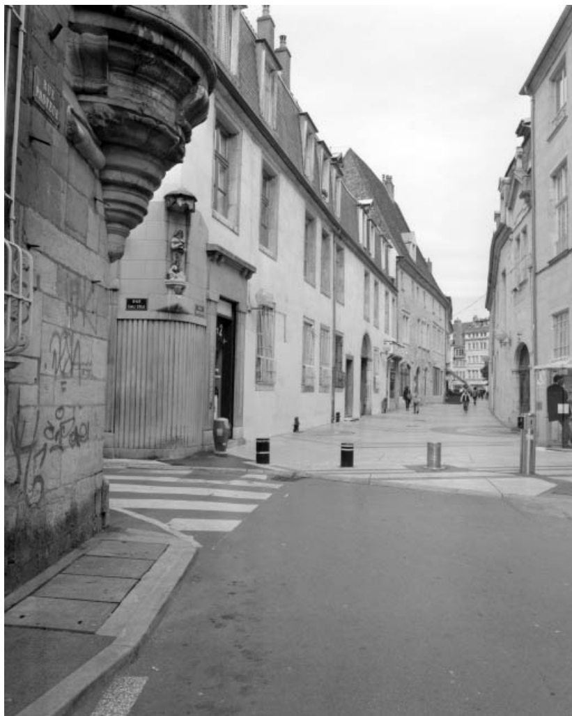
Vue d'ensemble de la façade sur rue, de trois quarts gauche.

25, Besançon, 10 rue Pasteur, lieudit : îlot Pasteur