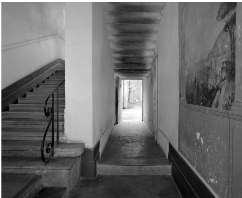
Vue d'ensemble de l'escalier et du couloir d'accès depuis la porte piétonne.

25, Besançon, 10 rue Pasteur, lieudit : îlot Pasteur