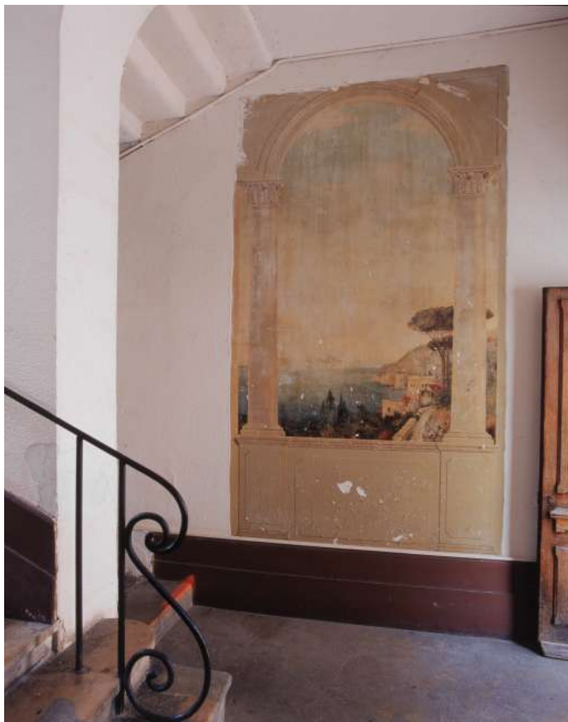
Vestibule : détail de la peinture murale.

25, Besançon, 10 rue Pasteur, lieudit : îlot Pasteur