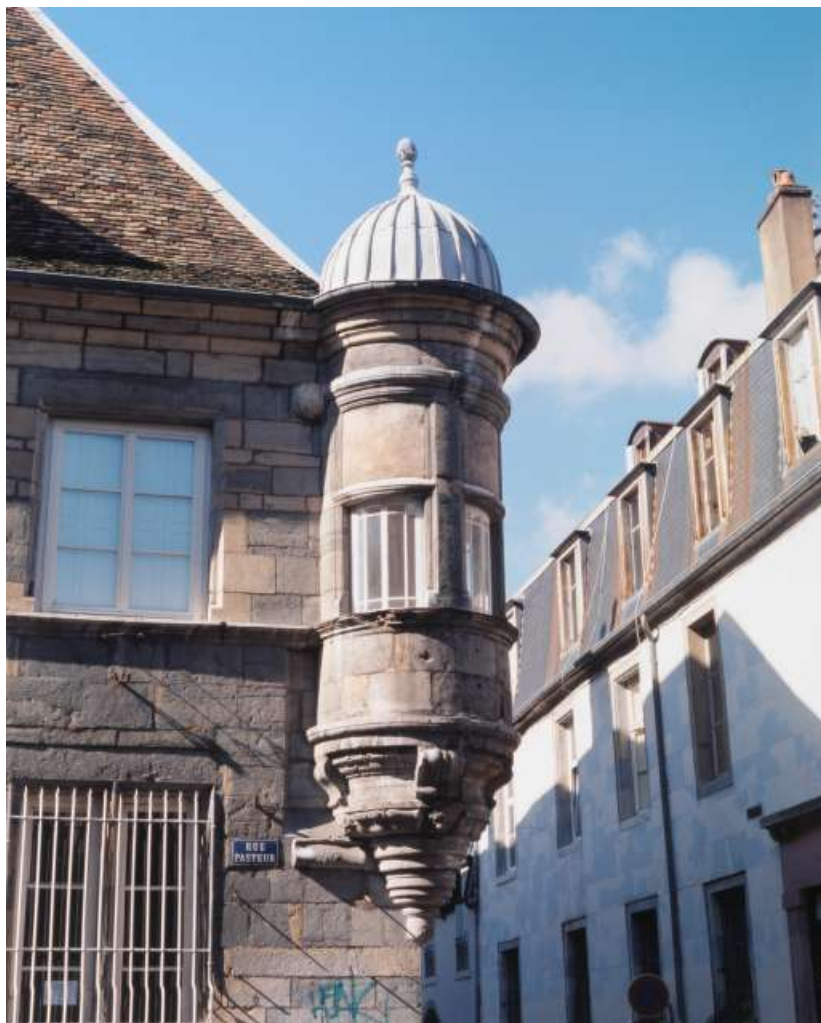
Façade latérale gauche : vue d'ensemble.

25, Besançon, 10 rue Pasteur, lieudit : îlot Pasteur