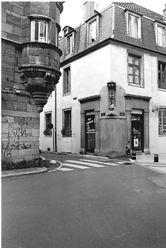
Vue éloignée de l'angle gauche de l'édifice, entre rue Pasteur et rue Emile Zola. 25, Besançon, 10 rue Pasteur, lieudit : îlot Pasteur