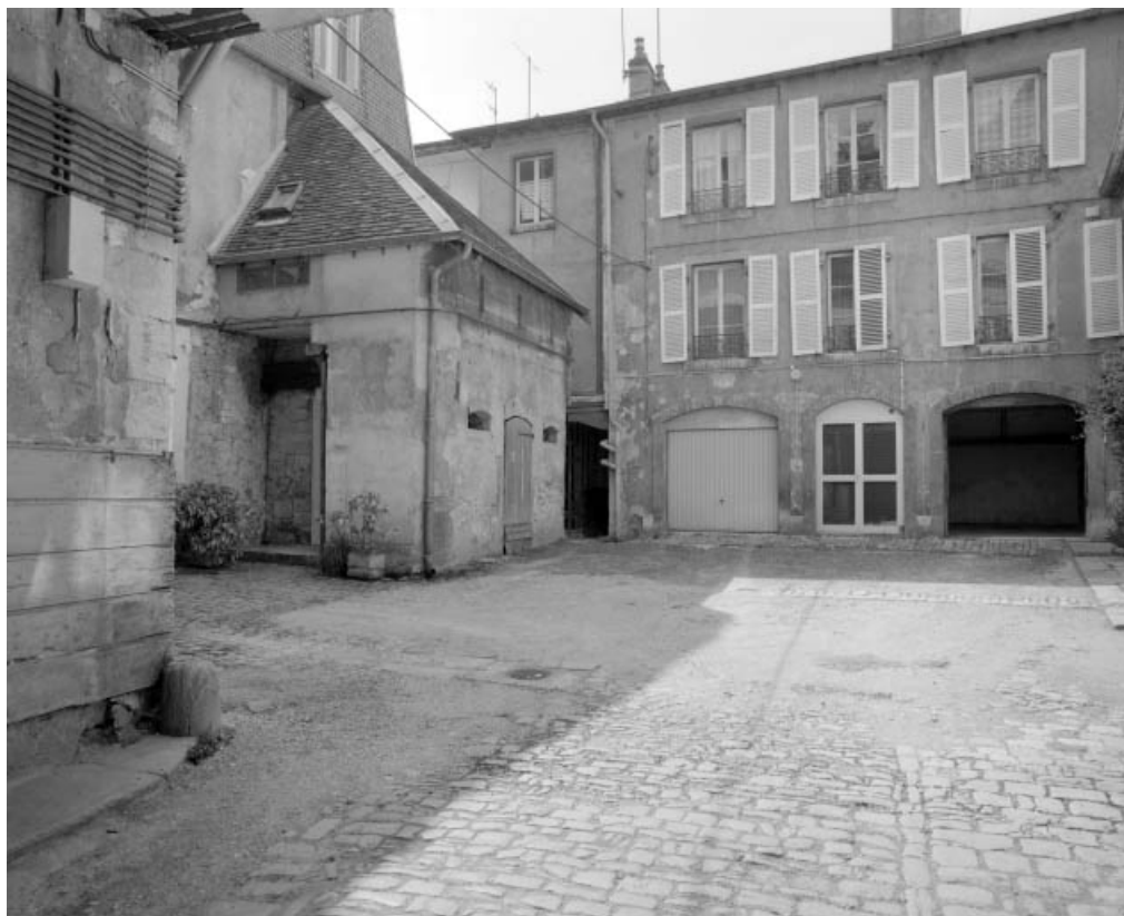
Vue d'ensemble de la cour de trois quarts gauche.

25, Besançon, 10 rue Pasteur, lieudit : îlot Pasteur