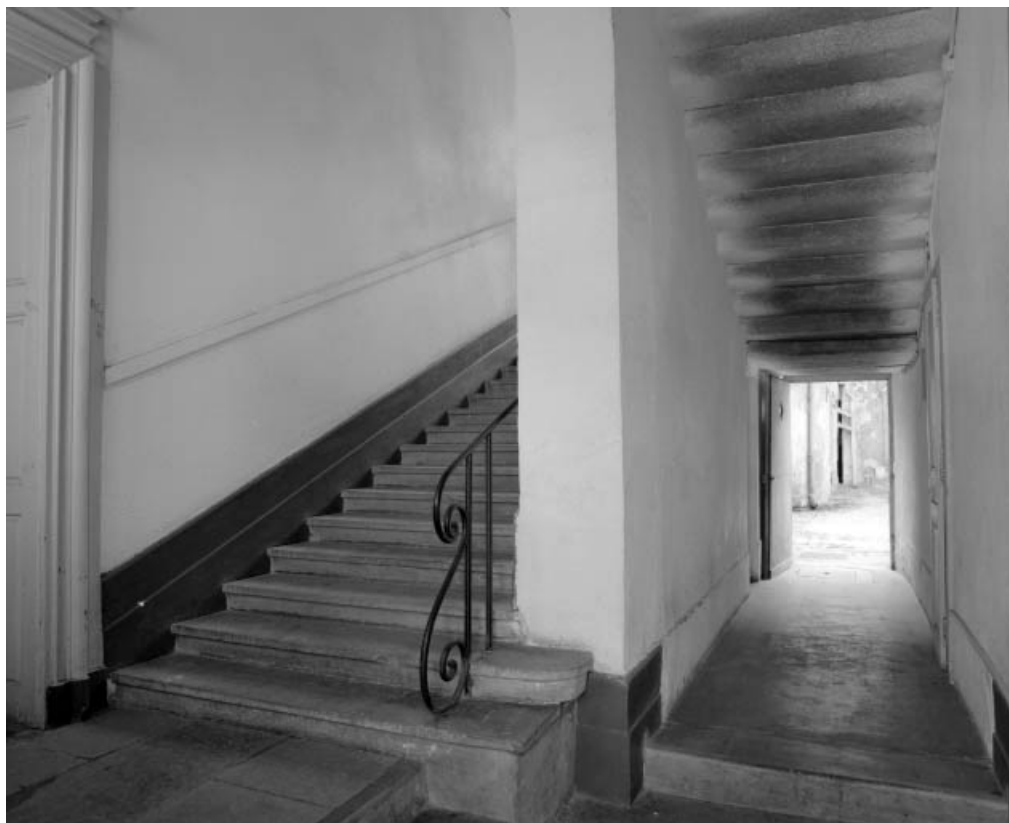
Vue d'ensemble de l'escalier et du couloir d'accès de trois quarts gauche.

25, Besançon, 10 rue Pasteur, lieudit : îlot Pasteur