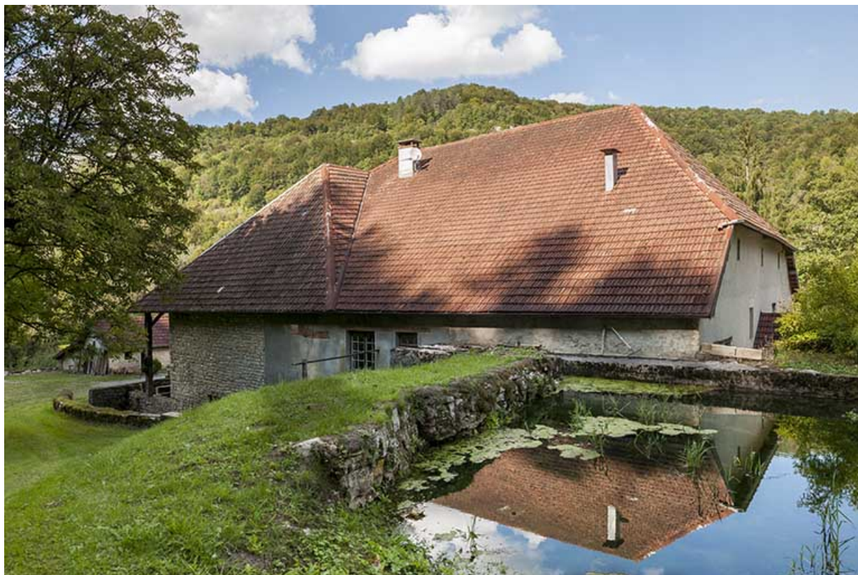
Vue plongeante depuis le sud-est.

25, Bonnevaux-le-Prieuré route départementale 280, lieudit : Bonnevaux du Bas