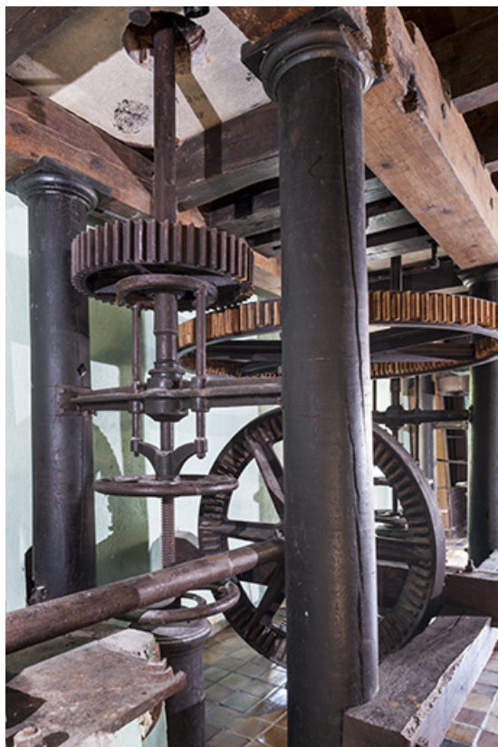
Beffroi est. Détail de la transmission.

25, Bonnevaux-le-Prieuré route départementale 280, lieudit : Bonnevaux du Bas