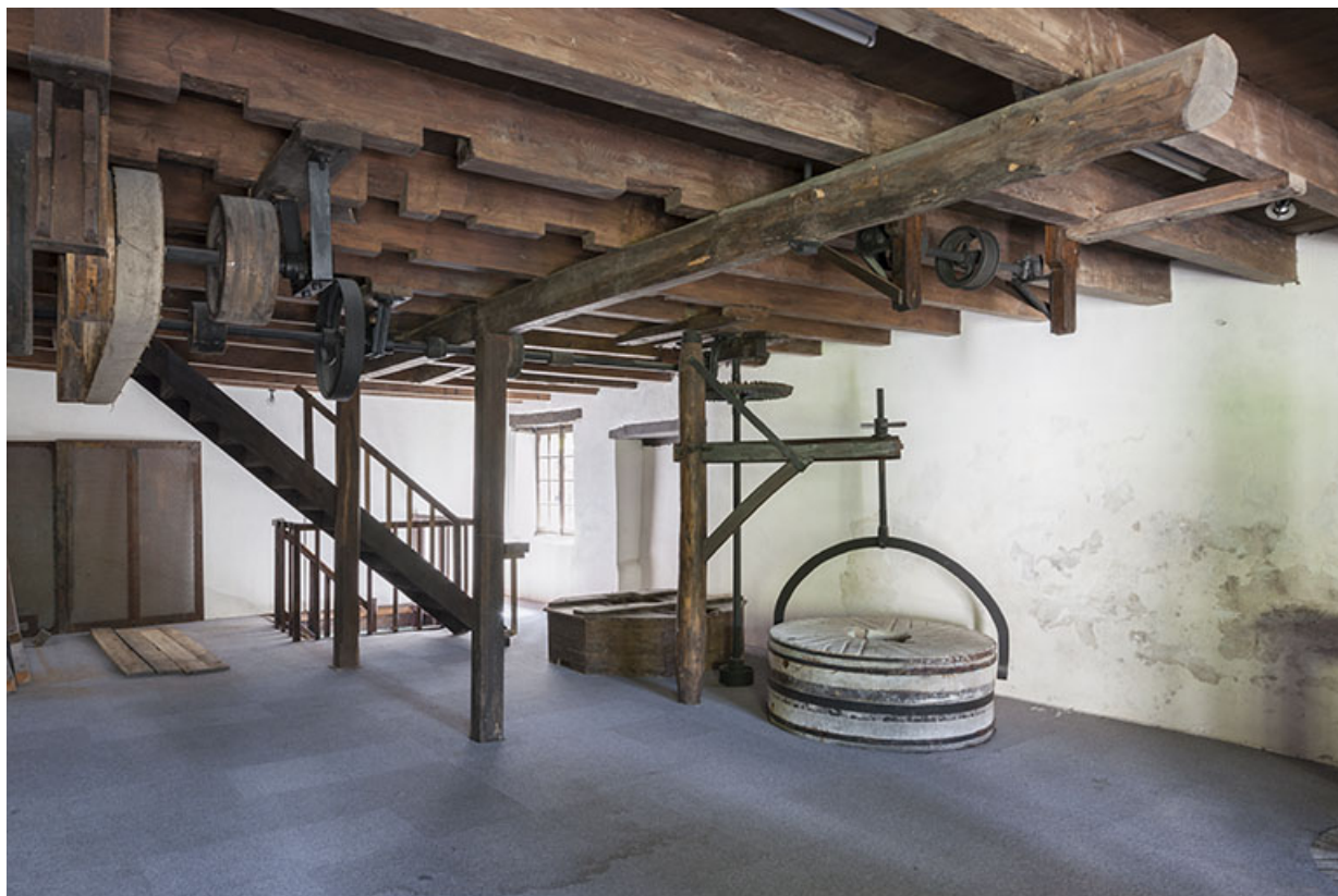
Premier étage. Vue d'ensemble depuis l'ouest.

25, Bonnevaux-le-Prieuré route départementale 280, lieudit : Bonnevaux du Bas