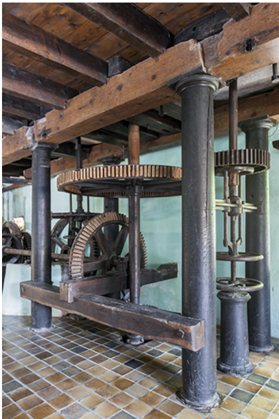
Beffroi (est) d'une paire de meules.

25, Bonnevaux-le-Prieuré route départementale 280, lieudit : Bonnevaux du Bas