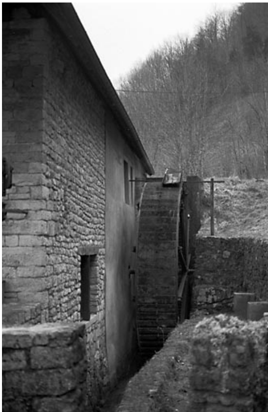
Façade latérale droite : la roue hydraulique verticale.

25, Bonnevaux-le-Prieuré route départementale 280, lieudit : Bonnevaux du Bas