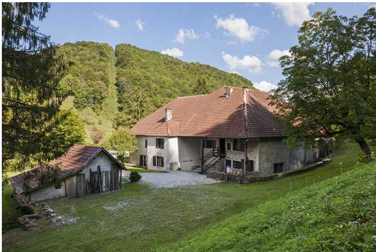
Vue d'ensemble depuis le sud-ouest.

25, Bonnevaux-le-Prieuré route départementale 280, lieudit : Bonnevaux du Bas