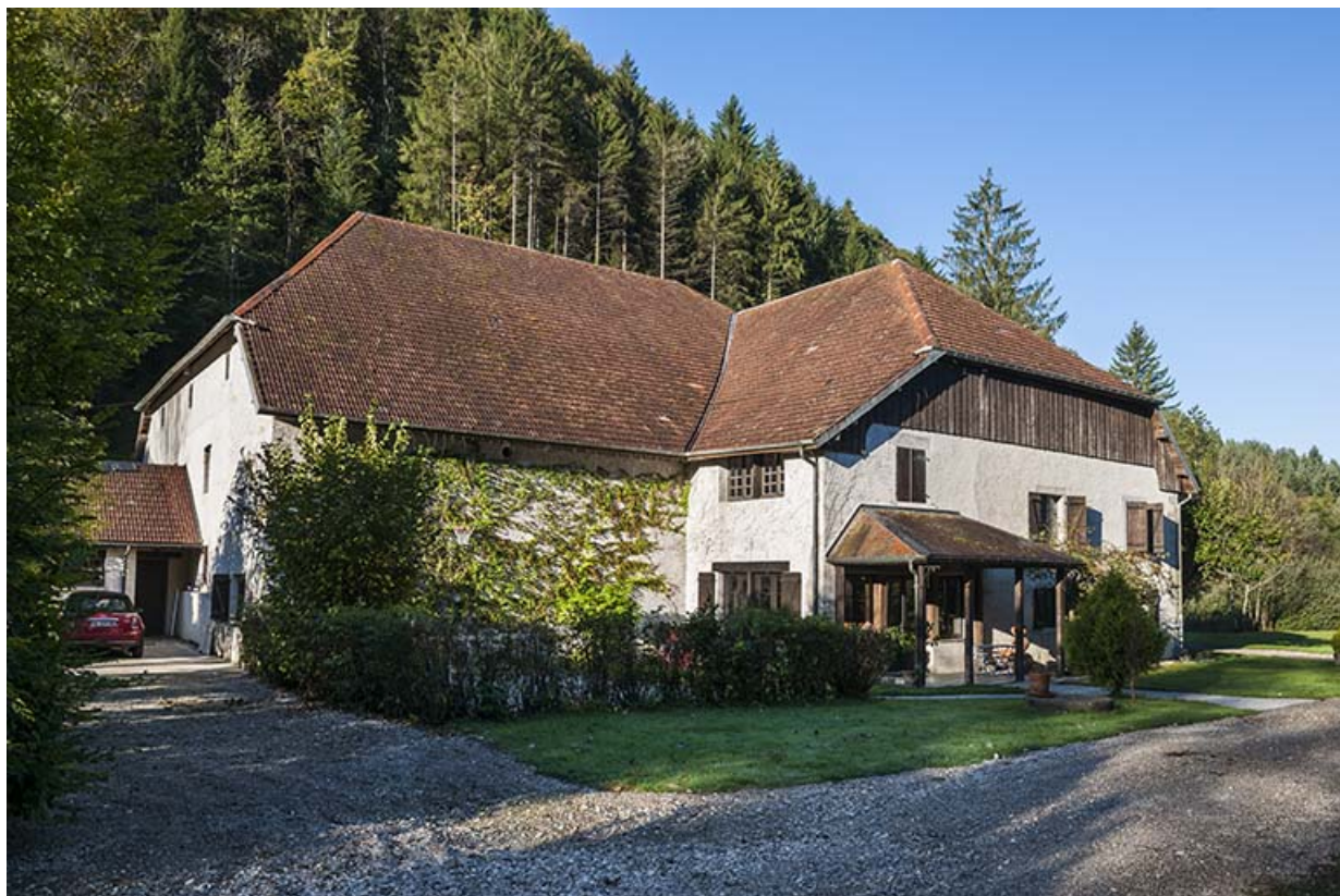
Vue depuis le nord-est.

25, Bonnevaux-le-Prieuré route départementale 280, lieudit : Bonnevaux du Bas