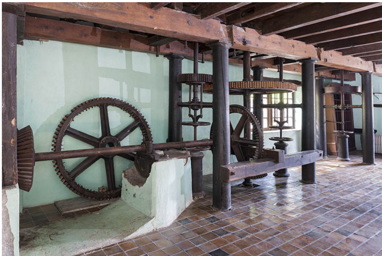
Vue d'ensemble depuis le nord-est.

25, Bonnevaux-le-Prieuré route départementale 280, lieudit : Bonnevaux du Bas