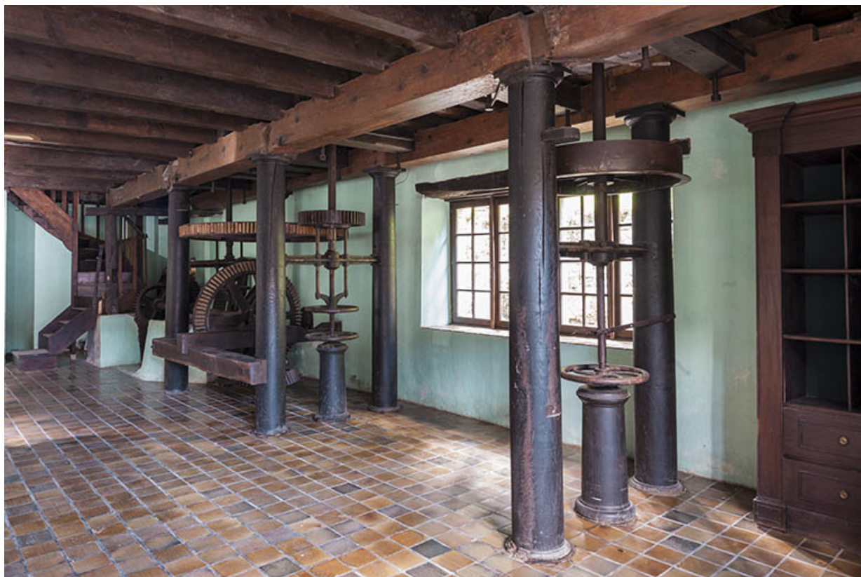
Rez-de-chaussée du moulin. Vue d'ensemble.

25, Bonnevaux-le-Prieuré route départementale 280, lieudit : Bonnevaux du Bas