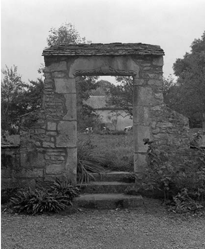
Maison située à Maisières-Notre-Dame : vestiges d'une porte piétonne au linteau décoré. 25, Scey-Maisières