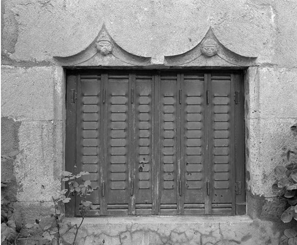
Maison située à Maisières-Notre-Dame, cadastrée 1971 AB 23 : linteau de baie orné de têtes humaines. 25, Scey-Maisières