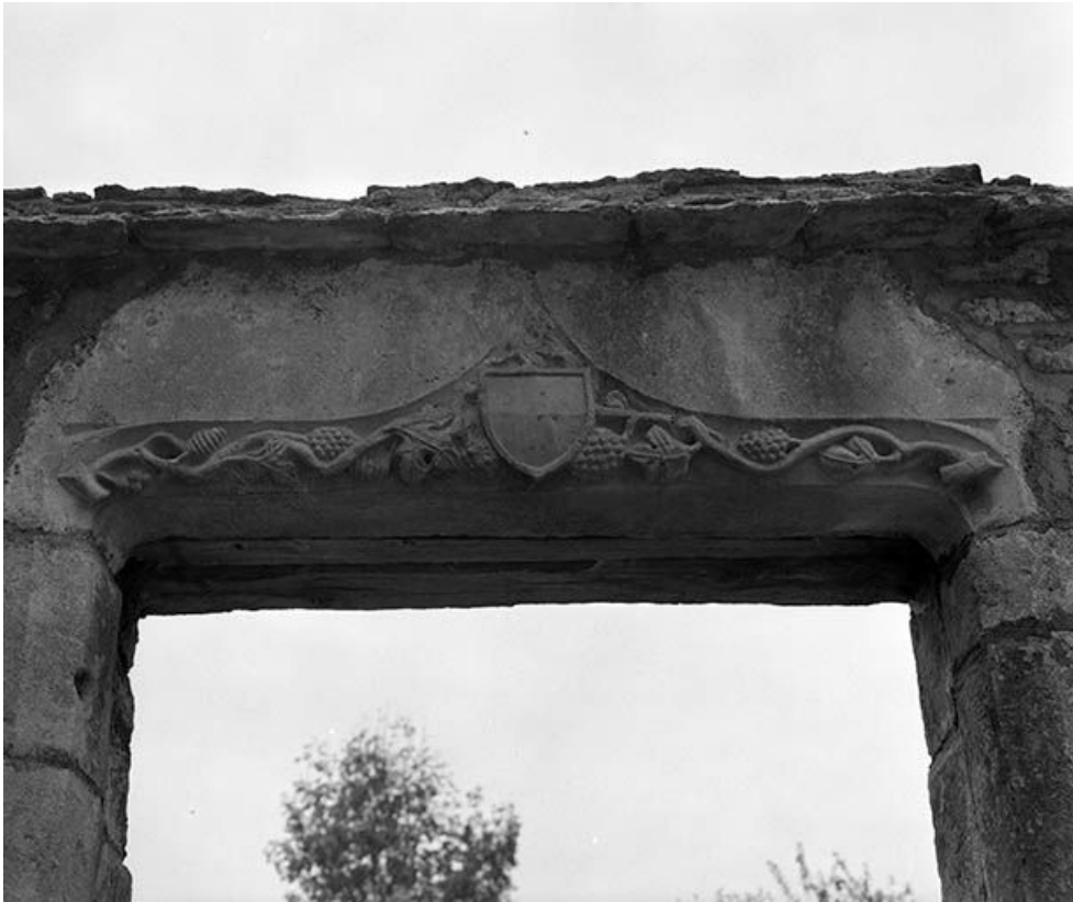
Maison située à Maisières-Notre-Dame : linteau décoré de la porte piétonne. 25, Scey-Maisières