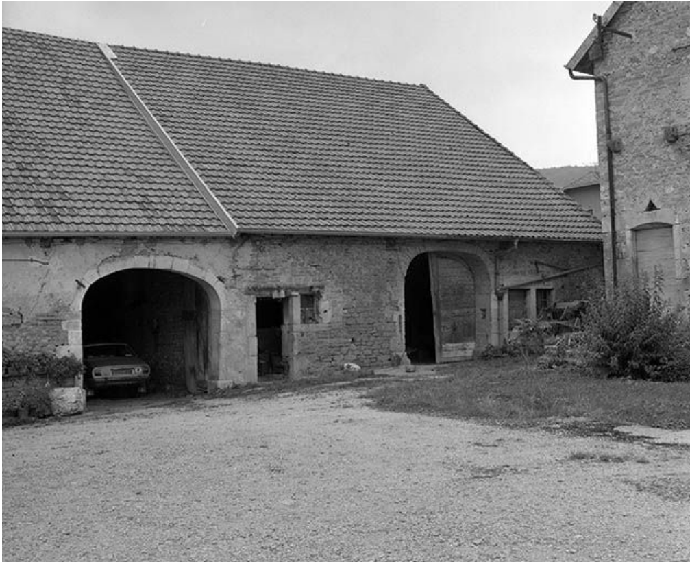
Ferme située à Scey-en-Varais, rue de l'Eglise. 25, Scey-Maisières