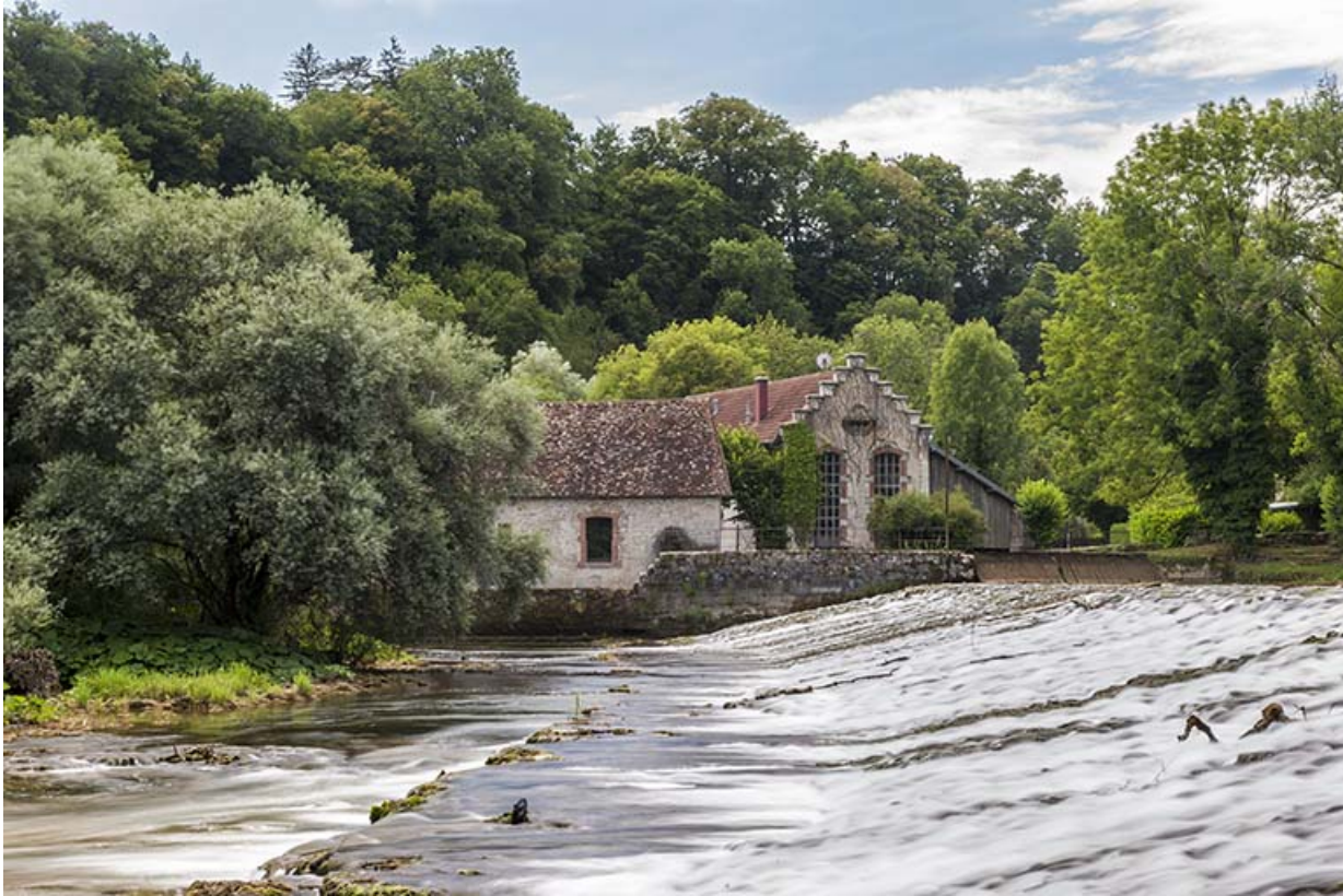
Vue d'ensemble depuis l'extrémité du barrage, au nord.