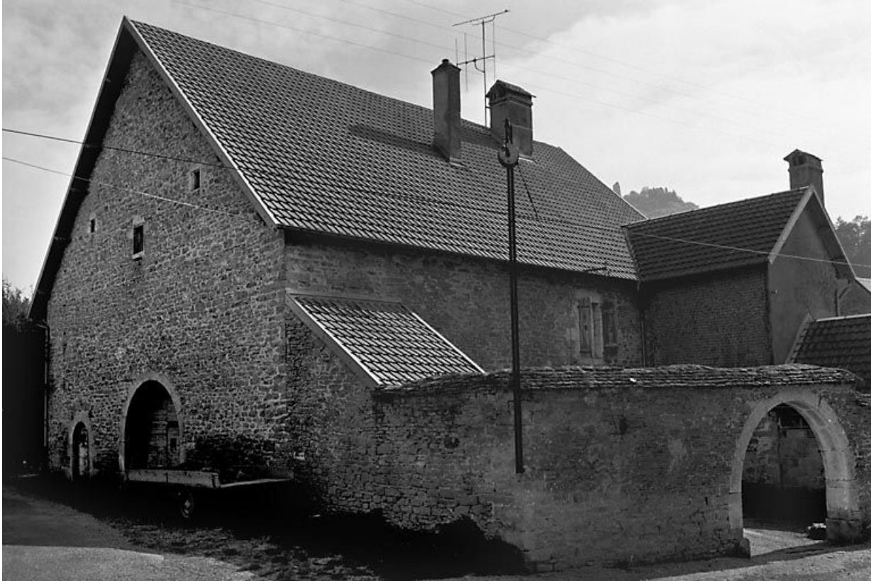
Façade antérieure et face latérale gauche. 25, Scey-Maisières