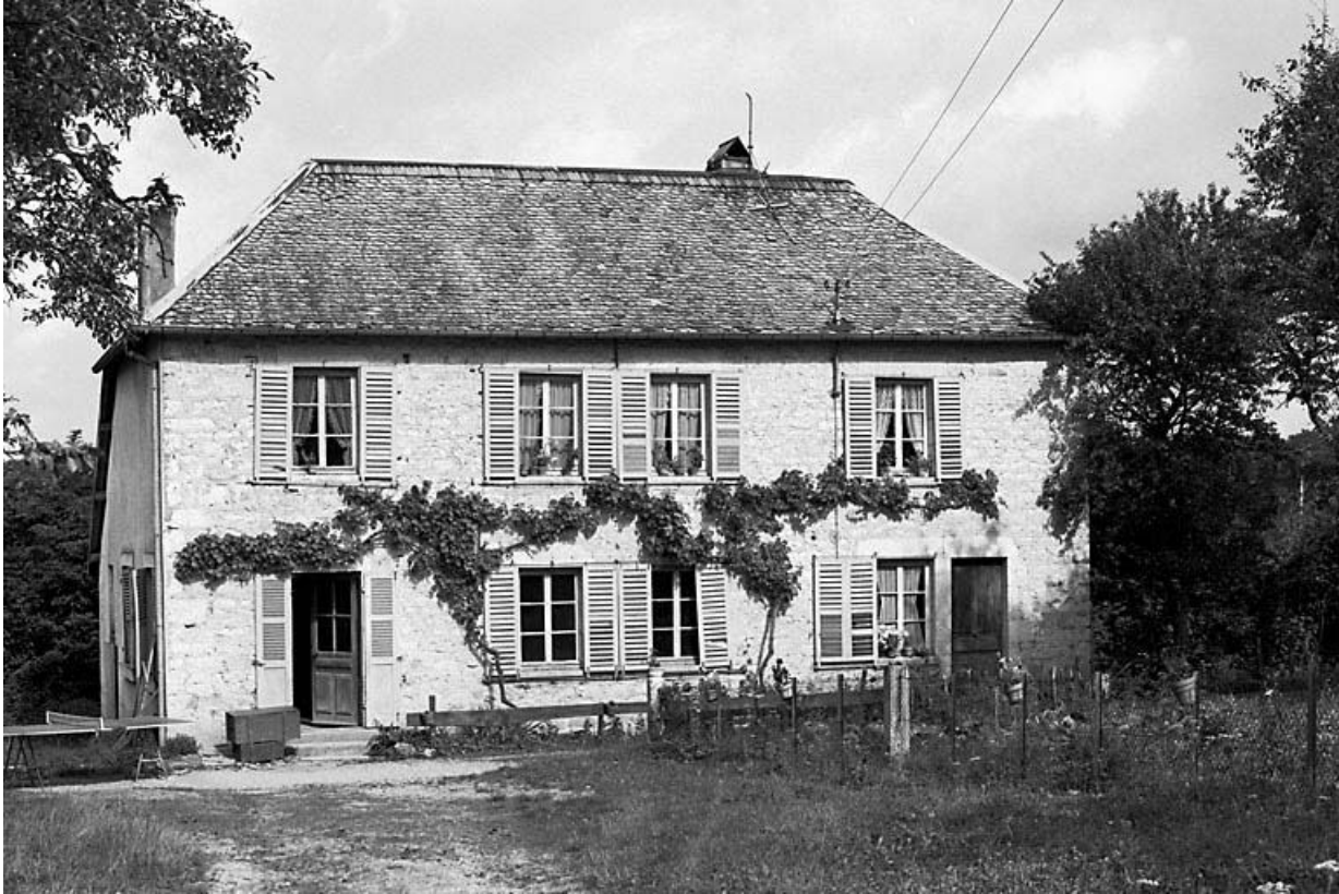
Façade antérieure et face latérale gauche.