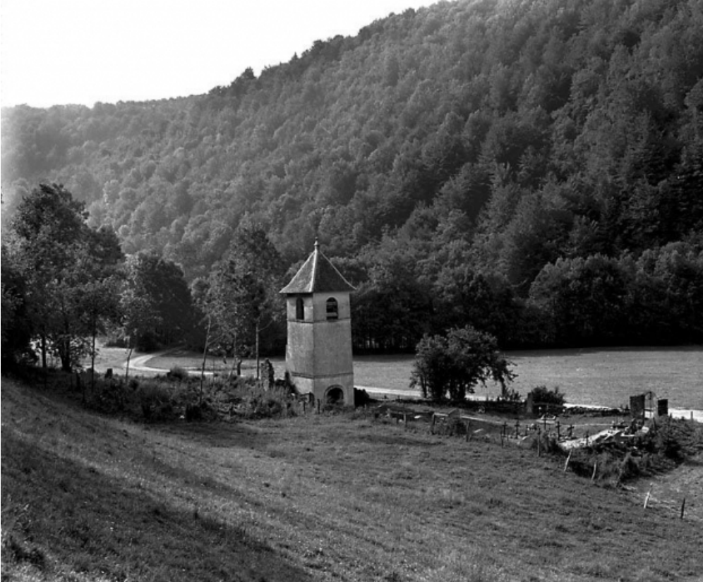
Vue générale depuis le nord-ouest.