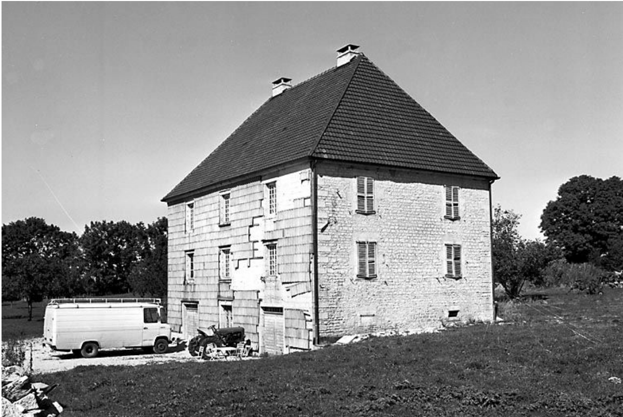
Façade antérieure et face latérale droite.