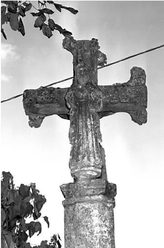
Détail : la Vierge vue de face.