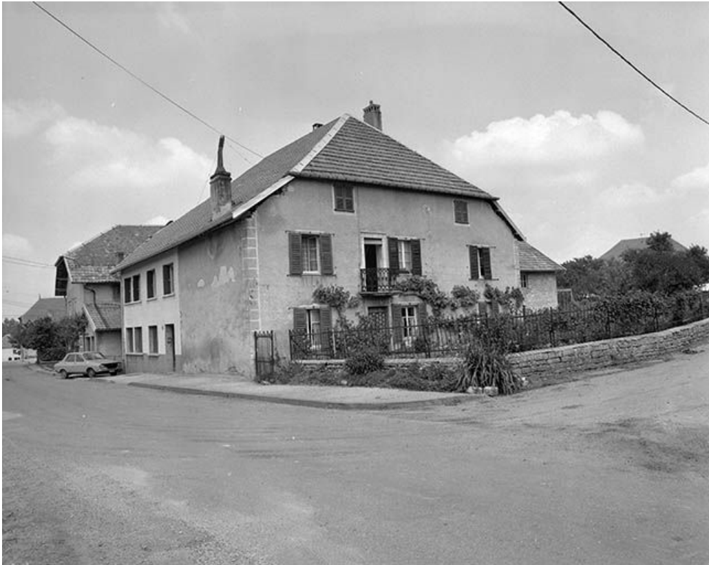
Façade antérieure et face latérale gauche. 25, Lavans-Vuillafans