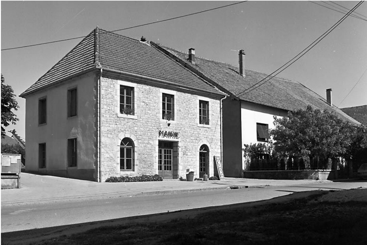
Façade antérieure et face latérale gauche.