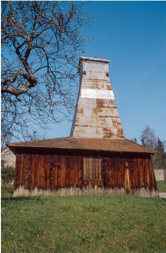
Puits de sondage nord : vue de côté.