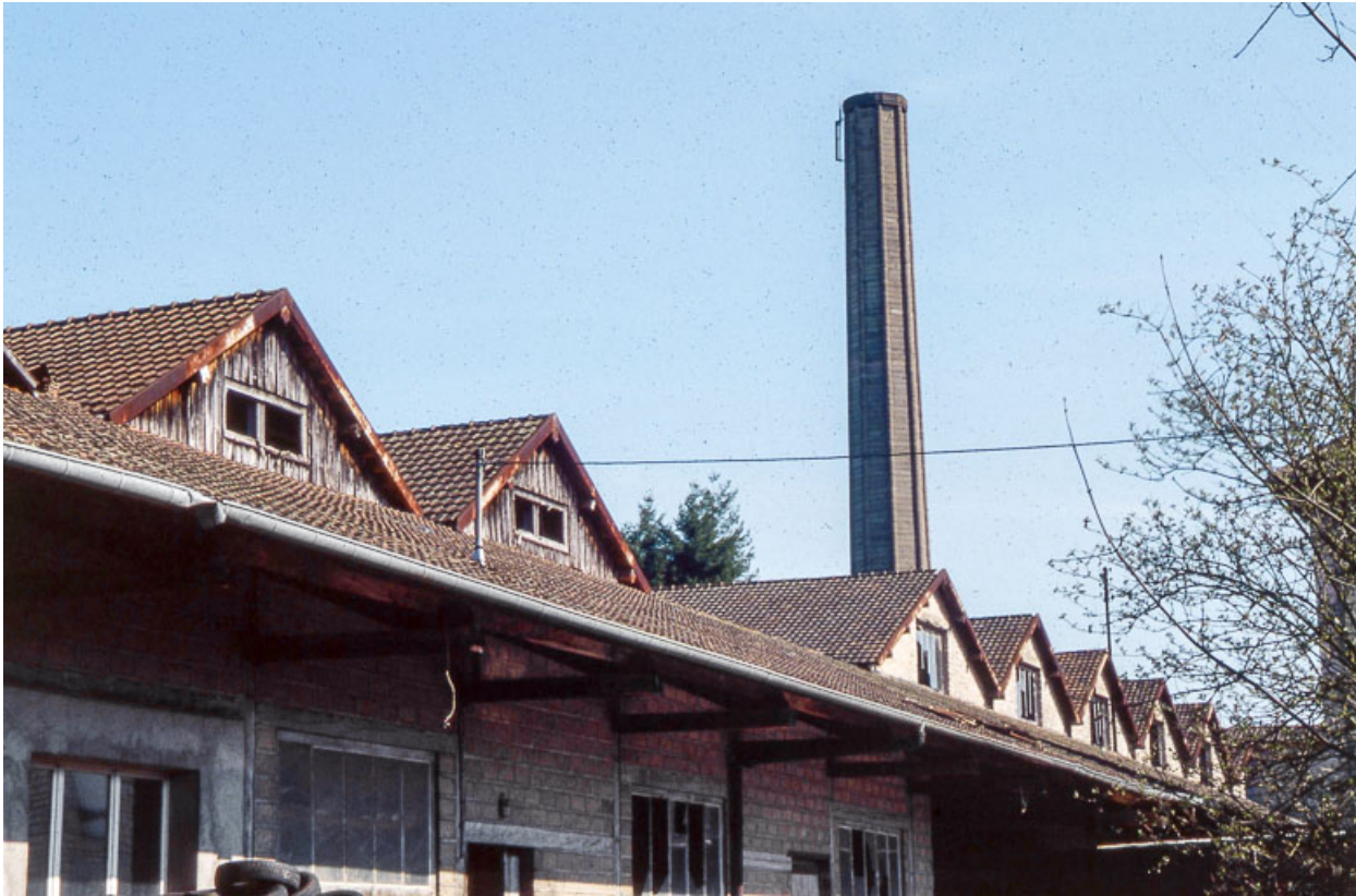
Magasins industriels et quai couvert depuis le sud-ouest.

25, Miserey-Salines, lieudit : aux Salines