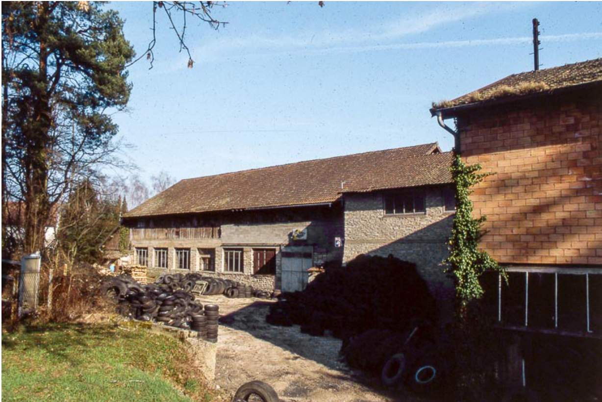
Façades occidentales des magasins industriels.

25, Miserey-Salines, lieudit : aux Salines