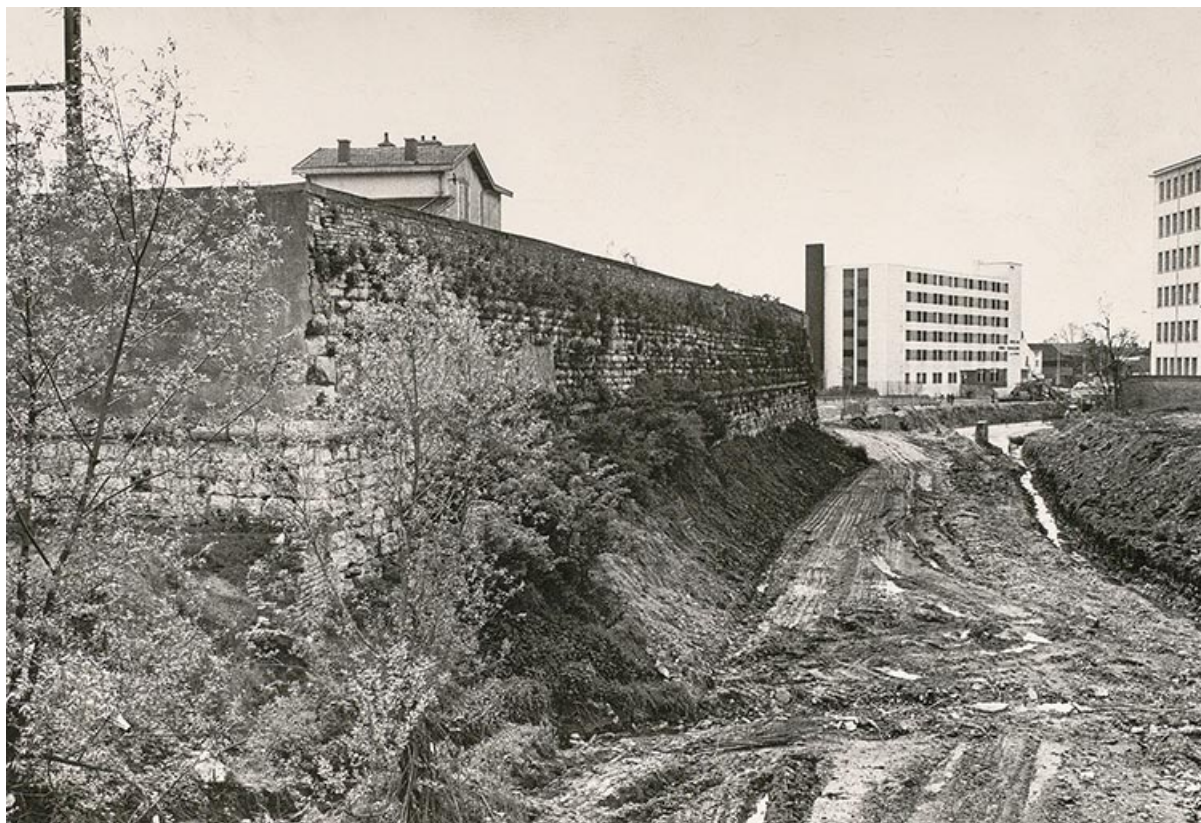
Fortifications du Bastion de Guise. 1969.