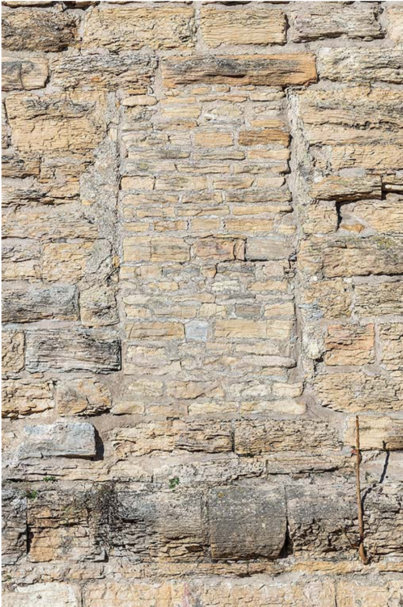
Poterne murée (flanc). 21, Dijon rue des Corroyeurs