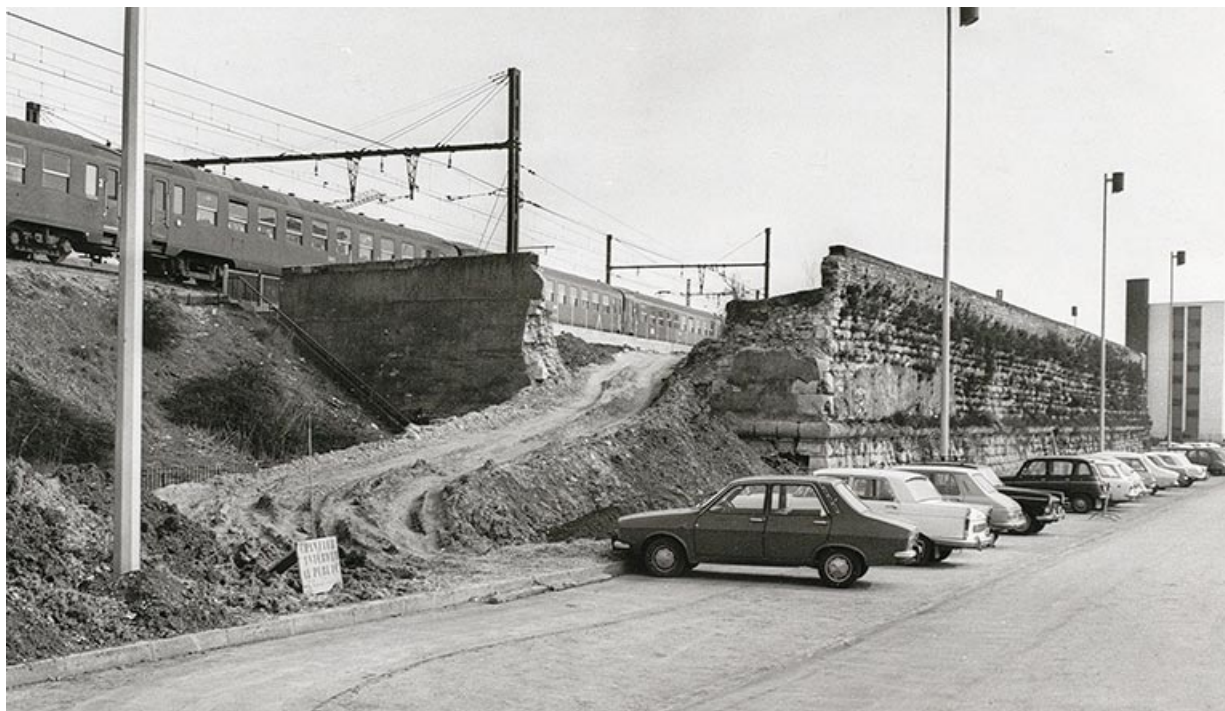
Bastion de Guise. 1971.