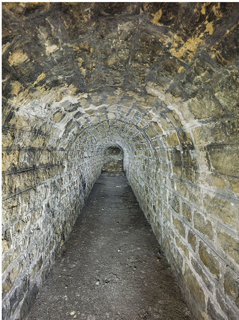
Galerie de la poterne (face).