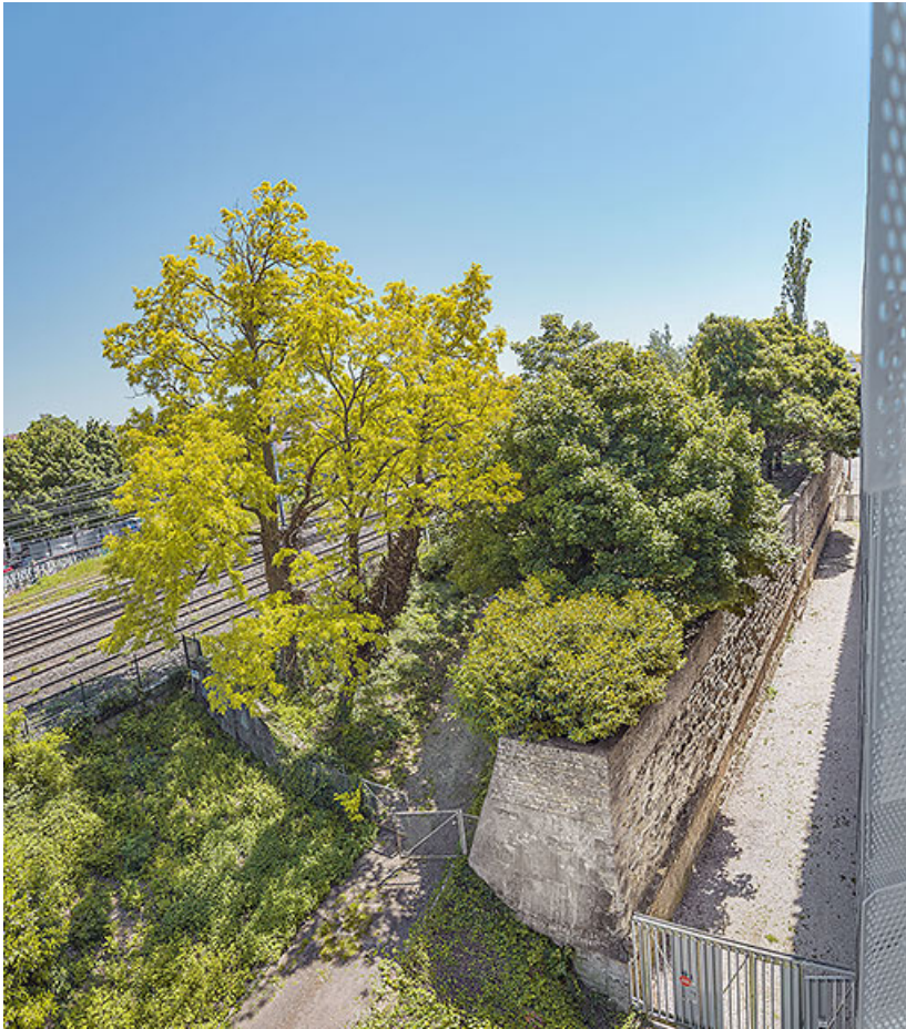
Le talus du bastion, socle des voies ferrées. 21, Dijon rue des Corroyeurs