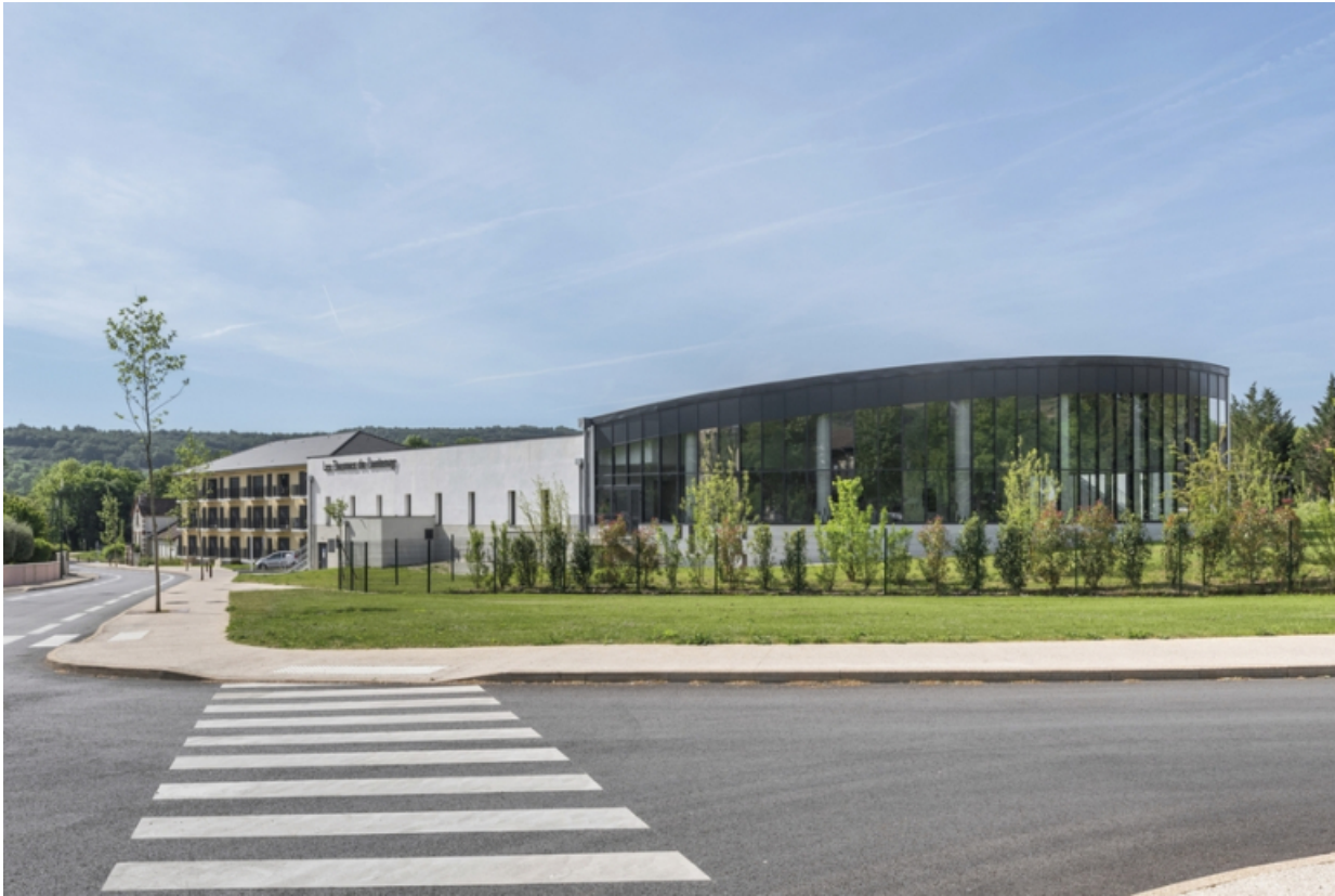
Vue de l'établissement thermal de 2021.