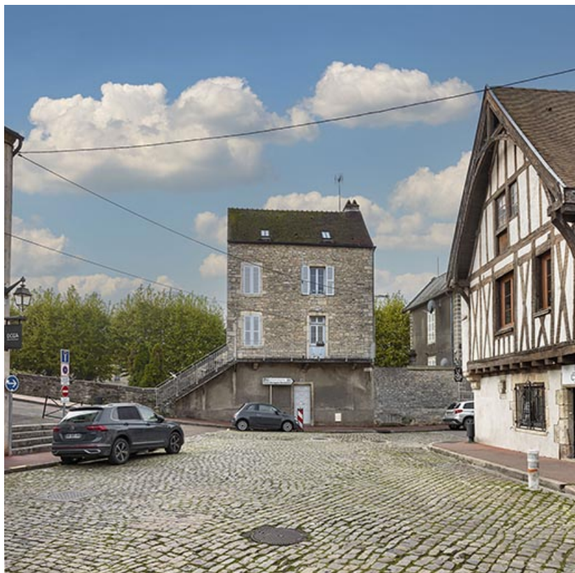
Vue depuis la rue Victor Millot.