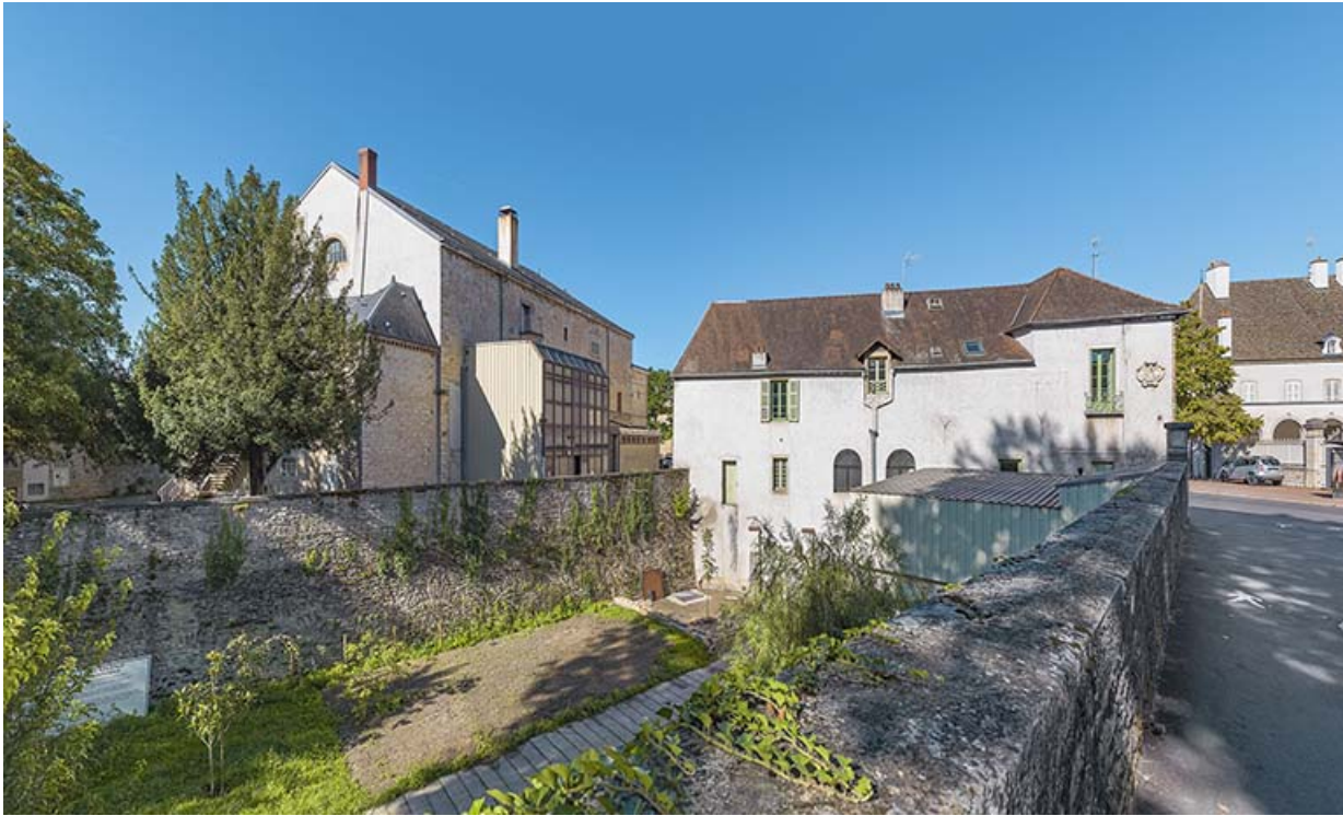
Mur de l'ancien bastion. 21, Beaune rue de Lorraine