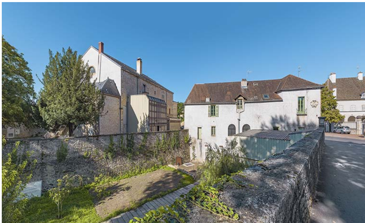
Mur de l'ancien bastion. 21, Beaune rue de Lorraine