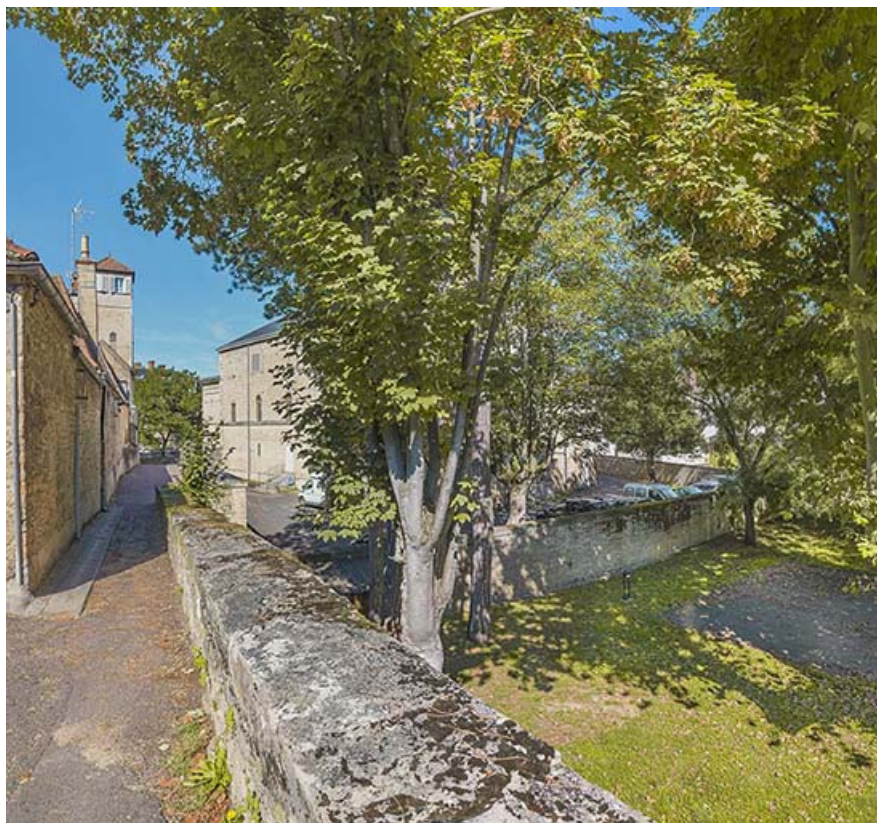
Rempart de la Comédie en direction de l'ancien bastion.